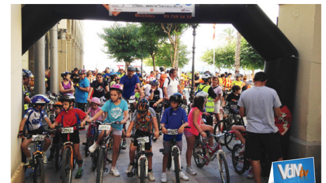
Podeu veure la notícia a VdM'TV http://tv.vilassardemar.cat

La pedalada havia estat organitzada per la Regidoria de Medi Ambient dins la Setmana de la Mobilitat Sostenible i Segura. Sota el lema "Aire Net-Fes el pas!", el recorregut d'aquest any va transcórrer per una de les rutes saludables, l'anomenada "Ruta del Mar-Vaixell Burriac", i el seu traç es va adaptar perquè els participants, entre els quals hi havia moltes famílies amb nens i nenes, el poguessin fer sense dificultat. En total es van recórrer uns 5,7 km.