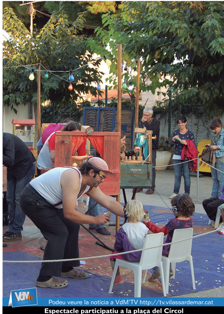
Podeu veure la notícia a VdM TV http://tv.vilassardemar.cat Espectacle participatiu a la plaça del Círcol

El Festival està organitzat conjuntament per l'Ajuntament i l'entitat Firobi, i combina nombrosos i variats espectacles amb tallers a on els infants tenen l'oportunitat de crear els seus propis titelles. Enguany es va celebrar la 17ena edició del festival, que ja està plenament consolidat i que atrau a un nombrós públic bàsicament format per famílies, tot i que també es va fer un espectacle destinat a adults.