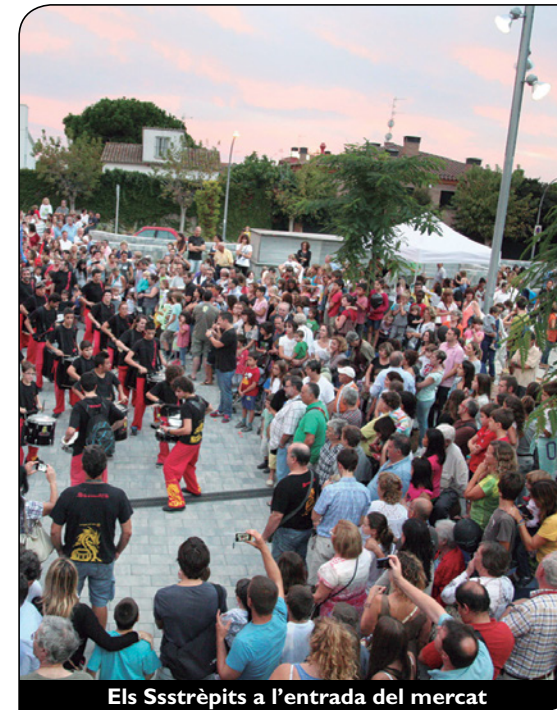
Els Ssstrèpits a l'entrada del mercat