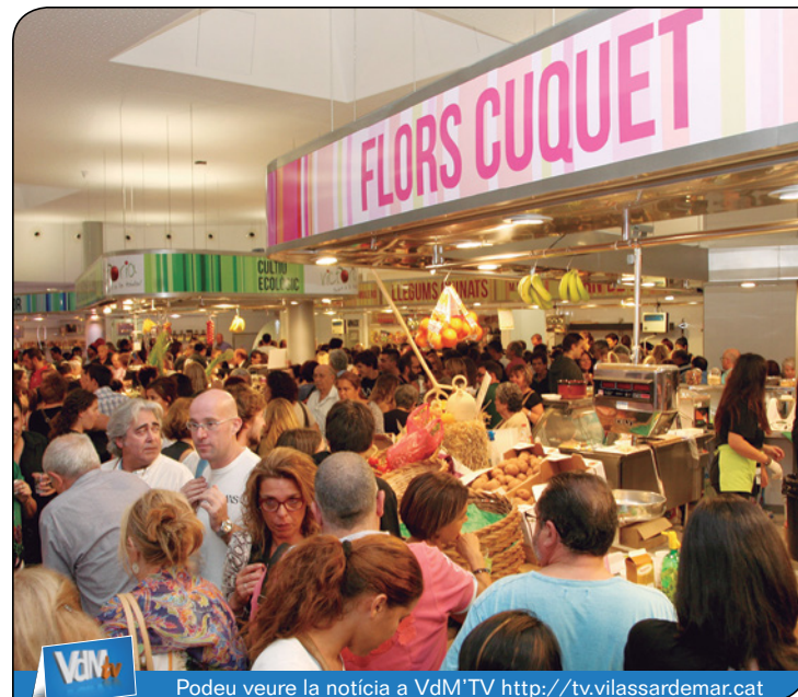
Podeu veure la notícia a VdM TV http://tv.vilassardemar.cat

La infraestructura del carrer Narcís Monturiol, 23, que mentre han durat les obres del nou equipament ha acollit el Mercat de forma provisional, es desmuntarà. L'Ajuntament té previst condicionar la zona perquè torni a ser espai verd públic.