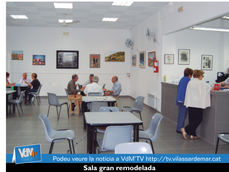
Podeu veure la notícia a VdM TV http://tv.vilassardemar.cat