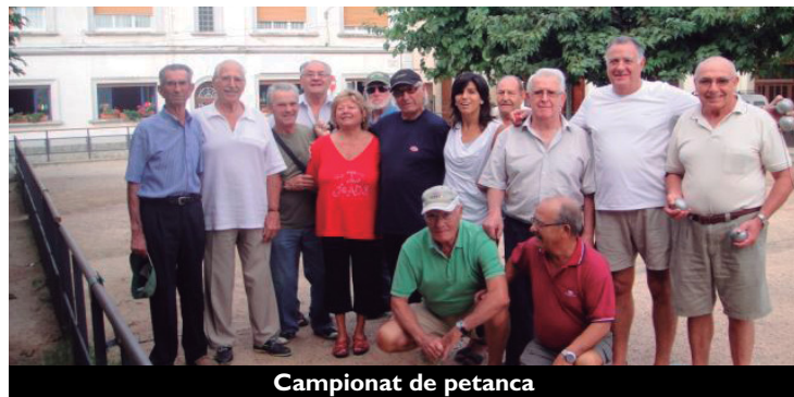
Campionat de petanca

La Setmana de la Gent Gran va començar el 28 de setembre, amb l'estrena del musical "Moments estel·lars de l'òpera", a càrrec del grup de gent gran Musical d'Or, que va donar el tret de sortida a l'intens programa d'activitats preparat conjuntament entre l'Ajuntament i la Comissió organitzadora de la Setmana. El dinar de germanor al pavelló d'esports municipal Paco Martín va ser l'acte de cloenda. Hi van assistir 230 persones, que van rebre com a obsequi una rajola commemorativa dels 15 anys de l'esdeveniment.