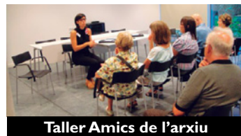
Taller Amics de l'arxiu