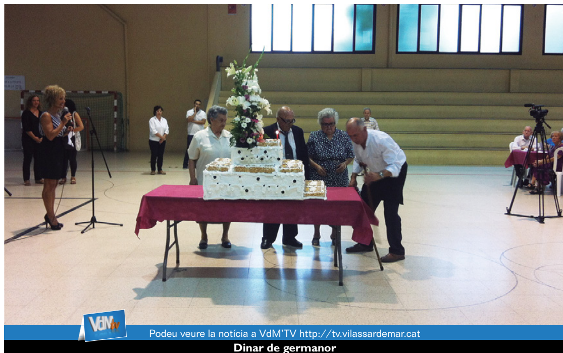
Podeu veure la notícia a VdM TV http://tv.vilassardemar.cat