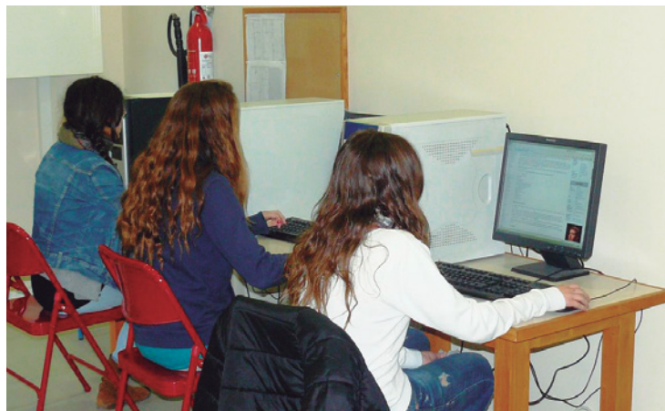
L'Aula TIC de Can Jorba, facilita als joves la recerca de feina per internet

Les persones interessades en els tallers de recerca de feina s'han d'adreçar al Servei Local d'Ocupació (c/ Manuel de Falla, 1, telèfon: 937542400).