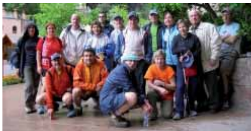
Participants a la Caminada 2008

El proper 9 de maig el Centre Excursionista de Vilassar de Mar, el Piri, organitza la tradicional caminada Vilassar de Mar-Montserrat, sortida que compta amb més de 50 anys d'història. Hi ha dues opcions: fer el recorregut sencer de 65 quilòmetres des de Vilassar de Mar, o incorporar-se més tard, i fer el recorregut final de 20 quilòmetres.