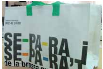
La bossa té diferents compartiments interiors

El cost de les bosses és de 20.706 euros, subvencionats al 100% per l'Agència de Residus de Catalunya.