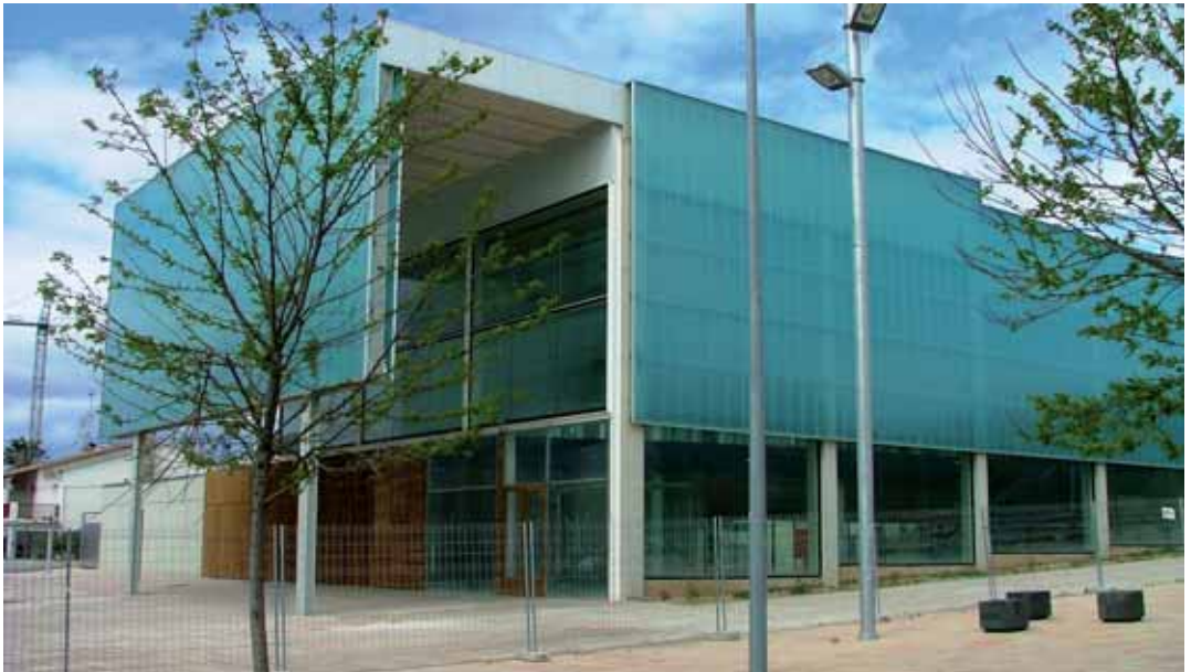
Exterior del nou equipament

L'Ajuntament de Vilassar de Mar calcula que serà a partir de l'inici del nou curs escolar quan la Biblioteca Municipal Ernest Lluch i Martín podrà inaugurar el nou espai, al carrer Santa Eulàlia. Amb el nou equipament en marxa, s'ampliaran els serveis i l'actual fons documental, i s'entrarà a formar part de la Xarxa de Biblioteques de la Diputació de Barcelona.