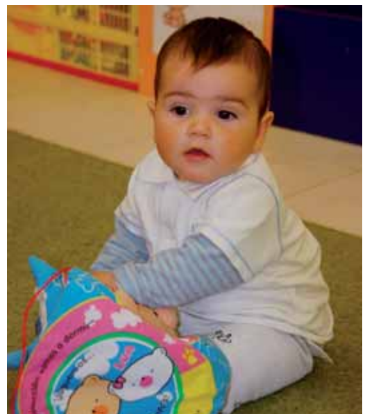
En Biel, en una de les activitats del Nascuts per llegir