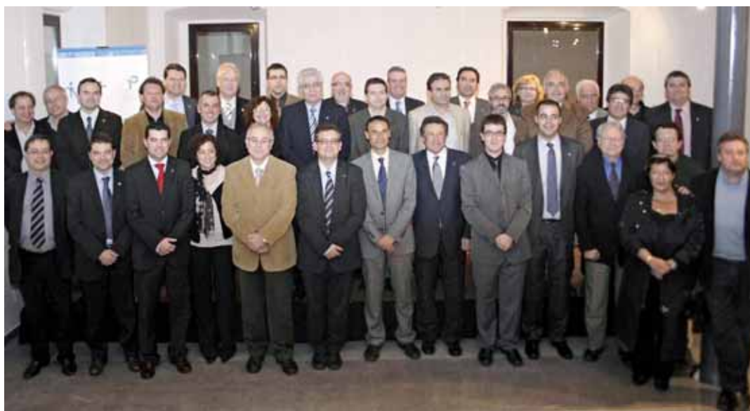
Els signants de l'acord

Com a objectius específics hi ha el de facilitar l'emergència de projectes innovadors i d'impacte territorial, ordenar racionalment les polítiques de desenvolupament econòmic de la comarca, aprofitar i augmentar les sinergies existents per fomentar l'ocupació i l'esperit empresarial, donar suport a la innovació i qualificació del capital humà, així com oferir coordinació i assistència tècnica als programes i iniciatives per al desenvolupament local a partir d'una programació i gestió concertada en el territori.