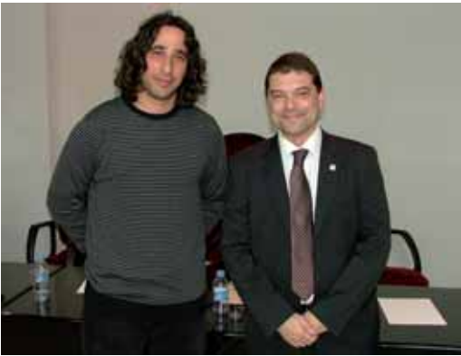
El regidor d'ICV amb l'alcalde

El Ple extraordinari del 12 de març va aprovar el text refós perquè la Generalitat aprovi definitivament la modificació urbanística prevista a l'àmbit del carrer Manuel Roca. L'actuació, que entre d'altres coses preveu una nova escola bressol municipal al Barato, es va aprovar amb el vots a favor de CiU i ICV.