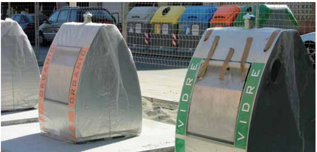
Grup de contenidors instal·lat a l'av. Carles III

L'objectiu del consistori és seguir augmentant, de forma progressiva, el nombre d'instal·lacions de contenidors soterrats. Per a l'any 2010, hi ha prevista una segona fase per a instal·lar cinc grups més de contenidors.