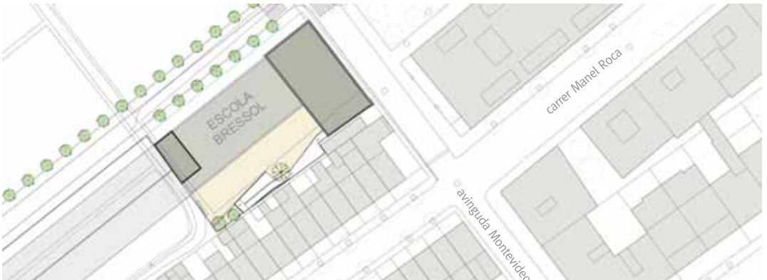
Plànol ubicació nova escola bressol al Barato

La modificació del Pla General d'Ordenació Urbana (PGOU) corresponent a l'àmbit del carrer Manuel Roca té com a objectius principals fer un carrer i una zona verda per donar una nova