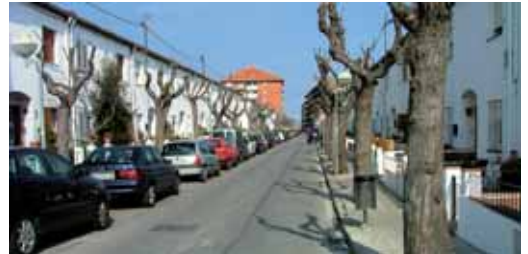
Estat del carrer, abans de l'inici de l'obra

a zona provisional d'aparcament els terrenys de can Vives, a l'avinguda Montevideo, per sobre del carrer Marina.