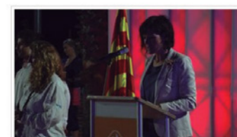
Acte institucional 11 de Setembre de 2013 1 day ago