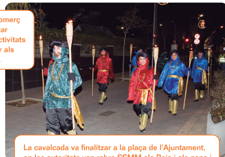
La cavalcada va finalitzar a la plaça de l'Ajuntament, on les autoritats van rebre SSMM els Reis i els nens i nenes van poder lliurar-los les cartes.