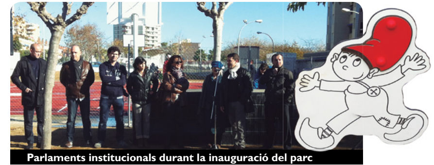
Parlaments institucionals durant la inauguració del parc

Diuenge 22 de desembre a les 12 del migdia es va inaugurar el parc del Patufet, ubicat al carrer Santa Marta, inspirat en les il·lustracions de Pilarín Bayés sobre aquest conte.