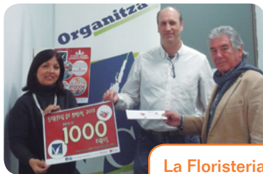
La Floristeria Jardins va ser la que va repartir la butlleta guanyadora del premi de 1.000 €.