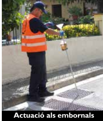
Actuació als embornals

Els treballs consisteixen en l'aplicació de larvicida en els embornals sifònics de la via pública (embornals que retenen aigua). L'actuació es centra a controlar la reproducció del mosquit mitjançant l'aplicació d'un larvicida específic en els principals punts de cria que es troben a l'espai públic. La campanya es perllongarà fins a l'octubre. Aquesta actuació complementa les que fa el mateix ajuntament en diferents equipaments mu-