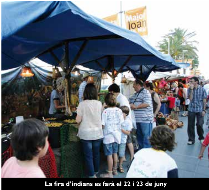
La fira d'indians es farà el 22 i 23 de juny

carrers Sant Joan, Anselm Clavé i la plaça de l'Era. Durant aquests dos dies, la fira comptarà amb diferents actuacions musicals, havaneres, contacontes i animació teatral per recordar l'esplendor dels indians. A més, diferents restauradors s'implicaran en la temàtica indiana preparant plats i begudes típiques del Carib, i els botiguers del nucli antic, durant el dies de la fira, estaran vestits per a l'ocasió. Una altra de les novetats d'enguany serà el concurs de decoració de carrers inspirat en els indians, que en aquesta primera edició compta amb la participació del carrer del Rosari (entre Duana i Mont) i la plaça del Círcol. Dimarts, darrer dia de la festa, es lliurarà el premi al carrer guanyador.