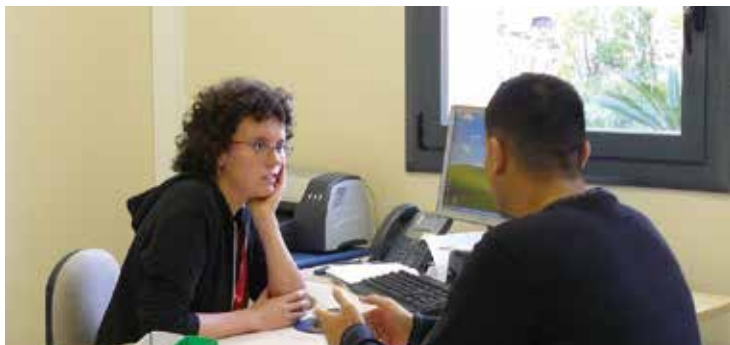
Assessoria presencial a can Jorba els dimecres

a entitats i associacions juvenils, assessora de manera personalitzada sobre propostes relacionades amb estades internacionals: intercanvis interculturals, formació, voluntariat, feina, pràctiques, etc. Compta amb tres espais d'assessoria presencial: Vilassar de Mar (equipament juvenil de Can Jorba) dimecres a la tarda, Mataró (Sidral, C.C Cabot i Barba) dimarts a la tarda i divendres matí i tarda, i Malgrat de Mar (Centre Cívic) dijous a la tarda. A través de la seva pàgina a Facebook ( www.facebook.com/Mobilitat.Internacional.Maresme ) es pot accedir a les notícies i activitats que es programen mensualment i a tota la informació i novetats del servei.