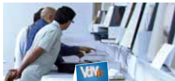
Podeu veure la notícia a VdM'TV http://tv.vilassardemar.cat

Amb motiu del Dia Internacional dels Arxius i per segon any consecutiu, l'Arxiu Municipal va tornar a fer una jornada de portes obertes per donar a conèixer quins documents són els que guarda. Perquè el públic apreciés com han evolucionat en el temps alguns dels documents administratius que l'arxiu conserva, es va organitzar una petita exposició on es van poder comparar actes dels plens dels anys 1913, 1960, 1983 i 2013 o el pressupost municipal de l'any 1923 i del 1986, entre d'altres.