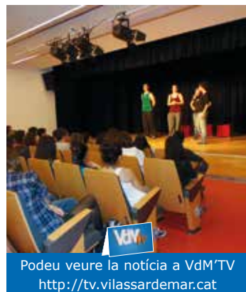
Podeu veure la notícia a VdM TV http://tv.vilassardemar.cat

L'obra plantejava dues temàtiques principals, l'ús de les xarxes socials i els seus riscos, i l'esclatxa digital de gènere, ja que segons diferents estudis les dones matriculades a informàtica o sectors vinculats a les noves tecnologies a la universitat no supera el 17%.