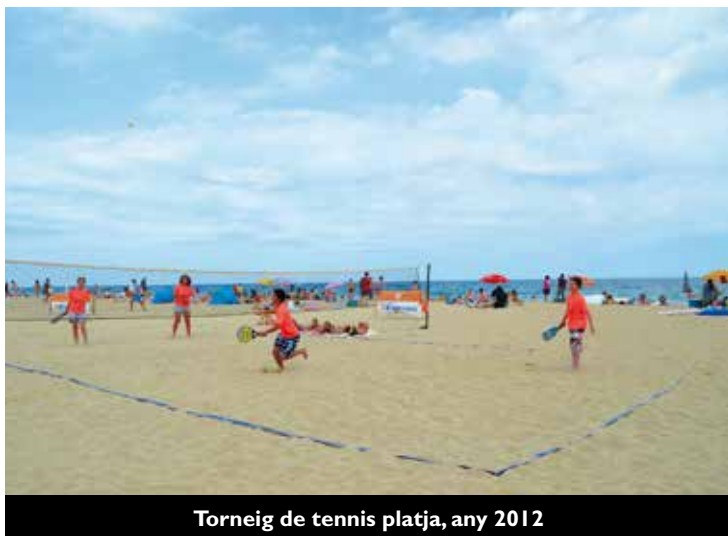
Torneig de tennis platja, any 2012

El 20 de juliol (10 h), l'esport tornarà a la platja de Palomares amb el X torneig de tennis platja per parelles en categories júnior (de 14 a 16 anys) i absoluta (a partir de 17 anys). Les inscripcions, al preu de 6 € per jugador, es poden fer fins al 19 de juliol al Pavelló d'Esports Municipal. Les parelles podran ser masculines, femenines o mixtes.