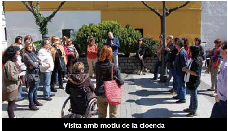
Visita amb motiu de la cloenda

L'alta demanda d'enguany s'ha notat sobretot en els tres graus del nivell intermedi (adreçats a persones catalanoparlants que es volien iniciar en l'expressió escrita), que s'han hagut de desdoblar en dos grups. També s'han impartit dos cursos de nivell bàsic i un de nivell elemental. D'altra banda, el programa Voluntariat per la llengua (VxL), que consisteix en un voluntari i un aprenent que es troben un cop per setmana per conversar en català, ha comptat amb prop de 30 parelles lingüístiques, xifra que consolida un any més el voluntariat lingüístic a Vilassar de Mar. A més, gràcies a la col·laboració entre el VxL i la Biblioteca Municipal s'ha