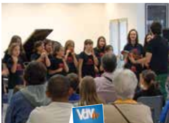
Podeu veure la notícia a VdM'TV http://tv.vilassardemar.cat

L'Aula de Música de Vilassar de Mar va acollir la cloenda del cicle 'Moments musicals a les escoles', on alumnes de 12 escoles de música de Sant Vicenç de Montalt, Llavaneres, Arenys de Mar, Premià de Mar, Calella, Tordera, Vilassar de Mar, Vilassar de Dalt i Mataró van mostrar la seva música al públic. L'experiència serveix per ensenyar quina és la feina que fan les escoles de música però també per motivar els alumnes.