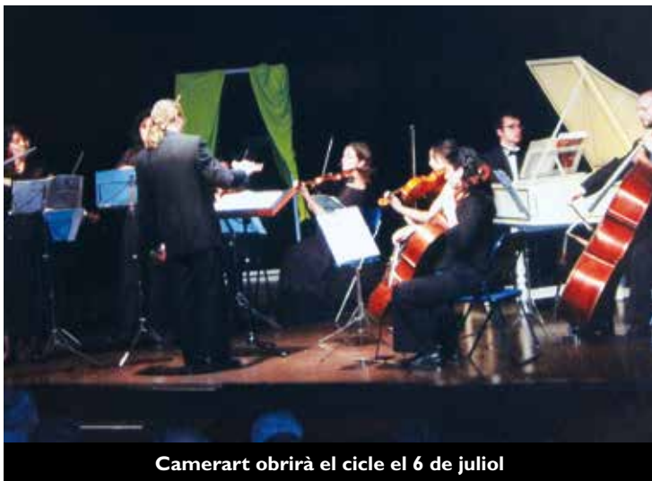
Camerart obrirà el cycle el 6 de juliol