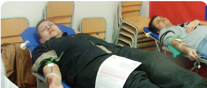
La Marató tindrà com a escenari l'escola Pérez Sala