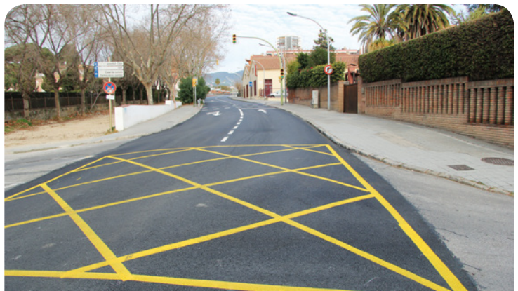
Millora del ferm de la carretera

La primera setmana de febrer la Diputació de Barcelona va asfaltar la calçada de la carretera de Cabrils en el tram comprès entre el pont de l'avinguda Carles III amb Lluís Companys fins al carrer Santa Maria.