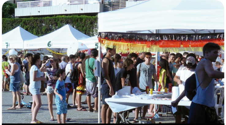
El projecte de la fira intercultural va ser un dels guanyadors de l'edició anterior

Durant la segona quinzena de març està previst que es faci la presentació als instituts de l'Ajuntament Jove, recollint l'experiència dels alumnes que van participar l'any passat. Després començaran els espais de reflexió amb l'alumnat per formar els grups de treball, oferint-los eines pràctiques i teòriques i donant-los a conèixer la realitat de la gestió pública perquè puguin elaborar les seves propostes. Un cop cada grup les tingui dissenyades i redactades es presentaran en públic i es votaran a través del web municipal. En aquesta fase, com a novetat d'enguany, els joves podran presentar les seves propostes en una