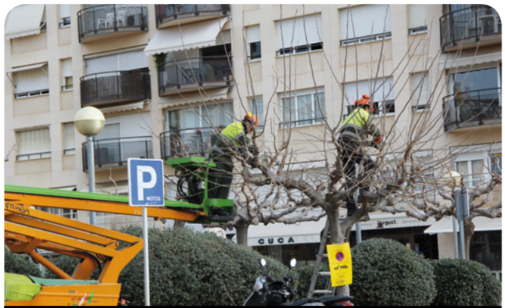
Operaris fent la poda

L'objectiu és aconseguir un manteniment i un creixement saludable dels arbres a més d'eliminar aquelles branques que causen molèsties o dificulten la circulació de cotxes, vianants, que toquen edificis o tapen senyals i fanals. L'empresa encarregada de la poda aplica en cada cas el tractament que tant l'espècie com l'espai on es troba requereixen. Les restes de poda serveixen per fer-ne compost.