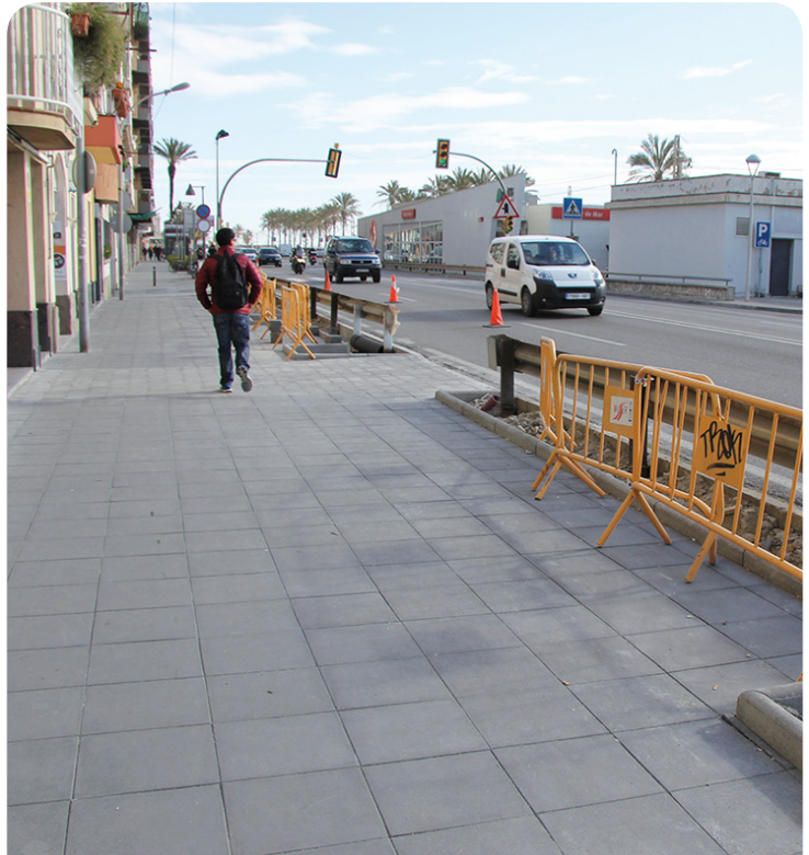
Tram del carrer Sant Jaume amb nou paviment

El nivell de la vorera en aquest tram de la via havia quedat per sota del nivell de la carretera, fet que provocava quan plovia que l'aigua de la carretera no fos absorbida pels embornals i el carrer quedés intransitable pels vianants. L'objectiu de l'obra és fer un sanejament de tota la vorera, que presentava peces trencades i zones enfonsades, creant uns pendents i embornals adequats per a l'aigua pluvial provinent de la carretera, i refer la vorera de nou per tal de millorar l'accessibilitat i la seguretat dels vianants. L'obra, finançada per la Diputació de Barcelona, té un pressupost de 181.125,13 euros, i el termini d'execució és de tres mesos.