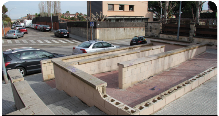
La rampa i les escales s'han enderrocat

rà, passarà a ser d'una sola direcció. El pressupost de l'obra, finançat per la Diputació de Barcelona, és de 45.263,10 euros i el termini d'execució és de 3 mesos.