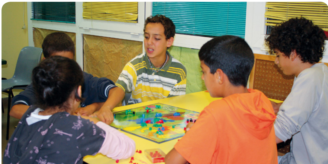
El Tucutuc va comptar amb 3.292 assistències l'any 2014

El Tucutuc compleix 20 anys i per celebrar-ho des del mes de març anirà fent diferents activitats que culminaran al juny amb l'acte central de l'efemèride.