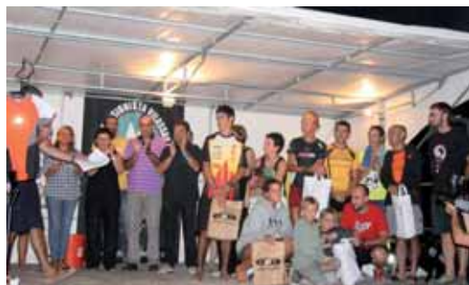
Lliurament de premis.