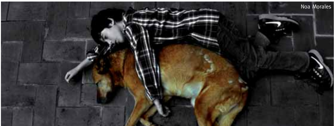
Fotografia guardonada amb el 1r premi de la categoria de 12 a 17 anys.

La mostra es podrà visitar els dimarts i dijous al matí, de 9.30 a 13 h, i totes les tardes de dilluns a divendres, a excepció del dimarts, de 16.30 a 20 hores.