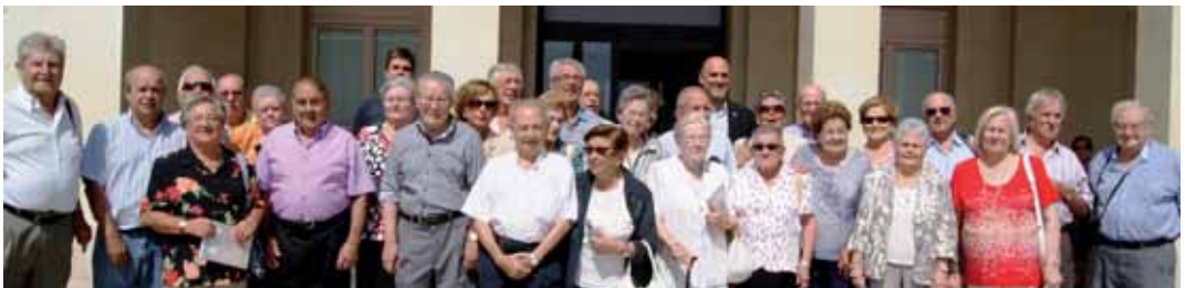
El grup acompanyat per representants dels consistori

El grup Nats el 31 es va formar amb motiu de la celebració dels 65 anys dels seus membres i des d'aleshores organitza diferents activitats.