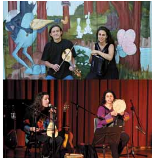
"El grill Esteve i l'orquestra del bosc"

El següent espectacle serà "Aladdi", l'adaptació del conte clàssic de les '1000 i 1 nits' que farà la companyia El Fantàstic Hardy Freenkel. Es representarà el 13 de novembre. El mateix mes però el dia 27 tindrà lloc l'espectacle de música "Guillamino a la classe de les girafes", que proposa als nens construir una peça electrònica a partir de les seves veus en temps real. L'any acabarà el 18 de desembre amb "Tot bufant", de Pep Gol i Pep Pasqual, que mostraran com objectes quotidians, ampolles o regadores, també poden formar part de la secció de vent d'una orquestra. Tots els espectacles comencen a 2/4 de 6 de la tarda a l'Ateneu Vilassanès.