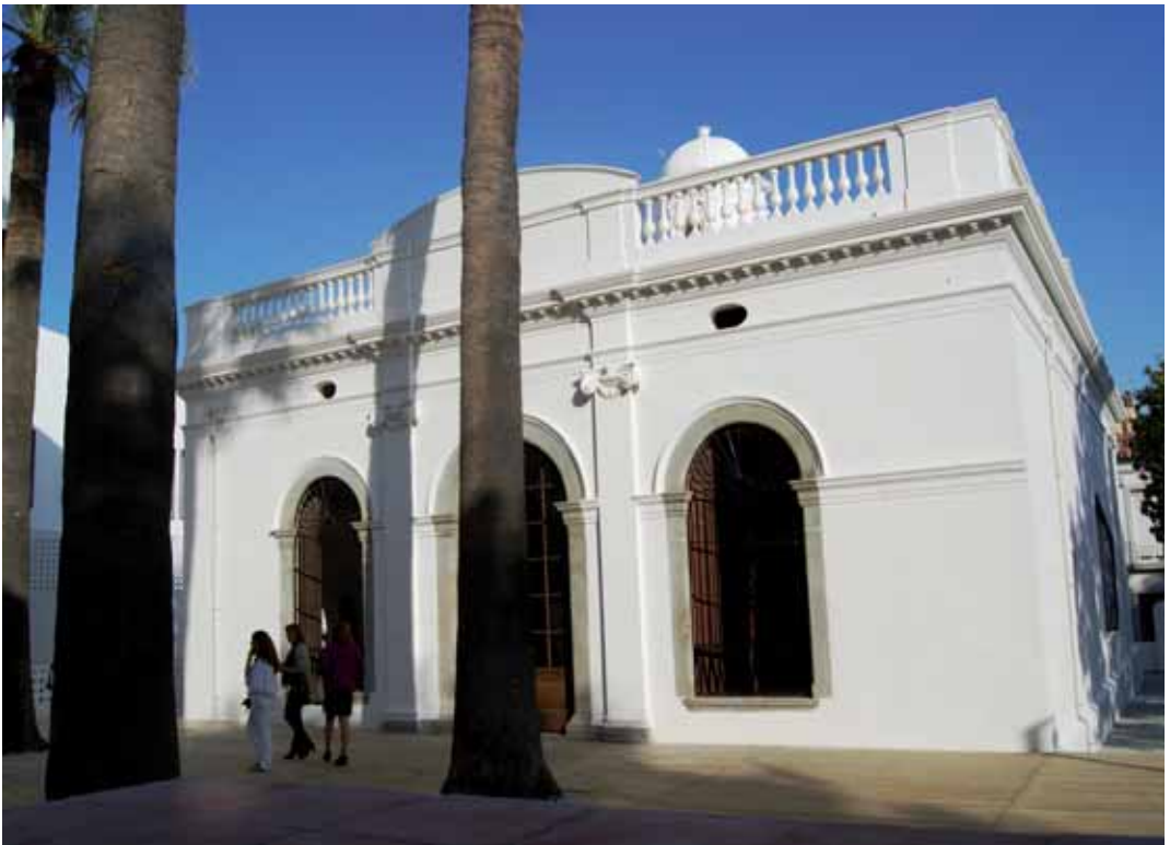
Can Bisa, casa colonial que estarà dins de la visita guiada.

Els restauradors del poble també s'han involucrat. Durant els dos dies de la Fira es podran assaborir diferents plats, cocktails i suggeriments culinaris basats en la gastronomia cubana, que han preparat els següents establiments: Daunis, Can Falgueras, Casa Juan, Café Tapes Favela, L'Espinaler, Botavara, Samanà i El Terral.