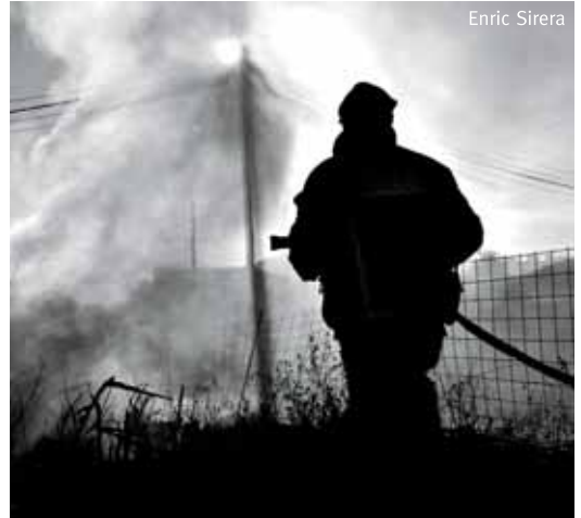
Una de les imatges de la mostra.

"Sortida confirmada" és el seguiment que el fotògraf local va fer als bombers de Mataró durant prop de sis mesos per mostrar dos aspectes diferents de l'ofici, el de les sortides, principalment incendis, i el de les guàrdies amb els moments de les hores d'espera, l'altra cara de la professió.