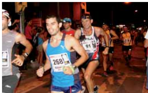
Els participants encara pel circuit urbà.

La propera activitat que organitzarà el Centre Excursionista de Vilassar de Mar serà el Vilassar Camina, el 23 d'octubre.