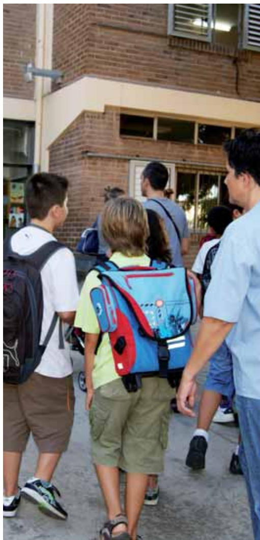
Primer dia de classe

La Bressoleta, l'escola bressol municipal que compta amb dos centres, va obrir portes el dia 7 de setembre amb un total de 243 nens i nenes matriculats i totes les places disponibles cobertes.