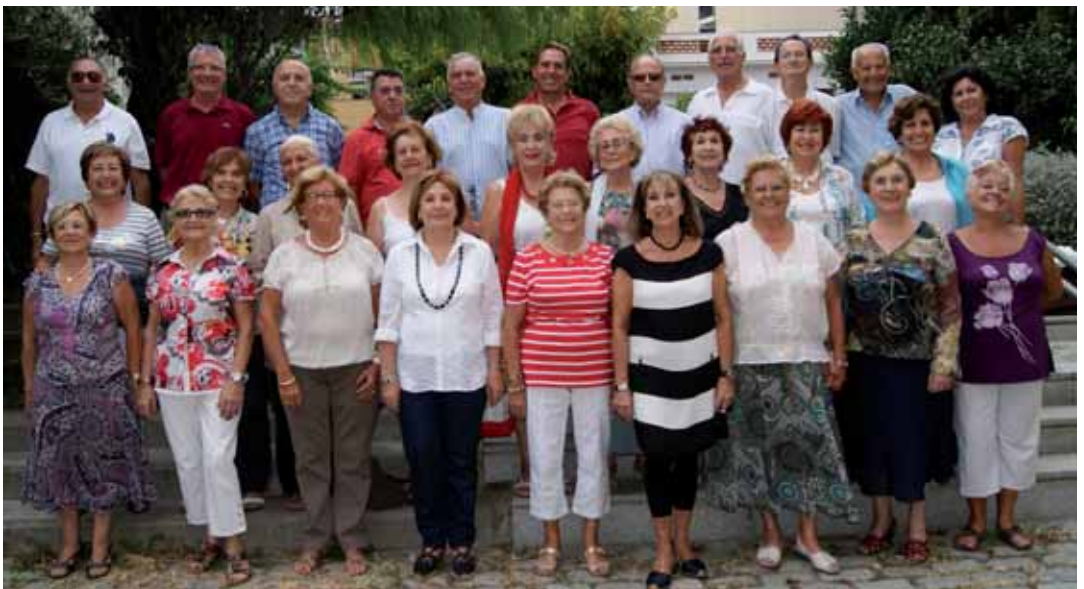
Grup que prepara el musical dedicat a la sarsuela

La Setmana de la Gent Gran portarà altres activitats ja consolidades com són les jornades de portes obertes a les diferents residències per a la gent gran que hi ha al poble, les festes als centres cívics, els campionats de petanca, botifarra, escacs i dòmino o el concurs de truites, que enguany arriba a la cinquena edició. Tampoc faltará una actuació musical a càrrec del tenor Jaume Fonollà, que tindrà com a escenari la sala