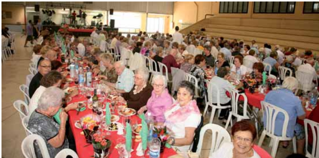
Dinar de germanor, any 2010.

missa o el dinar de germanor que posará el punt i final a la celebració. L'Ajuntament recorda que si alguna persona té problemes de mobilitat i vol assistir a algun acte, ho pot sol·licitar trucant a l'Escola Nàutica, al 93 754 05 00. La programació es detalla a les pàgines següents.