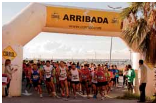
Sortida de la cursa any 2010

Per a inscripcions, cal adreçar-se a la Policia Local o a les botigues Corriol i Spiridon. El preu és de 5 euros pe persona. El termini d'inscripció es tancarà el 22 de setembre o abans si s'arriba a la xifra màxima de 250 participants.