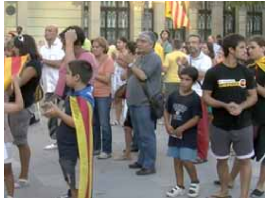
La concentració va aplegar unes 200 persones a la plaça de l'Ajuntament

Durant el transcurs de l'acte, que comptava amb el suport de l'Ajuntament, la regidora d'Ensenyament va llegir el manifest unitari de la plataforma Somescola.cat, que mostrava el rebuig a les sentències del Tribunal Suprem i la interlocutòria del Tribunal Superior de Justícia de Catalunya que qüestionen el català com a llengua vehicular de l'ensenyament a Catalunya. El text diu que la sentència "atempta clarament contra el model d'escola catalana, un model que ha funcionat amb èxit els darrers 30 anys" i destaca que la immersió "garanteix el coneixement de les dues llengües oficials a Catalunya". El manifest va fer una crida a "continuar reforçant el model d'escola catalana i a lluitar amb tots els mitjans democràtics per no posar en perill la cultura i la cohesió social de Catalunya".