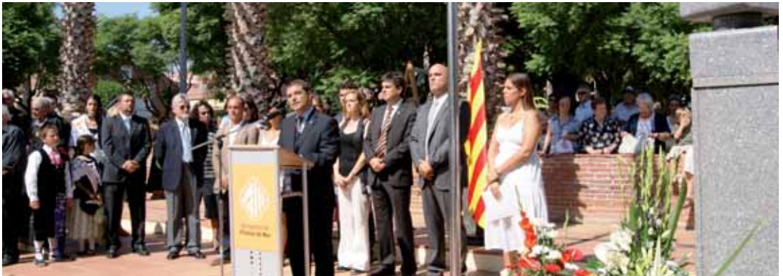
Discurs institucional al jardí del Museu de la Marina

A continuació, la Coral Englantina va interpretar diferents peces del repertori popular i tradicional català davant el públic assistent. A la tarda, un recital de poesia dedicat a Joan Salvat-Papasseit, a càrrec de la Tropa Teatre, va posar el punt i final als actes institucionals que el dia abans havien començat amb una ballada de sardanes.