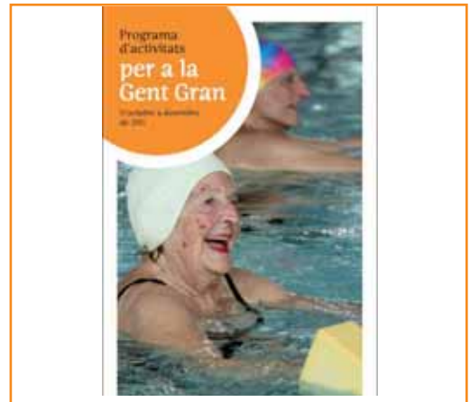
Portada del fulletó del programa d'activitats

Entre els tallers que es duran a terme hi ha de nous com el de rapsòdia i poesia o el de jardineria i d'altres que continuen com el de mandales, el de qualitat de vida i benestar, el de 'Fent amics', els cursos de piscina, country, anglès i informàtica en diferents nivells, l'aula de manteniment de la memòria i les classes de txi-kung. Pel que fa a les sortides, s'ha programat una el 15 de novembre per visitar el Museu de la Xocolata, que té el preu de 12 euros i que necessita inscripció prèvia ja que les places són limitades. També hi haurà xerrades cada últim dilluns de mes sobre diferents temes al centre social Mn. Josep M. Galbany. L'Ajuntament ha editat un fulletó amb la informació detallada d'aquestes activitats.