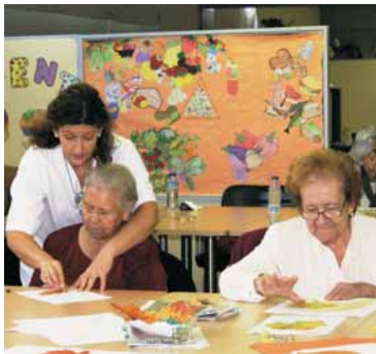
Les residències i casals de gent gran es van obrir al públic. A la imatge, tallers al centre de dia del Casal de Curació.