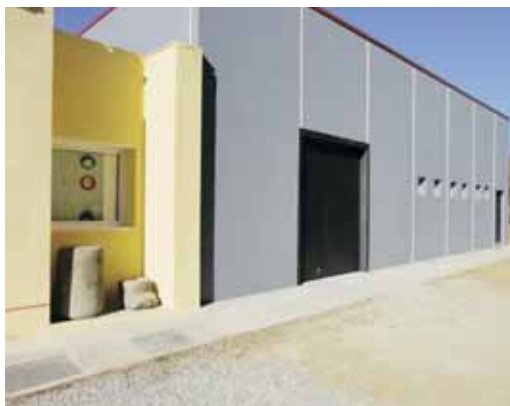
Exterior de la nova seu

La nova seu, de 236 m 2 construïts, compta amb un rocòdrom considerat com un dels millors que existeixen en l'actualitat tant per les seves dimensions, 100 m 2 , com pel seu disseny, pensat per als escaladors més exigents però també per als que es vulguin iniciar. El rocòdrom ha estat finançat en la seva totalitat pel Piri. L'equipament també disposa d'un espai per a secretaria i recepció, un magatzem, un taller de reparació de material, vestidors, un espai central i un espai social d'uns 50 m 2 per a reunions, trobades, biblioteca i formacions. Actualment el Piri, fundat el 1954, té més de 450 socis i sòcies.