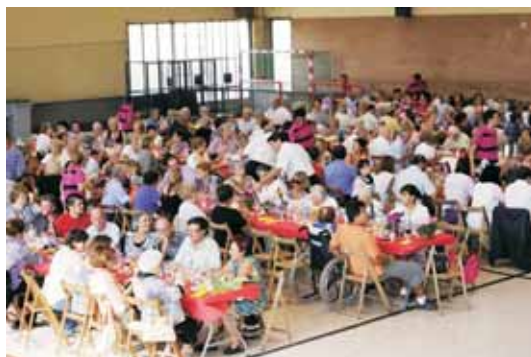
El dinar de germanor, la cloenda, va aplegar més de 200 persones a la pista annexa del Pavelló d'Esports Municipal.