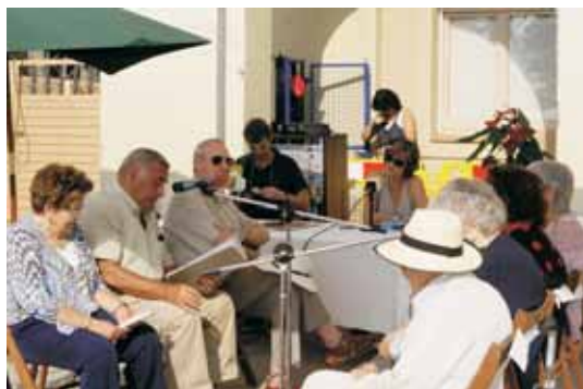
Les veus que cada dimarts omplen les ones de Vilassar Ràdio i fan possible el programa 'Els nostres avis', aquesta vegada, a la plaça de l'Ajuntament.