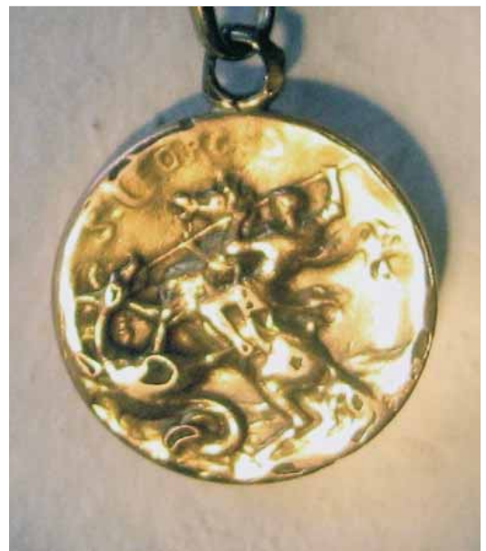
Medalla centenària que va permetre identificar-lo.