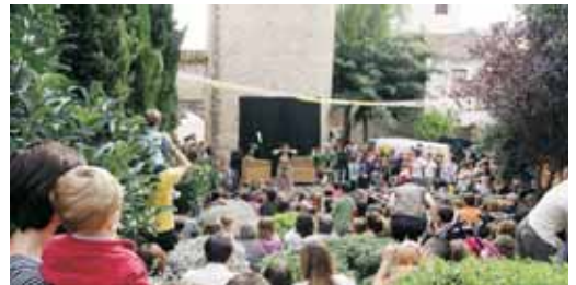
Espectacle 'Nil i la casa de xocolata', a la Torre d'en Nadal