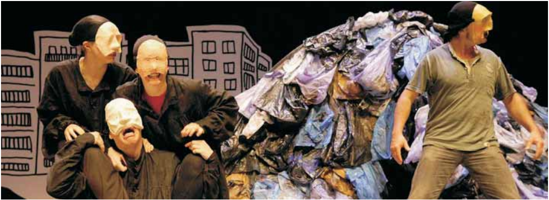
Escena de l’espectacle

Convenis de l’Organització del Treball. Sota la direcció de Toni Arteaga, arribarà a l’Ateneu Vilassanès el 20 de novembre, a les 6 de la tarda.