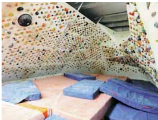
Nou rocòdrom del Piri