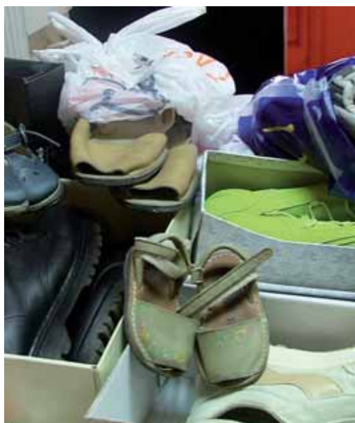
Algunes de les sabates recollides

“Sabates per a l'Àfrica” s'està duent a terme des del 2006, i enguany compta amb l'apadrinament de la Fundació de Samuel Eto'o.