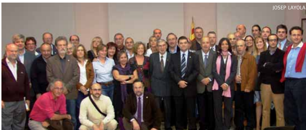
Alcaldes, regidors i regidores assistents a l'acte

La darrera part de la conferència la va centrar en el Pacte de Toledo, que es va signar després d'un intens debat sobre l'estat de la Seguretat Social als anys 90.