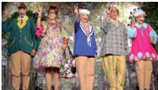
Els tres porquets

D'altra banda, la companyia de dansa Cotton escenificarà el 13 de desembre (17.30h, Ateneu), l'espectacle "La rateta presumida". Tot començarà com en el conte, amb una rateta que escombrant l'escaleta es troba una moneda d'or, es compra un llaç i comença a buscar pretendent per casar-s'hi.