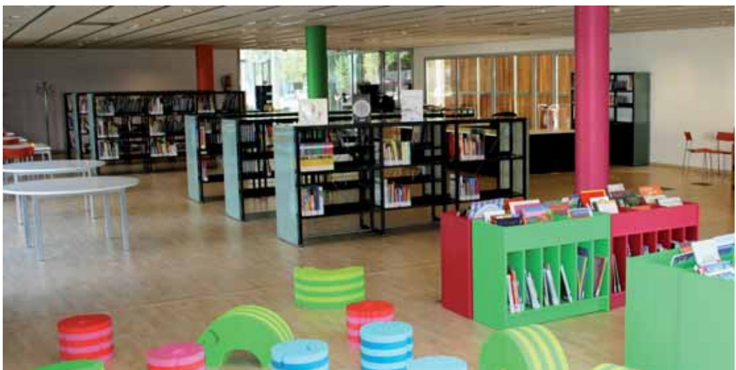
Zona infantil, a la planta baixa