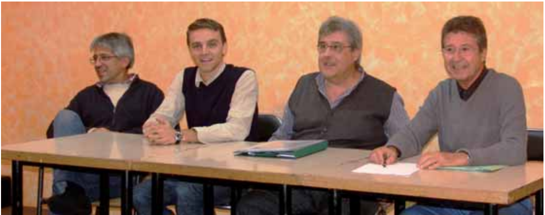
Integrants de la junta de la Plataforma escollits en assemblea

La Plataforma té grup propi al Facebook, "Consulta per la independència de Catalunya a Vilassar de Mar", amb més de 200 persones adherides donant-li suport i el bloc: http://www.vilassardemardecideix.blogspot.com .