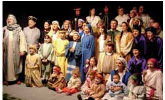
Una de les darreres representacions d'Els pastorets de Patronat Teatre

El grup del Patronat té una llarga tradició en representar aquesta obra característica del Nadal. L'any 1992 van celebrar els 75 anys d'Els pastorets.