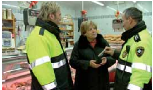
Agents informant de la campanya, any passat

Els agents visitaran els diferents comerços i oferiran als botiguers consells de seguretat. Enguany els repartiran un llaç per a que els comerciants puguin detectar els bitllets falsos. Està previst que la campanya finalitzi el 5 de gener.