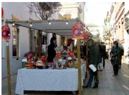
Les parades de l'any passat, al carrer Sant Joan

L'any passat la Fira de Nadal va comptar amb una quarantena de parades.