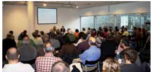
El públic va omplir la sala d'actes de la nova biblioteca