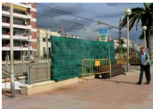
Inici de les obres al pas, banda passeig Marítim

Les obres, adjudicades a l'empresa Cotesa, han començat més tard del previst per l'endarreriment en el permís d'Adif, l'Administrador d'Infraestructures Ferroviàries.