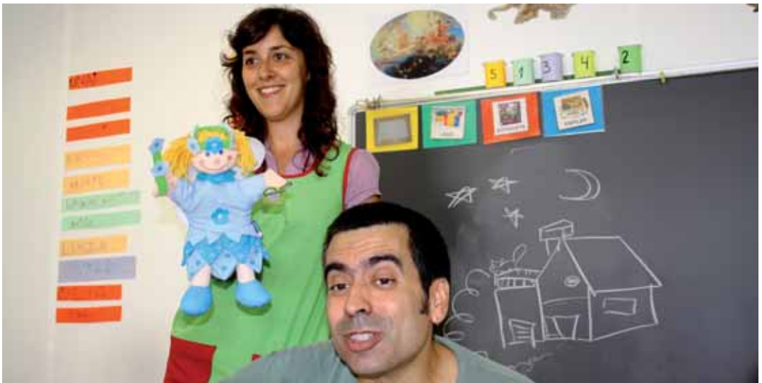
En Manel, amb una de les professores d’els Alocs

Tothom que ho vulgui pot participar al programa a través del correu electrònic dissabte@articulat.com . Per a més informació es pot consultar el bloc: www.dissabtearticulat.blogspot.com o el web de l'emissora http://radio.vilassardemar.cat , on es poden escoltar i descarregar els programes emesos.