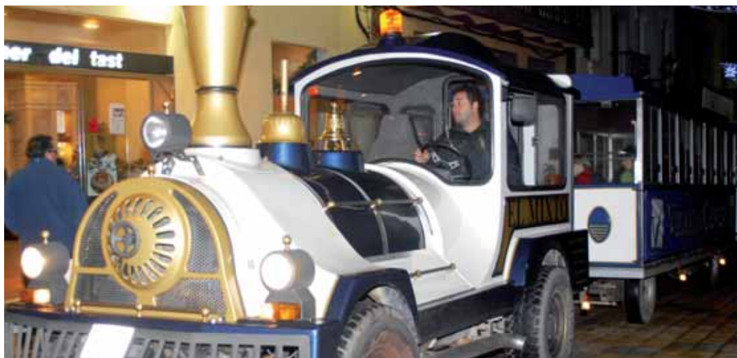
El tradicional trenet dels comerciants

Una altra novetat és el concurs d'aparadors que organitza Vilassar Comerç entre els comerços associats i que portarà com a títol "Nadal tradicional", amb l'objectiu que les botigues s'engalanin per les festes. El dia 20 de desembre, el jurat del concurs avaluarà els comerços inscrits i els dos guanyadors gaudiran dels corresponents premis.