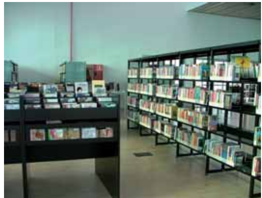
Zona del fons audiovisual i documental

El dissabte 28 de novembre el nou equipament farà jornada de portes obertes, de 10 a 14h i de 16 a 19h, amb diferents activitats adreçades principalment al públic infantil. A les 12 del migdia hi haurà un espectacle de titelles per a nens i nenes a partir de 3 anys. De 5 a 7 de la tarda es farà un taller per a infants a partir de 7 anys per fer punts de llibre, i a dos quarts de sis de la tarda, l'activitat del Nascuts per llegir "Tocadits", per a nadons fins als 3 anys.