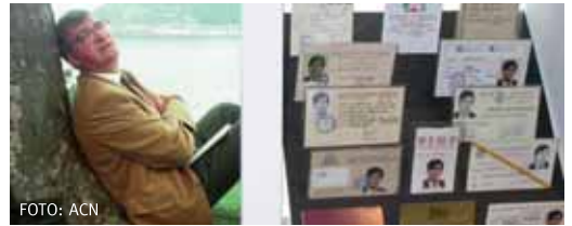
Un dels plafons de l'exposició