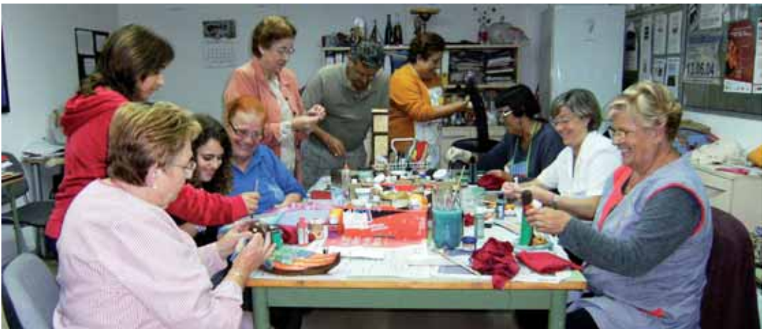
El taller de reciclatge del PDC funciona des del 2008

El 13 de desembre Televisió de Catalunya celebrarà la dissetena edició de la Marató de TV3, que dedicarà a les malalties minoritàries. Aquestes malalties, conegudes també com a "rars" o "poc freqüents", són més de 7.000 patologies greus, agrupades internacionalment sota aquest nom per la seva poca prevalença, però que el conjunt de malalts suposa el 8% de la població europea. A Espanya hi ha 3 milions d'afectats i 400.000 a Catalunya. Amb la divulgació d'aquestes malalties tan poc conegudes, la Fundació la Marató de TV3 vol donar resposta a la nombrosa demanda de famílies i associacions preocupades per l'escassa investigació i, conseqüentment, per la manca de tractaments i de recursos.