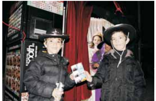
Una cabina de fotografies instantànies, que feia fotos gratuïtes, va permetre immortalitzar el moment del Carnaval. Es van fer 362 fotografies al llarg de tres hores.