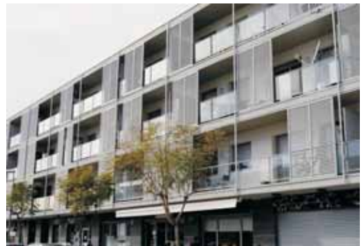
Habitatges de promoció pública del carrer Santa Eulàlia

Les bases per participar es troben al web municipal www.vilassardemar.cat i la documentació s'ha de lliurar a les oficines municipals ubicades a la plaça de l'Ajuntament, 1, 1r pis, de dilluns a divendres, de 9 a 14 hores. Per a més informació es pot trucar al tel. 93 754 24 00, ext. 146.