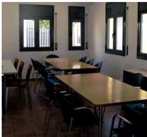
Interior del local social