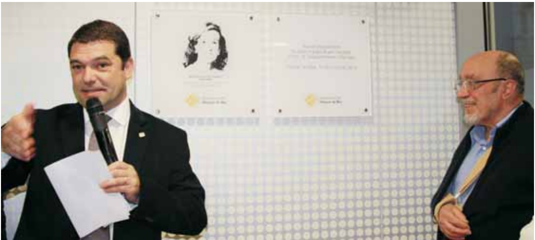
Descoberta de la placa inaugural