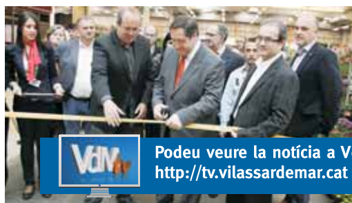
El conseller d'Agricultura va inaugurar la jornada