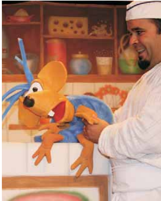
Cuina de nassos