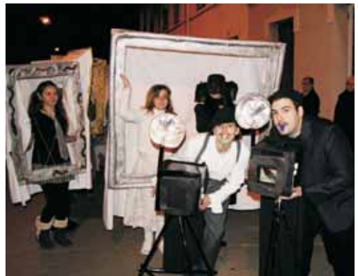
"El passat et persegueix" va guanyar el quart premi. Vestits de marcs de fotos antigues, recreaven en blanc i negre moments quotidians de la vida familiar.