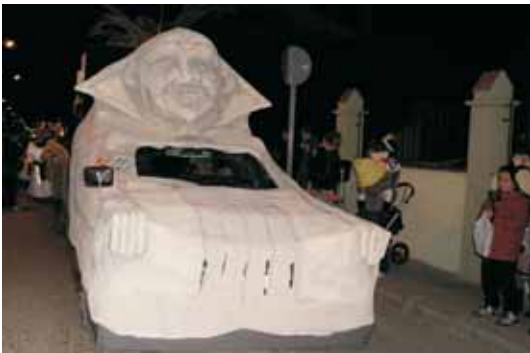
La carrossa d'Egiptèrèpia va rebre el premi Toni Linares. Recreava una gran esfínx i comptava amb elements de l'antic Egipte: columnes, símbols i fins i tot un camell.