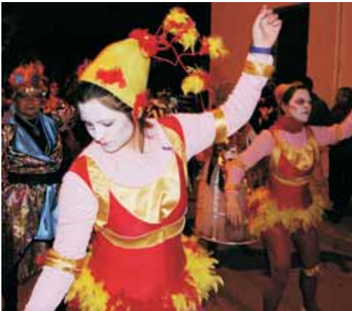
"Alegria", en clara al·lusió a un espectacle del Cirque du Soleil i els seus diferents personatges, va ser premiada amb el tercer premi.