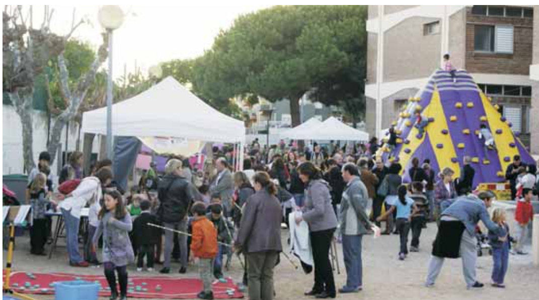
L'escola Pérez Sala serà l'escenari de la festa el 14 d'abril

Els centres educatius són una peça clau per transmetre hàbits saludables entre els infants. Per aquest motiu, durant tota la setmana faran activitats especials amb els seus alumnes. Sortides a peu al Castell de Burriac, anar al mercat a comprar fruita, consells i idees per a berenars, tallers d'amanides, i activitats d'educació física diverses són alguns exemples.