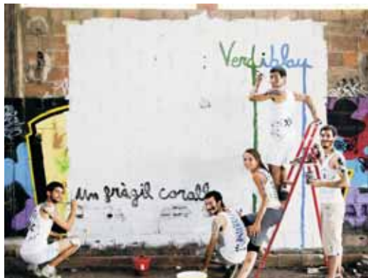
El grup Verd i Blau

Els membres de Verd i blau formen part d'una nova fornada de músics que afronten la creació musical des de la més absoluta llibertat de gèneres, registres i estils: jazz, pop, reggae, rock, avantguarda... amb l'única premissa de no avorir-se i no avorir el públic.