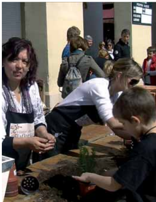
Taller de les floristes

La fira, per promocionar l'artesania i els productes de mestres artesans, va comptar amb 14 parades d'artesania alimentària (ratafia, embotits, formatges, cervesa, melmelades, neules, pa, olives, xurros, coques...) i 16 parades d'artesania variada (bijuteria, encens, il·lustracions, lavanda, sabó, fusta...). Els infants van poder gaudir dels tallers de papiroflèxia, joguines de fusta, terrissa, macramé, filat de llana, i un per trasplantar planta aromàtica. Aquest darrer va anar a càrrec de les tres floristes del poble, i estava emmarcat dins el programa VilesFlorides.