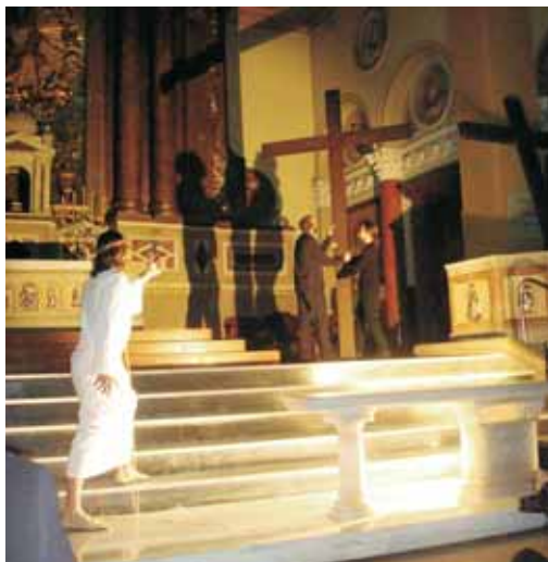
Una de les escenes