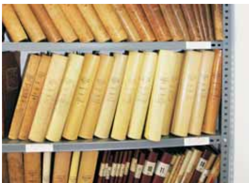
Llibres a digitalitzar

Finalment es realitza l'enregistrament de les dades de cada inscripció i l'enviament de tota la informació per a la seva integració en l'aplicació informàtica de gestió d'inscripcions registrals del Ministeri de Justícia (Inforeg).