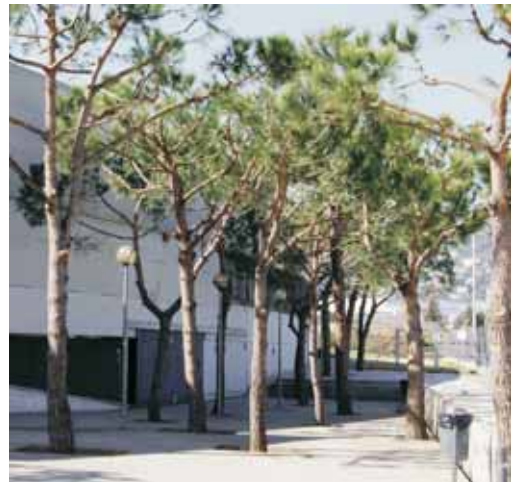
Espai entre el camp annex de futbol i l'institut