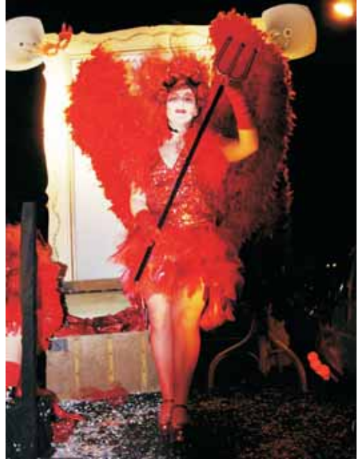
"Vermell explosiu" es va emportar el segon premi. La seva reina, 'Explosiva', va ser nomenada la reina del Carnaval.