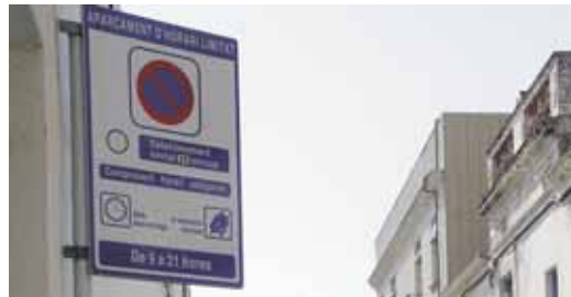
Senyal de limitació de 25 minuts

De la mateixa manera i amb l'objectiu d'aconseguir una major rotació dels vehicles comercials i/o industrials en les operacions de càrrega i descàrrega, les zones que a continuació es relacionen s'han