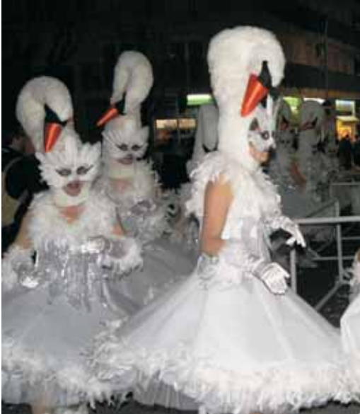
"Estem desplomats", la colla de cignes que feia classe en una escola de dansa, va ser la guanyadora del primer premi del concurs de comparses.