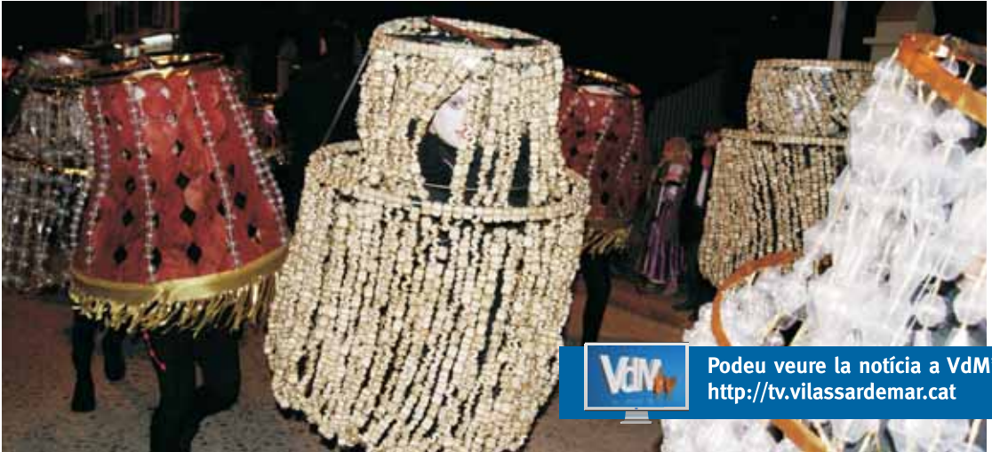
“Gli Il·luminati”, llums de saló o de tauleta de nit que llúien amb llum pròpia. Es van emportar el cinquè premi del concurs.