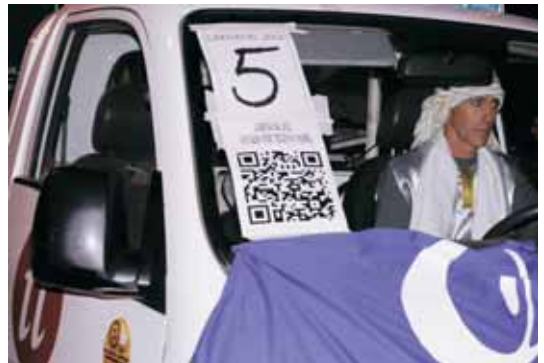
Enguany es va fer una prova pilot de votació popular no vinculant, per internet, i es van comptabilitzar 298 vots, la majoria dels quals van recaure en la comparsa “Estem encantats”, en les tres categories. L'any vinent es perfeccionarà el sistema per instaurar el premi del públic.