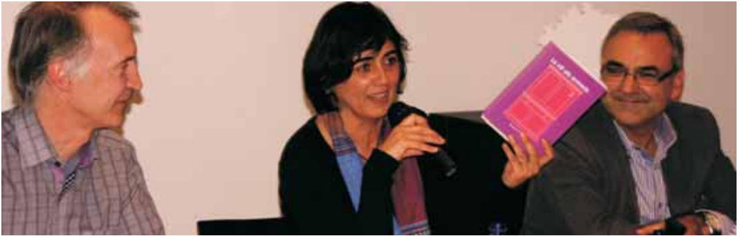
Presentació del llibre a la Biblioteca Municipal