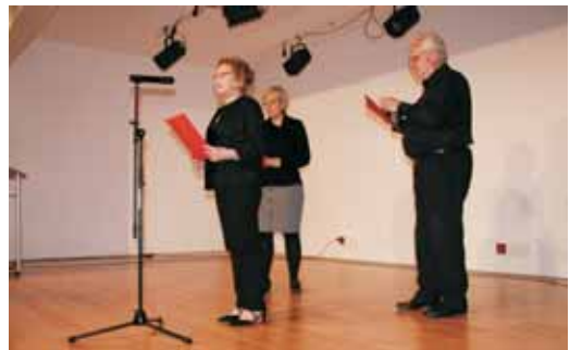
Lectura de poemes