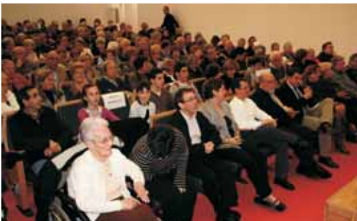
Sala plena a vessar