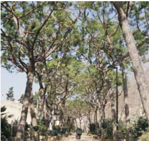
Passeig dels pins

haver per garantir així la seguretat d'aquest espai, un dels més transitats de la població. La mateixa actuació s'ha fet amb els pins de la plaça Pompeu Fabra i els pins de l'espai comprès entre el camp annex de futbol i l'institut Vilatzara.