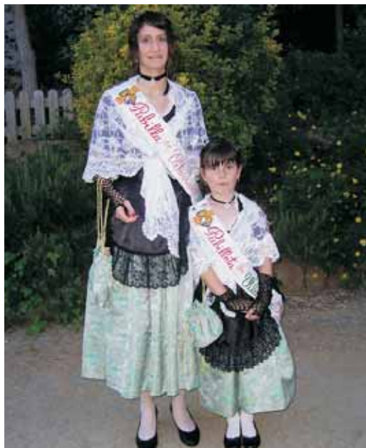
Pubilla i pubilleta 2010, les darreres representants del pubillatge

Per ser pubilla o hereu cal tenir entre 16 i 20 anys, i per pubilletes i hereuets entre 7 i 10 anys i sobretot moltes ganes d'anar pels diferents pobles de Catalunya representant al municipi. Les persones interessades es poden posar en contacte amb l'associació abans del 30 d'abril trucant als telèfons 937594084 o 625895078 (Juan Bustos) o bé mitjançant el web www.pubillavilassardemar.cat