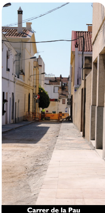
Carrer de la Pau

Al carrer Santa Isabel (entre Montserrat i Sant Ignasi), de la Pau (entre Sant Ignasi i Montserrat) i Sant Ignasi (entre pl. del Círcol i carretera de Cabrils) s'han ampliat voreres i s'han posat al mateix nivell que la calçada,