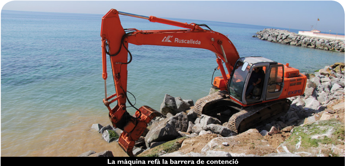
La màquina refà la barrera de contenció

del ferrocarril. Les obres tenen una durada aproximada de dues setmanes, si les condicions meteorològiques i l'estat de la mar ho permeten.