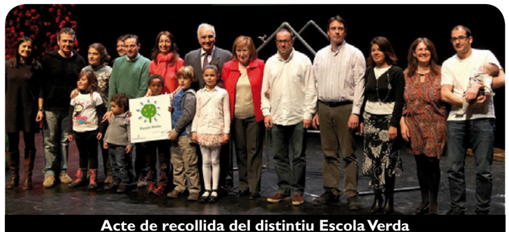
Acte de recollida del distintiu Escola Verda

El programa Escoles Verdes ajuda els centres a incorporar els valors de l'educació per a la sostenibilitat en tots els àmbits de la vida del centre.