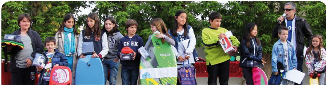
Els premiats recollint els premis

El 12 d'abril, en la festa de cloenda de la Setmana de la Salut, es van lliurar els premis del concurs de dibuix del gOvi, que enguany seguia el tema "Vilassar de Mar vila saludable" i va rebre 572 dibuixos d'alumnes de primària.