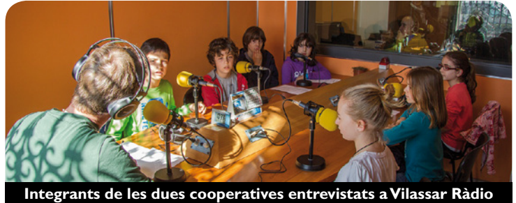
Integrants de les dues cooperatives entrevistats a Vilassar Ràdio

una activitat a l'escola. Des del centre i des de l'Ajuntament es valora de forma molt positiva la iniciativa que a més d'unir-los, els ha ajudat a desenvolupar valors i hàbits relacionats amb l'emprenedoria.