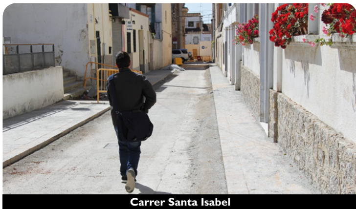
Carrer Santa Isabel

L'objectiu d'aquestes actuacions —l·ligades a les obres per adequar com a vial urbà el tram de la carretera de Cabrils entre la Nacional II i el carrer Santa Maria— ha estat millorar l'accessibilitat per als vianants. Amb les obres al carrer Sant Genís, entre el carrer Buenos Aires i la carretera de Cabrils, s'han ampliat les voreres i un cop acabades no s'hi podrà estacionar. Per aquest motiu, s'ha habilitat com a aparcament l'espai de l'antic Patronat que quedava per urbanitzar. En total 36 noves places per a cotxes i 10 per a motos, davant les 25 que s'han eliminat al carrer. La intenció del govern municipal a curt termini és que l'aparcament de l'antic Patronat sigui de zona verda per facilitar l'aparcament a les persones residents al poble. Les tarifes per a residents serien de 0,20 euros per a estacionament d'un dia i d'1 euro per a estacionament d'una setmana, mentre que per a no residents serien a preu de zona blava. Els diumenges i festius i els dies laborables de 14 a 16 h i de 20 a 8 h l'aparcament seria lliure.