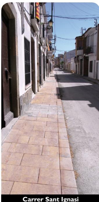
Carrer Sant Ignasi

Al carrer Santa Isabel (entre Montserrat i Sant Ignasi), de la Pau (entre Sant Ignasi i Montserrat) i Sant Ignasi (entre pl. del Círcol i carretera de Cabrils) s'han ampliat voreres i s'han posat al mateix nivell que la calçada,