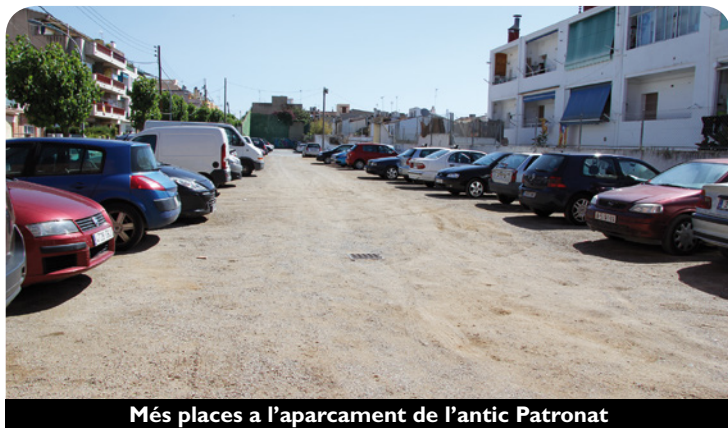
Més places a l'aparcament de l'antic Patronat