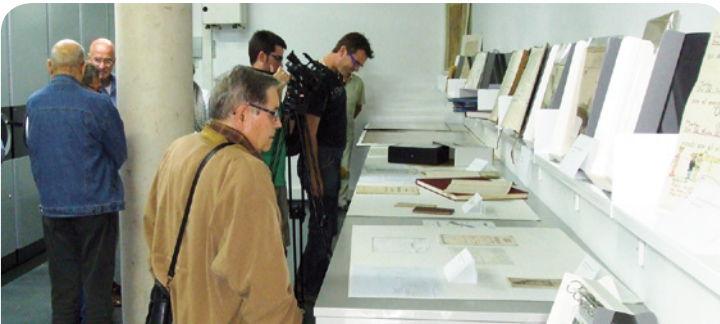
Cada any obre les portes per donar-se a conèixer

Les trobades d'amigues i amics de l'Arxiu Municipal han donat el seu fruit en forma d'exposició, una mostra que s'inaugurarà el 21 de juny. L'objectiu de l'exposició, amb 31 imatges, serà donar a conèixer la feina que es fa a les trobades on es passen fotografies antigues per tal que els participants puguin identificar persones, paisatges, noms de cases o indrets, i així actualitzar la informació i els materials de l'Arxiu Municipal. Des de l'octubre del 2013 ja s'han identificat més d'un centenar de fotografies. L'exposició tindrà com a títol "Memòria fotogràfica de Vilassar de Mar. Volem conèixer el Vilassar de Mar d'abans. Necessitem la teva col·laboració".