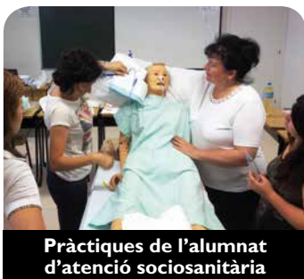
Pràctiques de l'alumnat d'atenció sociosanitària