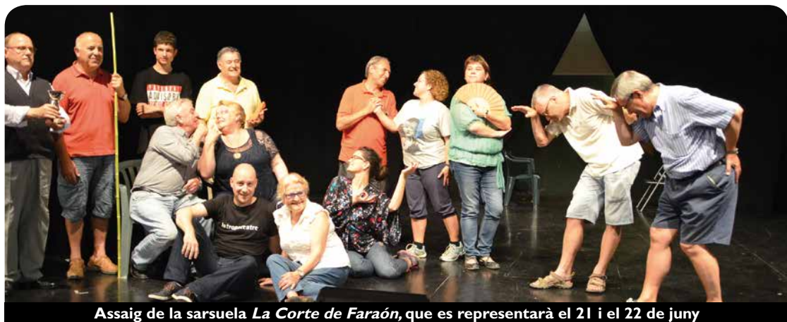
Assaig de la sarsuela La Corte de Faraón , que es representarà el 21 i el 22 de juny