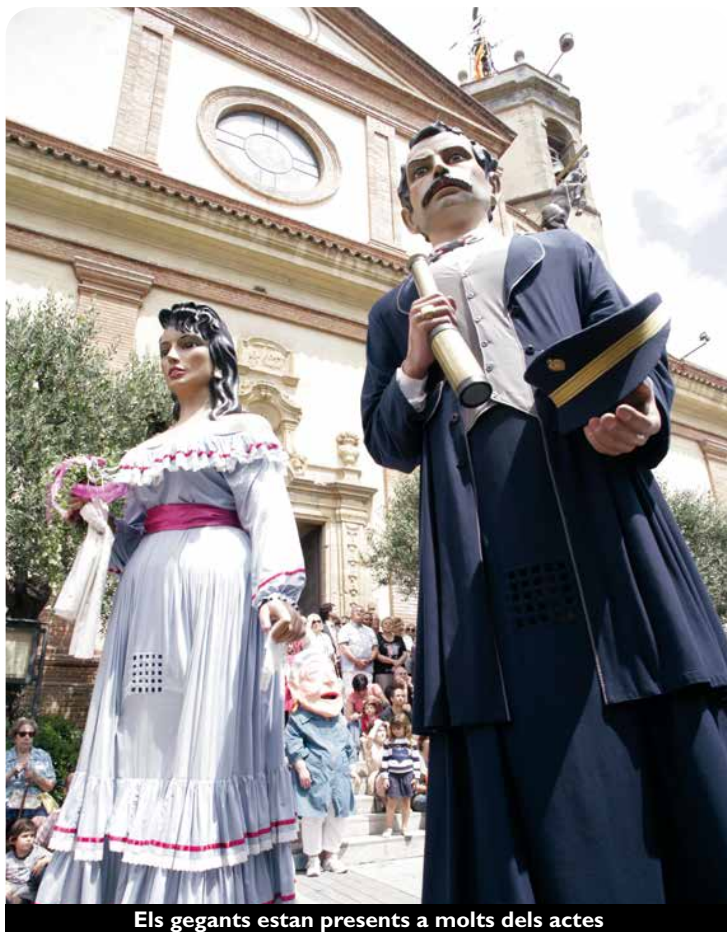
Els gegants estan presents a molts dels actes

El dimecres 25 de juny la despenjada de l'ase Innocenci i el comiat del Pigat i la Lucía, a més de la cantada d'havaneres i el castell de foc d'artifici marcaran el fi de festa.