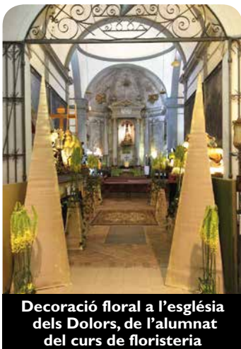
Decoració floral a l'església dels Dolors, de l'alumnat del curs de floristeria

En total s'han realitzat 5 cursos subvencionats pel Servei d'Ocupació de Catalunya i el Fons Social Europeu: Anglès: Atenció al públic, Activitats Auxiliars De Floristeria (nivell I), Activitats Auxiliars de Floristeria (nivell II), Atenció Sociosanitària a Persones Dependents en Institucions i Operacions Auxiliars d'Enregistrament i Tractament de Dades i Documents . Els quatre últims es tractaven de cursos de certificats de professionalitat, que consisteixen en una formació teòrico-pràctica amb una durada d'entre 400 i 600 hores, segons l'especialitat, per adquirir una sèrie de competències professionals pròpies d'una determinada ocupació.