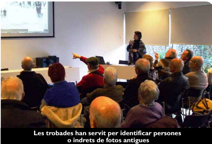
Les trobades han servit per identificar persones o indrets de fotos antigues