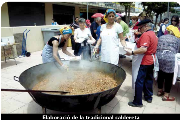
Elaboració de la tradicional caldereta