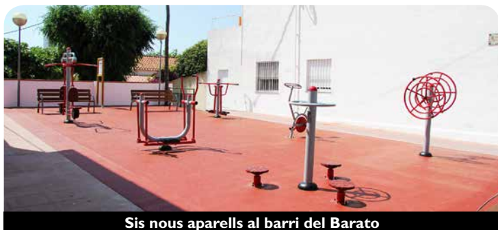
Sis nous aparells al barri del Barato

Els aparells són una doble roda de músculs per l'activació muscular i òssia, el triple gir de cintura per exercitar aquesta part del cos, l'uniciclo per reforçar les cames i la capacitat cardio-respiratòria, el doble dorsal assegut per millorar la força dels membres superiors, pit i abdomen, l'uni caminador el·líptic per exercitar la funció del cor, pulmons i extremitats inferiors i superiors, i el doble pèndul per potenciar la coordinació general del cos i enfortir la funció cardiovascular. Els aparells s'acompanyen d'un cartell on s'informa de com fer-los servir i amb consells per començar a fer exercici de forma saludable. Aquest nou espai d'activitat física a l'aire lliure s'afegeix als ja existents al passeig Sant Joan de Mar, passeig Marítim i al pati del cumu de les noies.