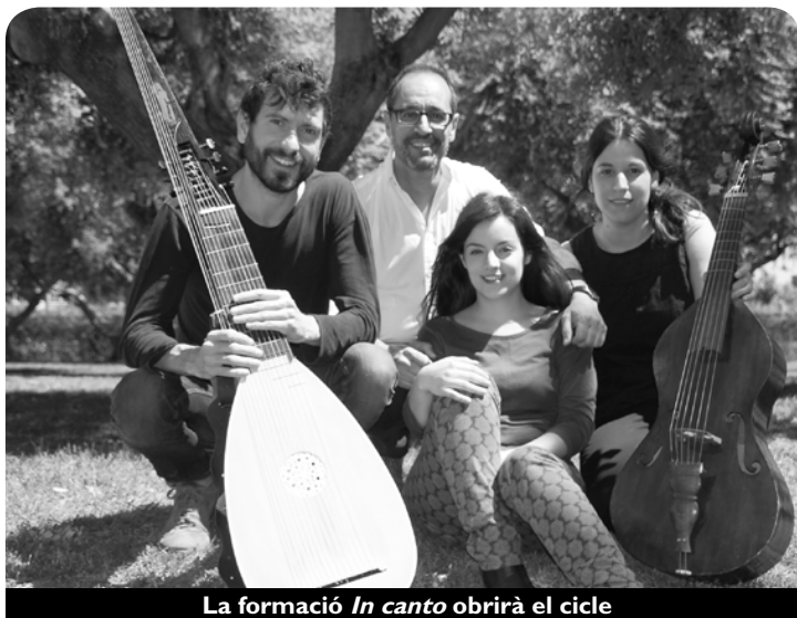
La formació In canto obrirà el cicle