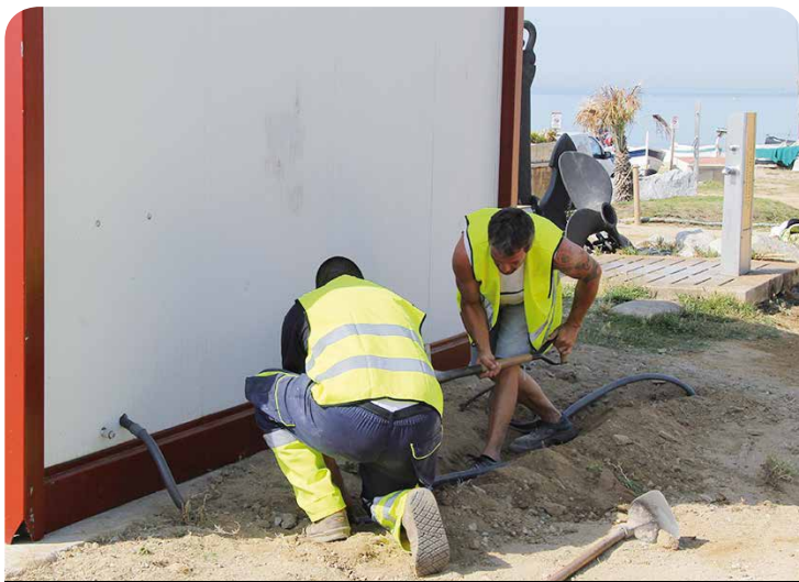
Dos dels nous operaris contractats

Les persones beneficiàries d'aquest programa són persones empadronades a Vilassar de Mar, usuàries de la borsa de treball de l'Ajuntament, inscrites al Servei d'Ocupació de Catalunya, amb càrregues familiars, i que en el moment actual no perceben cap ingrés econòmic. Vuit d'aquestes persones realitzaran durant sis mesos tasques de suport a la realització d'obres i manteniment de la via pública i equipaments municipals. Les altres dues estaran contractades com a agents cívics, durant quatre mesos, fent funcions d'informació i sensibilització a la ciutadania sobre el compliment de la ordenança de civisme del nostre municipi.