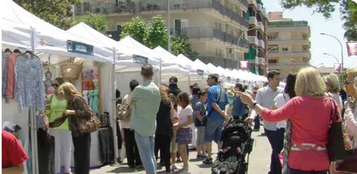
3a Fira de Comerç, Gastronomia i Serveis

vendre els seus productes van saber transmetre el seu valor afegit, la proximitat i la qualitat.