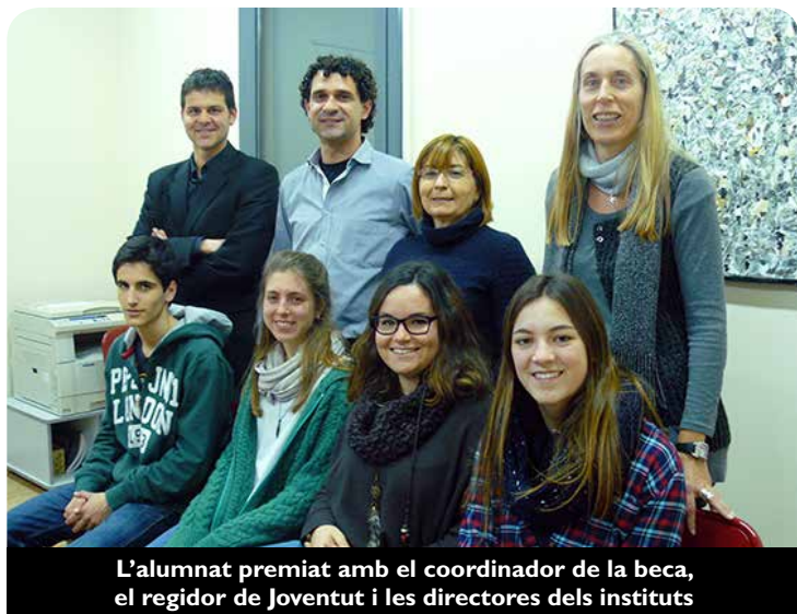
L'alumnat premiat amb el coordinador de la beca, el regidor de Joventut i les directores dels instituts

passat els alumnes becats van tornar molt satisfets amb la seva estada.