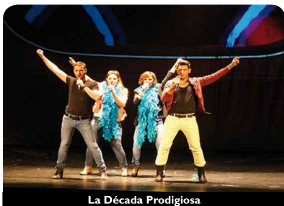
La Década Prodigiosa