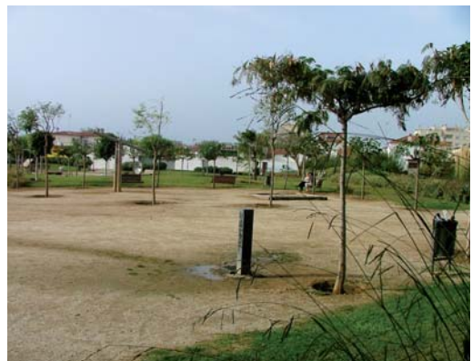
Parc de la Mar Xica, a la Xinesca.

La remodelació compta amb l'assessorament de professionals de la jardineria i el paisatgisme.