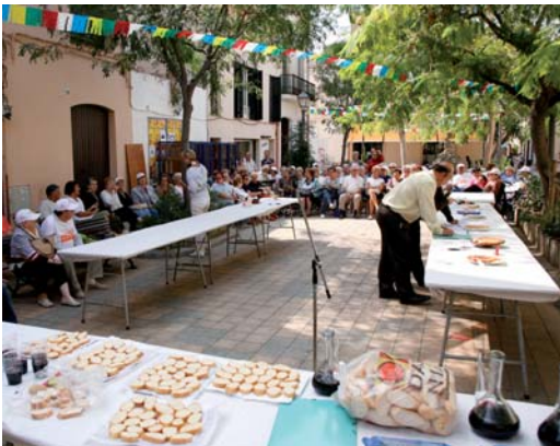
Concurs de truites amb premis per a la més original, la més petita, la més gran i la més bona.