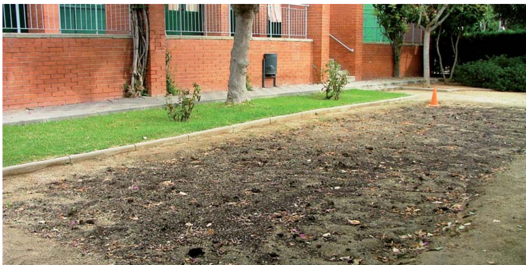
Espai destinat a hort escolar

L'espai, un rectangle de 3 per 14 metres, ja està preparat, l'ha condicionat la brigada municipal. D'altra banda, hi ha una comissió de l'escola que està decidint com el faran servir en cada un dels cicles d'educació infantil. La preparació de la terra, el reg, el creixement de les plantes i si tot funciona correctament la recol·lecta de fruits seran processos que viuran en viu i en directe els alumnes del centre.