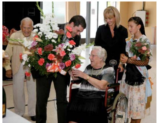
350 persones es van aplegar al dinar de germanor, on es van fer entrega de regals a l'home i la dona de més edat.