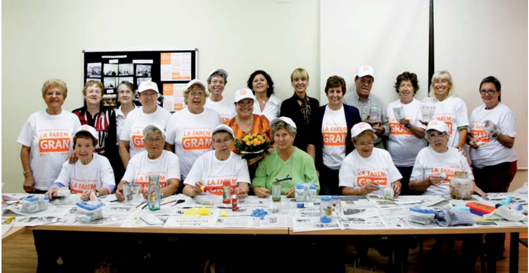
La creativitat i les manualitats es van conjugar al taller de decoració de pots de vidre.