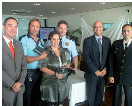
Distincions als policies pels 10 i 20 anys de servei al cos

També es va reconèixer el treball d'entitats o institucions que durant l'any han col·laborat amb el cos local, com són els Voluntaris Nou Vents, amb el suport als actes a la via pública, i l'Ajuntament de Cabrera amb motiu de la coordinació, aquest estiu, dels actes que es van fer a la platja per la Festa Major de Sant Joan.