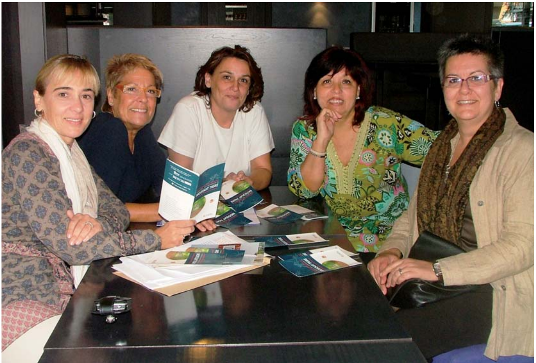
Reunió de la regidora de Sanitat amb les floristes

La flor natural no és incompatible amb el mosquit tigre sempre que es prenguin les mesures adequades. Aquest és el missatge que volen transmetre les floristes del poble, que, gràcies a una iniciativa de la regidoria de Sanitat de l'Ajuntament de Vilassar de Mar, utilitzaran aigua tractada amb larvicida en l'elaboració dels rams de flors.