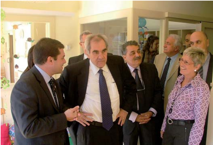
Recorregut de les autoritats per l’interior del centre

continuar amb el nostre projecte educatiu i vetllar pel desenvolupament dels infants en un marc de convivència i aprenentatge”. Finalment, el conseller d’Educació, Ernest Maragall, va destacar la qualitat del nou equipament i de l’educació que s’imparteix.