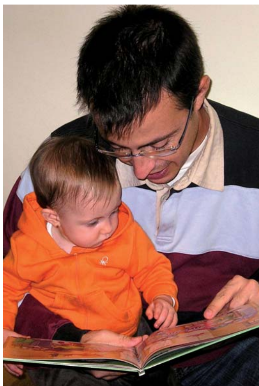
Llegir crea un vincle afectiu entre adults i petits

"Nascuts per llegir" té com a objectiu conscienciar els pares i mares del benefici de la lectura. Explicar o llegir un conte ajuda a millorar la relació entre pares i fills, estimula el plaer d'escoltar, imaginar, crear i el d'aprendre. Més informació sobre el projecte als webs: www.nascutsperllegir.org i www.vilassardemar.cat .