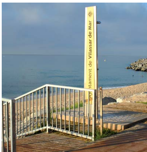
Noves dutxes i escales que arriben fins a la sorra.

Des de la comissió de platges es destaquen actuacions que s'han dut a terme, com ara que s'han pintat tots els bancs del passeig, s'han instal·lat papereres noves, s'ha arranjat el parc infantil i la jardineria, s'han canviat totes les rajoles malmeses, i que totes les escales s'han fet arribar a la sorra de la platja.