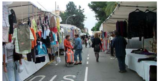
Mercat setmanal dels dijous