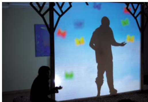
"En el jardín", joc d'ombres i dibuixos, dirigit a la petita infància.

amb intensitat. Els carrers i places estaven plens d'infants amb titelles a les mans, ja fossin comprats a la fira d'artesans o fets als tallers.