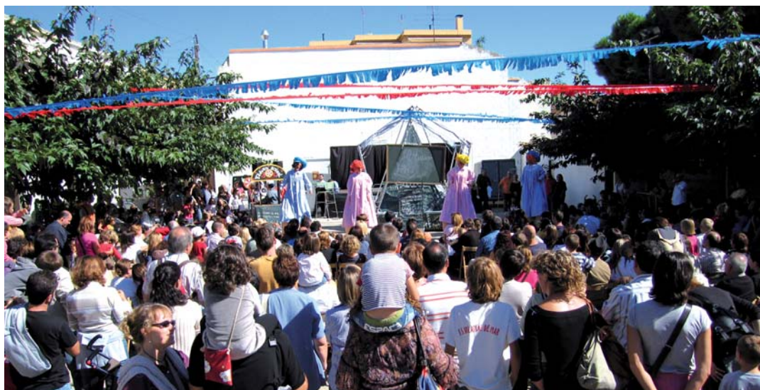
La plaça del Círcol, plena de goma a gom en un dels espectacles.