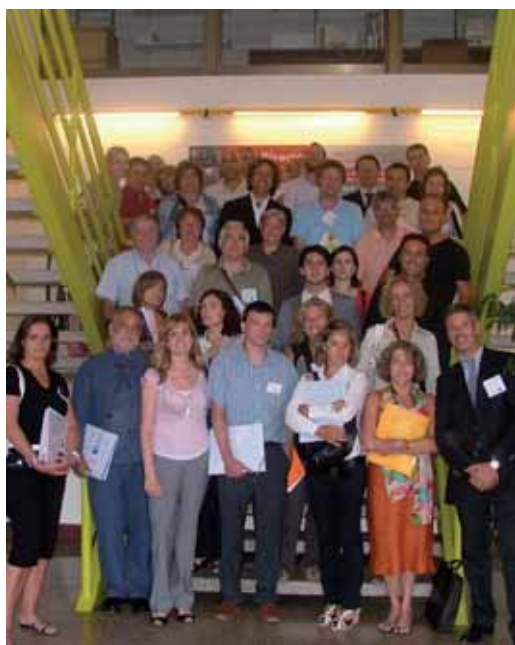
Grup de participants

La jornada es va desenvolupar al Mercat de Flor i Planta Ornamental de Catalunya. Els participants, durant les quatre hores de la jornada, van gaudir d'una conferència i després d'entrevistes curtes per conèixer a altres empresaris del municipi amb els quals establir els primers contactes per a possibles relacions comercials. La realització de la jornada ha estat possible gràcies a la col·laboració del Banc de Sabadell, que ha patrocinat de l'acte, el Mercat de Flor i Planta Ornamental de Catalunya, que ha facilitat espai i infraestructures i la patronal PIMEC.