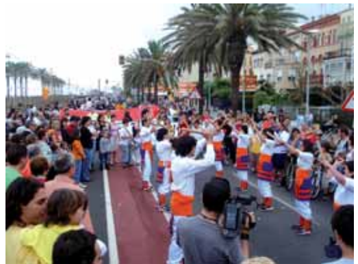
La colla Picadits va actuar al tall

D'altra banda, els alcaldes de Vilassar de Mar, Premià de Mar, Cabrera de Mar i el Masnou, dies abans del tall havien signat un manifest conjunt que sol·licita a la Generalitat un estudi per valorar que la N-II es converteixi en una via cívica, amb la mínima presència possible de vehicles. Els alcaldes creuen que s'han d'avaluar adequadament totes les alternatives que hi ha damunt de la taula, incloent-hi la que preveu la gratuïtat total i per a tothom de l'autopista del Maresme. També exigeixen un estudi tècnic i rigorós que inclogui una anàlisi dels usuaris de la C-32 i de l'N-II, la capacitat màxima de l'autopista i la necessitat de construir-hi laterals.