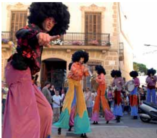
Cercavila per animar l'inici de festa