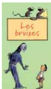
Portada del llibre "Les Bruixes"

El taller de lectura s'adreça a nens i nenes de 9 a 12 anys, en un format diari d'una hora i mitja, en què s'enllaçaran lectures de fragments, jocs, petits tallers i on tots els assistents rebran una pista per a la sessió del dia següent. L'objectiu, expliquen des de la biblioteca, no és llegir tot el llibre, sinó obrir la gana a la lectura, divertir-se i donar l'oportunitat de descobrir móns nous dins d'altres llibres.