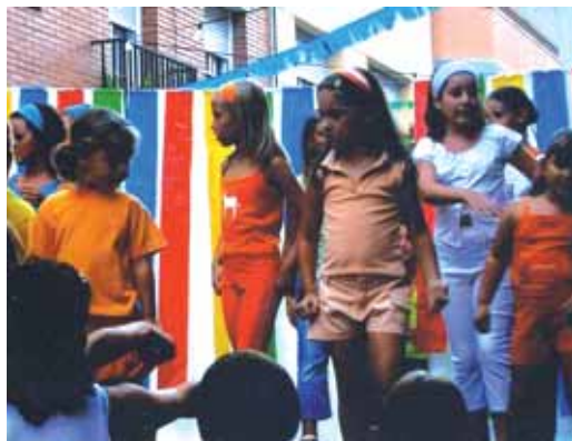
Enguany les festes del carrer Sant Llorenç compleixen 10 anys

Els jocs per als infants, els sopars i dinars de germanor i els balls són activitats que afavoreixen aquesta interrelació.