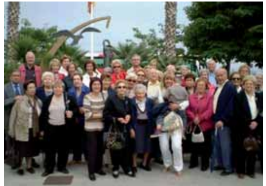
Sortida cap al Parlament de Catalunya

CÀRITAS PARROQUIAL TÉ UN NOU HORARI: DIMARTS DE 15.30 A 16.30H