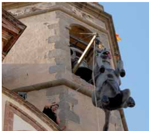
Penjada de l'ase Innocenci, tret de sortida a la festa