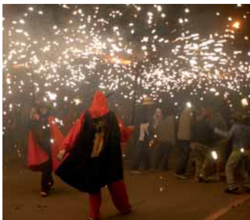
El correfoc, diversió assegurada