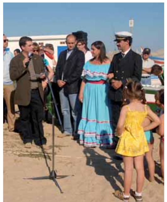
Les autoritats municipals van rebre el Pigat i la Lucía a la platja