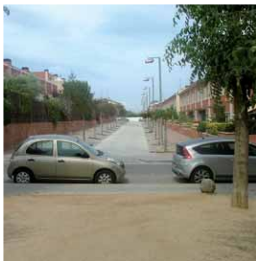
S'urbanitzarà seguint la línia del tram entre Migjorn i riera d'en Cintet que es veu al fons de la imatge

Actualment consta d'un passatge central de sauló i dues voreres laterals amb dues fileres d'arbres i enllumenat viari. Amb la reforma s'enderrocarà l'actual pavimentació, i es retirarà l'arbrat existent i es projectarà una vorera al costat sud de 3,70 m d'amplada, amb un passatge central de les mateixes dimensions, un parterre inclinat de 2m d'amplada i una vorera al costat nord també de 2 m.