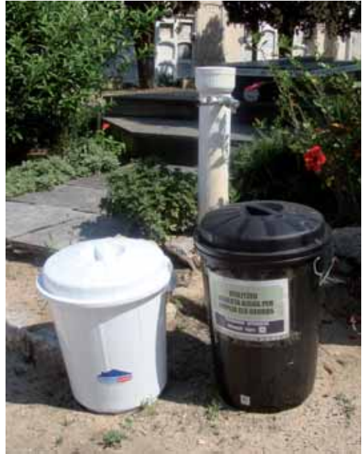
Bidons d'aigua amb larvicida per als usuaris del cementiri

El mosquit tigre ( Aedes albopictus ) és una espècie d'origen asiàtic que nidifica en qualsevol bassa d'aigua artificial petita i estancada, com jardineres, bidons o plats de testos de plantes, entre d'altres recipients domèstics. És un insecte que provoca picades molt molestes i que poden causar reaccions al·lèrgiques. Darrerament s'ha vist que pot transmetre una malaltia anomenada "Chikungunya" que provoca febres altes i artràlgies invalidants transitòries.