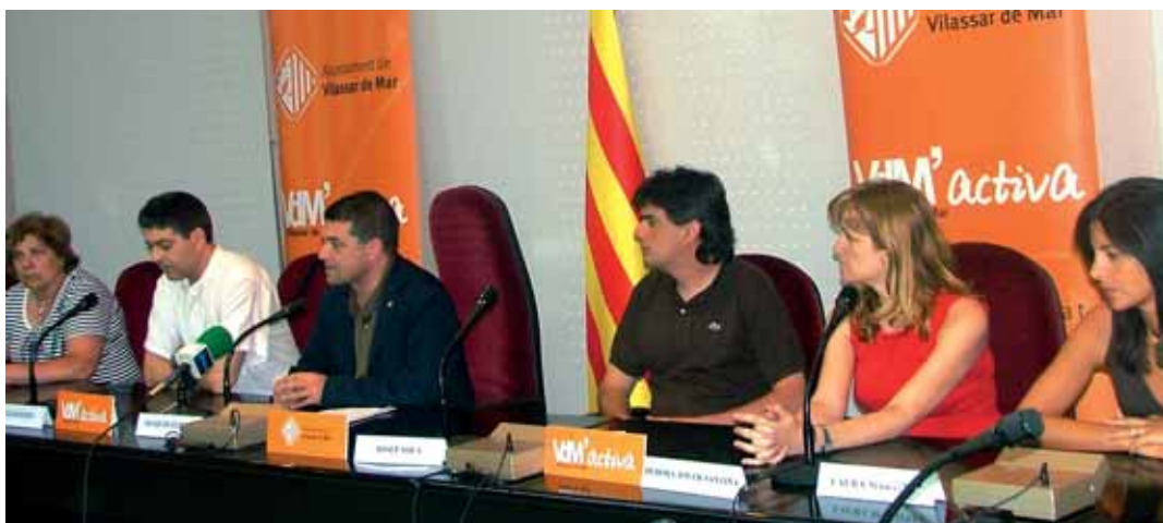
Presentació als mitjans de comunicació

Vilassar de Mar es va convertir els dies 11, 12 i 13 de juliol en la capital de l'slot. Centenars d'aficionats i públic en general es van donar cita en l'Slot Meeting 2008, l'esdeveniment que té com a objectiu promoure l'slot com a activitat socioesportiva.