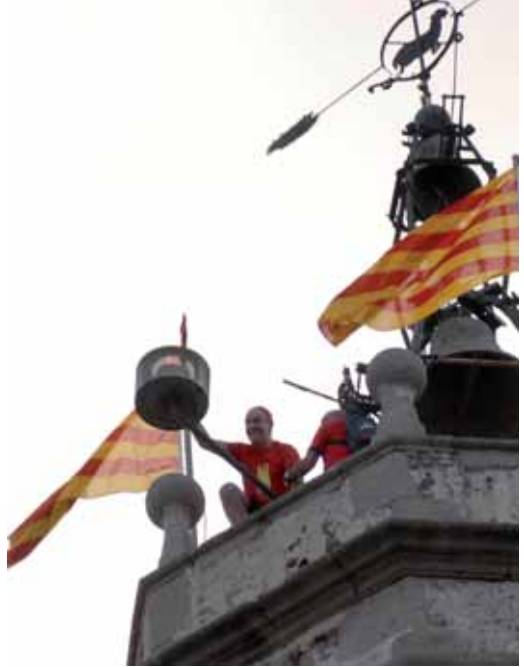
La flama del Canigó, al peveter de l'església