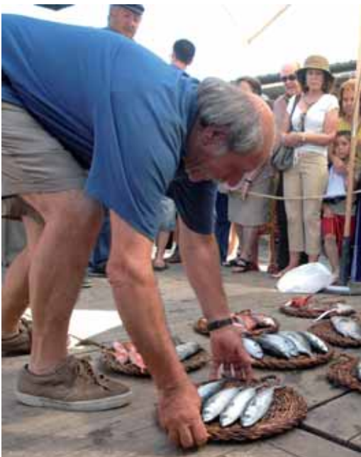
Subhasta de peix, per recordar les arrels marineres de la vila