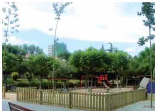
Tancament a la plaça Joan Monjo