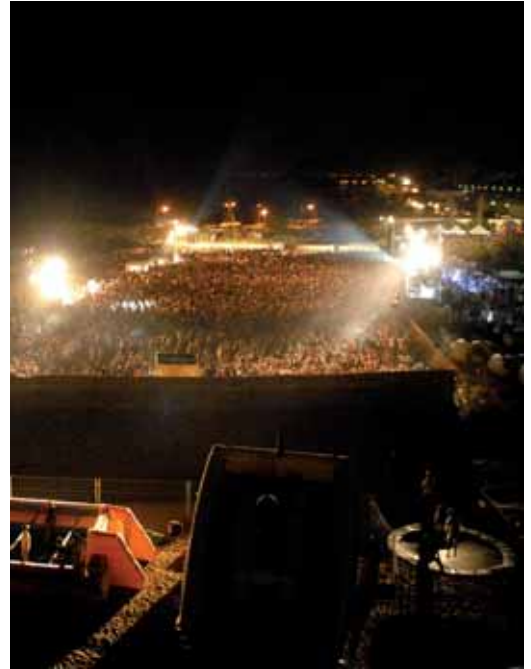
El Summer Festival va omplir de gom a gom. Bona música en un marc inoblidable