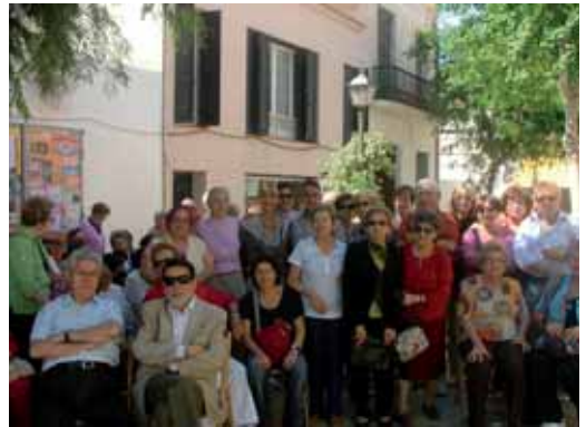
La regidora amb un grup d'avis durant la celebració a la plaça de l'Era

Durant el curs s'han realitzat tallers de la memòria, el curs treballem el cos i la ment, el de piscina, el de tai-txi, el d'informàtica i el de manualitats, tots ells amb l'objectiu de millorar la qualitat de vida de la gent gran. També s'han programat diferents sortides, una d'elles al Parlament de Catalunya.