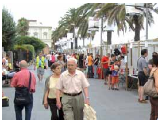
Fira de col·leccionisme al carrer Sant Pau