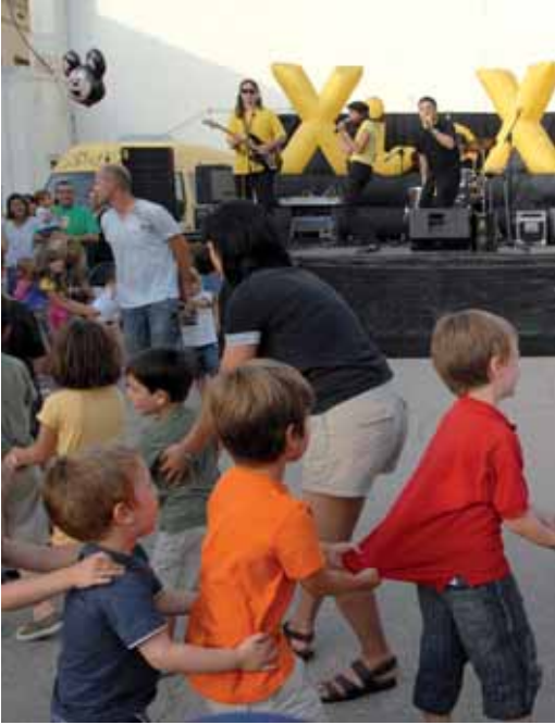
Els infants van gaudir d'espectacles a la seva mida