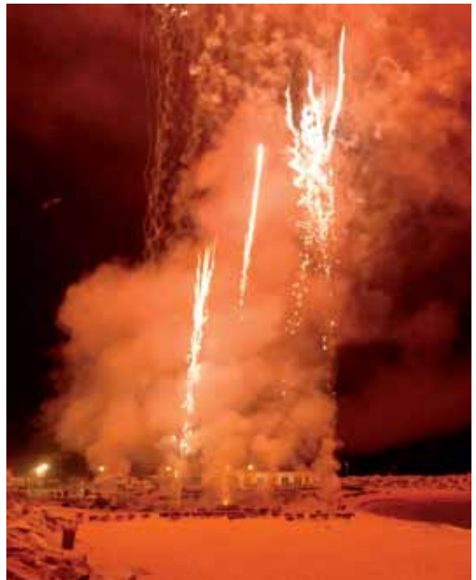
Els focs a la platja, els més espectaculars