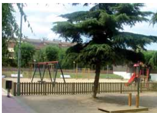
Tancament a la plaça Andreu Teixidó