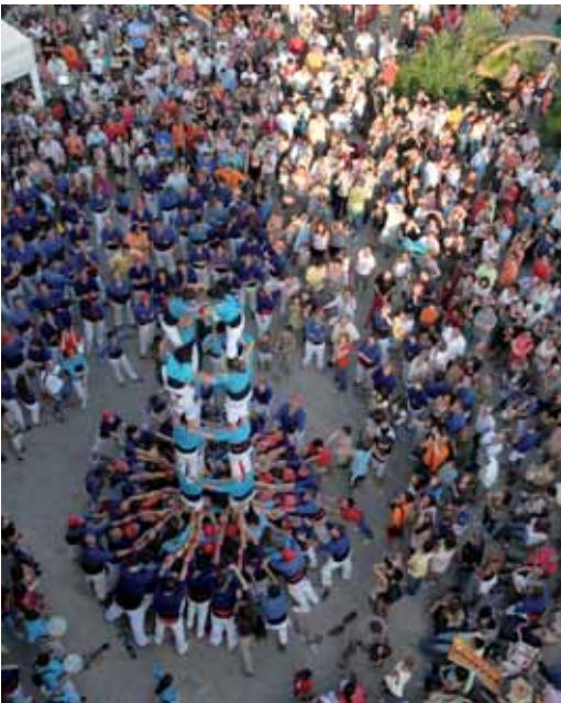
Els castellers van omplir la plaça de l'Ajuntament