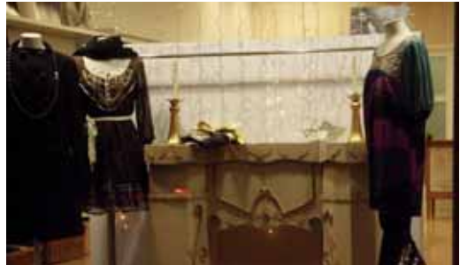
Lider dona, botiga premiada al concurs d’aparadors