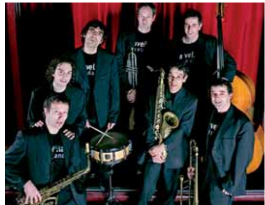
La Vella Dixieland

el 18 d'abril; i l'espectacle musical “Wimoweh” del grup L'Auditori Educa, el 16 de maig.