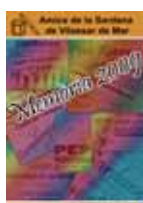
Portada de la memòria

A la revista es pot trobar la informació sobre totes les audicions i activitats realitzades durant l'any 2009 amb fotografies, així com elements del "Calendari de la cultura tradicional viva segons Joan Amades", folklorista