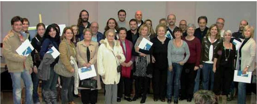
Grup de premiats al sorteig de Vilassar Comerç