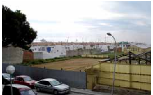
Terreny on s'està construint la nova bressol

natural. La previsió és que pugui entrar en funcionament el proper curs escolar. Amb aquest nou centre, Vilassar de Mar comptarà amb 246 places públiques de llar d'infants, pràcticament es doblaran les 130 que hi havia fa dos anys. Les places quedaran distribuïdes entre el nou centre que ara està en construcció i l'escola bressol municipal de l'avinguda Eduard Ferrés, 168.