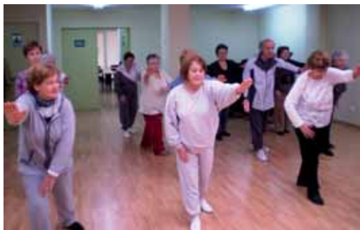
Participants a les classes de tai-txi

taller "Lliçons de vida", el taller de teatre i el de "Fent Amics". A més, també segueixen les xerrades mensuals sobre temes diversos al centre social Mossèn Josep Maria Galbany, al carrer Sant Roc.