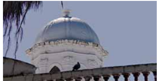
Detall de la cúpula de can Bisà

al 14 de febrer l'exposició “B/B. Una lectura juxtaposada, dues ciutats”, resultat del projecte interdisciplinari de cooperació entre la Facultat de Belles Arts de la Universitat de Barcelona i la de Berlín.