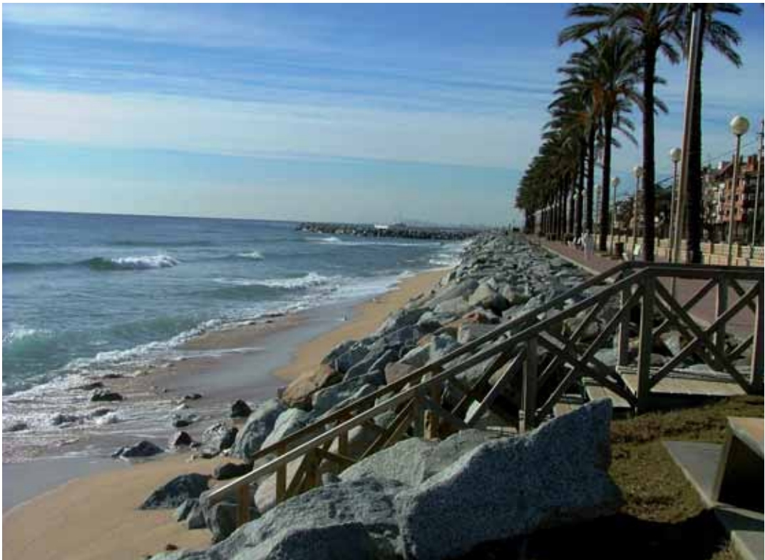
Aspecte de la platja, de davant de l'Ajuntament, al mes de gener

siguin tant efímeres com la reposició de la sorra. L'única solució que fins ara s'ha rebut en el tema de la pèrdua de sorra a les platges del Baix Maresme han estat els transvasaments de sorra anuals (per mar o per terra), una opció molt cara i totalment efímera, ja que abans que arribin els primers temporals bona part de la sorra ja ha desaparegut de les platges.