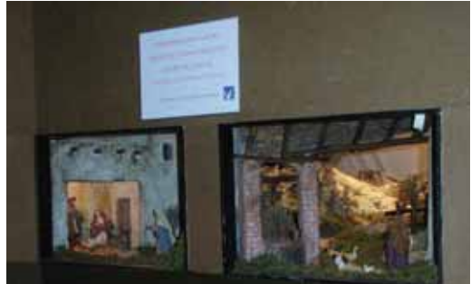
Pessebre de Nadal