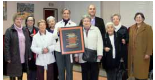
Les puntaires entreguen la peça

Passeig, del Centre Cívic Lluís Jover i Aula 4 que han fet diferents treballs amb puntes de coixí que un cop units han donat com a resultat una peça que destaca per la combinació de colors.