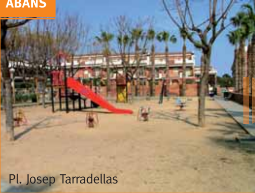
Pl. Josep Tarradellas