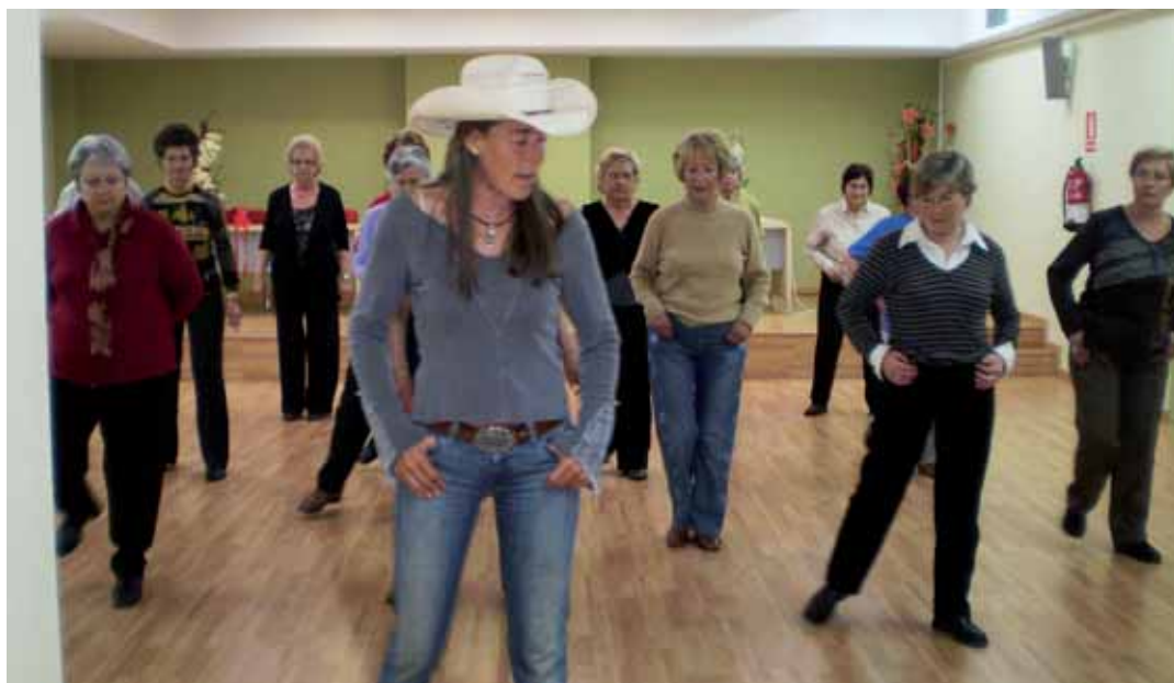
Assistents a les classes de country