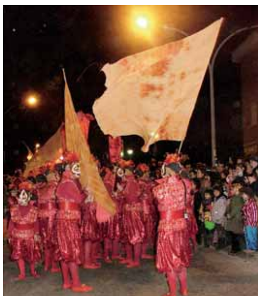
Comparsa guanyadora del primer premi l'any passat

Les comparses que vulguin participar a la rua poden consultar les bases de participació al web municipal www.vilassardemar.cat . El Carnaval infantil a la plaça Picasso obrirà els actes el dissabte 13 de febrer, i posteriorment tindrà lloc un dels actes més multitudinaris tant pel nombre de comparses com pel públic que s'hi aboca, la rua i el ball de disfresses. Diumenge 14 de febrer tornarà el Carnestoltes del Firobi, adreçat als més menuts, i el dimarts 16 de febrer, ho farà el ball dels mamarratxos, que es va recuperar l'any passat, i on la clau està en amagar la identitat i que ningú sàpiga qui és qui. L'enterrament de la sardina, el dimecres 17 de febrer, posarà el punt i final a la celebració en què la disbauxa i el bon humor prenen protagonisme.