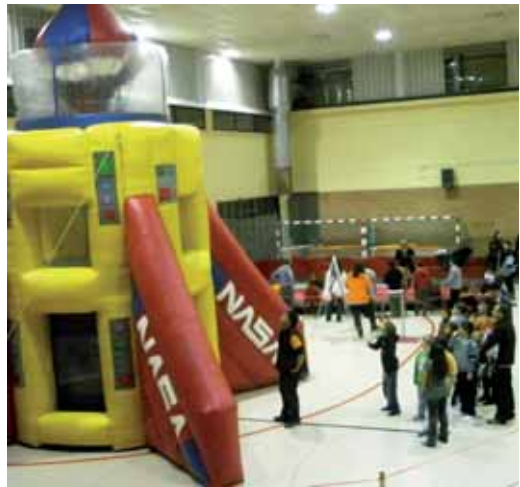
3.450 persones van passar pel Juga-Juga, el parc infantil de Nadal que del 27 al 30 de desembre va omplir de propostes lúdiques el Pavelló d'Esports Municipal