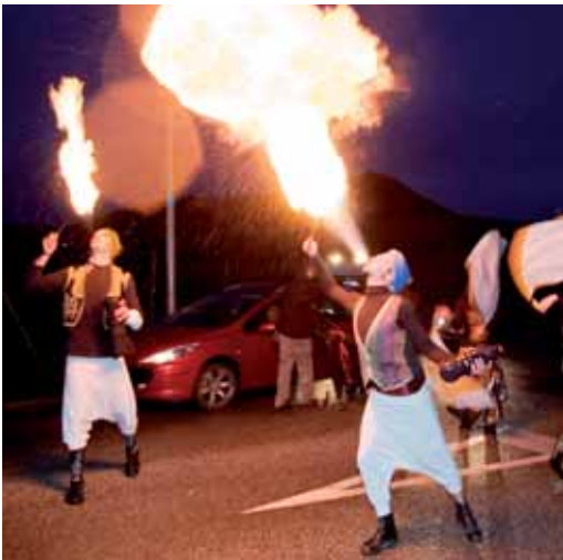
Un grup d'escupfocs i malabaristes van formar part del seguici

de l'Ajuntament es van projectar diverses parts de la Cavalcada, amb imatges en directe i d'altres en diferit, amb l'objectiu d'amenitzar l'espera del públic. Les imatges també es podien veure per internet a través del web municipal www.vilassardemar.cat i vilassardemar.tv .