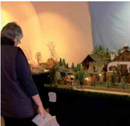
L'exposició de pessebres del grup de pessebristes de la parròquia comptava amb pessebres i diorames de diferents estils, mides i materials, entre ells un naixement de puntes de coixí