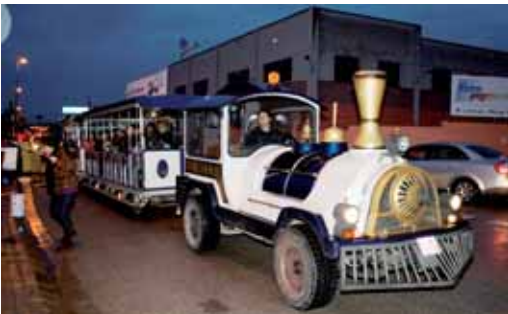
El trenet de Vilassar Comerç va formar part de la Cavalcada

“Molt positiva”. Així valoren des de Vilassar Comerç la campanya comercial de Nadal, que ha tingut una bona participació tant per part del públic com per part dels comerços associats. La campanya ha comptat amb el trenet de Nadal, un concurs d’aparadors i el sorteig de 30 premis de 200 euros en xecs de compra.