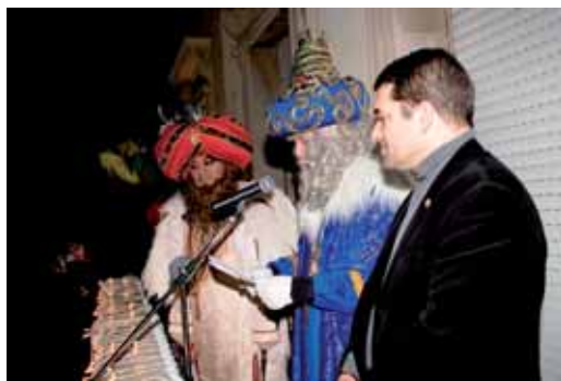
Els tres Reis acompanyats per l'alcalde al balcó de l'Ajuntament