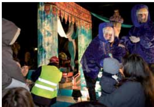
Els infants viuen la màgia de ben a prop