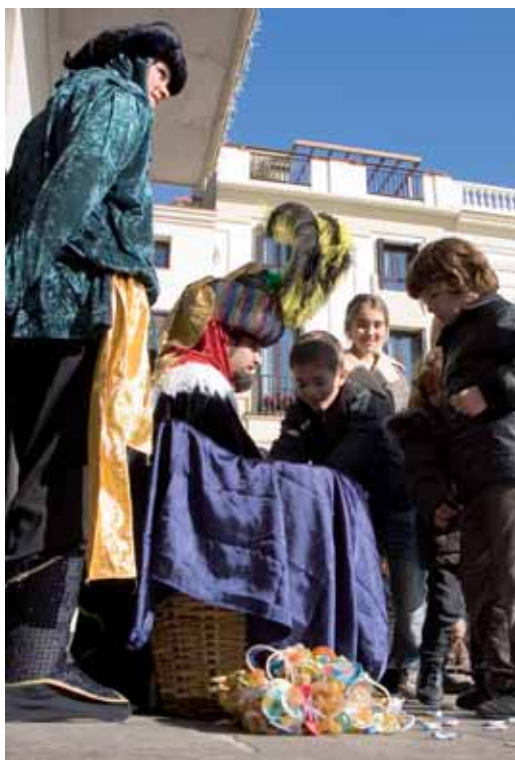
El Carter Reial va recollir, dies abans a la Cavalcada, les cartes dels infants

alumnes de les escoles. Melcior, en representació dels tres Reis, des del balcó del consistori, va dirigir-se als nombrós públic que s'esperava a la plaça. Va començar el seu discurs agraint la rebuda dels vilassarencs, i va demanar als nens i nenes que fossin bons i es portessin bé. Seguidament, els Reis van entrar en contacte directe amb els més menuts,