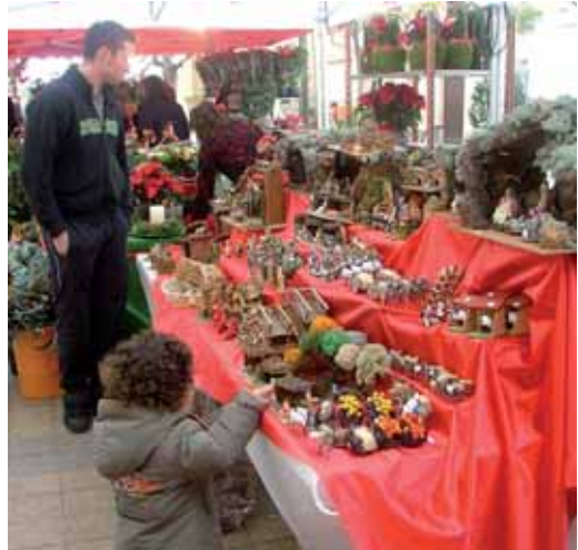
El 12 i 13 de desembre el nucli antic es van convertir en un aparador de productes relacionats amb el Nadal. La Fira de Nadal va aplegar una quarantena de paradetes, una trentena de les quals eren de comerços vilassarencs