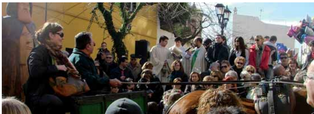
La benedició dels animals al carrer Sant Joan

carruatges, encapçalada per la imatge de Sant Antoni, iniciarà el recorregut per diferents carrers: Torrent de les Tartanes, Maria Vidal, Sant Genís, Escultor Monjo i Montserrat. Des d'allà començaran les tres voltes. La benedició dels animals es realitzarà com cada any al carrer Sant Joan, a l'altura de la plaça de l'Església. Durant el recorregut es vendran els típics tortells de Sant Antoni.