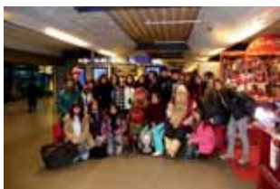
L'arribada a Helsinki, on el Pare Noel els va rebre a l'aeroport

Els alumnes van viatjar a Vaala, a 3.000 quilòmetres de casa nostra. Durant la seva estada, van anar a l'institut del poble finlandès, van visitar la ciutat d'Oulu, i van viatjar a la capital de la Lapònia, Rovaniemi, on van fer activitats al museu