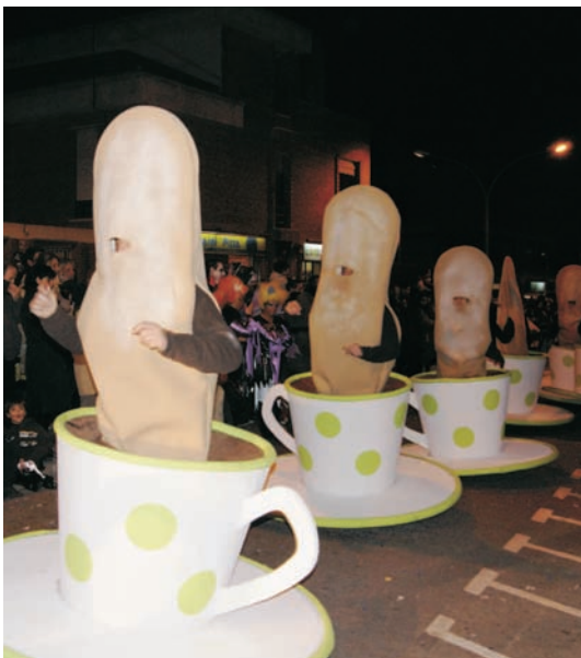
Comparsa guanyadora del primer premi, l'any passat

En cas de mal temps, els espectacles infantils es traslladaran al Pavelló d'Esports Municipal