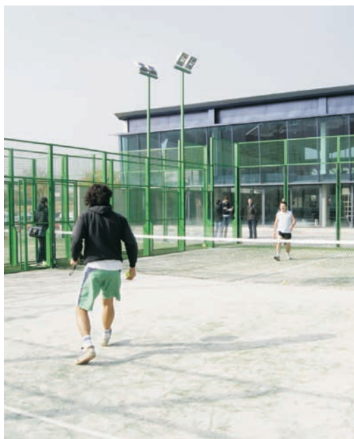
Els usuaris ja gaudeixen de les instal·lacions

es pot fer per telèfon, presencialment a la recepció del centre, i en breu, per Internet. El pressupost de l'actuació ha estat de 150.000 €, finançats per l'Ajuntament.