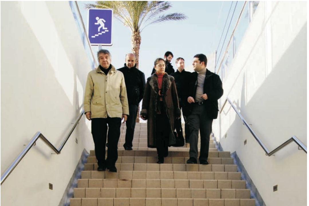
L'alcalde i el cap de la Demarcació de Costes, al nou pas