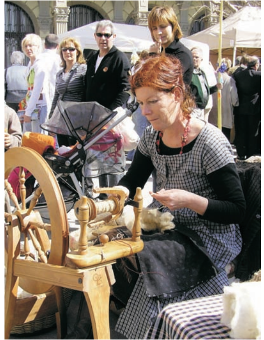
Mostra d'oficis en directe

La fira, de 9.30 a 14.30 hores, permetrà veure, tastar i comprar diferents productes artesans. Entre les diferents parades hi haurà de bijuteria, fusta, ceràmica, tèxtil, alimentació, i també es faran demostracions en directe d'oficis artesans com la filadora i el vidrier, entre d'altres. L'any passat hi van participar prop d'una trentena d'artesans.