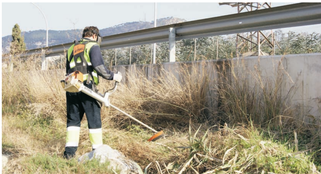
L'operari actuant a la Riera de Cabrils

Els operaris ja han realitzat la neteja de la Riera d'en Cintet i continuen l'actuació a la Riera de Cabrils i la Riera de Vilassar de Dalt, al seu pas per tot el poble.