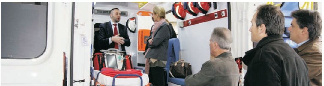
L'interior de l'ambulància

L'ambulància ha costat 38.800 euros i ha estat finançada amb fons propis de la Creu Roja.