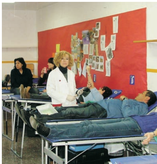
L'any passat van donar sang més de 300 persones

L'any passat van donar sang un total de 353 persones, i el repte d'enguany és superar aquesta xifra. Durant dotze hores ininterrompudes, de 10 del matí a 10 de la nit, es podran fer les donacions, a més de participar en les nombroses activitats que han organitzat conjuntament el Banc de Sang i Teixits, l'Ajuntament i les entitats del poble. Per donar sang només cal tenir més de 18 anys i pesar 50 kg o més.