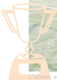
L'alcalde, acompanyat de diferents regidors, visitant les noves pistes