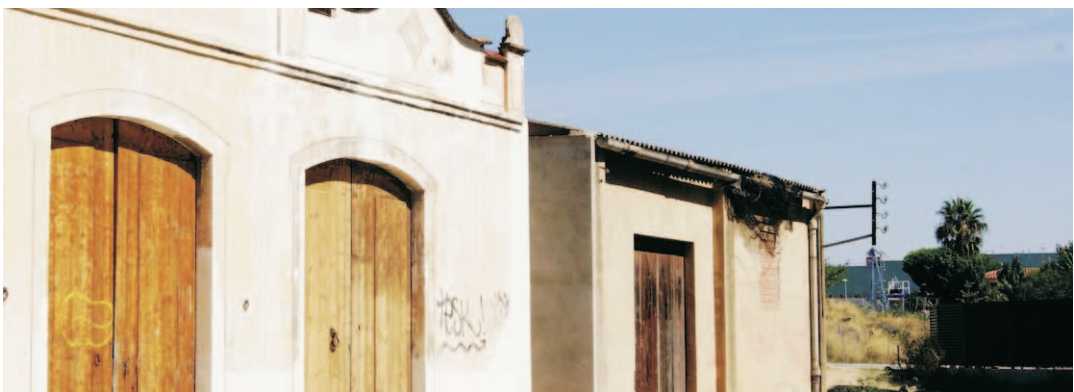
Can Bisa i la nau annexa que s'adjudica al Piri