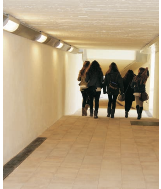
El pas s'ha condicionat i prolongat fins el passeig Marítim

L'actuació ha consistit a prolongar el pas actual fins fer-lo arribar al passeig Marítim i adequar el que ja hi havia i que només arribava a l'estació de tren. A més, el pas s'ha fet accessible per a persones amb mobilitat reduïda amb la instal·lació de dos ascensors, un al carrer Sant Jaume i l'altre al passeig Marítim.