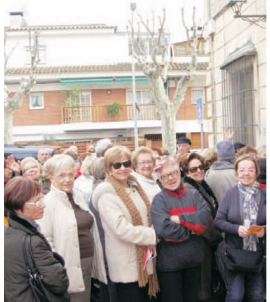
Les inscripcions es van fer a l'Escola Nàutica

Les inscripcions es van fer els dies 19 i 20 de gener. 192 persones es van apuntar a diferents tallers i cursos, 100 persones ho van fer per la sortida que es farà a El Molino i 30 per anar al Museu del Barça. La resta de persones, fins arribar a les 400, són les que ja estan fent alguna de les activitats en curs, com ara piscina o country.