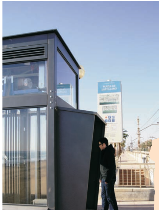
L'ascensor de la banda del passeig Marítim

Amb els ascensors, l'accés del nucli urbà al passeig Marítim és més fàcil i còmode.