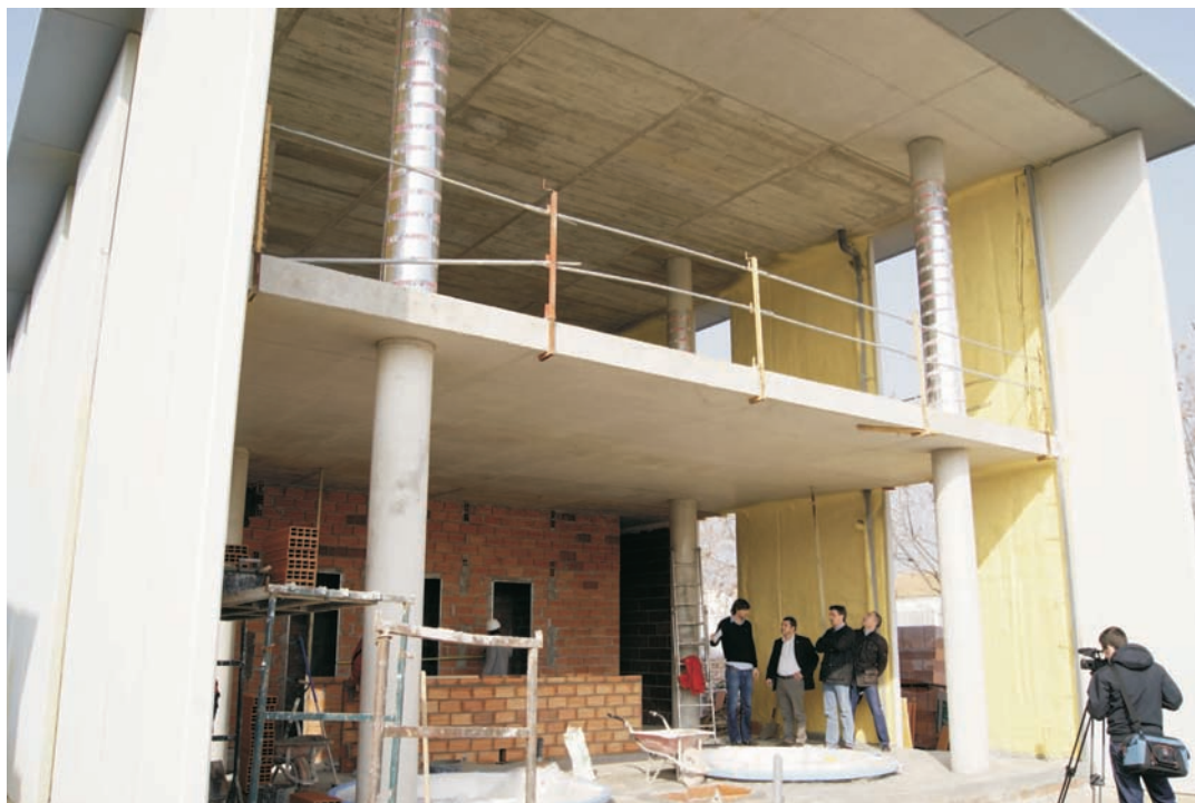
Les obres de l'edifici annex, a bon ritme

D'altra banda, les obres d'ampliació de la piscina amb la construcció d'un edifici annex, de 600 m 2 distribuïts en dues plantes, avancen a bon ritme. La previsió és que en un mes i mig l'obra pugui estar enllestida i donar servei de wellness als usuaris: dos spa, sauna, bany de vapor, pediluvi, passadís nebulitzador d'aigua, cabines d'hidromassatge, sala de relax amb llits tèrmics i sales per a massatges i tractaments corporals. A la planta de dalt del nou edifici es traslladarà la sala cardiovascular i els aparells de fitness, que actualment ocupen el hall de la piscina, i se'n renovarà i ampliarà el nombre i tipus.