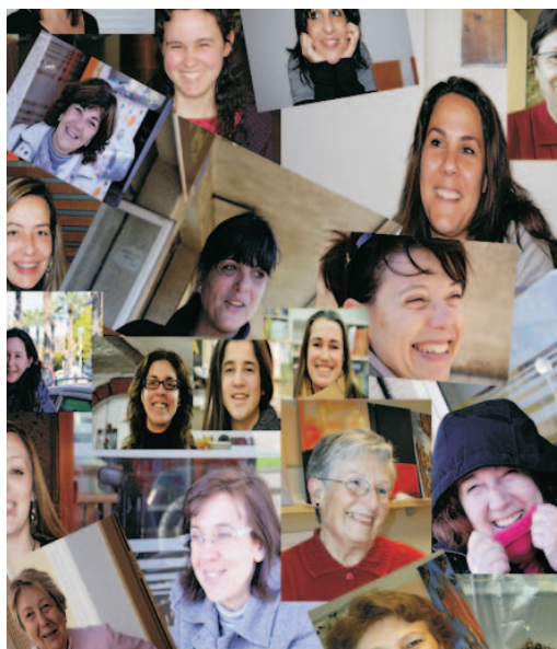
Cartell de l'exposició

La mostra, amb el somriure de dones com a protagonista, es podrà visitar els dissabtes d'11 a 14 h i de 17 a 20 h, i els diumenges, d'11 a 14 h.