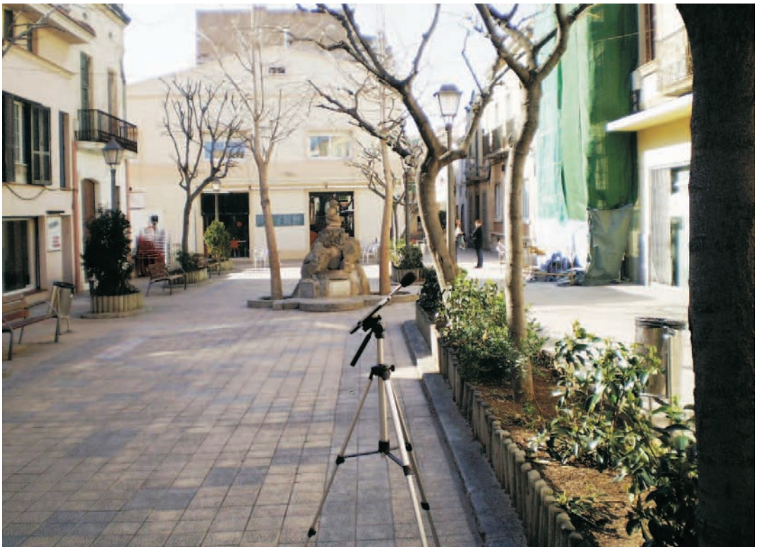
Un dels mesuraments a la plaça Àngel Guimerà

L'elaboració del mapa està finançada per la Diputació de Barcelona.