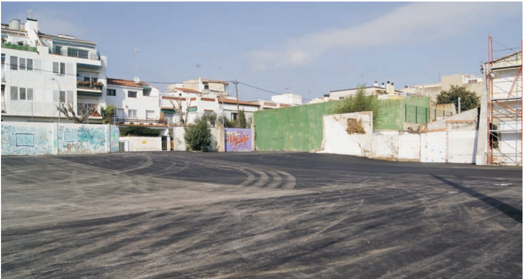
El terra del solar ja està asfaltat

L'Ajuntament pagarà un lloguer mensual per l'ús del solar que servirà per pal·liar la manca d'aparcament en aquesta zona del municipi.