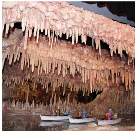
El pessebre monumental d'enguany

20 h, amb premis per als guanyadors i guanyadores i sorteig de material d'slot entre les persones participants. Aquell mateix dia, a partir de les 18 h, el Carter Reial de SM els Reis d'Orient farà la seva aparició a Vilassar de Mar per recollir les cartes de les nenes i nens de la vila. Ho farà, com ja és tradició, a cavall, des de la plaça Vicenç Martí fins a la plaça de l'Ajuntament, i un cop allà atindrà als infants que s'hi acostin.