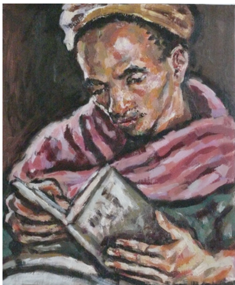
El lector, una de les pintures de l'exposició

vegada que Mariné exposa al Monjo, al 2011 va presentar Imatges d'Etiòpia .