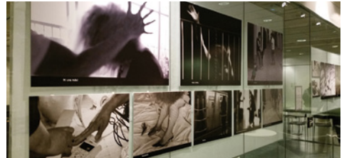
Exposició No, de Viladona