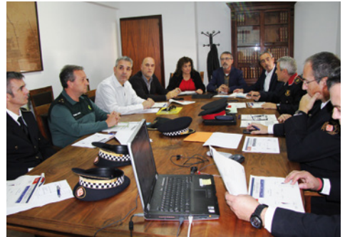
Assistents a la Junta Local de Seguretat

de tot Catalunya. Tant la Policia Local com els Mossos d'Esquadra, que treballen de forma conjunta aquest tema, van destacar que ho tenen com a una de les seves principals prioritats i demanen la col·laboració ciutadana que consideren imprescindible per prevenir i investigar aquest tipus de delictes.