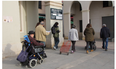
Mou-te: participants al recorregut adaptat

El web municipal disposa d'un apartat dedicat al PMUS on s'explica què és i els seus objectius, es detalla el procés de participació que s'està desenvolupant i on també es pot consultar el document de la diagnosi de mobilitat complet i una síntesi: www.vilassardemar.cat/pmus .