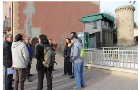
Mou-te: participants al recorregut a peu