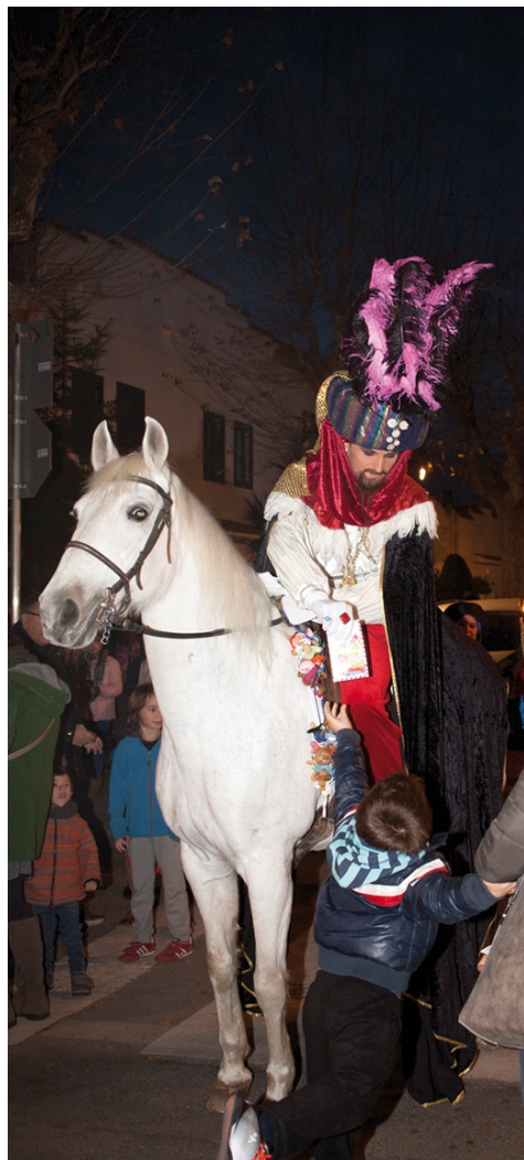
El Carter Reial arribarà el 27 de desembre

Amb l'encesa de llums de Nadal, el 4 de desembre, els carrers de Vilassar de Mar respiren ambient nadalenc pels quatre costats. Després de la fira de Nadal i nit de botigues obertes, el passat dia 12, s'han programat diferents activitats per part de l'Ajuntament i entitats, que fan que la màgia d'aquestes festes s'encomani a grans i petits.