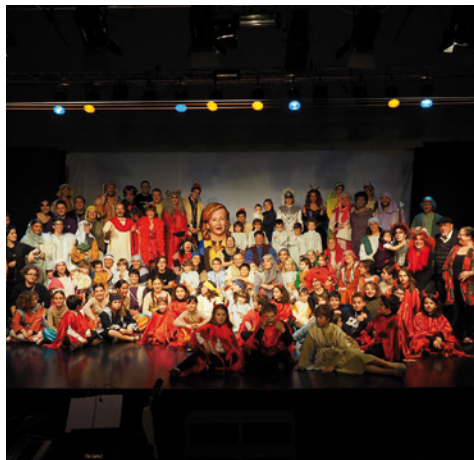
Els Pastorets de La Tropa