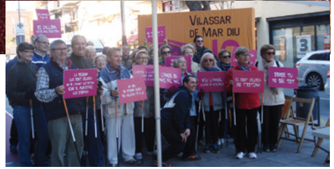
Photocall amb missatges contra la violència

Vilassar de Mar va organitzar diferents activitats amb motiu del Dia Internacional per a l'eliminació de la violència envers les dones amb l'objectiu de posar de manifest el rebuig a aquesta xacra social. Cinema, una exposició, una paradeta informativa amb photocall inclòs, la lectura del manifest, un taller de moviment expressiu, un vermut popular i un concurs d'Instagram van ser algunes de les propostes.