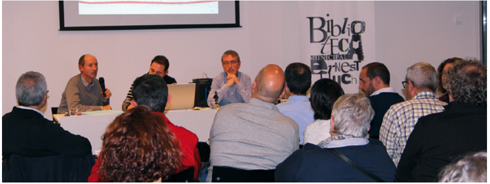
Presentació de la diagnosi

L'1 de desembre es va presentar a la ciutadania la diagnosi del Pla de Mobilitat Urbana i Sostenible (PMUS) del municipi, que l'Ajuntament amb el suport de la Diputació de Barcelona està elaborant per definir quines estratègies i accions s'han de desenvolupar a Vilassar de Mar en els propers anys per aconseguir un model de mobilitat sostenible, segur i integrador.