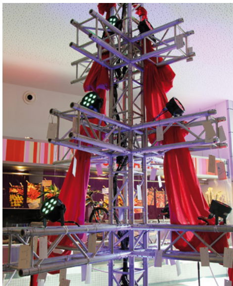
Arbre dels desitjos, al Mercat

que comprin, es repartiran butlletes per participar en el sorteig de 3.000 €, amb 15 premis de 200 € en xecs-compra. A més, per al 3 de gener al matí, han preparat un conjunt d'activitats infantils en tres escenaris, la rambla del Veral de l'Ocata, la plaça de l'Era i la plaça Jeroni Gelpí.