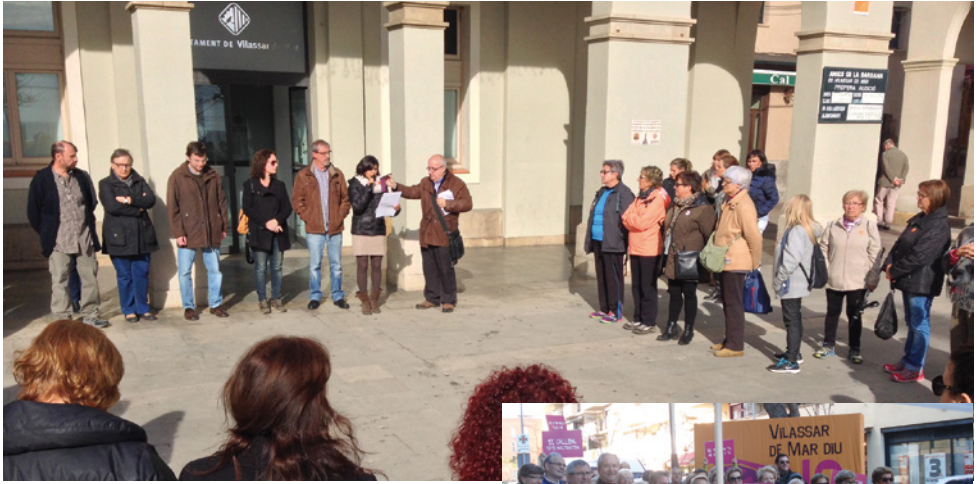
Lectura del manifest a la plaça de l'Ajuntament

Vilassar de Mar va organitzar diferents activitats amb motiu del Dia Internacional per a l'eliminació de la violència envers les dones amb l'objectiu de posar de manifest el rebuig a aquesta xacra social. Cinema, una exposició, una paradeta informativa amb photocall inclòs, la lectura del manifest, un taller de moviment expressiu, un vermut popular i un concurs d'Instagram van ser algunes de les propostes.