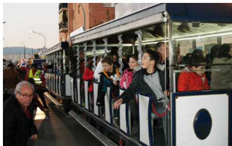
Trenet de Vilassar Comerç

Vilassar Comerç i el Mercat Municipal tenen en marxa les seves campanyes comercials de Nadal. Vilassar Comerç bateja la seva campanya com un 'Nadal de somni' i inclou a més d'activitats infantils, el tradicional trenet i el sorteig de 3.000 € en xecs de compra. El trenet, que va començar el dia 12, continuarà els dies 22, 23, 24, 28, 29, 30 i 31 de desembre i els dies 2, 3, 4 i 5 de gener, i es podrà pujar amb el tiquet que es reparteix amb les compres a les botigues associades. Alhora, entre les persones