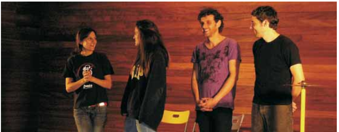
Representació a l'Institut Vilatzara

genera un debat perquè els estudiants participin i resolguin una situació que proposin els actors en què els joves es poden sentir identificats, com ara què fer si un està begut i vol portar a un amic en moto. Que els joves puguin prendre decisions de manera responsable sobre les drogues és un dels objectius de l'espectacle.