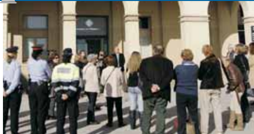
Lectura del manifest de rebuig a la violència de gènere

VdM TV Podeu veure la notícia a VdM*TV: http://tv.vilassardemar.cat