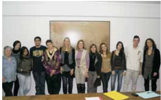
La regidoria d'Ensenyament, el personal municipal de Joventut i Ensenyament i les directores dels dos instituts amb els alumnes participants

d'orientació educativa i laboral. Els tallers finalitzaran el 15 de juny.