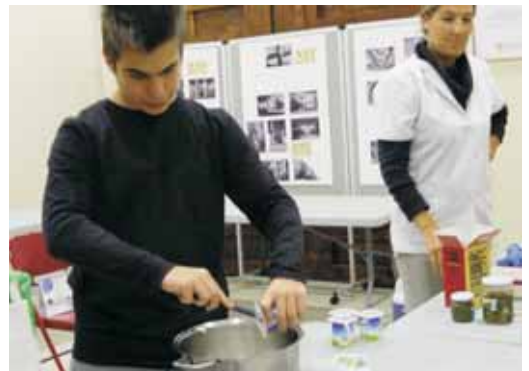
Els joves van aprendre a fer un menú sencer

L'Ajuntament, amb el suport de la Diputació de Barcelona, va organitzar el taller "Cuina sense pares", adreçat a joves a partir de 14 anys, amb l'objectiu d'introduir-los en el món culinari i promoure una alimentació saludable. El taller es va fer el 28 de novembre a can Jorba. També es va donar a conèixer el web www.cuinasensepares.cat amb consells i propostes de menús setmanals per motivar els joves a posar-se el davantal.