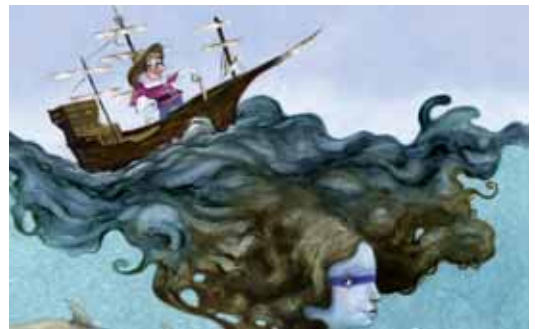
Part d'una il·lustració de Roger Olmos