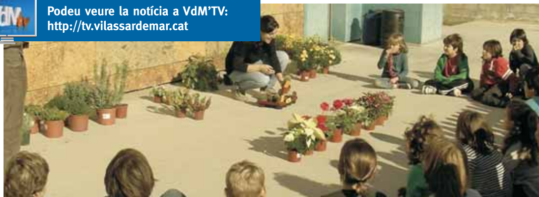
Xerrada sobre les plantes dels nostres horts i jardins a l'escola Pla de l'Avellà

Podeu veure la notícia a VdM'TV: http://tv.vilassardemar.cat