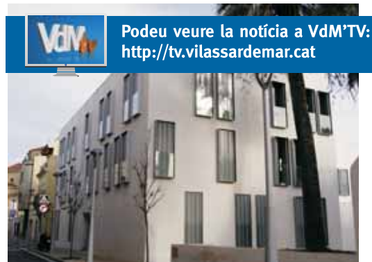
Els 14 habitatges de promoció pública de l'illa de can Bisa