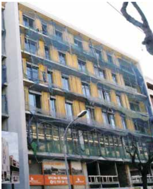
L'obra entra en la fase d'acabats

Des de l'Ajuntament s'espera que la nova construcció es converteixi en un nou centre d'activitat i de vida tant per als vilatans com per als futurs veïns, empreses i comerços.