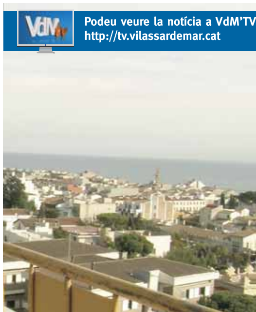
Les vistes dels habitatges que donen a mar