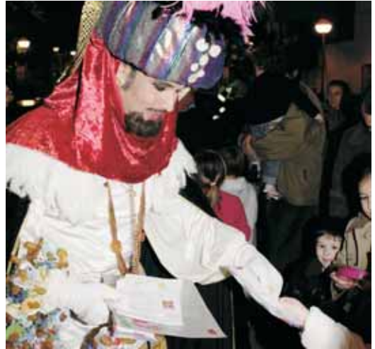
El Carter Reial arribarà el 29 de desembre

El 5 de gener és el dia màgic de la Cavalcada. Començarà a 2/4 de 6 de la tarda i seguirà l'itinerari d'anys anteriors, omplint-lo de molt color! Des del polígon industrial sortiran les carrosses dels tres Reis i la seva comitiva de patges, acompanyats per carrosses d'entitats del poble, el trenet de Vilassar Comerç i un nombrós grup de voluntaris. Baixaran per l'avinguda Montevideo, Narcís Monturiol, la carretera de Cabrils, el carrer Santa Maria, la Via Octaviana, i els carrers Sant Genís, Sant Josep, Enric Granados, Colom i Sant Joan, fins arribar a la plaça de l'Ajuntament. Pel camí, però, faran aturades al Casal de Curació i a la Casa Pairal on els esperarà la gent gran d'aquests centres. També s'aturaran a l'església parroquial per adorar al nen Jesús i després seguiran a peu el recorregut per un "sorprenent" carrer Sant Joan fins a l'Ajuntament. Des del balcó del consistori saludaran a tota la població i els expressaran els seus desitjos. Després arribarà un dels moments més entranyables. Els tres Reis baixaran a la haima instal·lada a la plaça de l'Ajuntament i els infants que ho vulguin podran parlar directament amb ells i lliurar-los les seves cartes en mà.