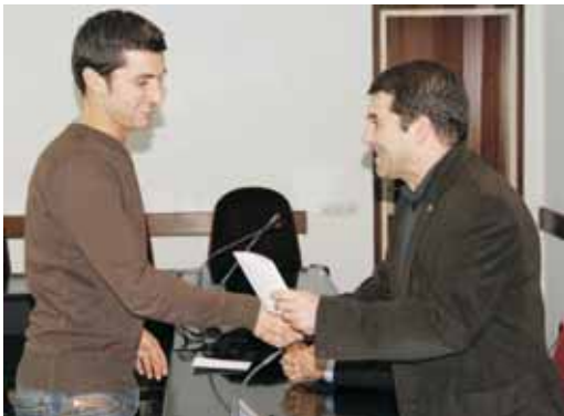
L'alcalde lliura una de les claus

La promoció pública consta de dos edificis. En el del carrer Montserrat, núm. 10, hi ha vuit habitatges distribuïts en planta baixa i dues plantes de 3 i 2 dormitoris, amb superfícies entre els 54 i els 83 m 2 . A l'edifici del carrer de la Pau, núm. 1, hi ha sis habitatges distribuïts en dues plantes de 2 i 3 dormitoris, amb superfícies entre els 60 i els 81 m 2 .