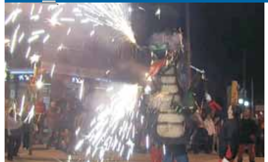
El drac Cremavila