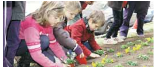
Els infants es van implicar en la plantada

El programa 'Viles Florides, una aposta per millorar la nostra qualitat de vida', és una iniciativa de la Confederació d'Horticultura Ornamental de Catalunya (CHOC), que aglutina la major part del sector de la flor i la planta ornamental, i té com a objectiu reconèixer i distingir els municipis que apostin pels espais verds i enjardinats per a millorar el benestar dels ciutadans.