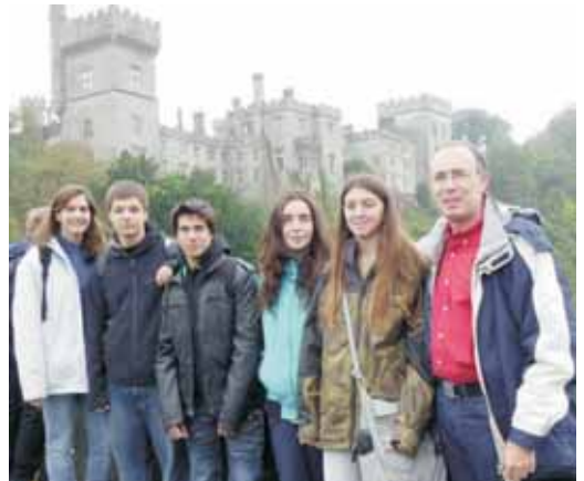
El grup de l'institut visitant un castell a Irlanda

En aquest projecte cada país tracta el tema d'una o diverses llengües minoritàries a través de tres documentals. Els joves vilassarencs van triar Montserrat, la Vall d'Aran i Andorra. Han visitat l'Abadia de Montserrat i la biblioteca privada que conté el primer document escrit en català que s'ha trobat (el Forum Iudicum) i han fet un reportatge sobre la llengua i cultura de la Vall d'Aran i d'Andorra. També han estat al nord de Noruega, on es parla la llengua sami, a l'oest de Bulgària i a la zona gaèlica d'Irlanda.