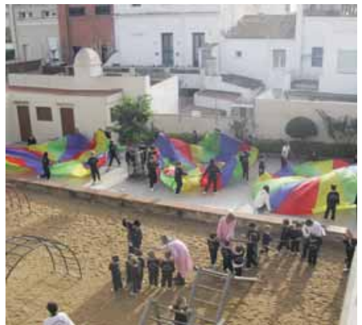
Vista aèria del pati amb diferents propostes de joc

El 21 de novembre el pati de l'escola es va convertir en l'escenari de diferents jocs per endinsar els nens i nenes en el coneixement de la comarca a través dels seus productes alimentaris. Els alumnes de sisè de primària van ser els encarregats d'organitzar diferents jocs per a la resta d'estudiants amb l'objectiu de donar a conèixer productes autòctons de la comarca com el vi d'Alella, el tomàquet pometa, el pèsol de Sant Andreu de Llavaneres, la cirera d'en Roca d'Arenys de Munt, el maduixot del Maresme, la petxina lluent i el calamar d'Arenys de Mar, i la torronada i el formatge farcell, de Vilassar de Mar. Vuit productes de la terra emmarcats en vuit propostes de joc per difondre també bons hàbits d'alimentació i consum entre els infants.