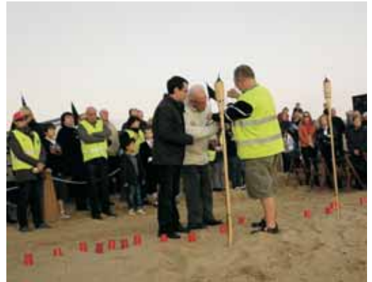
Cada torxa simbolitzava una de les víctimes

L'acte d'homenatge a les víctimes del temporal, organitzat per l'Ajuntament, va comptar amb el suport de Bricbarca, la parròquia de Sant Joan, els Pescadors de l'Espigó de Garbí, La Tropa Teatre, el Pubillatge de Vilassar de Mar i els Voluntaris Nou Vent.