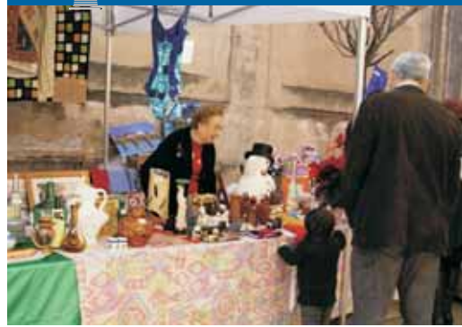
La tómbola solidària del taller de reciclatge

VdM TV Podeu veure la notícia a VdM*TV: http://tv.vilassardemar.cat