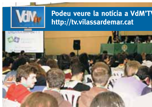
Podeu veure la notícia a VdM*TV: http://tv.vilassardemar.cat

Escoltes Catalans, l'associació laica de l'escoltisme català, aplega 4.000 infants i joves repartits en una quarantena d'agrupaments en dotze comarques catalanes.