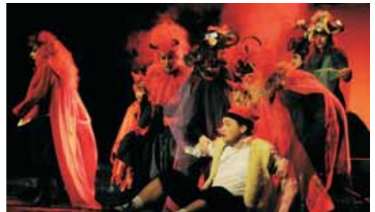
Espectacle dels Pastorets interpretat per la Tropa, any passat

L'obra més representada per Nadal, Els Pastorets, també es podrà veure al municipi. La versió de Folch i Torres és la que interpretarà durant quatre dies La Tropa Teatre a l'Ateneu Vilassanès: el 26 de desembre a les 20 h, i l'1, el 7 i el 8 de gener a les 19 h. La de Ramon Pàmies es representarà en dues ocasions de la mà de l'Associació Cultural Nats el 51, a can Madrona: el 14 de gener a les 22 h i el 15 de gener a les 19 h.