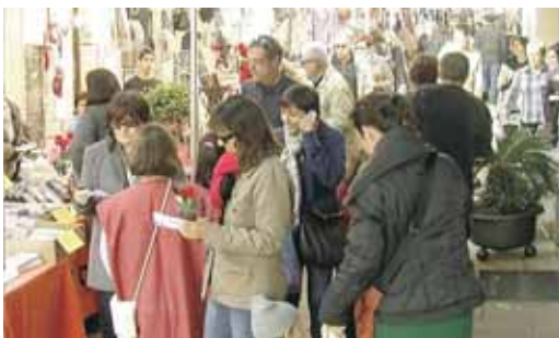
La Fira de Nadal es va omplir de públic

Un altre moment destacat de les activitats nadalencques arribarà el 24 de desembre a les 18 h amb el cagatió a la plaça de l'Ajuntament. Amb uns avis i un nét entranyables, els infants de Vilassar de Mar reviuran aquesta tradició i podran fer cagar el tió a cops de bastó. La Regidoria de Festes Populars també és l'encarregada de tenir-ho tot a punt per a l'arribada dels Reis de l'Orient. Prèviament, però, el Carter Reial recollirà les cartes dels infants de Vilassar de Mar. Serà el 29 de desembre i com ja és tradició farà un recorregut a cavall des de la plaça Vicenç Martí fins a la plaça de l'Ajuntament. Serà en aquest punt, a les 18.30 h, on recollirà les cartes amb les peticions dels més menuts.