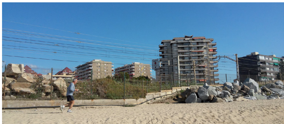
Tram del passeig que queda tallat a l'altura de la Ronda Vilassar