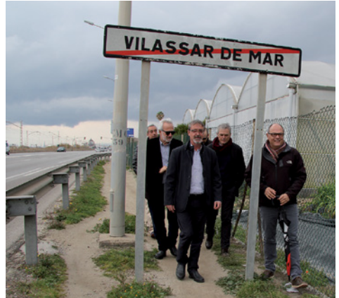
Visita sobre el terreny

D'altra banda, els consistoris veïns també estan d'acord en millorar el camí que, a la banda interior de la carretera N-II, uneix el barri de Can Pou-Camp de Mar, de Premià de Mar, amb el Mercat de Flor i Planta, a Vilassar de Mar, un camí molt freqüentat sobretot els diumenges quan es fa el mercat a l'aire lliure a l'exterior de les instal·lacions del Mercat de Flor. Els consistoris volen consolidar aquest camí per tal de millorar la seguretat dels vianants que el transiten.