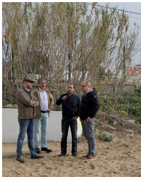
Els alcaldes i els regidors de Territori dels dos pobles

A ningú se li escapa que el passeig Marítim és un espai molt transitat, principalment el cap de setmana, per persones que passegen o practiquen esport corrent o en bicicleta. El passeig Marítim de Vilassar de Mar no està connectat amb el de Premià de Mar, una reivindicació històrica que els dos consistoris veïns volen solucionar. Per