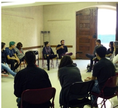
Trobada del passat 3 d'abril a can Jorba

La Regidoria de Joventut ha posat en marxa un projecte de participació perquè el jovent pugui expressar les seves inquietuds i participi en el contingut del proper Pla de Joventut. Per fer-ho, el primer que s'ha fet és saber què vol el jovent, fent arribar un qüestionari als grups de batxillerat dels instituts i a les entitats on hi participa gent jove. Amb les respostes dels diferents col·lectius, el passat 3 d'abril es va organitzar una trobada a can Jorba i es va constituir l'anomenat grup motor. La missió del grup serà la creació d'un format de Regidoria de Joventut més obert al poble i al seu jovent i la reflexió de temes puntuals diversos que l'Ajuntament o el col·lectiu de joves consideri prioritari. La intenció és que formin part d'aquest grup joves amb edats compreses entre 16 i 30 anys que hagin format part d'algun projecte per a joves del sector de la cultura i l'art, l'esport, casals juvenils o educatius, de forma directa o indirecta.