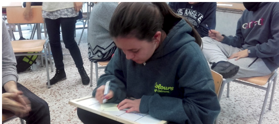
Una de les sessions de treball als instituts

Efecte Jove és el nom del projecte que posa en marxa la Regidoria de Joventut amb l'alumnat de 1r de batxillerat dels instituts perquè s'impliquin amb el municipi. Hereu de l'Ajuntament Jove, del que es tracta és que els joves desenvolupin dos projectes vinculats amb allò que no els hi agrada del seu entorn i que poden contribuir a transformar, provocant un efecte en la societat, d'aquí el seu nom. Les sessions de treball als instituts van començar a finals de març, amb la crea-