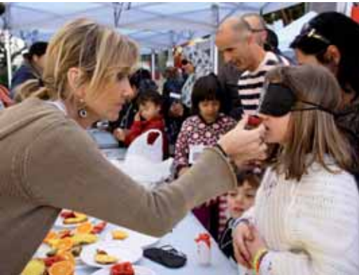
Les AMPES de totes les escoles van organitzar tallers adreçats als infants per explicar, de forma divertida i amb jocs, hàbits saludables. Més de 1.500 persones van assistir a la festa de la Setmana de la Salut.