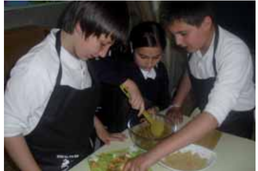
Els centres educatius, durant tota la setmana, van fer activitats especials amb els seus alumnes per transmetre'ls hàbits saludables.