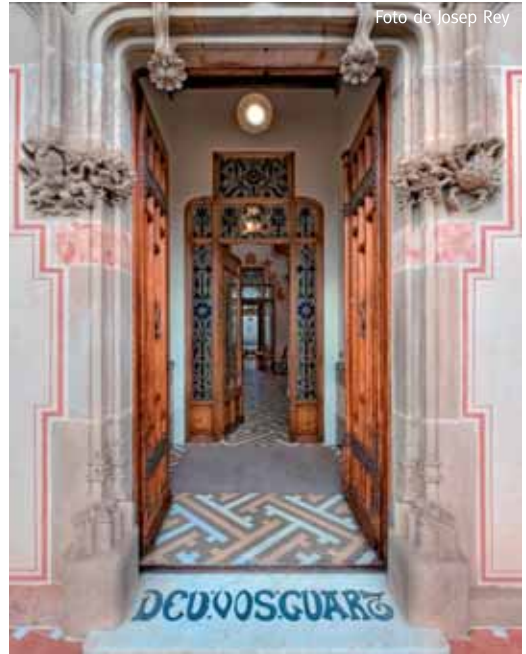
Entrada de can Bassa

L'exposició constitueix una oportunitat única de veure l'interior d'aquesta joia del modernisme vilassarenc a través dels ulls de Josep Rey, que el 2009 va rebre el prestigiós LUX or del premi nacional de fotografia professional, i alhora comprovar com l'arquitecte Cristian Cirici ha sabut combinar la reforma d'una casa centenària amb les necessitats d'una família del segle XXI, respectant i posant en valor aquest patrimoni.