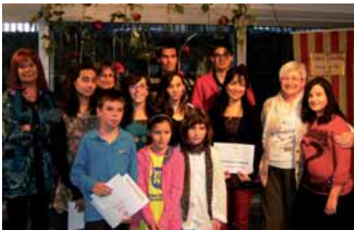
Grup de premiats amb la regidora de Cultura

Els treballs guanyadors participaran en la Mostra Literària del Maresme, la fase comarcal del concurs, i l'Ajuntament els editarà a la tardor en un llibret.