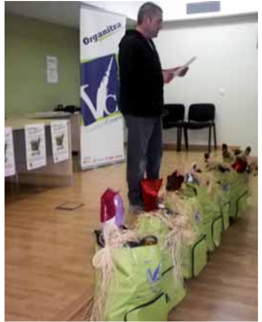
El vocal de Vilassar Comerç amb els “carrets delicatessen”

Des de l'abril i fins a l'octubre els comerços associats sortiran al carrer els primers dijous i divendres de cada mes.