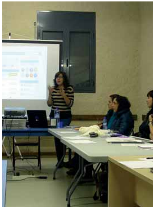
Tallers dirigits als joves