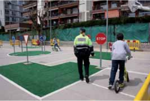
Un circuit d'educació viària amb la Policia Local i la col·laboració de Corriol va servir per explicar als infants els principals senyals de trànsit que s'han de tenir en compte a l'hora de circular.