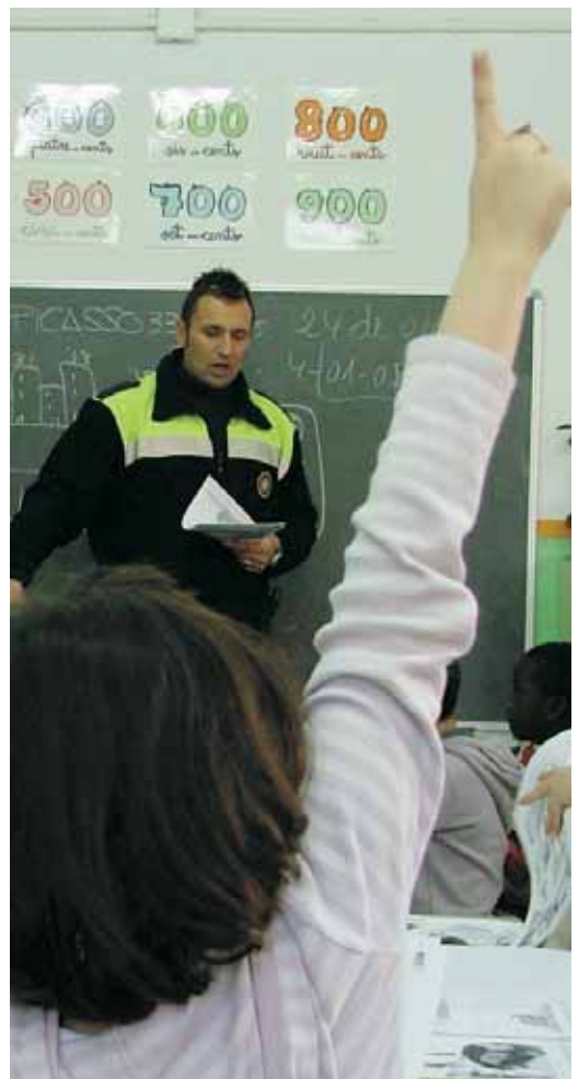
Classes educació viària

En aquest cas, l'aportació que fa l'Ajuntament supera la que fa la Generalitat, que és qui en té competències. És aquí on la Regidoria va fer la proposta de passar dels 79.860,58 euros del 2011 a 72.684,54 euros per a aquest 2012, una