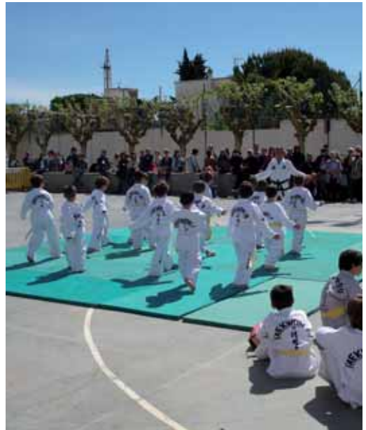
Durant la festa de la Setmana de la Salut diferents entitats esportives van fer exhibicions i van donar l'oportunitat de practicar esports ben diversos: judo, patinatge, hoquei i bàsquet.