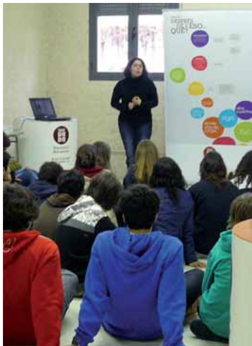
Xerrada de l'exposició "I després de l'ESO què?"

En l'àmbit 'Informació i qualitat de Vida', el Servei Municipal d'Informació Juvenil ha donat resposta a les consultes dels joves d'entre 14 i 35 anys