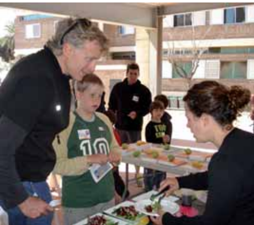
Diferents restauradors van fer tallers i receptes en directe per posar a l'abast de tothom la cuina saludable.