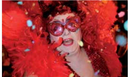
Fotografia guardonada amb el 1r premi

El primer premi (250 €) va ser per a la imatge sense títol presentada per Soledad Pacheco, el segon premi (150 €), per a “Arlequines”, de Margarida Vernetta, i el tercer premi (100 €), per a “L'altra cara del carnaval”, de Mireia Marimon. El premi especial a la millor fotografia presentada per un menor de 16 anys (càmera digital compacta) va ser per a “Brillaré, amb llums de tots els colors”, de Clara Córdova. Fins al 15 d'abril una selecció de les fotografies presentades al concurs van estar exposades a l'espai Foto Bisa.