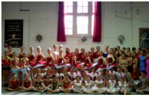
Alumnes de l’escola de dansa Madó

segons premis i 11 tercers premis. D’altra banda, en el concurs de ballet Ciutat de Torrelavega, de les set alumnes que participaven, tres van arribar a la semifinal i dues a la final.