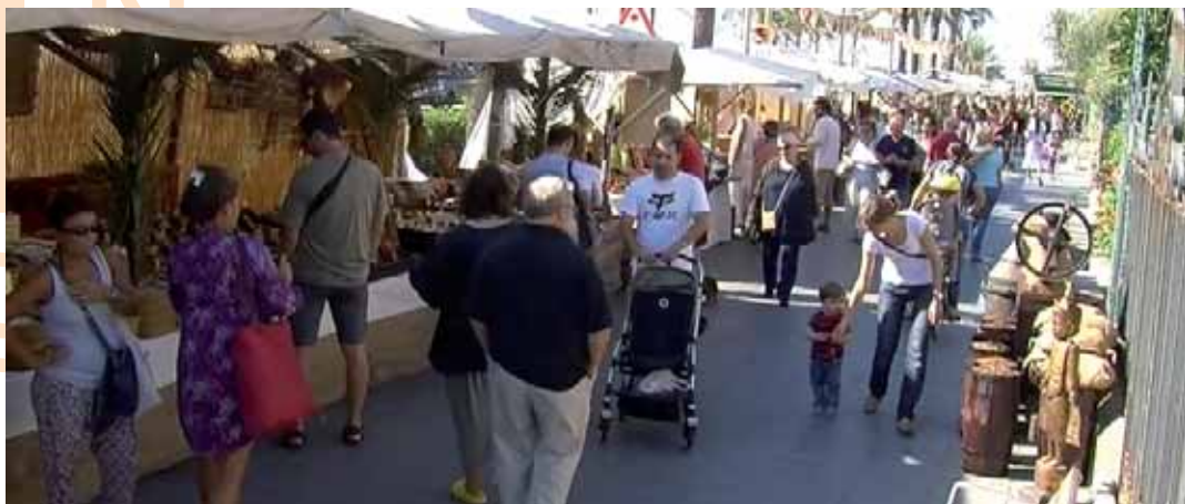
Mercat amb productes d'ultramar, any passat

Les inscripcions per participar a la visita guiada de la ruta d'indians (20 de maig, a les 17 h) o embarcar-se amb el vaixell Sant Ramon (20 de maig, al matí) s'obriran el 10 de maig, són limitades i es tancaran quan es cobreixin totes les places. Les persones interessades en la visita guiada s'han d'inscriure enviant un correu electrònic a vinesqj@vilassardemar.cat , i les que vulguin embarcar-se al Sant Ramon, al correu vergessa@vilassardemar.cat .