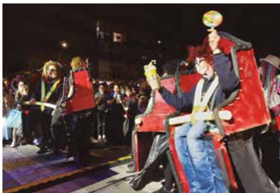
El grup 'S'emballa', que imitava la famosa atracció de Port Aventura, se'n va endur el primer premi del concurs de disfresses