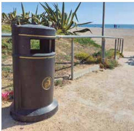
Les noves papereres per controlar rosegadors

Aquesta mesura s'uneix al control periòdic de rosegadors que efectua l'Ajuntament tant al clavegueram municipal com als espais públics.