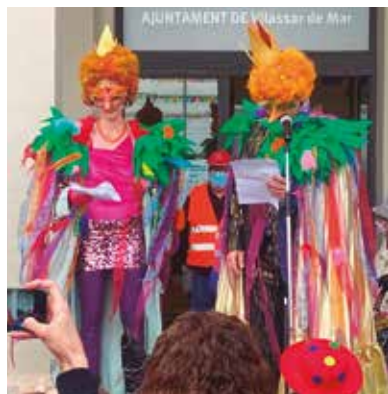
El Rei Carnestoltes i la Reina del Carnaval llegeixen el seu pregó a la plaça de l'Ajuntament

El Rei Carnestoltes i la Reina del Carnaval van tornar enguany a Vilassar de Mar per recuperar les tradicions d'aquesta festa de la disbauxa que la pandèmia de la covid-19 va arraconar l'any passat. El ball i el concurs de disfresses van ser els dos plats forts d'aquesta celebració, que us resumim en imatges a continuació.