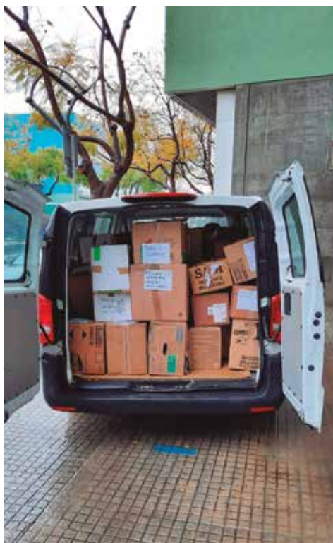
Una de les furgonetes de la caravana

De tornada, la caravana, integrada per diversos vehicles i persones de diferents municipis del Maresme i de la costa barcelonina, té la intenció de portar cap a Catalunya prop de 200 persones d'Ucraïna, la majoria de les quals ja tenen una llar d'acollida al nostre país. Les que encara no la tenen seran ateses