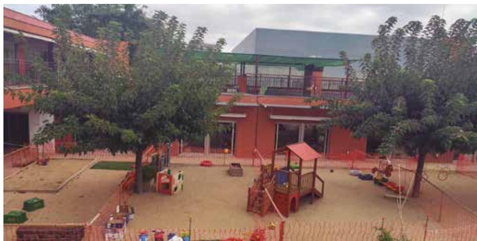
La Bressoleta de l'avinguda Eduard Ferrés

L'escolarització dels infants d'infantil 2 serà gratuïta, excepte els serveis complementaris.