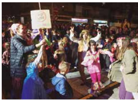
Petits i grans van gaudir d'allò més del ball de disfresses, que va comptar amb l'actuació de The covers band