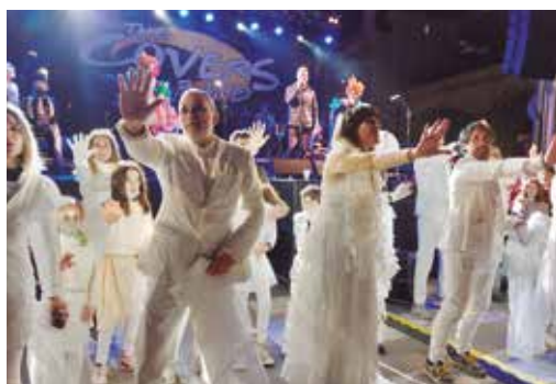
El grup 'Rigoteles', un homenatge a la cançó 'Ay, mamá', de Rigoberta Bandini, va rebre el segon premi del concurs de disfresses