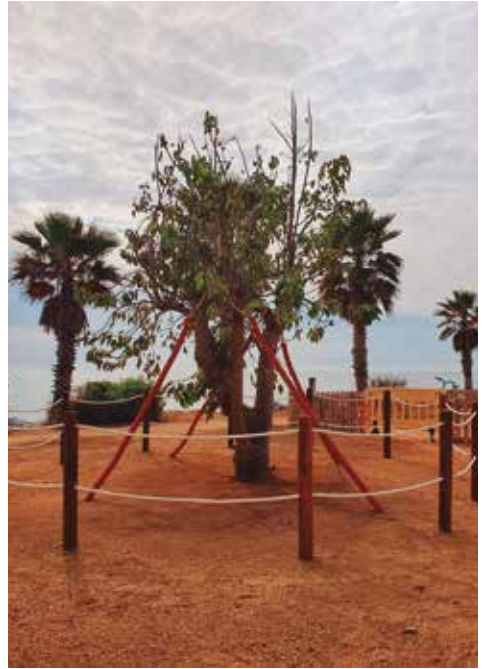
La nova bellaombra del passeig

L'arbre, que va caure a l'estiu, va ser plantat en el moment en què es va fer la remodelació del que avui coneixem com a passeig Marítim. Amb el pas dels anys, l'arbre va crear un forat a la soca i, tot i les repetides inspeccions dels serveis municipals, mai es van detectar patologies que indiquessin que pogués caure. Després de l'incident, afortunadament sense danys personals