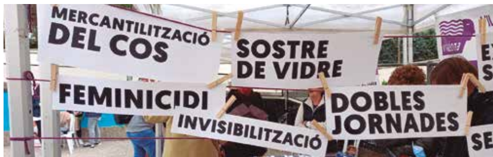
Les associacions feministes de Vilassar de Mar denuncien al carrer els mals que pateixen les dones pel simple fet de ser-ho