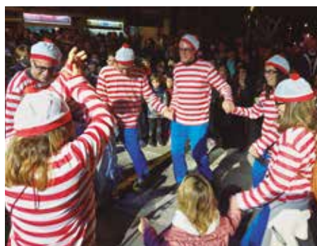
El tercer premi del concurs de disfresses va recaure en 'Wallies', un grup de famílies que evocaven el protagonista del llibre 'On és en Wally?'