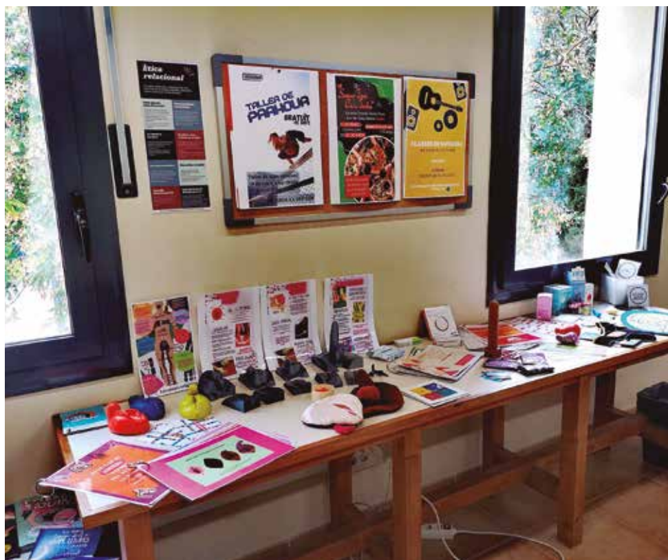
Nou espai de sexualitat a l'Espai Jove de can Jorba

El personal dinamitzador de l'Espai Jove estarà disponible per resoldre els dubtes dels joves, que hi podran accedir lliurement en l'horari de funcionament de l'Espai Jove de Can Jorba, és a dir, de dimarts a divendres, de 16.30h a 19.30h.