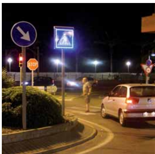
Un dels senyals a la rotonda d'Escultor Monjo

Els senyals funcionen amb leds i s'alimenten amb plaques solars que redueixen el cost del manteniment i permeten ser vistos a la nit. S'han posat al carrer Santa Eulàlia (davant de la Biblioteca Municipal); al carrer Escultor Monjo (a la cruïlla amb la N-II); a l'avinguda Eduard Ferrés (davant del Camp de futbol i la Piscina); al carrer Narcís Monturiol (davant del Mercat Municipal provisional); i a l'avinguda Montevideo (davant l'escola Pérez Sala). Els dos que resten per col·locar, a l'espera de l'acabament d'unes obres, es posaran al pas de vianants de l'avinguda Montevideo (al costat de la nova escola bressol municipal), i l'altre al pas de vianants del carrer Montserrat (davant de can Bisa).