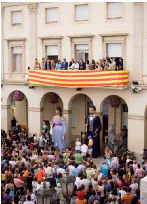
El pregó omple cada any la plaça de l'Ajuntament

de la Festa Major. La Salseta del Poble Sec seguirà posant música a la revetlla de Sant Joan, la Principal de la Bisbal tornarà amb concert i ball el dia de Sant Joan, la Beat Club Orquestra recordarà els mítics anys 60 el dia 26 de juny i el grups locals (divendres 25 i dissabte 26 de juny) pujaran a l'escenari de la Festa'l Burro, a l'Escola del Mar. El final el posarà l'espectacular castell de focs d'artifici a la platja. (La programació de la Festa Major 2010 la podeu consultar a la pàgina 6 i 7).