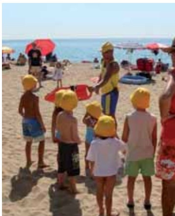
Els socorristes fent activitats preventives amb els infants

Altres serveis que continuen a la platja són els de megafonia amb missatges sobre banderes, seguretat i emergències. També es faran activitats preventives com xerrades i tallers per explicar com gaudir de la platja sense