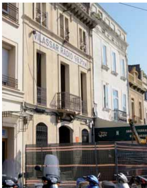
Façana de l'edifici, en obres

El projecte, que du a terme l'Ajuntament de Vilassar de Mar, està inclòs en el fons estatal d'ocupació i sostenibilitat local i té un termini d'execució de 5 mesos.