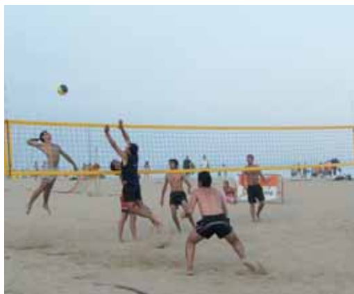
El vòlei platja arribarà a la desena edició

El VIII torneig de tennis platja per parelles es farà el 17 de juliol a la platja de Palomares. Fins al dia d'abans del torneig hi ha la possibilitat d'apuntar-s'hi. Hi haurà dues categories, la júnior, de 14 a 16 anys, i l'absoluta, a partir de 17 anys. Les parelles podran ser masculines, femenines o mixtes.