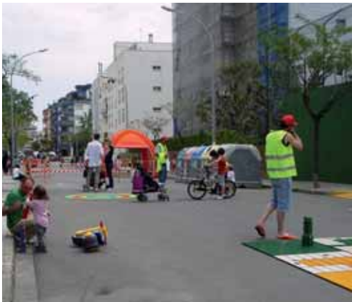
Activitats del 22 de maig

El joc consisteix a trobar vuit píffies que estaran repartides en diferents aparadors dels comerços associats. Els premis seran tres xecs compra de 50 euros per als guanyadors.