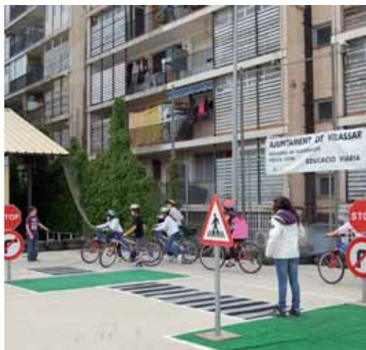
Parc de bicicletes

i coneixent els elements viaris més comuns que es poden trobar quan circulen pel carrer.