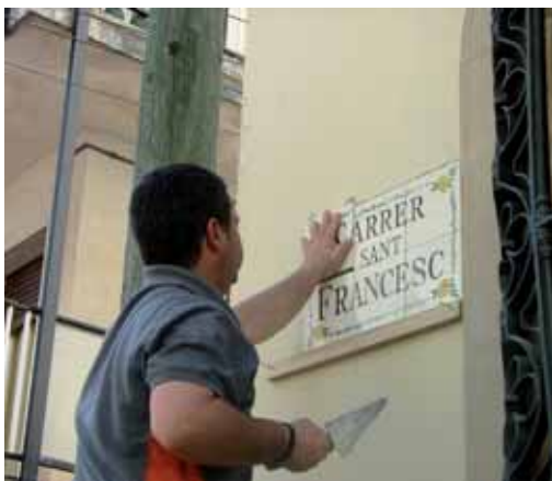
Instal·lació d'una de les noves plaques

La Regidoria d'Espais Públics, a través de la brigada municipal, està finalitzant el procés de substitució de les plaques dels carrers que estan escrites en castellà per les seves corresponents en català. Alhora també s'ha millorat la identificació dels carrers posant plaques allà on no n'hi havia.