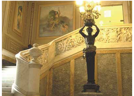
L'herència colonial en l'arquitectura

Es podrà visitar al Museu de la Marina els dissabtes d'11 a 14h i de 17 a 20h, i els diumenges i festius d'11 a 14h.