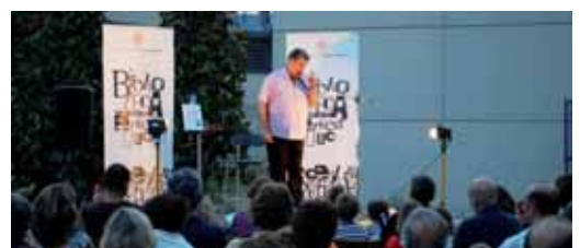
Sessió de contes per Festa Major

gaudir de més sessions a d'altres municipis del Maresme. La programació es pot consultar al bloc http://festivalmultipolarmaresme.blogspot.com .