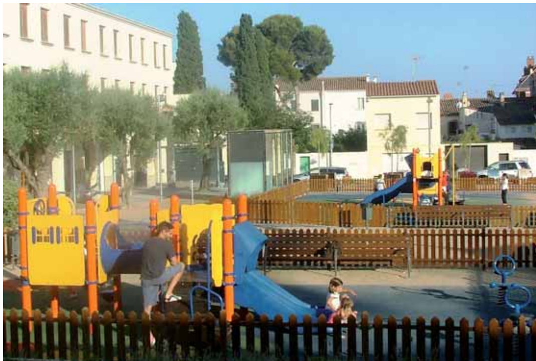
Una de les dues zones de jocs infantils que té la plaça

En el parc dels més grans s'ha volgut reproduir en el disseny del terra el quillat Sant Ramon, el castell de Burriac i un perfil del poble. El terra del parc dels petits recorda el món de la flor.