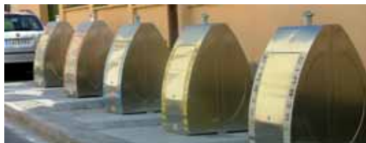
Nous contenidors al carrer Cuba

d'emmagatzematge que els contenidors en superfície. A cada illa de contenidors soterrats s'hi poden llençar deixalles de rebuig, matèria orgànica, vidre, paper i cartró i envasos de plàstic.