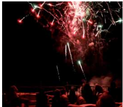
El castell de focs d'artifici posa el punt i final a la Festa i aplega centenars de vilassarencs a la platja.