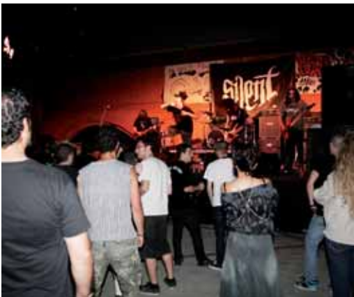
La Festa'l Burro-L'alternativa jove va oferir dues nits de música de grups locals a l'Escola del Mar. A la imatge, l'actuació de metal del grup Silent.