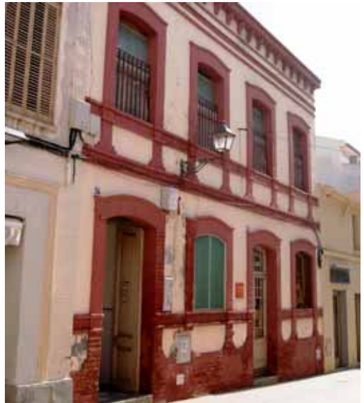
Façana de l'edifici

Amb les obres, es rehabilitarà la façana, que està catalogada, i l'edifici es dotarà d'ascensor per fer les plantes accessibles. Pel que fa als serveis, es dotarà l'edifici de calefacció i es farà tota la instal·lació elèctrica i la de l'aigua, que actualment estan malmeses. El termini d'execució previst de les obres és de cinc mesos.