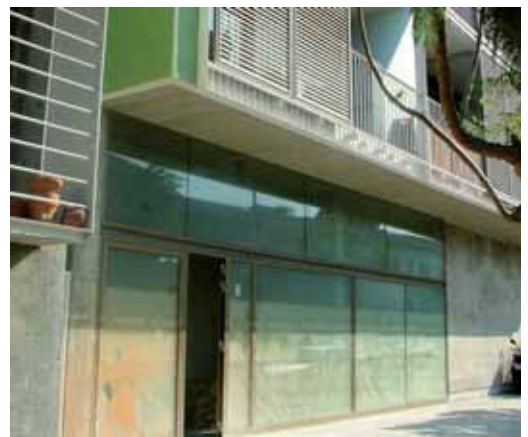
Els baixos que acolliran el nou centre social

L'actuació, que està duent a terme el consistori vilassarenc, està inclosa en el fons estatal d'ocupació i sostenibilitat local.