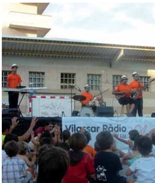
Actuació del grup Articulat

tecnologies. “En aquests dies de globalització que vivim és important destacar el paper de les emissores locals que ens apropen a la nostra realitat, una realitat que per d'altres mitjans passa desapercebuda”. També va explicar que aquest any la ràdio gaudirà de noves instal·lacions a la planta baixa del mateix edifici on ara es troba ubicada. Folch va finalitzar el seu discurs donant les gràcies a tots els fundadors, als treballadors, als oients, però sobretot a tots als col·laboradors que amb il·lusió i d'una forma desinteressada han fet possible que l'emissora hagi tirat endavant i gaudeixi de bona salut. La festa va acabar amb una botifarrada popular a benefici dels Amics dels Animals.