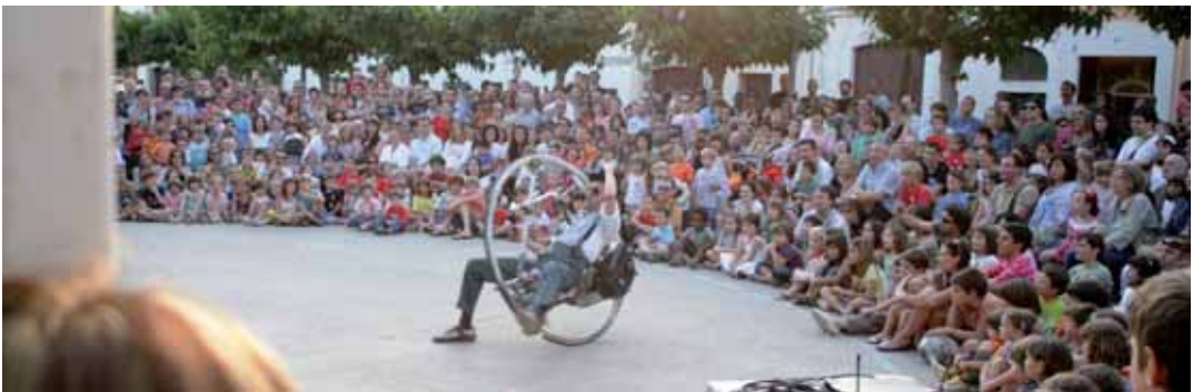
Els espectacles infantils a l'aire lliure són dels més concorreguts a la Festa Major. L'home roda, del circ Karoli, no va deixar ningú indiferent.