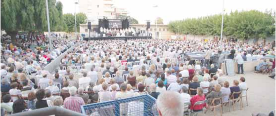
La música omple, com ho demostra el concert de La Principal de la Bisbal a la pista del CEIP Pérez Sala.