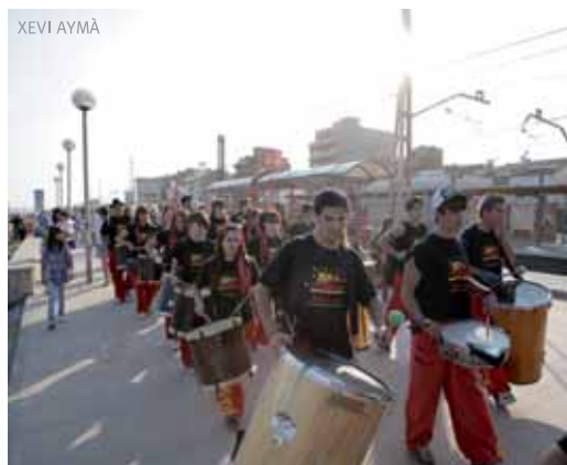
Els Ssstrèpits durant la Festa Major

lliure i serà el públic assistent qui decidirà el guanyador final del concurs. Al llarg de la nit es servirà sopar i es vendran samarretes i recordatoris de la festa. L'acte finalitzarà amb el concert del grup Acrylic Act.