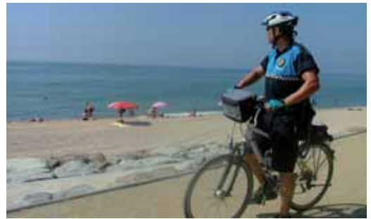
Vigilància a la franja litoral

L'altre està dedicat a les tasques pròpies de la vigilància dels parcs i jardins de la població i vetlla per la convivència ciutadana en relació a la prevenció i denúncia de possibles actes incívics que es produeixin.