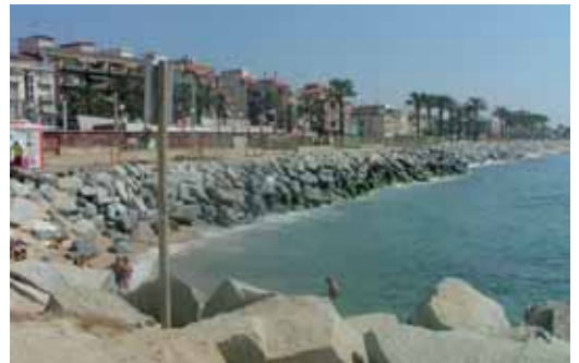
Una de les parts més afectades per la falta de sorra

L'actuació, que du a terme el Ministeri de Medi Ambient, té previst posar un total de 100.000 m 3 de sorra a la part del litoral vilassarenc més afectat.