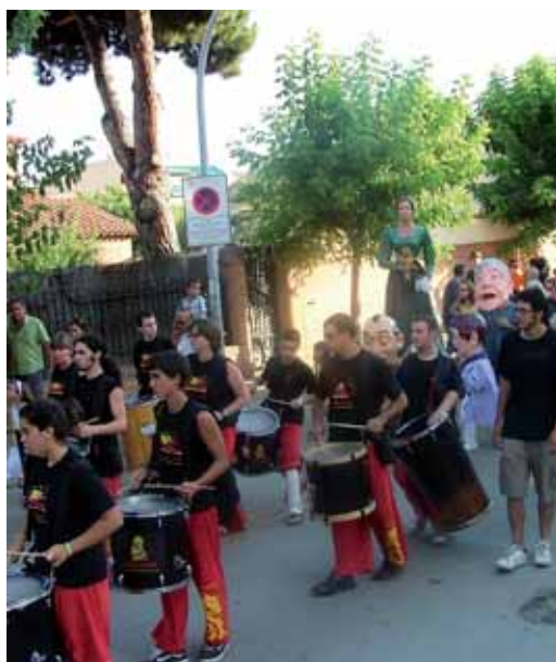
Cercavila amb les colles de l'AVAL