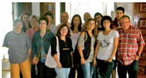
Els alumnes amb la regidora d'Educació i el personal de l'Ajuntament on han fet les seves pràctiques

els alumnes han aprovat el curs escolar i han aconseguit el graduat en secundària.