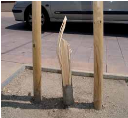
Dos dels arbres recent plantats, davant l'escola Presentació, van aparèixer trencats per la meitat

Durant les últimes setmanes s'han produït diferents actes vandàlics com ara la destrossa d'arbrat viari, d'enllumenat públic, pintades als passos soterranis o cremades a la nova