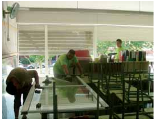
Al Vaixell Burriac es renova la fusteria d'alumini

d'aquestes obres, a totes les escoles es faran tasques de manteniment general de sauló, pintura, jardineria i electricitat.