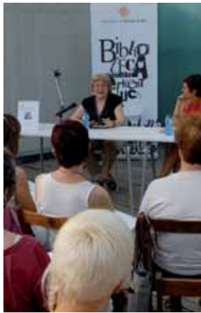
L'escriptora Isabel-Clara Simó al club de lectura d'adults

Actualment hi ha clubs de lectura per a infants, joves i adults. A la darrera trobada del club de lectura d'adults, gràcies a la col·laboració d'Institut Català de les Indústries Culturals, els lectors van poder conversar amb l'escriptora Isabel-Clara Simó. D'altra banda, els clubs de lectura juvenil i infantil van néixer a partir de la participació al Premi Protagonista Jove i Premi Atrapallibres que convoca el Consell Català del Llibre Infantil i Juvenil i on, a partir d'una tria