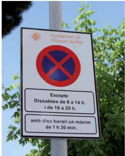
Senyal que indica la utilització de disc horari

Les obres del nou edifici del Mercat Municipal han fet disminuir el nombre de places de zona blava que l'Ajuntament tenia contractat amb l'empresa explotadora del servei. Per aquest motiu, i de forma provisional, mentre durin aquestes obres el carrer Narcís Monturiol, entre Ca l'Aduana i la Riera d'en Cintet, s'ha fet de zona blava. Quan finalitzin les obres, l'aparcament en aquest tram del carrer tornarà a ser lliure.