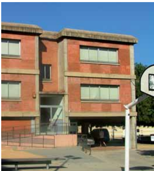
Façana de l'Aulari

Les obres han començat al mes de juliol i la previsió és que estiguin enllestides al setembre. Des de l'AMPA del centre es valora de forma molt positiva la resposta de l'Ajuntament. Tot seguit es reproduïx la carta que han adreçat al VdM'informa.