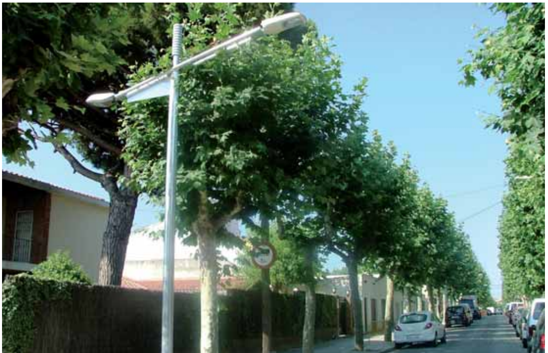
Nous fanals, de doble braç, il·luminen el carrer Colom

Al carrer Colom, entre el carrer del Mont i