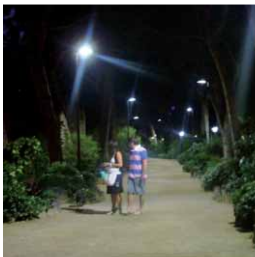
Passeig dels Pins

del carrer Sant Genís s'han canviat els dos focus per dos punts de llum de leds de 80 vats cadascun.