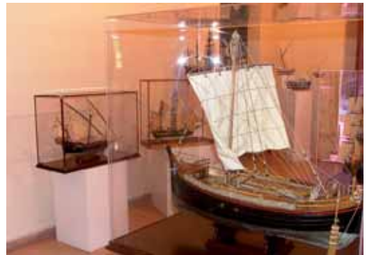
Una de les reproduccions de l'exposició

N'hi ha reproduccions de tot tipus, des de vaixells de guerra del segle XVIII fins a un vaixell mercant del segle XIX, passant per una maqueta d'una embarcació grega, barques de pesca o fins i tot l'Ictíneo. La mostra es pot visitar els dissabtes d'11 a 14 h i de 17 a 20 h, i els diumenges d'11 a 14 h. D'altra banda, al Museu Monjo continua fins el 31 de juliol, en el mateix horari que l'anterior, amb l'exposició "Escultura classicisme. Enric Monjo, l'artista i el model". Al mes d'agost els dos espais del Museu Municipal, Museu de la Marina i Museu Monjo, romandran tancats per vacances.