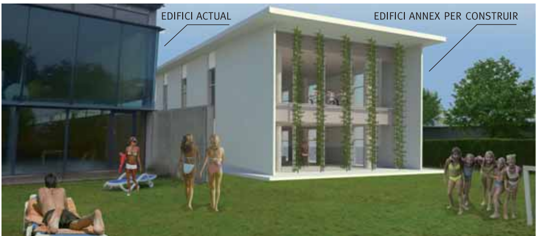
Imatge virtual de l'edifici annex

El cost total de les obres és d'1.652.243 euros, dels quals 1.046.995 són per a l'ampliació i 605.248 per a la reparació. L'Ajuntament, l'empresa concessionària Geafe i l'empresa constructora Contratas y Obras es reparteixen els costos.