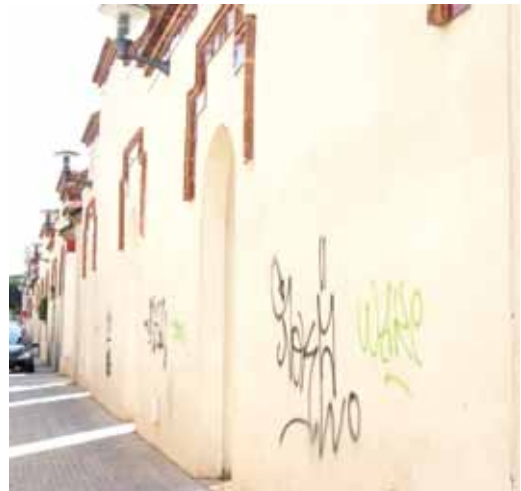
Pintades en el mobiliari urbà, passos soterranis o parets

gespa del camp de futbol. Són actes que sovint passen desapercibuts però l'Ajuntament vol conscienciar que el civisme és cosa de tots.