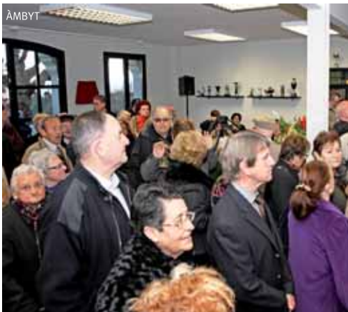
El nou centre es va omplir de gom a gom