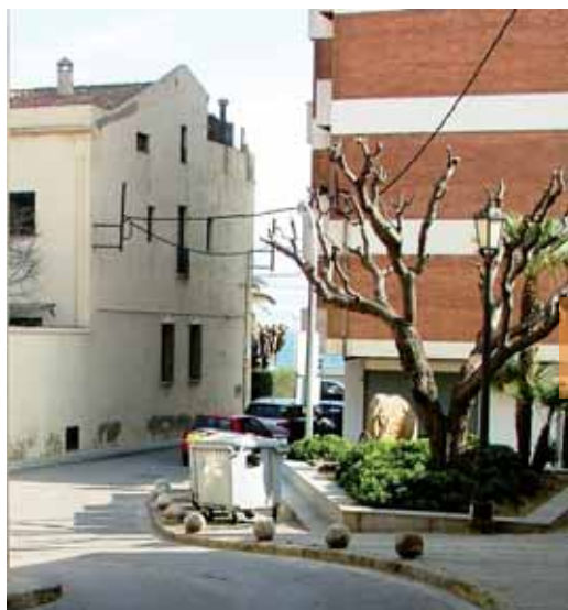
Carrer ca l'Aduana abans de la reforma

vianant. També s'ha instal·lat una illa de contenidors soterrats amb les cinc fraccions: paper, vidre, plàstic, orgànic i rebuig.