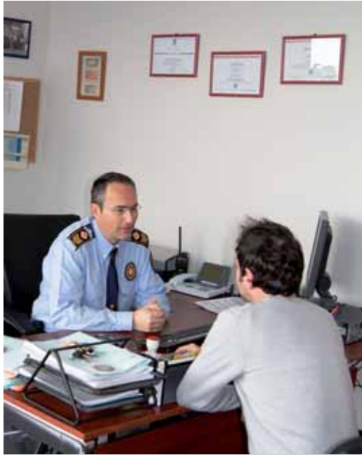
Despatx del cap de la Policia

Actualment la Policia Local de Vilassar de Mar compta amb una plantilla de 34 agents (25 agents, 6 caporals, 2 sergents i un sotsinspector), i dos auxiliars administratius, distribuïts en tres torns que cobreixen les 24 hores del dia, els set dies de la setmana, per donar resposta a totes les demandes ciutadanes.