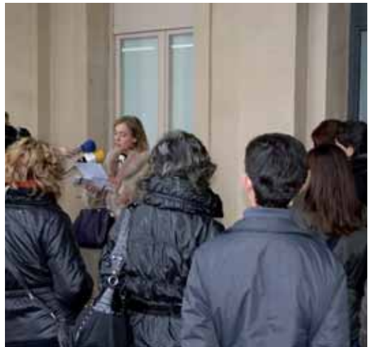
Lectura "Carta d'una madre" a la plaça de l'Ajuntament

"Mares", un sopar i ball i un col·loqui sobre la maternitat.