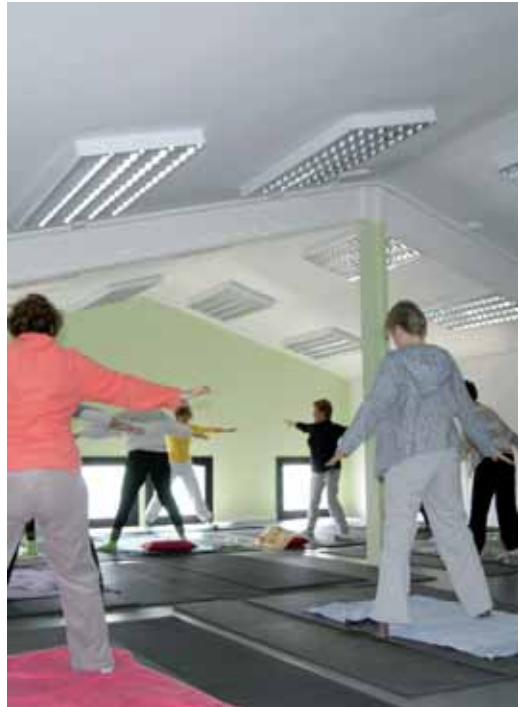
La sala on es fan les classes d'ioga