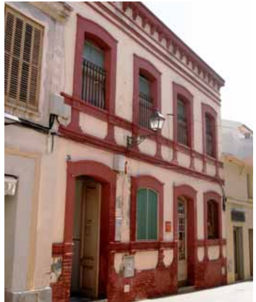
L'edifici del carrer Sant Joan, 36, es convertirà en hotel d'entitats i l'escola bressol funcionarà en un edifici de nova construcció al barri del Barato

L'objectiu de l'obra és que les aigües que baixen actualment de l'avinguda Montevideo i del Barato fins al carrer Sant Joan i el col·lector del passeig Marítim es desviïn ara cap a la riera de Cabrils i així s'alliberi de càrrega el volum d'aigua que fins ara suporta el nucli antic. El termini d'execució de l'obra és de 3 mesos i ha estat adjudicada a l'empresa Paviments Martín.