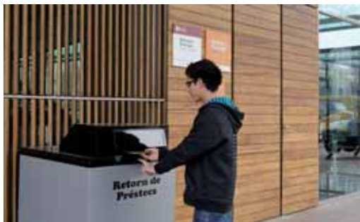
Un usuari fent servir la bústia de retorns

La Biblioteca Municipal Ernest Lluch i Martín ofereix un nou servei als seus usuaris: la bústia de retorn de documents 24 hores. D'aquesta manera, els usuaris s'estalvien possibles cues o poden retornar els documents de préstec a qualsevol hora encara que l'equipament estigui tancat.