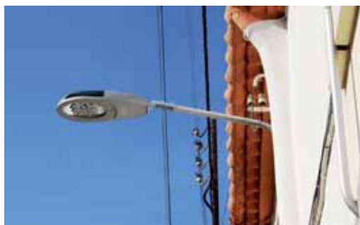
Una de les noves lluminàries del carrer Arpella

moció, l'Ajuntament es comprometia a dur a terme accions per reduir el 20% de les emissions de CO 2 abans de l'any 2020.