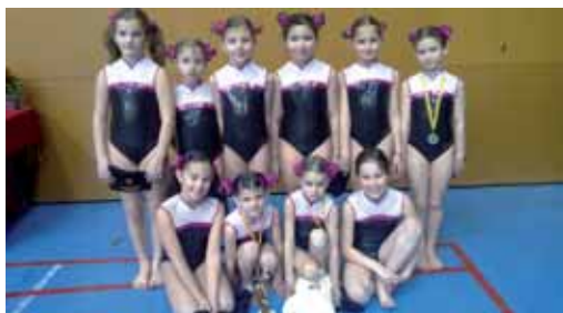
Les gimnastes de l'AGAV

El bon nivell de les gimnastes de Vilassar de Mar es va tornar a demostrar el passat febrer a Vic, durant la primera fase promogym de gimnàstica artística femenina.