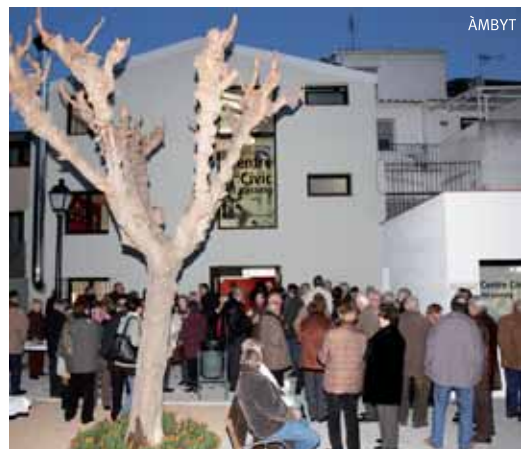
La nova plaça del Pati del Cumu de les Noies