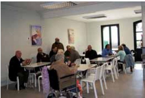
L'espai de lectura, a la planta baixa