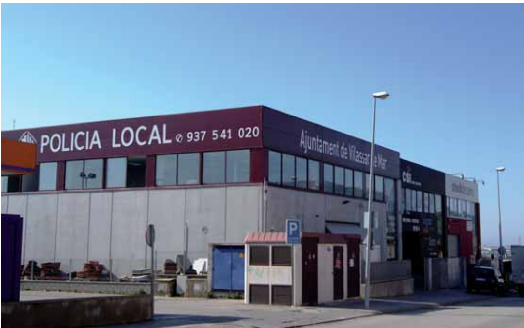
La nova seu, al polígon industrial