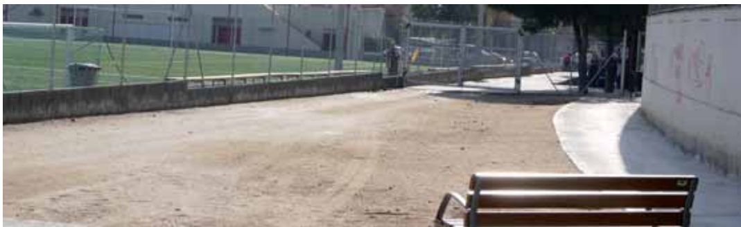
Nou espai d'esbarjo per als gossos

L'espai està obert les 24 hores del dia. La Regidoria d'Espais Públics i Medi Ambient ha senyalitzat l'espai, que està tancat, i l'ha condicionat amb bancs, papereres i dispensador de bosses per recollir les defecacions dels animals. L'espai compta amb dues portes, una d'accés per als ciutadans i els seus gossos, i una altra porta per a l'accés de vehicles d'urgència municipals. Amb aquesta ja són dues les zones d'esbarjo de gossos que hi ha al municipi. L'altra, des de finals del 2007, és la situada al costat de la N-II, davant del Mercat de Flor i Planta Ornamental.