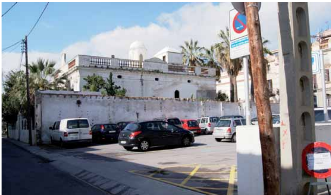
Espai objecte de transformació

Per seguretat, a l'inici de l'obra la circulació de vehicles al carrer de Santa Isabel, Rector Bartrina i la Pau quedarà interrompuda i no s'hi podran estacionar vehicles. Amb vehicle, només es podrà accedir als aparcaments privats i als serveis eclesiàstics.