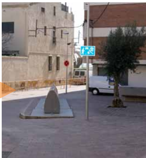
Després de la reforma