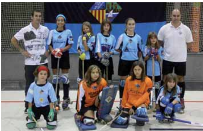
L'equip femení del club d'hoquei vilassarenc

En el Campionat de Catalunya participaran sis equips, dels quals, en el moment de tancar aquesta edició, estaven confirmats els equips de patins de Vilanova, Bigues i Riells, Castellet i Vilassar de Mar.