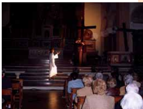
Escena corresponent a la presentació de la creu

L'altar del temple parroquial farà d'escenari de les 29 escenes plàstiques que conformen la representació i que són interpretades per 43 actors amb edats que van dels 4 als 35 anys, i sis lectors. A l'equip s'afegeixen les onze persones que integren la part tècnica i de muntatge. I és que la música i els efectes de llum són tant o més importants que els gestos dels actors. El públic respon i cada any omple l'església de gom a gom. L'any passat el muntatge teatral va incorporar una escena nova, la de l'acomiadament de mare i fill (La Verge Maria i Jesús).