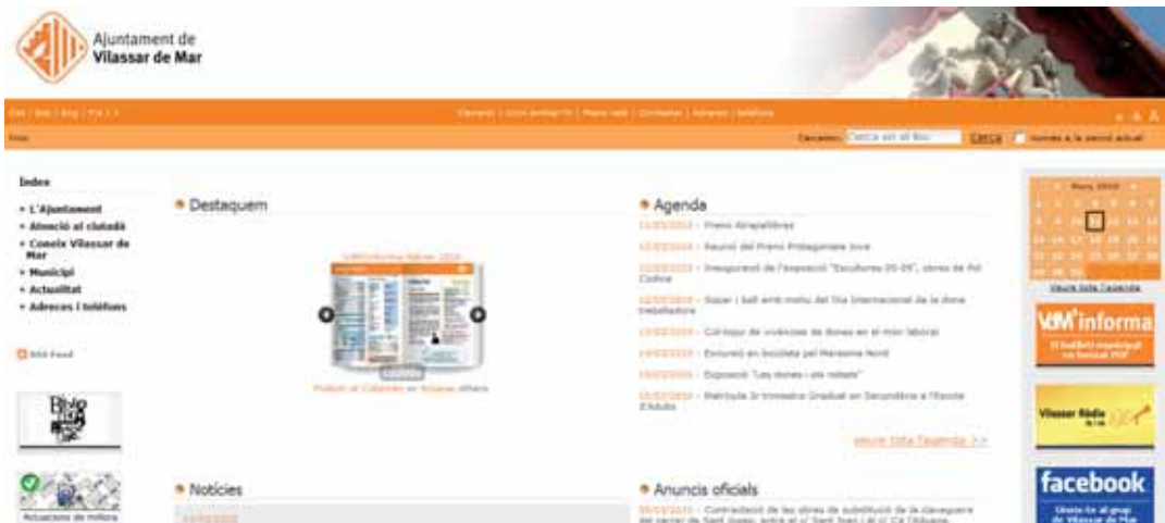
El web municipal registra més de 150.000 visites durant el primer any de funcionament

Des de la Regidoria de Comunicació i Noves Tecnologies s'utilitza la tecnologia google maps al web municipal per anunciar obres, talls de trànsit o qualsevol tipus d'incidència a la via pública, un servei que ha rebut més de 100.000 visites. Permet situar-se en el punt on es porta a terme cada obra i obrir una petita fitxa en què es pot veure una fotografia i una breu descripció de cada actuació.