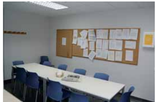
Sala de menjador