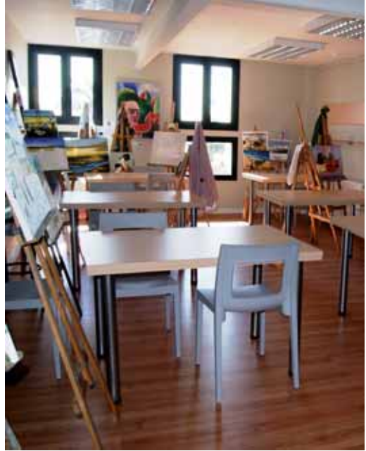
La sala de pintura