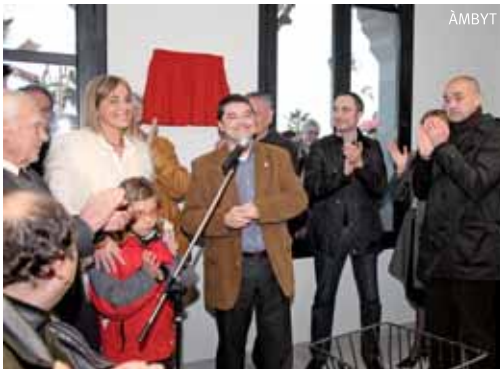
Parlaments inaugurals amb la presència d'autoritats municipals

El nou equipament compta amb diferents sales per dur a terme activitats com ara pintura, ioga, jocs de taula o puntes de coixí, entre d'altres.