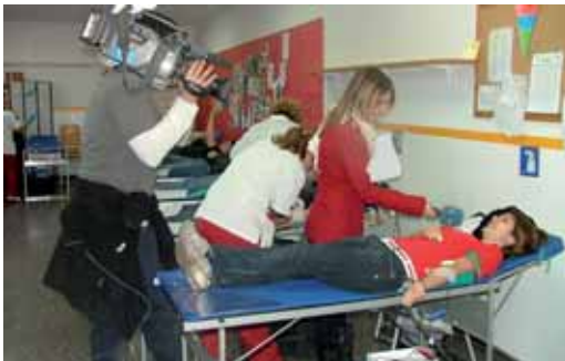
Sala habilitada per fer les donacions

La xifra aconseguida quintuplica la mitjana de donacions que s'aconsegueixen en les campanyes ordinàries que es fan al municipi i que giren al voltant de les 60 donacions. La previsió que feia el Banc de Sang per a aquesta marató es va superar amb escreix gràcies a la solidaritat demostrada per tots els donants.