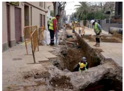
Obres al carrer Santa Rosa de Lima