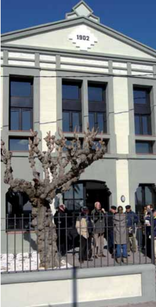
La façana principal, al Camí Ral 19