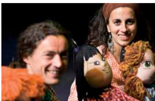
Espectacle "Nens, al pati!" de la companyia Samfaina de colors

Euclides Mattos tornarà a obrir el Va de jazz.