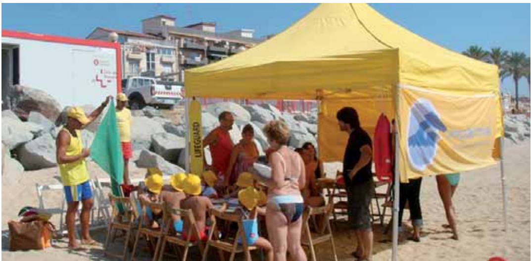
Els infants al taller "Gaudim de la platja sense riscos" aprenent el significat dels colors de les banderes

Durant la temporada de bany amb la col·laboració de la Regidoria de Serveis Socials, Sanitat i Família de l'Ajuntament de Vilassar de Mar s'han realitzat diferents activitats i tallers lúdico-educatius orientats principalment a la prevenció de riscos. "Els pirates a la platja", "Gaudim de la platja sense riscos" i "Aprèn a menjar sa a la platja" han gaudit d'una gran participació. Els dos primers tallers explicaven què fer en cas de picades de meduses, deshidratacions, la necessitat de protegir-se del sol o conèixer l'estat de la mar pel color de les banderes. El taller "Aprèn a menjar sa" donava alternatives saludables a l'entrepà.