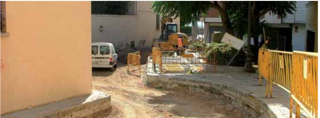
Carrer Ca l'Aduana

entre el carrer Sant Josep i Cristòfol Colom, i també inclouen el tram del carrer Sant Ignasi entre la plaça del Círcol i el carrer Sant Joan. Les del carrer ca l'Aduana estan adjudicades a l'empresa Cotesa i abracen el tram que va del carrer Doctor Masriera fins al Camí Ral.