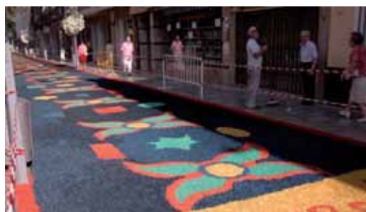
La catifa d'enguany