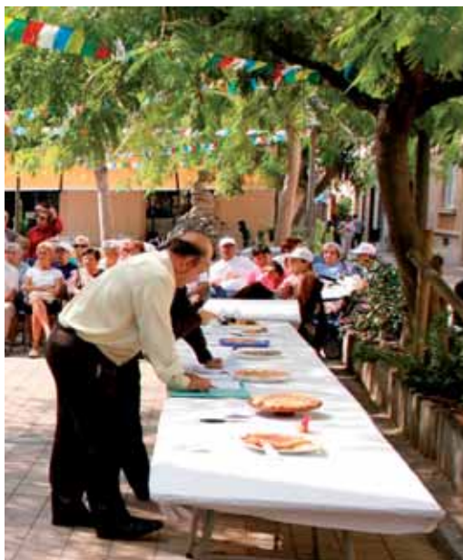
Concurs de truites 2008

L'Ajuntament recorda que si alguna persona té problemes de mobilitat i vol assistir a algun acte ho pot sol·licitar trucant a l'Escola Nàutica, al 937540500.