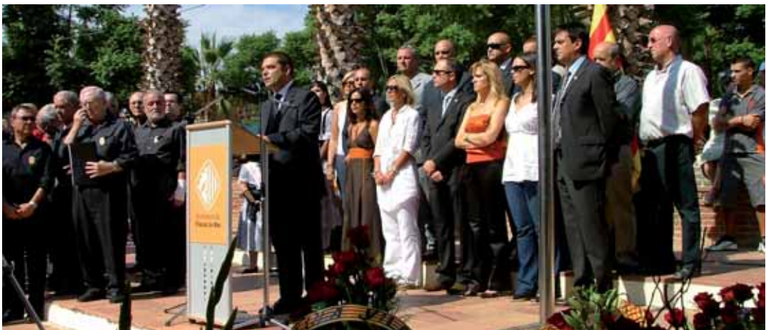
Discurs de l'alcalde durant la Diada