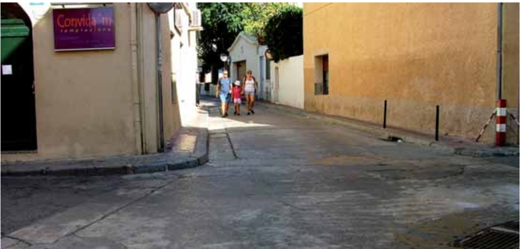
Carrer Sant Joan