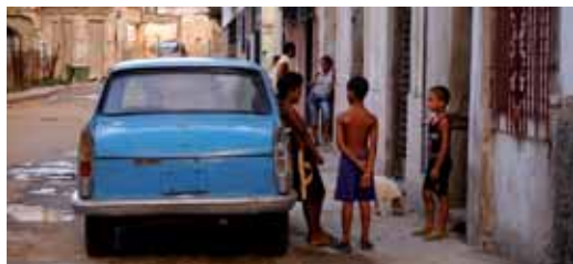
Una de les fotografies de “Cuba”

A partir del 18 d'octubre es podrà veure “La Gran Aventura dels Velers Mercants”, exposició de més de 100 objectes del capità Pau Lloveras i Riera, nascut a Vilassar de Mar, i que va viure entre els anys 1853 i 1915, un dels protagonistes del que s'ha anomenat la carrera americana.