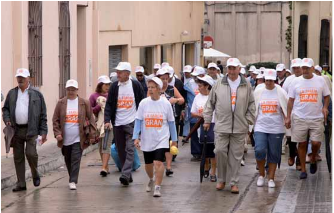
Caminada celebrada a l'edició anterior