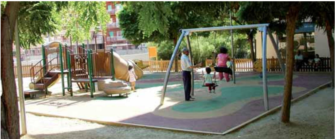
Plaça Carles Trias