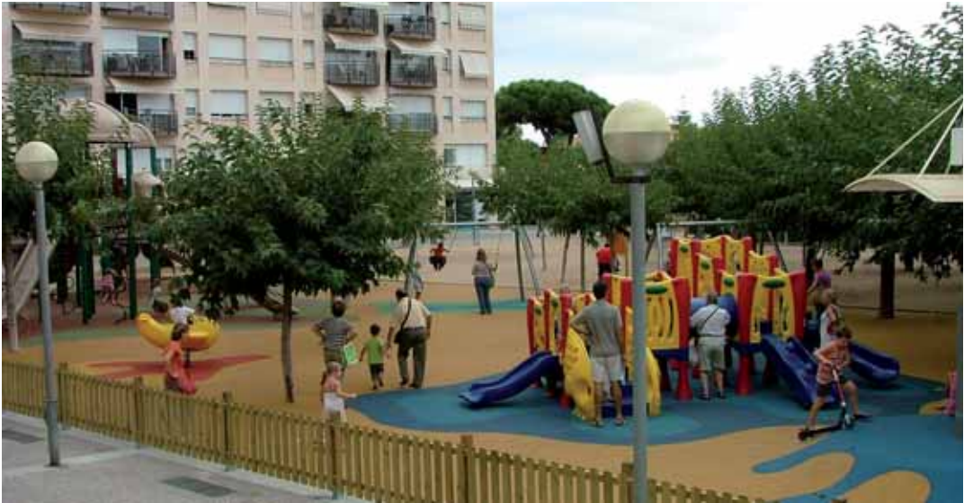
La plaça Jeroni Gelpí després de la renovació

infantil amb nous jocs, més moderns i participatius, i més seguretat amb la instal·lació de paviment de cautxú per evitar danys en cas de caigudes.