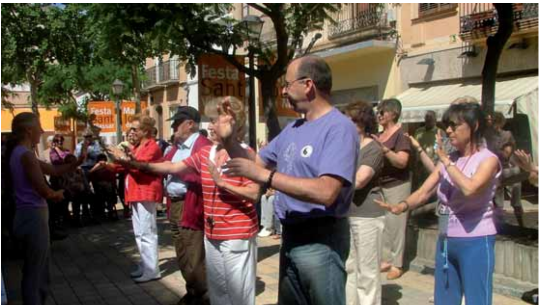
Exhibició dels participants del curs de tai-txi

i country, i durant el mes de novembre s'ha organitzat una sortida al Palau de la Música. Totes les activitats són gratuïtes a excepció de la sortida, que té un preu de 10 euros. També continuen les xerrades mensuals cada últim dilluns de mes al local del carrer Sant Roc, 2. A l'octubre amb "Deixar de discutir per entendre's", al novembre amb "El canvi climàtic" i al desembre amb "Costums i tradicions catalans". La Regidoria ha editat un tríptic amb informació detallada d'aquestes activitats que s'ha repartit casa per casa. Les inscripcions es faran el 28 i 29 de setembre a l'Escola Nàutica (carrer Santa Eulàlia, 40) a partir de les cinc de la tarda.