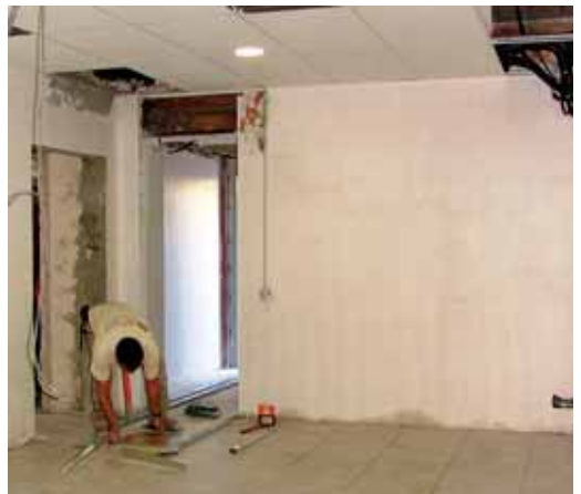
Obres de reforma a la que serà la seu definitiva de l'Escola d'Adults