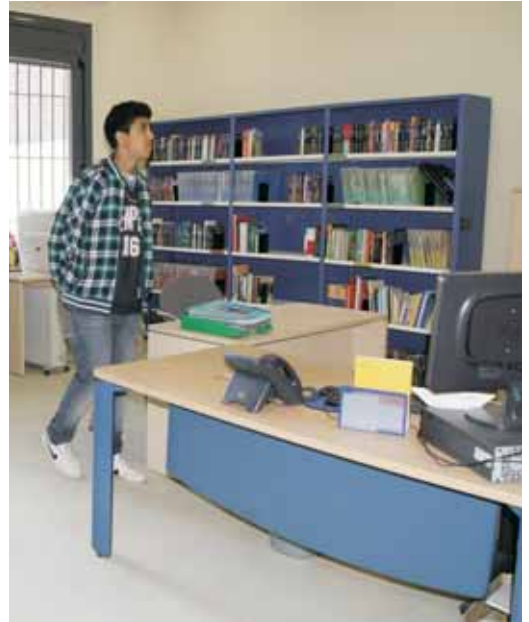
Espai dedicat a informació i viatgeteca

Precisament la primera activitat que s'ha dut a terme al nou equipament ha estat l'exposició "Després de l'ESO què?" per orientar als i les joves sobre què i com continuar estudiant després de finalitzar l'ensenyament secundari obligatori, independentment l'aprovin o no. Una altra activitat que es durà a terme és un curs de