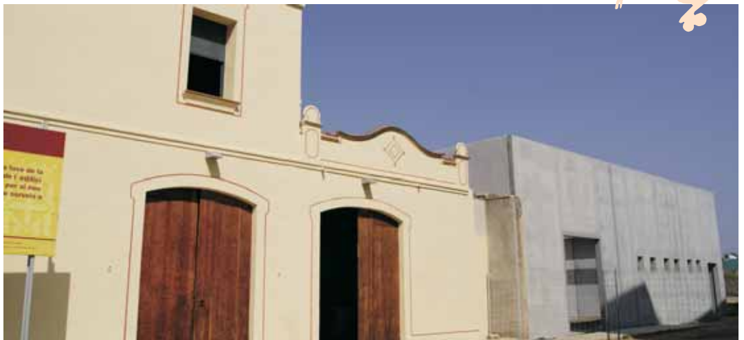
El nou equipament de Joventut

L'horari d'atenció al públic de can Jorba és a les tardes, de dilluns a divendres de 16.30 a 20 hores, a excepció dels dimarts que està tancat, tot i que el Servei de l'Oficina d'Habitatge del