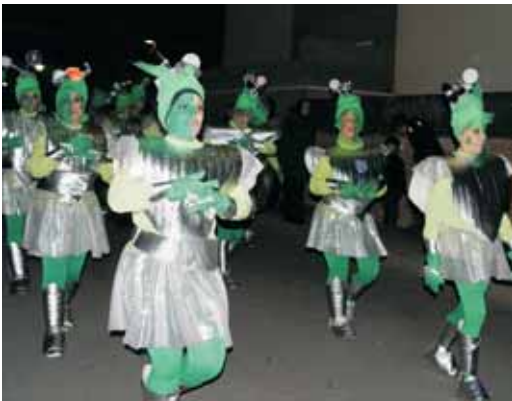
4rt premi: "Metal-ik Planet", marcians plens de lluentors metàl·liques.