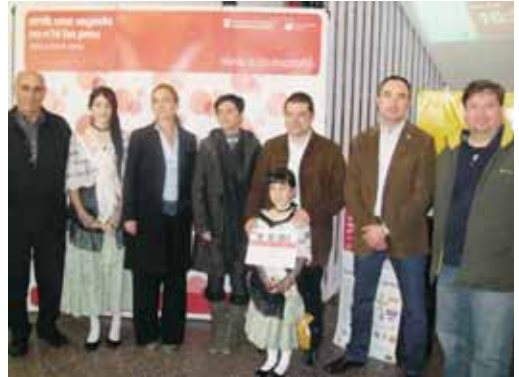
Els organitzadors de la Marató donant el tret de sortida a la donació

L'Escola Pérez Sala va ser l'escenari on es va desenvolupar la jornada de 12 hores ininterrompudes de donacions de sang, que va comptar amb nombroses activitats, gràcies a la col·laboració de les AMPES de totes les escoles,