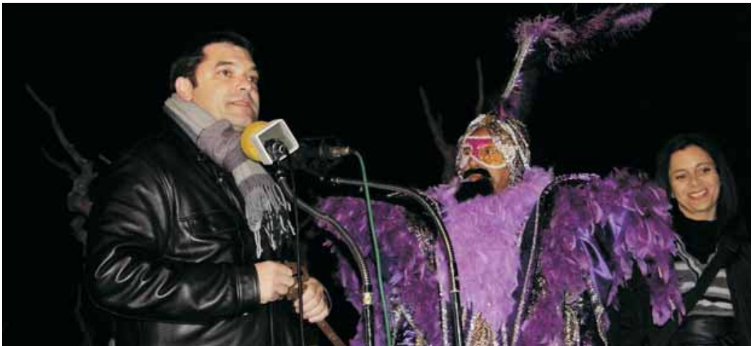
El pregó del rei Carnestoltes va donar el tret de sortida al Carnaval. L'alcalde acompanyat per la regidora de Cultura li va lliurar la clau del poble.

16 comparses i prop de 650 persones van desfilat a la rua de Carnaval, una de les més participatives de la història d'aquesta festa a Vilassar de Mar. El públic també va batre rècords. Centenars de persones van sortir a gaudir de la rua en els diferents punts del recorregut.