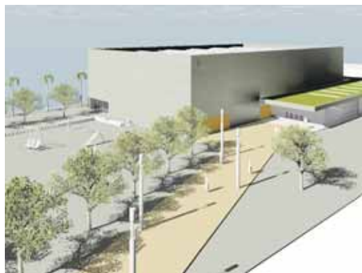
Imatge virtual de la pista esportiva coberta

per acollir quatre vestidors col·lectius, dos vestidors per a arbitratge, una infermeria, lavabos i sales de magatzem de material, entre d'altres, i també preveia un espai per a una pista esportiva exterior. El fet que una part del solar estigui afectat per restes arqueològiques a preservar fa que no hi hagi espai per a la futura pista secundària.