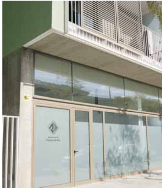
L'entrada del nou centre

L'Ajuntament ha ofert el local per tal que serveixi com a punt de trobada a diverses entitats, entre elles l'associació de puntaires del Passeig, DiscapVicamar, Oncolliga, el Centre Excursionista Vilassar de Mar, Vilassar Comerç i l'associació de veïns de la Xinesca.