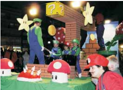
Premi Toni Linares a la millor carrossa: per a la comparsa "No entiendo", que representava un conegut videojoc protagonitzat per Mario Bros.