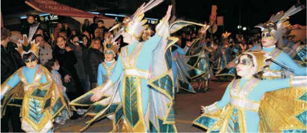
3r premi: "El regne Quetzal", ocells amb plomalls daurats.