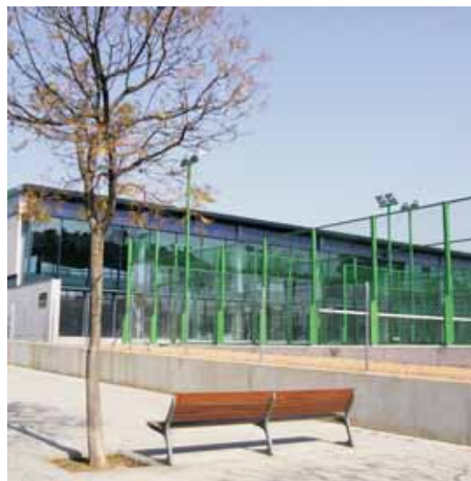
Vista general de la Piscina

A la planta de dalt, hi haurà la sala cardiovascular i els aparells de fitness.