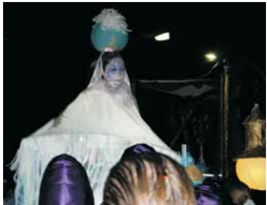
Reina del Carnaval: "La gran medusa", de la comparsa "Mar de Gresca".