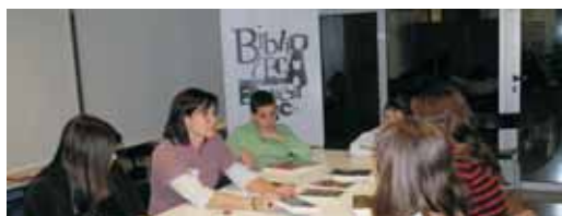
Club de lectura

La Biblioteca Municipal inicia un programa d'animació a la lectura que amb les sigles BELL (La Biblioteca t'Engresca a Llegir) engloba sota un mateix paraigua totes les activitats de foment de la lectura infantils i juvenils, i a més amplia l'oferta amb nous tallers, exposicions i sortides. Les activitats més immediates són dos tallers d'animació a la lectura per a infants de 7 a 12 anys, el 26 de març i el 2 d'abril, a les 11 del matí.