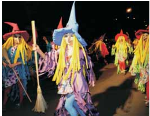
5è premi: "Xup, xup, màgia i color", bruixes molt acolorides, amb grans barrets i llargs cabells.