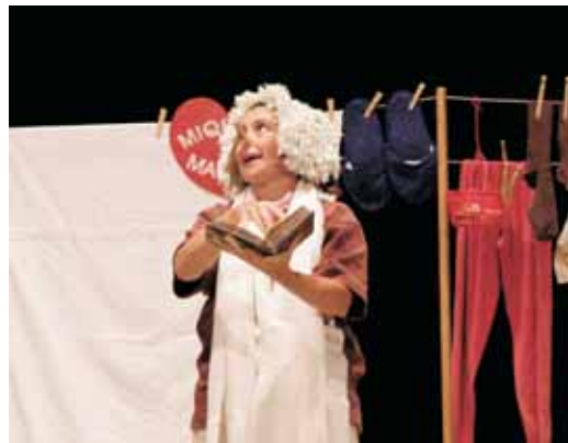
Una de les escenes de 'Contes al terrat'

La programació estable continuarà el 18 de maig, a les 17.30 h, amb 'La bella dorment', de la companyia Tutatis Produccions.