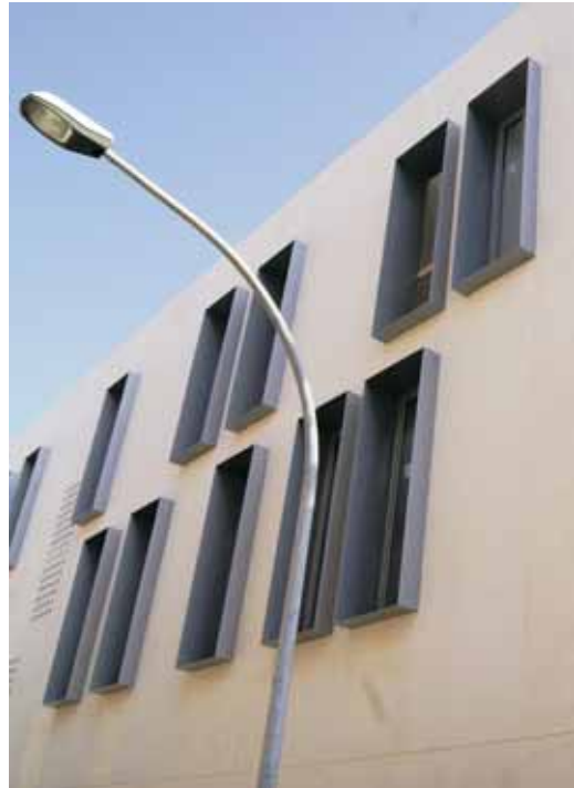
L'edifici annex a can Bisa compta amb 14 pisos de promoció pública i un nou equipament cultural

La connexió del nou edifici amb la casa de can Bisa es farà amb un gran finestral. Les obres també preveuen la urbanització dels carrers de l'entorn, amb voreres més amples i nova il·luminació.