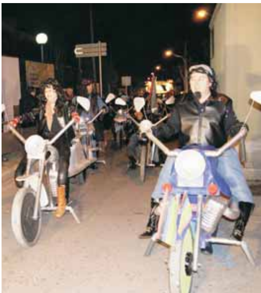
1r premi: "Ruta 56", motoristes amb unes Harleys ben originals.