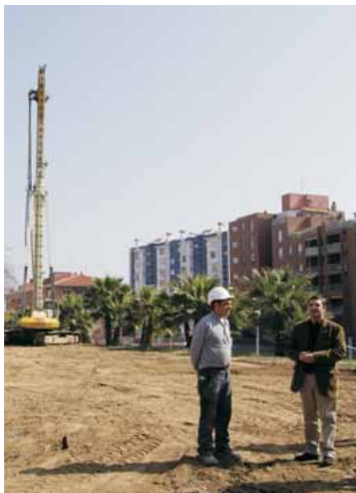
L'alcalde en l'inici de l'obra

El projecte també comptava amb una segona fase en què es construiria una altra edificació, al costat de la que ara comença, que serviria