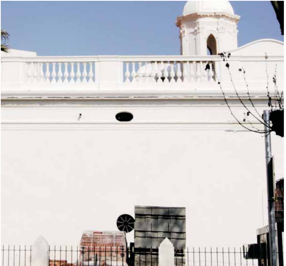
La casa d'estil modernista s'ha rehabilitat

per dins i per fora. La casa, situada al centre del poble, compta amb 250 m 2 de superfície construïda i acollirà dependències municipals i una sala d'exposicions per a fotografies de Vilassar de Mar.