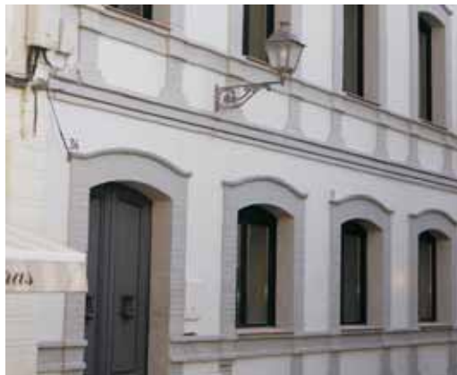
El nou equipament està distribuït en dues plantes amb ascensor

Amb les obres, també s'ha rehabilitat la façana de l'edifici, s'ha posat un ascensor per fer les plantes accessibles i s'ha refet tota la instal·lació elèctrica i la de l'aigua, que estaven malmeses.