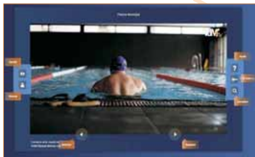
Un dels reportatges de VdMTV

Els ciutadans que vulguin participar-hi, poden fer arribar les seves propostes a l'adreça: tv@vilassardemar.cat .