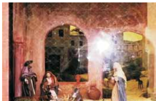
Pessebre de Nadal a la seu social de Vilassar Comerç realitzat per Josep M. Macià