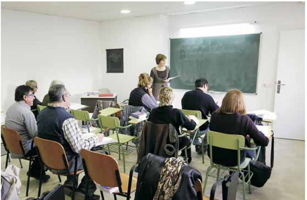
Una de les aules ampliades

L'Escola d'Adults obre del 24 al 28 de gener el període de matriculació per al segon quadrimestre amb una oferta educativa que inclou: iniciació a l'alfabetització, llengua per a nousvinguts, iniciació a la informàtica, informàtica bàsica i iniciació a l'anglès. L'horari de matriculació és de 15.30 a 20 hores.