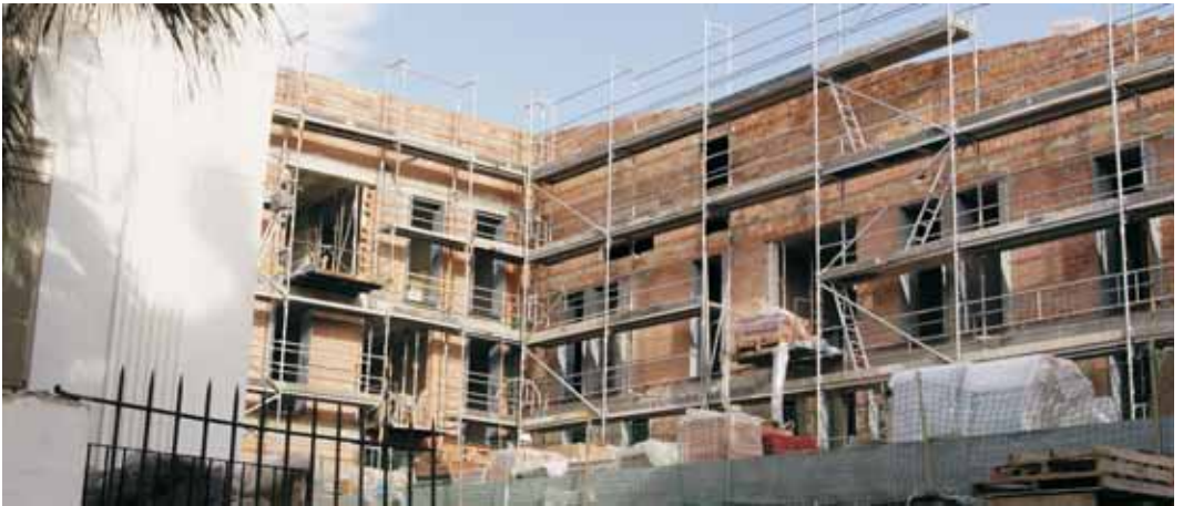
La construcció dels habitatges a l'illa de can Bisava a bon ritme

Entre les sol·licituds que es presentin i compleixin les condicions demanades es farà un sorteig. En cas que no es presenti ningú, es cridarà el següent de la llista de reserva resultant del sorteig del 16 d'octubre.