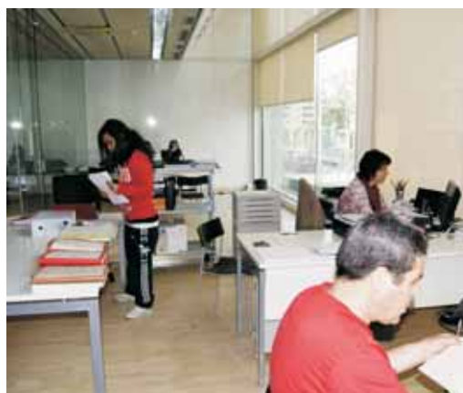
La sala de consulta