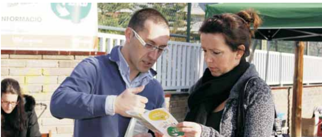
Parada informativa, els dijous de gener, al mercat ambulant