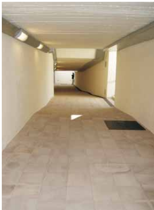
El nou pas soterrani dóna accés directe a la platja

L'obra es va començar al mes de maig del 2010.