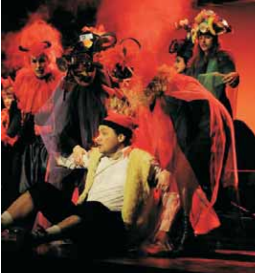
El públic va respondre omplint les quatre representacions que La Tropa Teatre va fer dels Pastorets a l'Ateneu Vilassanès.