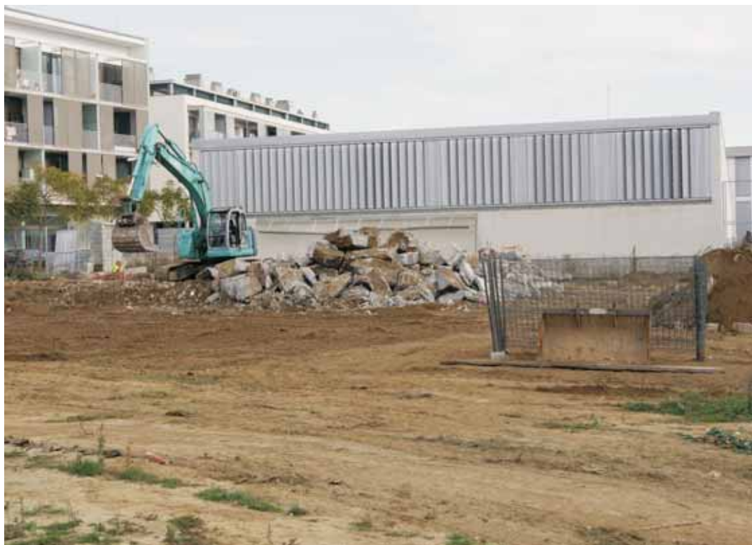
Les obres han començat amb la neteja i tancament del solar adjacent a l'Institut Pere Ribot

pugui ampliar a dues línies. Aquesta ampliació no afectaria el funcionament del centre ja construït. El projecte es basa en una composició articulada de tres cossos clarament diferenciats però connectats a través de la coberta, des de l'accés principal fins al gimnàs. També disposarà de cinc accessos des de l'exterior per poder accedir de forma independent a les pistes esportives, a la biblioteca, al despatx de l'AMPA, a la cuina i al mateix centre educatiu.