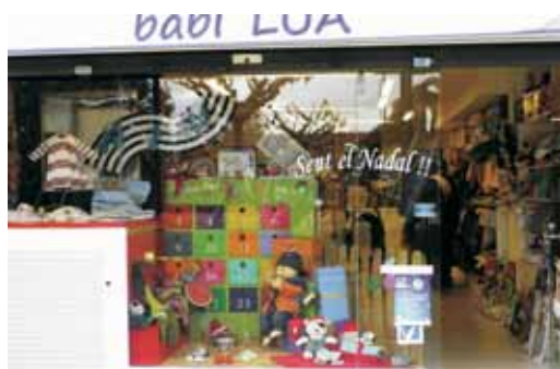
Babi Lua, premiat al concurs d'aparadors