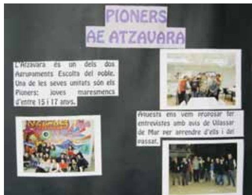
Aprenem dels avis vilassarencs, de l'AE. Atzavara

"Vilassar des dels terrats" és l'altra mostra que es pot visitar i que ens permetrà veure el poble des d'un altre angle, aquesta vegada des de la mirada privilegiada que ofereixen els terrats.