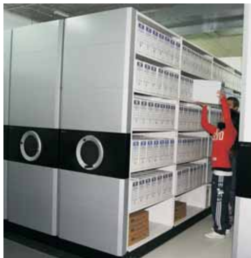
Els fons documental de l'arxiu

una part del dipòsit de l'arxiu tal com ho recull el conveni signat entre l'associació i l'Ajuntament. El fons documental de la fonoteca es pot consultar visitant la seva web www.fonovilassar78.com .