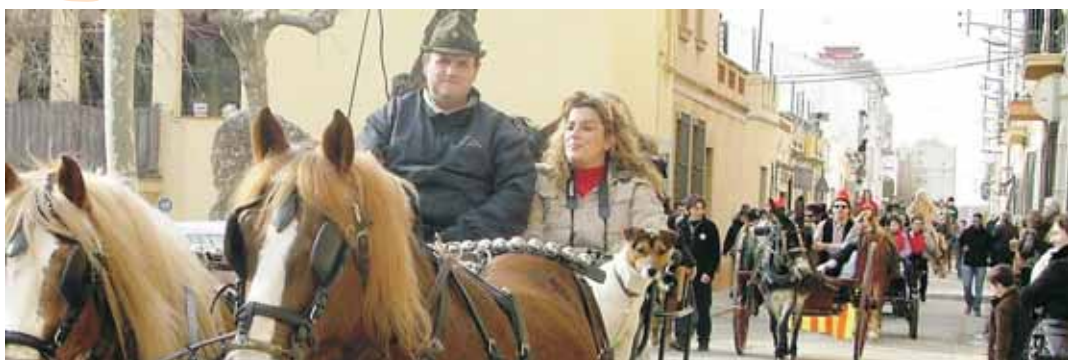
Els carros i carruatges vesteixen les millor gales

La benedicció dels animals, a la 1 del migdia, es realitzarà com cada any al carrer Sant Joan, a l'altura de la plaça de l'Església.