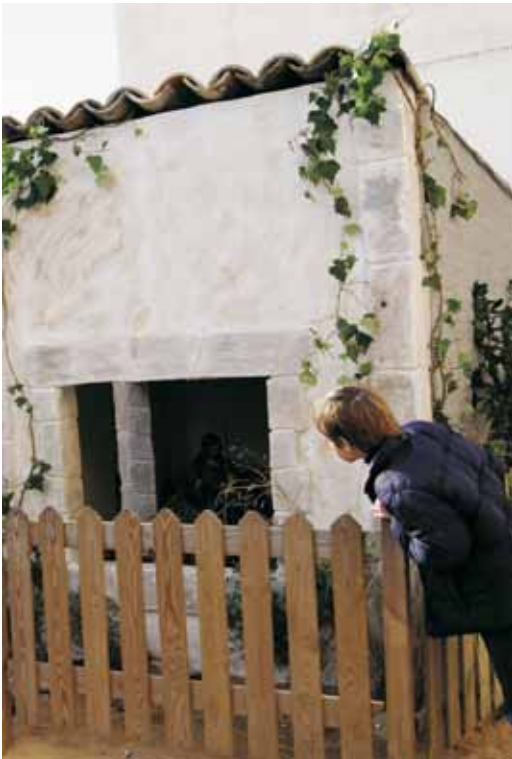
El pessebre de la plaça de l'Església, fet per la brigada municipal, i els de l'exposició al centre parroquial, de l'associació de pessebristes de Vilassar de Mar, no van faltar a la cita nadalenca.