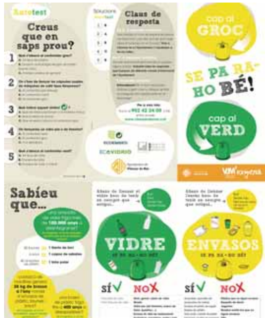
Tríptic informatiu campanya medi ambient

La campanya es reforça amb xerrades a les escoles amb vídeos i jocs didàctics. Alhora es reparteixen bosses reutilitzables i tríptics que, a més d'informació sobre què es pot llençar i què no es pot llençar als contenidors d'envasos i vidre, incorporen un autotest perquè cadascú s'avalui i conegui quant en sap, de reciclar.