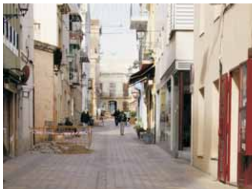
Aspecte del carrer Sant Joan abans de l'actuació

que ja no es fabriquen, pel mateix paviment que s'ha posat al carrer Montserrat i Sant Josep. Això contribuirà a millorar la mobilitat dels vianants i donar uniformitat al nucli antic.