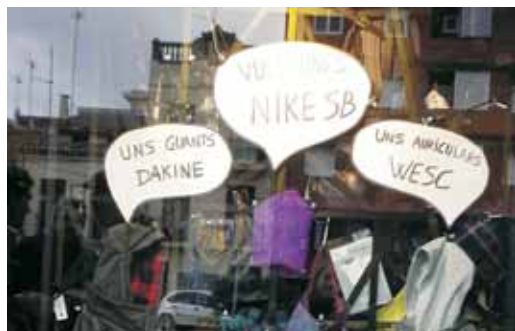
Shifty Freestyle, premiat al concurs d'aparadors