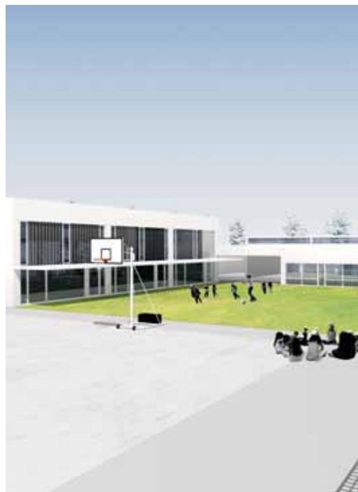
Imatge virtual del nou centre

El cos principal, destinat a les classes, comptarà amb tres plantes. A la planta baixa hi haurà tres aules d'educació infantil, la sala de psicomotricitat, la biblioteca i el despatx per a l'AMPA. A la primera planta hi haurà cinc aules de primària i diverses sales de reforç, i a la segona planta, tres aules de primària, l'aula de plàstica, la d'informàtica i la de música. Al seu costat hi haurà el cos destinat a cuina, menjador i espai de treball intern del professorat, i per acabar, l'espai que acollirà el gimnàs i els vestidors.