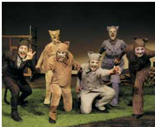
Els actors de "Gats"

La propera actuació del cicle, el 13 de març, també serà musical, amb "Nou pometes té el cançoner", de la companyia Samfaina Colors.