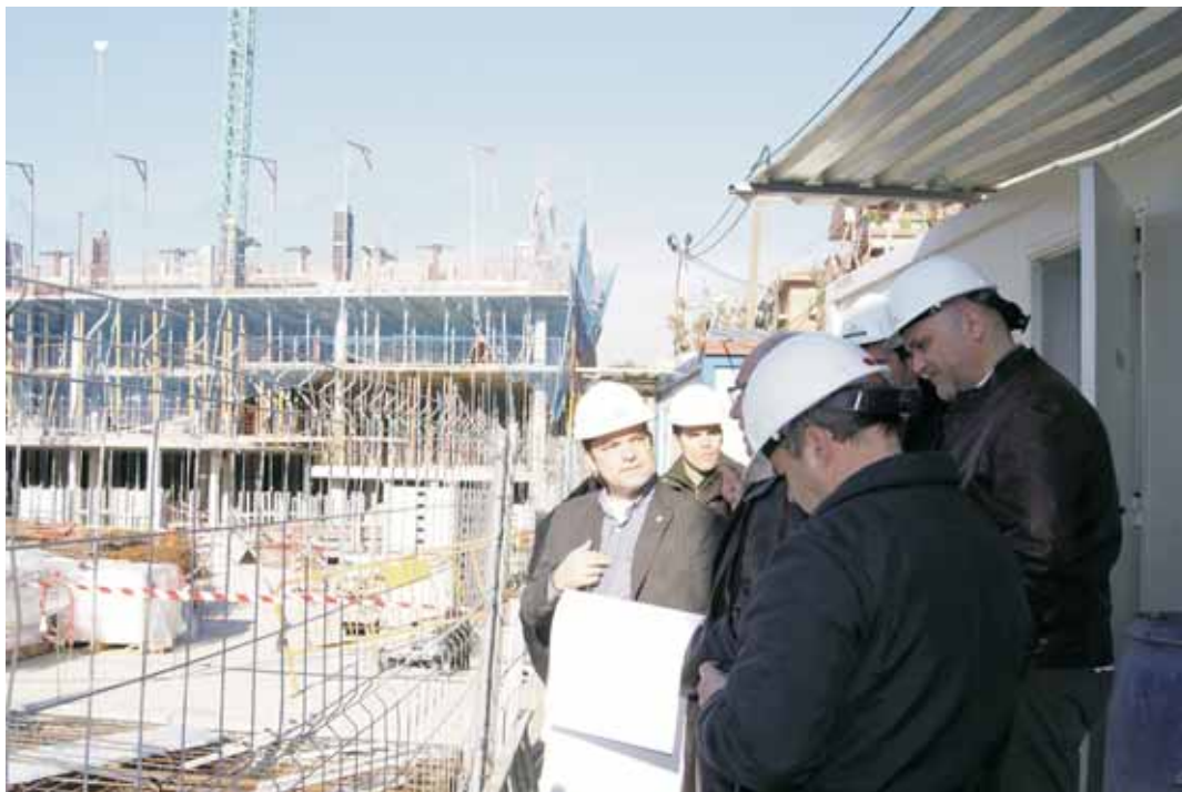
Alcalde i regidors en una visita d'obra al mes de gener

L'obra també preveu la urbanització de l'entorn amb noves voreres, més amples, als carrers que es troben dins de l'àmbit d'actuació, és a dir, Narcís Monturiol, Picasso, av. Montevideo i Mn. Joan Rebull.