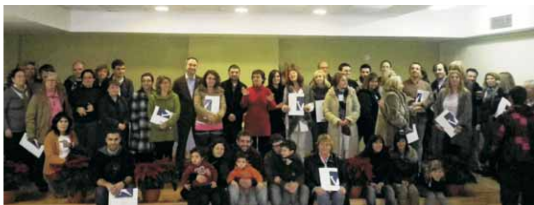
Grup de premiats amb vals de compra de 200 euros, acompanyats per l'alcalde, diferents regidors i membres de Vilassar Comerç

Vilassar Comerç ha repartit 4.000 euros en vals de compra durant la campanya comercial de Nadal, que també ha comptat amb altres activitats com ara el concurs d'aparadors entre les botigues, el trenet o la participació a la Fira de Nadal.