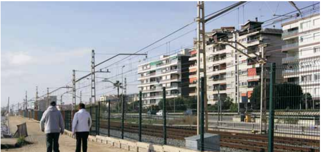
Tanques arranjades des de desembre

D'aquesta manera dóna resposta al requeriment de l'Ajuntament de Vilassar de Mar, que a través d'una carta al mes de juny li demanava amb urgència, per motius de seguretat, la reposició i arranament d'aquest espai. Adif ha substituït les tanques malmeses per unes de noves, i ha posat així solució a la situació de perillositat que s'havia creat en aquesta part del passeig, molt transitat per públic de totes les edats i a tocar del pas del tren.