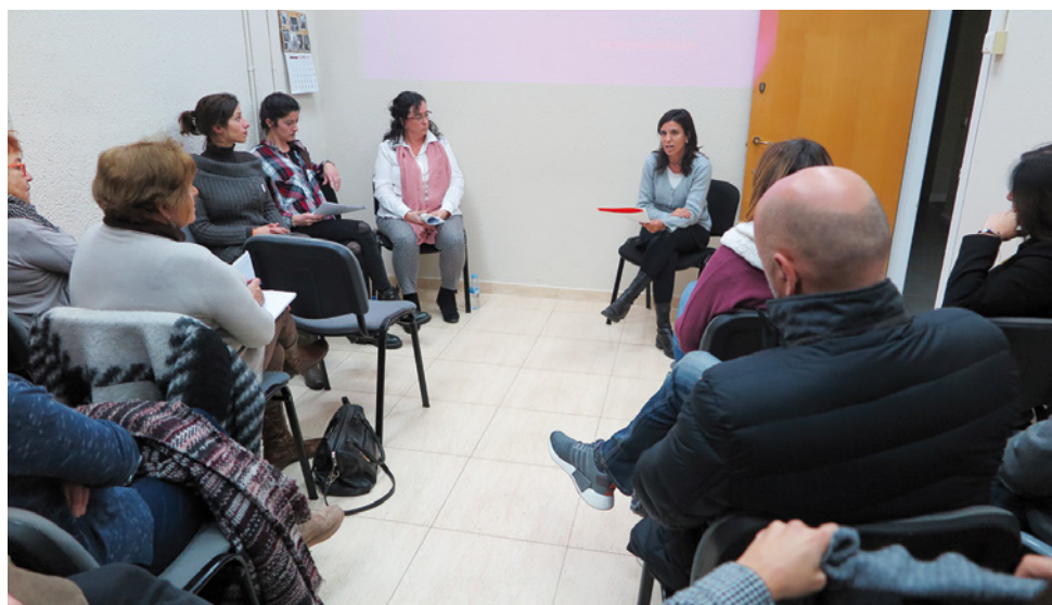
Presentació del SIAD el passat 13 de desembre

El SIAD té la seu a les dependències de Serveis Socials. Per a demanar hora es pot enviar un correu electrònic: siad@vilassardemar.cat o trucar al telèfon 93 754 05 00 (dilluns de 16 a 17 h, dimecres de 10 a 18 h i divendres de 9 a 13 h).