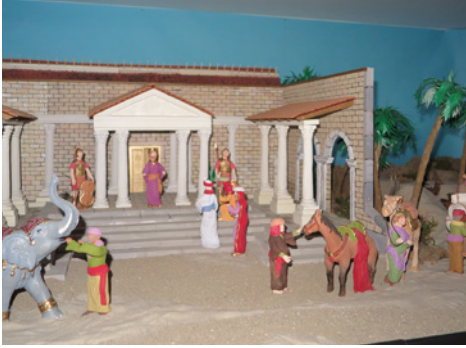
Part del pessebre monumental