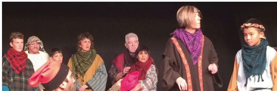
Enguany hi haurà les representacions d'Els Pastorets d'en Pàmies de la Tropa Teatre i de Nats el 51

L'Associació de pessebristes i modelistes de Vilassar de Mar té en marxa la 55a exposició de pessebres amb 12 diorames individuals i un de monumental amb el temple d'Herodes com a peça central. Es pot visitar fins al 7 de gener a la sala cultural M. Roser Carrau, els dies feiners de 17 a 20 h i els festius d'11 a 14 h i de 17 a 20 h. El 25 de desembre, dia de Nadal, romandrà tancada per la tarda.