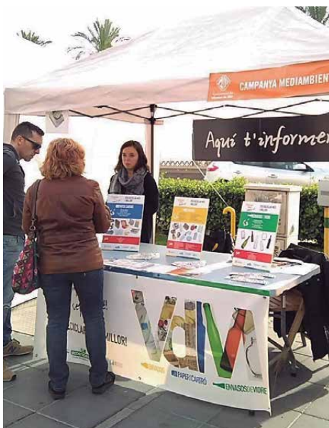
Carpa informativa a la Fira de Nadal

En el marc de la campanya "Per reciclar més i millor", que du a terme la Regidoria de Medi Ambient, 80 establiments comercials han rebut la visita d'un educador ambiental que els ha recordat les bones pautes de reciclatge. Entre els establiments que s'han visitat hi ha grans i petits comerços del poble com ara restaurants, bars, fruiteries, perruqueries, forns, carnisseries, escoles i farmàcies, entre d'altres. Els comerciants han vist amb bon ulls aquesta iniciativa i entre les principals consultes que s'han atès hi ha l'aclariment dels residus que van al contenidor groc, on a més de plàstics també es poden dipositar llaunes, plàstic film, envasos de iogurt i làctics i les seves tapetes així com el paper d'alumini. I és que, a més de millorar les pautes de reciclatge, un dels objectius prioritaris de la campanya és reduir els residus que es dipositen al contenidor que no correspon, el que es coneix com a impropis.