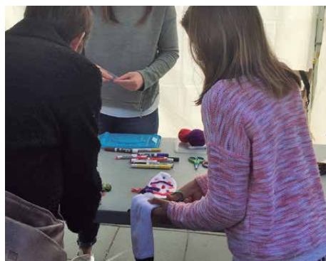
Taller de reutilització de mitjons

Dins la Fira de Nadal, Humana, amb la col·laboració de l'Ajuntament, va realitzar el taller educatiu de reutilització de roba per fer un titella a partir de mitjons que ja no es feien servir. L'objectiu era demostrar com es pot allargar la vida útil d'un mitjó, donant-li un nou ús abans que acabi en residu. Cal recordar que al poble hi ha 22 contenidors per a la recollida de roba usada de la Fundació Humana.