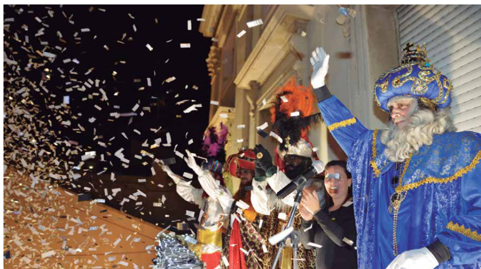
Els Reis d'Orient saludant des del balcó de l'Ajuntament (any 2018)

tural M. Roser Carrau, amb la pel·lícula Se armó el Belén . El 26 de desembre, a les 12 h, la Coral Englantina oferirà el seu concert de Sant Esteve a l'Ateneu Vilassanès i al vespre, al mateix escenari, s'estrenaran els Pastorets de la Tropa Teatre en la versió de Folch i Torres, uns Pastorets especialment emotius perquè enguany celebren el centenari. Es representarà en tres ocasions, el 26, el 29 i el 30 de desembre. Amb motiu del centenari, fins al 5 de gener es podrà visitar al vestíbul de l'Ateneu, l'exposició amb motiu dels 100 anys de Pastorets. A Vilassar de Mar, també es podrà gaudir de la versió dels Pastorets d'en Pàmies. La representarà l'associació Cultural Nats el 51 a can Madrona, el 12 i 13 de gener, a les 19 h i 18 h, respectivament. Per al dia 31 de desembre, la proposta del consistori per passar la nit de Cap d'any és la festa gratuïta que començarà a partir les 00.30 h, a l'envelat que s'instal·larà a la pista de l'escola Pérez Sala.