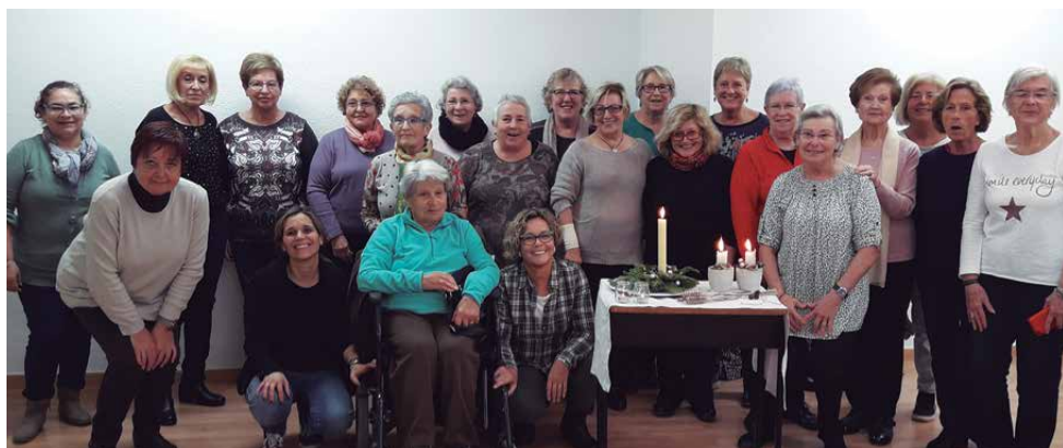
Taller "Decorem el Nadal"

d'activitats formatives que anirà de febrer a juny. Les inscripcions s'hauran de formalitzar del 14 al 18 de gener, a l'Escola Nàutica. N'hi ha moltes opcions i per a tots els gustos. Des de tallers de la memòria, d'anglès per a principiants o per aprendre el funcionament bàsic de telèfons mòbils fins al curs d'iniciació al patchwork, taller de mandales, música o fins i tot de riure. Es tracta d'activitats pensades per millorar la qualitat de vida de la gent gran, que han estat elaborades amb les aportacions i propostes de les persones participants.