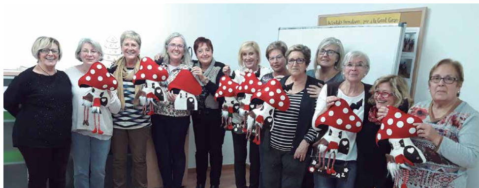
Taller de decoració nadalenca amb patchwork