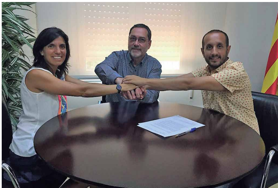
Fotografia d'arxiu de la signatura del conveni del 2017

L'Ajuntament de Vilassar de Mar i la companyia subministradora de l'aigua al municipi, Aigües de Vilassar, SLU, han signat un nou conveni de suport a famílies amb dificultats socioeconòmiques. L'aportació d'Aigües Vilassar és de 6.000 €, que se sumen als que ja té pressupostats l'Ajuntament en concepte d'ajuts d'emergència per a subministraments bàsics (aigua, llum i gas). Tots aquests diners pretenen evitar els talls de subministraments i donar un suport econòmic a aquestes llars.