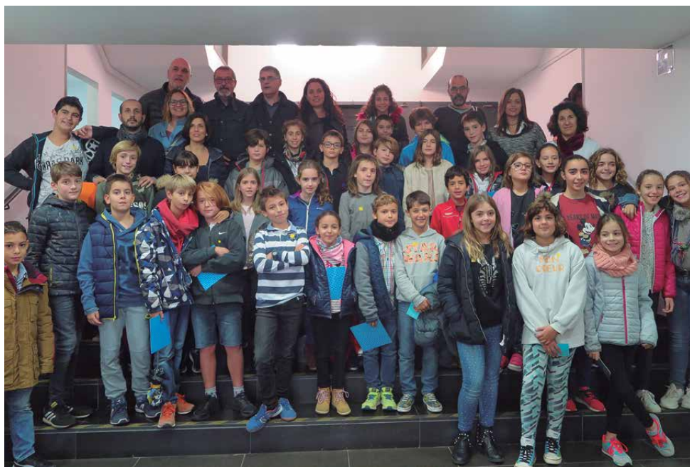
Els nous membres del Consell d'Infants acompanyats per regidors de govern i oposició de l'Ajuntament