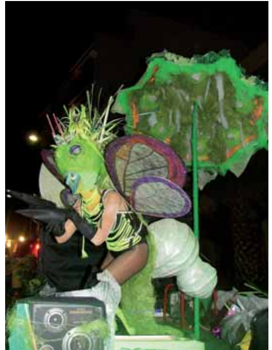
El segon premi (600 €) va ser per "Estem com un llum", cuques de llum. La candidata a reina d'aquesta comparsa, l'Al-lucinada, va ser escollida la Reina del Carnaval