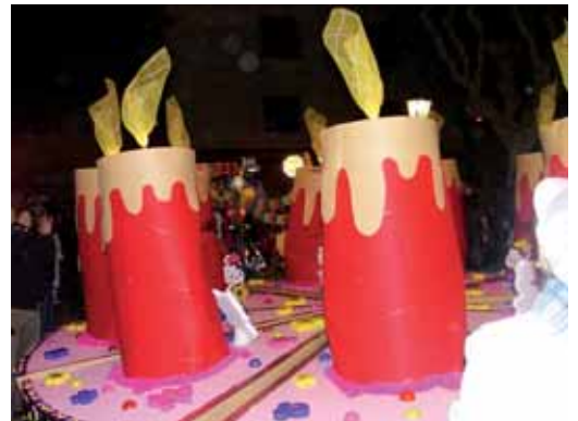
El tercer premi (500 €) va anar a parar a "Dolços del 55", la formació que anava disfressada de porcions de pastís d'aniversari