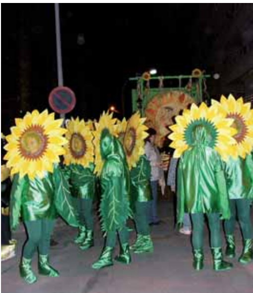
El cinquè premi (300€) va recaure en "Em pipats pel sol", que anaven de camps de gira-sols