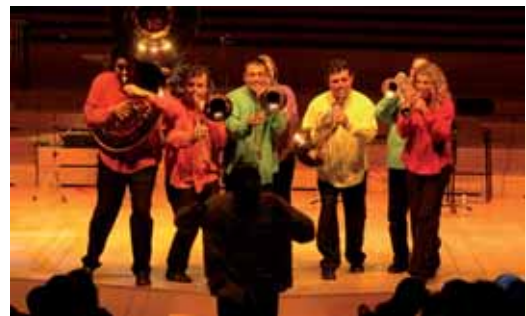
Els colors del metall

La propera actuació de la programació estable serà el 26 d'abril i també estarà especialment adreçada als infants amb el teatre “La bella i la bèstia” de la companyia Veus Veus.