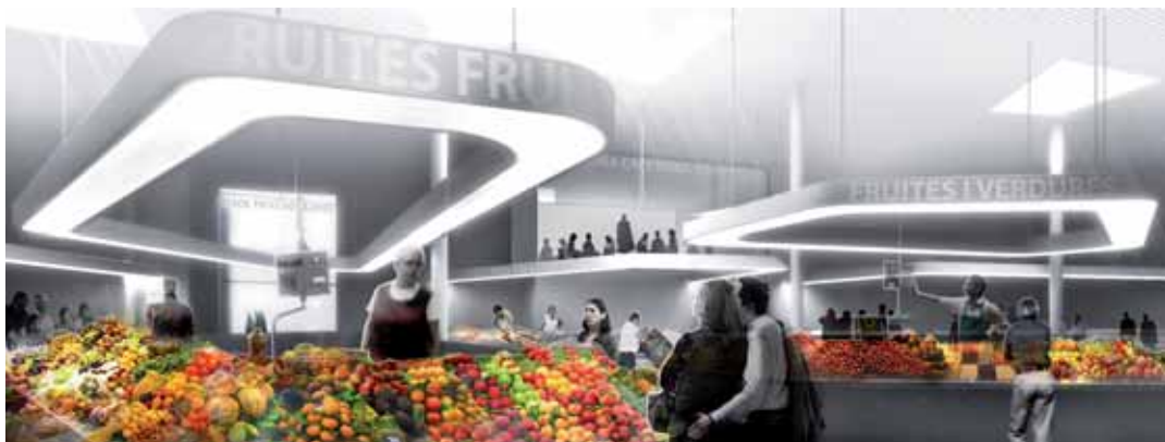
Imatge virtual interior del Mercat

amb els compromisos adquirits per l'Ajuntament amb els paradistes de l'antic mercat. El nou equipament modifica els conceptes d'organització, circulacions, serveis, il·luminació, accessos i aparcament de l'antic edifici. El nou edifici constarà de tres plantes subterrànies d'aparcament, una planta a nivell de la plaça pública que es farà davant del CEIP Pérez Sala, la planta del Mercat, una planta d'oficines i a sobre d'aquesta, 35 habitatges distribuïts en tres plantes. La proposta també contempla l'accés al Mercat des dels carrers Mn. Joan Rebull i Narcís Monturiol, l'avinguda Montevideo i també des de la plaça que es crearà per sobre del carrer Picasso. La sensació d'espai fosc i tancat de l'anterior Mercat serà substituïda per la de lluminositat i permeabilitat per tal que sigui un pol d'atracció per a compradors però també un recorregut alternatiu atractiu per a tothom.