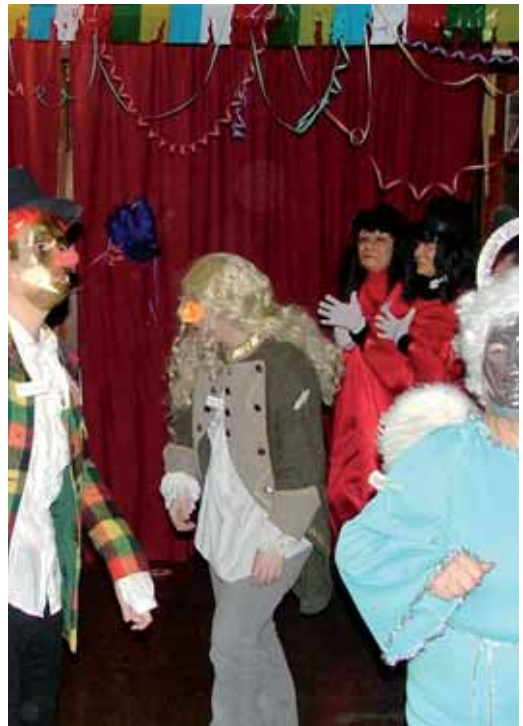
Una quarantena de persones van participar al Ball dels Mamarratxos, un acte tradicional dels anys quaranta i que enguany s'ha tornat a recuperar. L'objectiu dels participants: no ser reconeguts pels altres