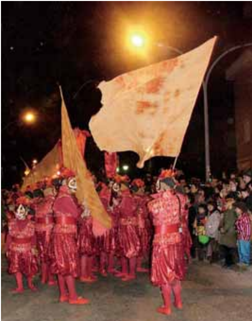
El primer premi (700 €) se'l va endur la comparsa "Samurais de foc" formada per 39 persones amb una vestimenta vermella molt vistosa, un maquillatge molt cuidat i banderes de grans dimensions