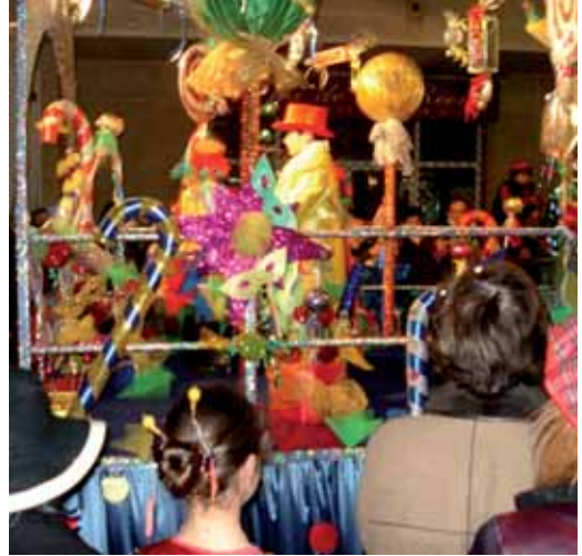
El premi Toni Linares (700€) va ser per a la comparsa "Gresca dolça" que portava una carrossa plena de colors amb dolços, llaminadures i piruletes gegants