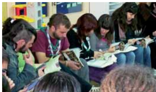
Un dels tallers de consum responsable

El 7 i 8 de març, més de 250 caps escoltes es van donar cita a l'Escola del Mar en el marc de la quarta edició de la Trobada de Formació d'Escoltes Catalans acollida per l'AE Intayllú i que comptava amb el suport de la regidoria d'Educació de l'Ajuntament de Vilassar de Mar. Entre d'altres activitats, els participants van aprendre a fer forns solars i van intercanviar experiències de consum responsable.