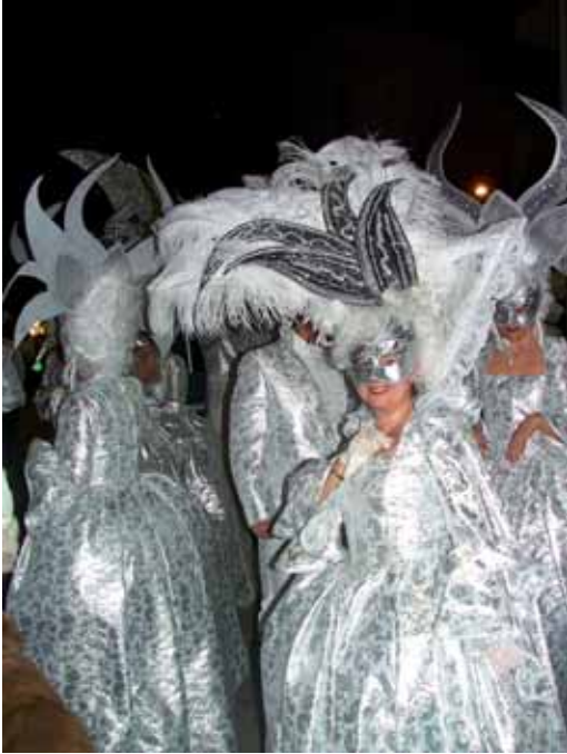
El quart premi (400€) va ser per a la comparsa "Som a la lluna de Venècia" fent al·lusió directa al Carnaval italià amb màscares venecianes i el color platejat com a distintiu