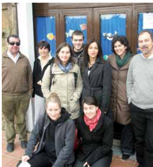
Reunió prèvia a la trobada

va celebrar els seus 15 anys d'història. Té la seva seu a can Gabernet, a la plaça Vicenç Casanovas, tot i que provisionalment i mentre durin les obres a la plaça, es troben a l'Escola Nàutica. Amb més d'un centenar d'infants i joves apuntats, organitzen diferents activitats i tallers per transmetre valors de solidaritat, respecte i estima a la natura. Compten amb el suport de la regidoria d'Educació de l'Ajuntament de Vilassar de Mar, que reconeix la gran tasca educativa que duen a terme amb els infants del nostre municipi, i els encoratja a seguir treballant en aquesta línia.