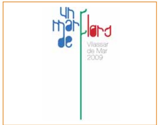
Logotip que serà la imatge de la nova edició del Vilassar, un mar de flors

Que els infants facin florir una planta a partir d'un esqueix que se'ls proporcionarà, per tal que llueixi per la mostra, i conèixer les flors de la mà del projecte educatiu "Les flors, font de cultura" són algunes de les propostes que es volen presentar a les escoles de Vilassar de Mar.