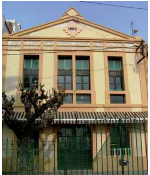
Façana de l'antiga Escola Bressol que es transformarà en un centre cívic

Entre els projectes, destaca la reforma i adequació de l'edifici municipal del Camí Ral, 19, que ocupava l'antiga escola bressol, que es torna a recuperar per al patrimoni municipal per destinar-lo a un centre cívic per a la gent gran. El nou centre, que substituirà l'actual que es troba als baixos del carrer Sant Pau, 22, serà molt més gran i comptarà amb tres plantes, ascensor i patis exteriors.