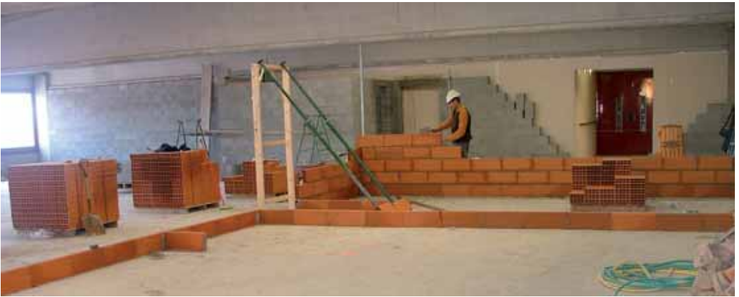
Obres per a la nova seu de la Policia Local

El passat 3 de febrer van començar les obres d'adequació de la primera planta de la nau de Serveis Municipals, al polígon industrial Els Garrofers, que passarà a ser la nova seu de la Policia Local de Vilassar de Mar. La previsió és que les obres estiguin enllestides en el termini de 9 mesos.