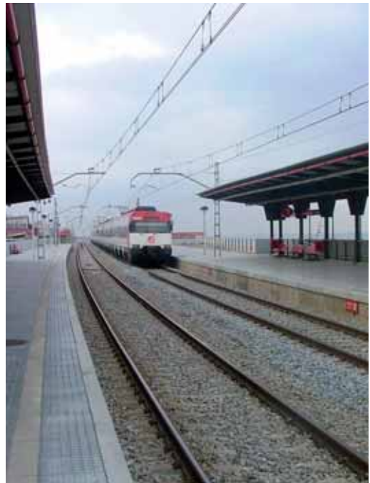
Estació de Cabrera de Mar - Vilassar de Mar

La línia C1 ha patit un canvi d'horaris amb un increment del temps d'espera de viatge de tres minuts de mitjana però, com a contrapartida, ha incrementat l'oferta de serveis a estacions com la de Cabrera de Mar, Montgat i Montgat Nord. Ara, tots els trens efectuen parada en aquestes estacions, cosa que comporta, segons informa Renfe, una freqüència d'un tren cada sis minuts en hora punta i un augment de l'oferta en més d'un 30%. Més informació al telèfon 902240202 o al web www.renfe.es .