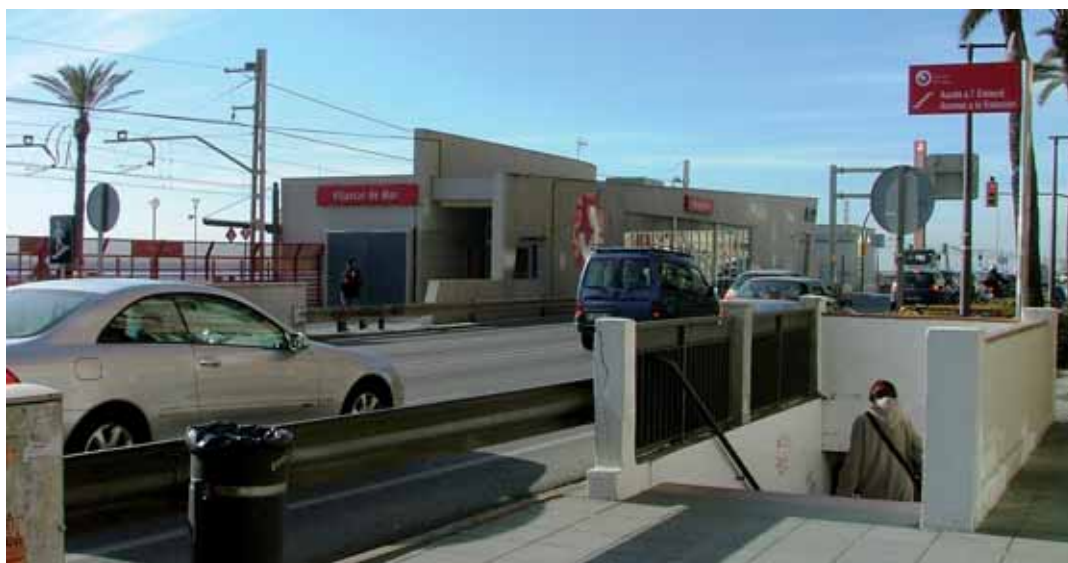
Accés del pas subterrani de l'estació de Vilassar de Mar

El Ministeri de Medi Ambient ha posat a licitació l'obra de prolongació del pas subterrani de Renfe fins al passeig Marítim. D'aquesta manera es desencalla un projecte que s'arrossegava des del 2003 i que permetrà fer un pas accessible per a persones amb mobilitat reduïda o que vagin amb cotxets de nens.