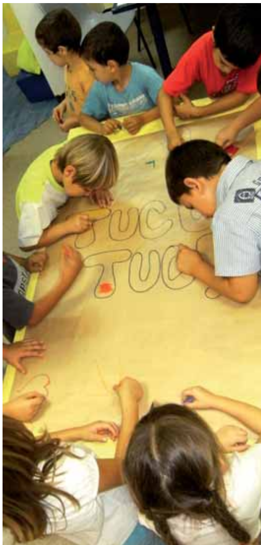
Activitats al Tucutuc.

D'altra banda, per tal de donar una millor atenció als veïns i veïnes del barri, s'unificarà la coordinació del PDC amb la del servei del Tucutuc, la biblioteca i ludoteca infantil que hi ha al barri.