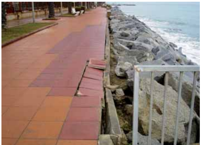
Tram dels passeig que va malmetre el temporal de Sant Esteve