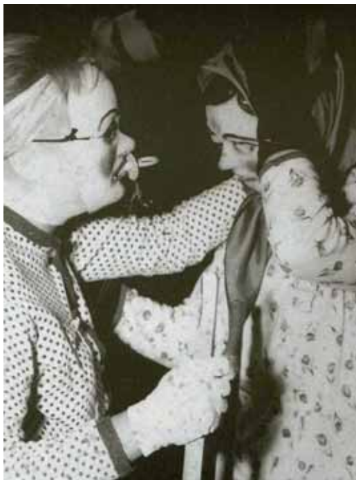
Imatges del llibre 'L'Abans', corresponents a l'any 1958

Aquest festeig, tradicional de finals dels anys quaranta, i que es va mantenir fins els anys seixanta, tenia com a principal objectiu que els participants no fossin reconeguts, deixant en segon pla l'originalitat o elegància de la pròpia disfressa.