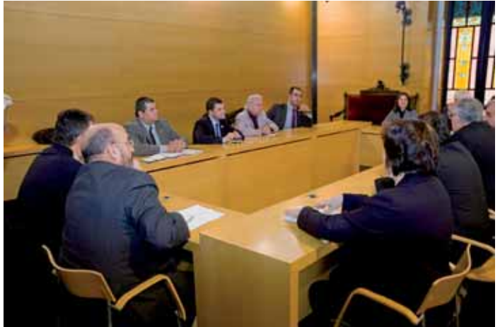
Reunió dels alcaldes amb el secretari del Mar.

Pel que fa al temporal de vent del passat 24 de gener, l'Ajuntament s'ha acollit a les ajudes extraordinàries que la Diputació de Barcelona ha ofert als consistoris dels municipis que van patir desperfectes ocasionats pel temporal de vent. El lloguer de maquinària i equips o honoraris extres són algunes de les despeses subvencionables.