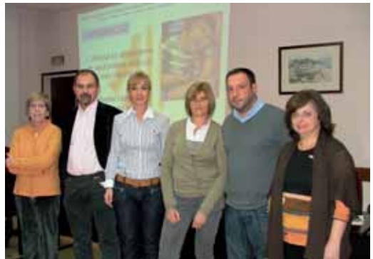
La regidora presenta l'estudi als directors de les escoles

de dades, es procedirà a tallar i pesar als alumnes i posteriorment es farà l'anàlisi estadístic. Amb les conclusions i resultats de l'estudi, l'Ajuntament tindrà la informació per planejar les actuacions que cal dur a terme per millorar, si és el cas, els hàbits alimentaris dels infants.