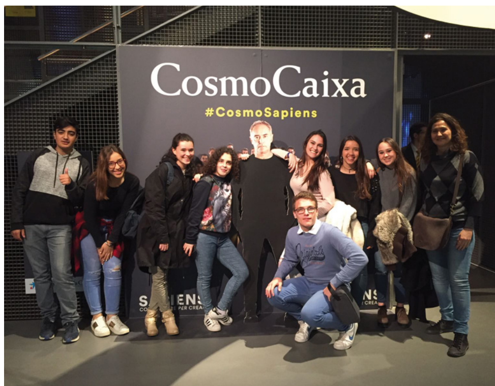
Sortida al CosmoCaixa, al març

i què ens agrada i què no", coincideixen. Tots els tallers s'han desenvolupat amb èxit i a alguns d'ells els ha servit per decidir sobre el seu futur professional i millorar les seves habilitats. Dels 9 participants, 6 han acreditat l'ESO. D'aquests, 4 cursaran un CFGM (Cures auxiliars d'infermeria, Atenció a persones en situació de dependència, Assistència al producte gràfic interactiu i Forneria, pastisseria i confiteria) i 2 faran batxillerat. Dels 3 que no han acreditat, un repeteix curs, un s'ha matriculat a l'Escola d'Adults per fer les matèries que li han quedat suspeses i un fa un CFGM d'Electromecànica de vehicles automòbils, ja que va aprovar la prova d'accés a CFGM.