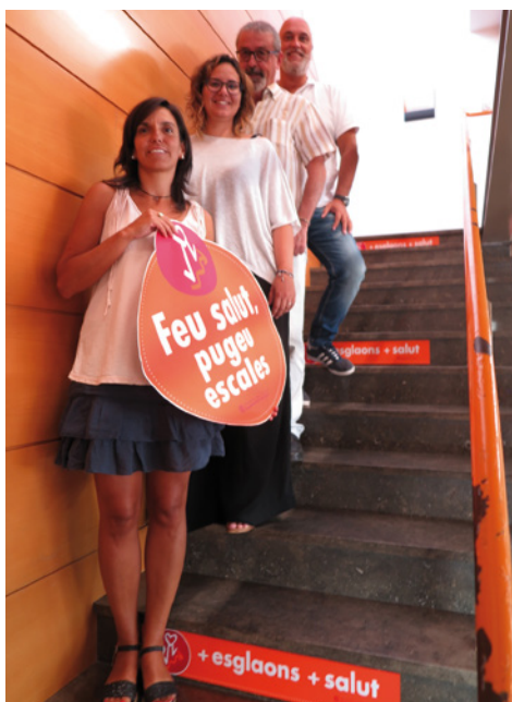
Regidores i regidors promociant la campanya