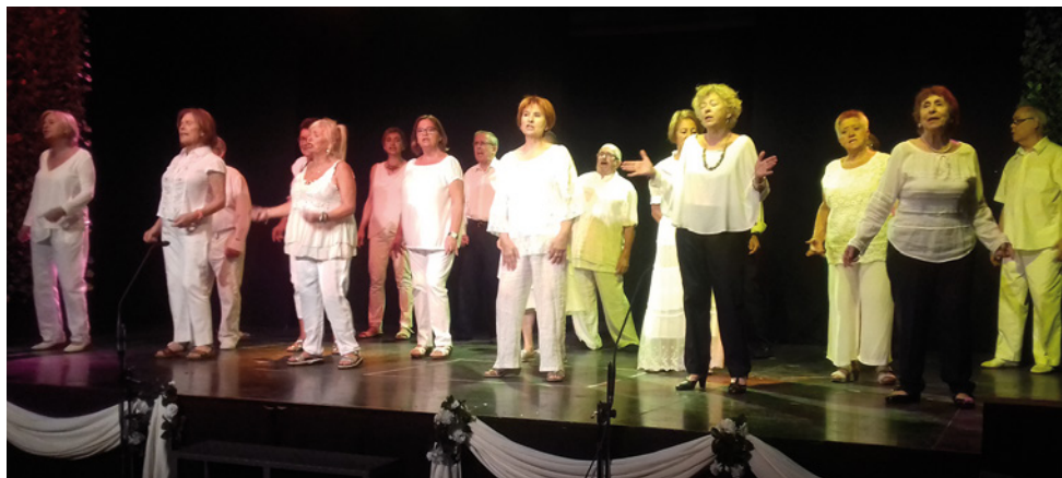
Edició anterior del taller "Això serà cosir i cantar"

Entre les novetats d'enguany s'inclouran dues xerrades, una el dia 26 per parlar de les aules d'extensió universitària i donar a conèixer l'oportunitat de seguir aprenent a edats avançades, i una altra el dia 28, dedicada a parlar dels maltractaments vers les persones grans. La part musical i artística també té un lloc important a la programació amb activitats del grup musical d'or o el festival de fi de curs "Això serà cosir i cantar". El primer representarà, en dues ocasions, els dia 23 i 24, Moments estel·lars dels musicals de Broadway , sota la direcció de Rafael Pugibet, amb fragments de Cabaret , El fantasma de l'òpera , Els miserables , Sister Act o My Fair Lady , entre d'altres. I el segon, l'1 d'octubre, servirà perquè l'alumnat que ha participat al curs ensenyi tot el que ha après: des de playbacks a cançons en directe passant per la poesia, el ball i el teatre-còmic. Totes dues activitats tenen el preu de 3 € i es faran a l'Ateneu Vilassanès. El musical d'or farà un representació extra el 25 de setembre amb una entrada a 5 € a favor d'Oncolliga.