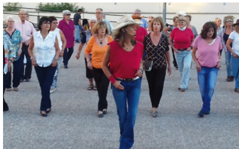
Taller de country

Són prop d'una vintena de cursos i tallers on no hi falten els tallers de la memòria, els d'informàtica, el de ganxet i mitja, el de country, el de marxa nòrdica o els de decoració nadalenca, entre