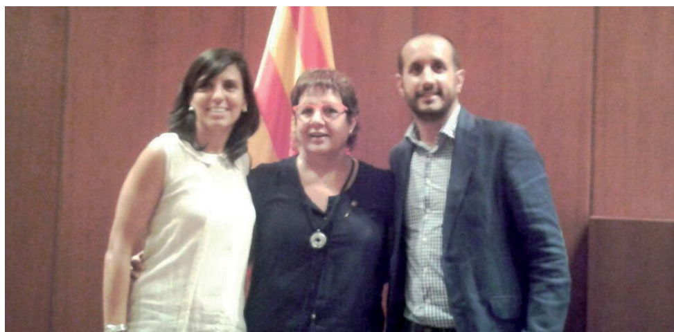
Els representants vilassarencs amb la consellera Dolors Bassa, a l'Auditori del Palau de la Generalitat

La consellera de Treball, Afers Socials i Famílies, Dolors Bassa, va anunciar que enguany la Generalitat de Catalunya ha incorporat quatre noves línies de col·laboració amb el món local. D'una banda, s'han afegit plans i mesures d'igualtat en el treball i plans i mesures d'igualtat per a les persones LGBTI i de lluita contra la LGBTIfòbia. D'altra banda, també s'han sumat al Contracte Programa línies de col·laboració per a l'impuls d'actuacions en matèria d'accessibilitat i d'associacionisme i voluntariat. En l'àmbit de l'accessibilitat, s'inclouen iniciatives com ara la formació als professionals o l'impuls de bancs de productes de suport. Pel que fa a l'associacionisme i el voluntariat, es duran a terme accions de promoció, sensibilització, suport, formació, assessorament i creació d'espais d'intercanvi de coneixement.