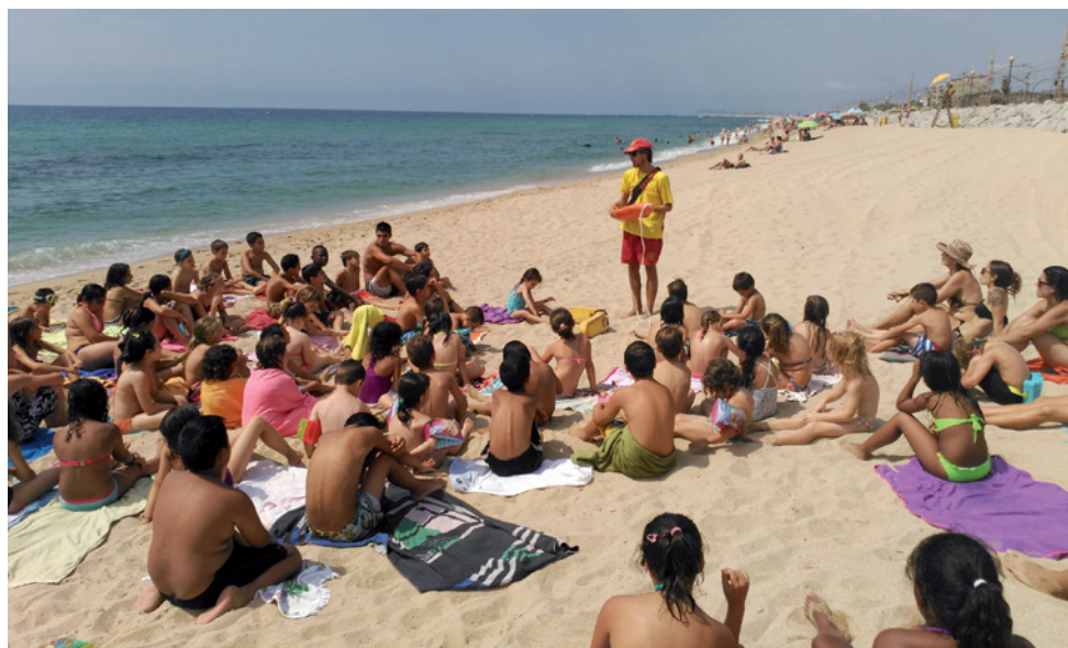
Tallers informatius als infants

persones, dues de les quals van haver de ser evacuades a l'hospital. Com a novetat, enguany es van posar tres línies de vida (cordes ancorades amb boies) -dues més que l'any passat-, per ajudar a les persones amb mobilitat reduïda o limitada a entrar i sortir de l'aigua. Estaven col·locades a l'alçada de la Riera d'en Cintet, l'espigó de Garbí i la Xinesca. També el personal del servei de socorrisme ha realitzat sessions de bany adaptat així com tallers informatius per als infants dels casals d'estiu.