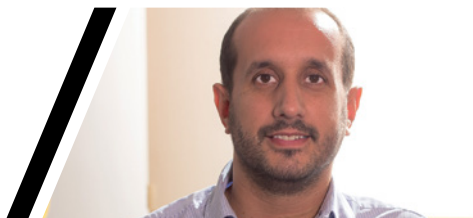
Damià del Clot i Trias Alcalde de Vilassar de Mar