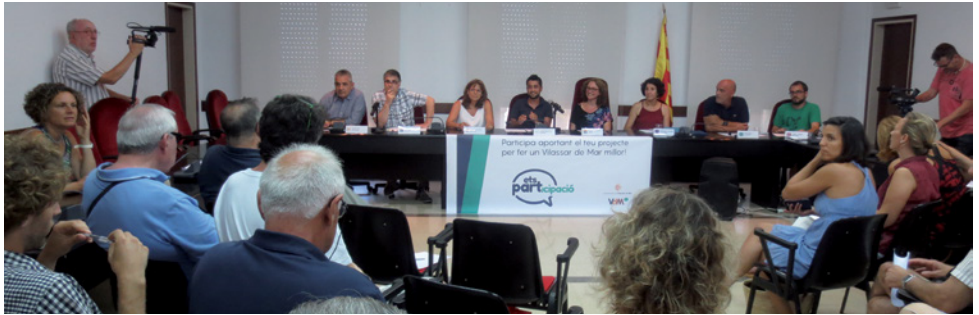
Presentació pública del procés de pressupostos participatius a la sala de plens

La ciutadania no ha deixat passar l'oportunitat de decidir en què invertir 92.000 € del pressupost municipal. El 5 de setembre es va tancar el termini de presentació de propostes a aquesta iniciativa que es fa per primer cop al municipi i es van rebre un total de 52. El 12 de setembre, les persones que havien presentat projecte i volien ampliar o aclarir algun punt al respecte el van explicar davant els vuit membres de la Comissió Pressupostos Participatius 2016. La llista definitiva dels projectes a votar però no es coneixerà fins al 30 de setembre, un cop els representants de la comissió de