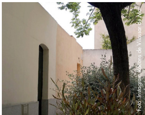
Qualsevol racó pot servir d'inspiració per al concurs

Racons de Vilassar de Mar i la Regidoria de Cultura posen en marxa el concurs d'imatge i relat Racons de Vilassar de Mar 2016. Del que es tracta és d'a partir d'un element arquitectònic del poble, realitzar una obra que estigui formada per un relat imaginari escrit i una imatge que la il·lustri. Tant el text del relat (prosa o poesia) com la imatge (dibuix, fotografia...) han de tenir l'element arquitectònic (carrer, plaça, casa...) com a fil conductor i protagonista. Cada participant podrà presentar un màxim de dues obres. El dia límit serà el 21 d'octubre i s'haurà de portar a la Regidoria de Cultura, de dilluns a divendres, de 8 a 15 h a l'Espai Cultural Can Bisa. Totes les obres portaran un títol i un pseudònim per ser identificades. Hi haurà tres premis de 200 €, 150 € i 100 € i un premi especial per a menors de 16 anys, que consistirà en una càmera digital compacta. Una selecció de les obres presentades formarà part de l'exposició