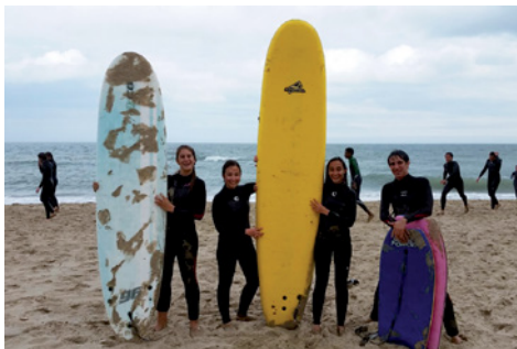
Els alumnes premiats practicant paddel surf

ara Kilkenny, són els que més han cridat la seva atenció. La beca, organitzada per la Regidoria de Joventut, premia així els joves de segon de batxillerat dels dos instituts amb les millors notes de l'expedient acadèmic.