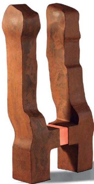
Nivell 1 (acer, metacrilat i llum 57 x 30 x 12 cm)

"El buit és una energia que interactua amb la matèria, de fet li dona sentit". Amb aquesta premissa neix l'exposició de Martí Morros, que veu en l'escultura la incansable recerca de la forma sobre el buit. La mostra estarà formada per nou peces d'acer i metacrilat. "És el buit qui decideix si dos cossos són una mateixa obra o diversos cossos, un conjunt", afirma l'artista. Morros té previst fer un dia (encara per concretar) una xerrada col·loqui sobre l'escultura i què pot aportar social i culturalment.