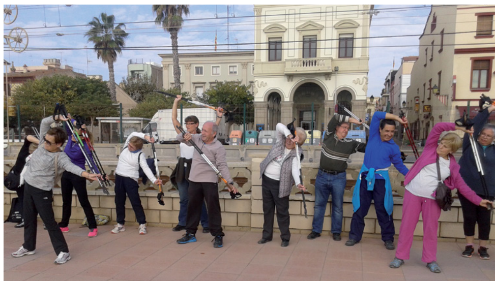
Taller de marxa nòrdica

tat física, la cognitiva i la de lleure. Entre les novetats hi ha un taller de ball en línia per aprendre a ballar ritmes dels diferents continents: salsa, funky... I per Nadal, al tradicional taller floral s'afegeix un de patchwork dedicat específicament a les decoracions nadalenes.