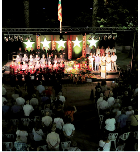
Final dels actes de la Diada