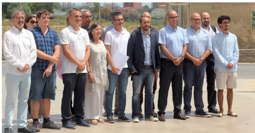
Els alcaldes i els regidors i tècnics d'Urbanisme dels sis consistoris signants

està integrada per cinc punts. En el primer, els consistoris proposen, en l'àmbit dels espais agrícoles industrials, establir unes directrius comunes de regulació que siguin compatibles amb la preservació de l'entorn, que alhora permetin un desenvolupament i impuls de l'activitat econòmica agrícola i industrial i també avaluar com harmonitzar les ordenances municipals. En el segon punt, els consistoris avaluaran quin ha de ser l'instrument urbanístic més adequat per regular les activitats agrícoles i industrials d'aquesta zona. En el tercer, els ajuntaments es comprometen a destinar els recursos econòmics i tècnics que tinguin al seu abast per fer realitat la millora dels vials de la zona i la comunicació entre els municipis. Pel que fa al quart punt, es marca com a objectiu coordinar una estratègia comuna per atreure inversions que dinamitzin l'espai industrial de la zona, crear llocs de treball i desenvolupar una xarxa d'activitat econòmica conjunta. El cinquè punt assenyala com a objectiu preservar, protegir, conservar i millorar la natura i el territori.