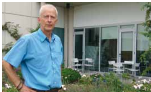
En Neil s'ocupa del jardí interior de la Biblioteca i d'un grup de conversa en anglès

Des de la biblioteca recorden que també hi ha voluntaris disposats a portar llibres a casa de persones amb mobilitat reduïda o per fer lectura en veu alta a domicili de persones que tinguin poca o nul·la visió, només falten usuaris que demanin aquest servei per posar-lo en marxa.