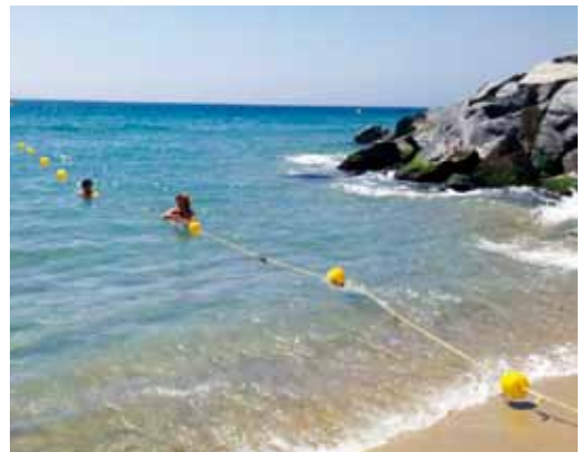
Enguany es va posar una línia de vida per ajudar a sortir de l'aigua

La temporada es resumeix en 179 assistències i 773 accions preventives, és a dir, recomanacions a banyistes per evitar accidents. El nombre d'assistències ha augmentat respecte l'any passat en 62, però també ho ha fet el nombre d'usuaris a les nostres platges. D'entre les assistències, 128 han estat per picades de medusa, 110 d'elles concentrades durant el mes d'agost per l'augment de la temperatura de l'aigua, 19 per altres picades o al·lèrgies, 18 per ferida incisa i 5 per ferida contusa. Un altre fet que ha caracteritzat la temporada de bany ha estat el predomini de la bandera verda i l'absència de la bandera vermella, que no s'ha hagut de posar cap dia.