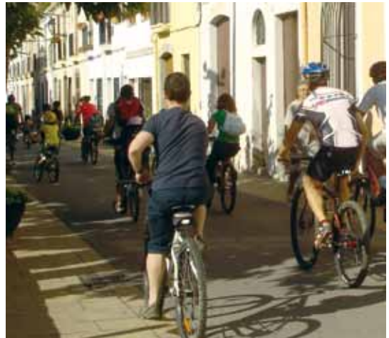
Pedalada de l'any passat

Es recomana a tothom que porti aigua i que, qui en tingui, també porti armilla reflectant. Aquells que no tinguin bicicleta poden contactar amb la botiga Corriol (tl. 937593433) que col·labora en l'esdeveniment facilitant bicis als que no en tinguin (el nombre de bicicletes és limitat).