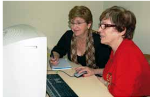
Fent classe d'informàtica

reduïda llibres o altres documents de la biblioteca o bé fer lectura en veu alta a domicili a persones amb poca o nul·la visió.