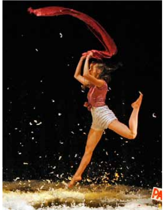
Happy ha ha

El segon espectacle programat és "Lluna d'estiu", teatre, música i narració de la companyia Teatre de Butxaca, pensat per a un públic adult. Es representarà l'11 de novembre, a les 7 de la tarda, a la sala Roser Carrau, amb el poemari del mateix títol de Jordi Pàmias i la música de David Pradas. Al desembre, s'han programat dos espectacles a l'Ateneu Vilassanès. El primer, el dia 2, amb la música de la Big Band Jazz Maresme que començarà a les 7 de la tarda, i el segon, el dia 16, a 2/4 de sis de la tarda, que portarà a l'escenari l'obra "Conte de Nadal" de la companyia de teatre Sim Salabim.