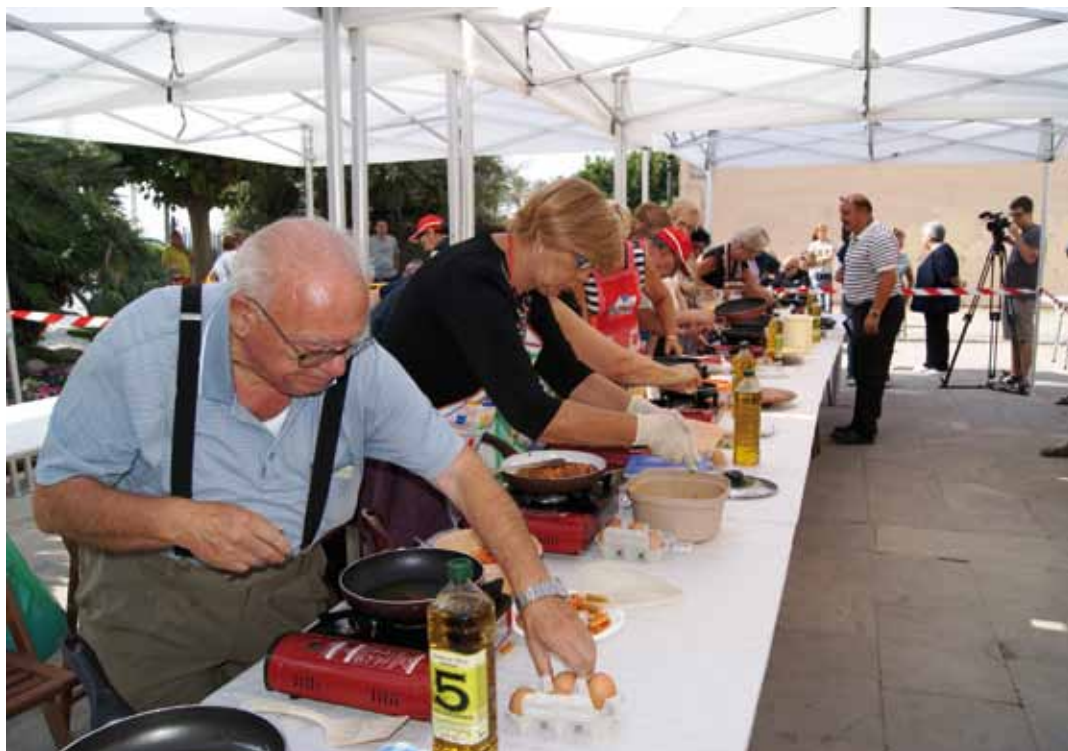
El concurs de truites sempre atrau molts participants