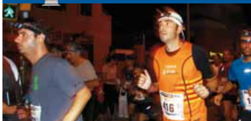
Cursa Marrec Atac - Cursa Burriac Atac

Podeu veure la notícia a VdM'TV: http://tv.vilassardemar.cat