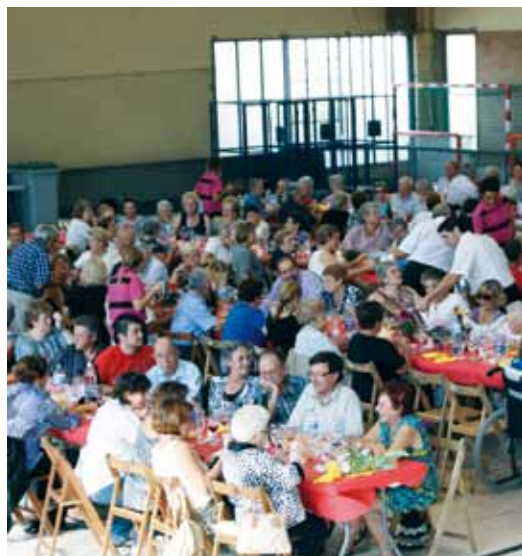
Dinar de germanor

La Setmana de la Gent Gran portarà altres activitats ja consolidades com són les jornades de portes obertes a les diferents residències per a la gent gran que hi ha al poble, les festes als centres cívics, els campionats de petanca, botifarra, escacs i dòmino o el concurs de truites, que enguany arriba a la sisena edició. Tampoc faltaran les havaneres, el programa especial de Vilassar Ràdio en directe des de la plaça de l'Ajuntament el dia 28 de setembre i la missa o el dinar de germanor, que posarà el punt i final a la celebració.