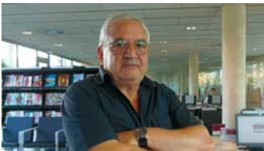
L'Òscar va fer un taller de fotografia