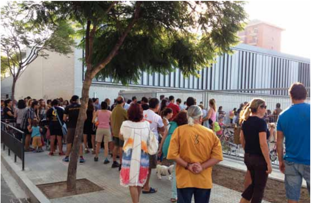
Exterior de l'escola els Alocs el primer dia de classe

La Bressoleta, l'escola bressol municipal que compta amb dos centres, va obrir portes els dies 6 i 7 de setembre amb un total de 243 nens i nenes matriculats i totes les places disponibles cobertes. Pel que fa a l'Escola Municipal d'Adults "Els Ametllers" les classes començaven oficialment el dia 19 de setembre.