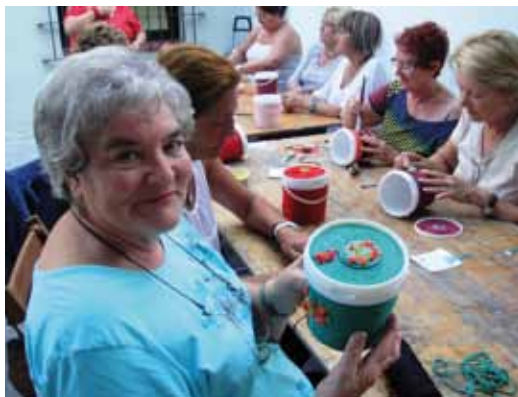
Taller de manualitats

Enguany l'homenatge a la gent gran del poble coincideix amb l'any europeu de l'envelliment actiu i la solidaritat entre generacions, motiu pel qual algunes de les activitats programades vinculen avis amb infants, diferents generacions que poden aprendre una de l'altra. És el cas dels nens i nenes del club de lectura infantil de la biblioteca que el dia 26 de setembre llegiran textos sobre avis i néts o el taller del dia 29 de setembre que permetrà que els néts ensenyin als seus avis a fer servir el Facebook. D'altra banda, l'intercanvi d'experiències també es veurà reflectit amb la rebuda de la gent gran del casal de Navàs, responent així a la visita que els vilassarencs els hi van fer al mes de maig.