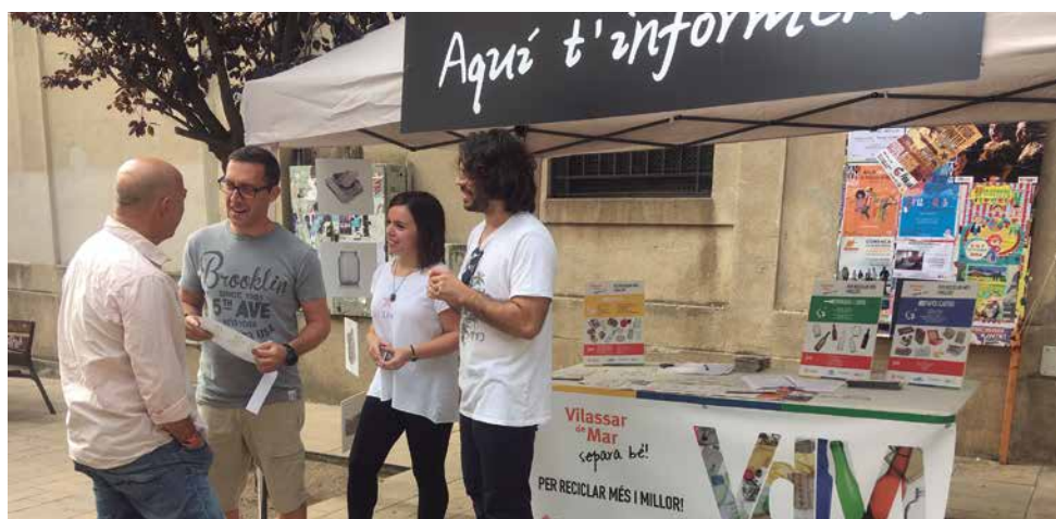
Parada informativa al carrer Sant Joan, el 6 i 7 d'octubre

Els propers 1 i 2 de desembre, coincidint amb la Fira de Nadal, tornarà al carrer la carpa informativa. L'empresa Solucions Medioambientals Assessors, SL de Mataró ha estat seleccionada per realitzar la campanya, que compta amb els ajuts que Ecoembes i Ecovidrio destinen als ens locals segons el conveni marc amb l'Agència de Residus de Catalunya (ARC) per realitzar campanyes de sensibilització i promoure la separació activa dels residus domèstics a les llars i als comerços.