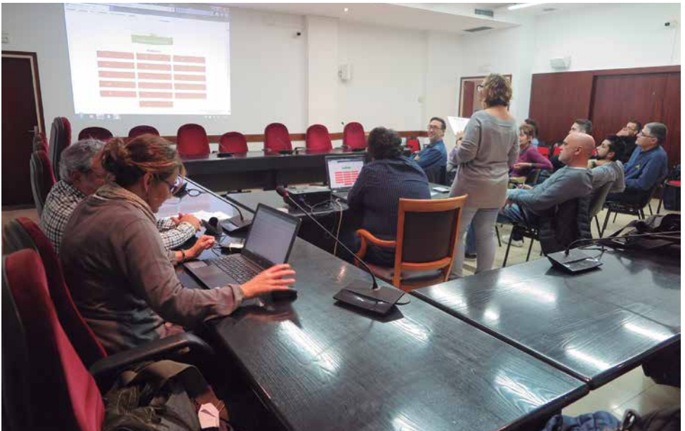
Sorteig públic per designar els membres de la Comissió de Pressupostos Participatius

El 7 de novembre es va realitzar el sorteig públic per designar els membres de la Comissió de Pressupostos Participatius de 2019. Fins ara, aquesta comissió que vetlla pel bon funcionament de tot el procés de pressupostos participatius, estava formada per representants polítics i en aquesta nova edició s'ha volgut obrir també a tota la ciutadania. El sorteig es va fer entre les persones inscrites al Registre de persones interessades en els processos de participació, un total de 191.