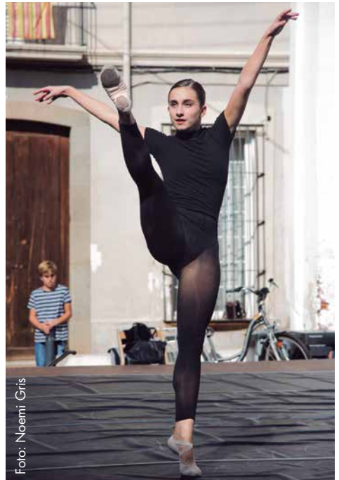
OFF-ZERO de dansa

Des dels seus inicis ha evolucionat i s'ha transformat donant lloc a diferents espais de creació i trobada, el 2017 va esdevenir Plataforma Zero per oferir oportunitats de professionalització a la joventut amb interès per disciplines artístiques. Al 2018 s'han realitzat dues mostres temàtiques anomenades OFF-ZERO, de teatre al maig i de dansa a l'octubre, on han assistit més de 900 espectadors i més de 100 artistes joves.