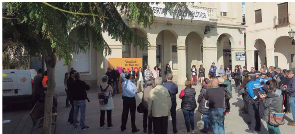
Lectura del manifest, l'any passat

econòmica, psicològica, física i sexual. A més, al novembre es compleix un any de la posada en funcionament del SIAD, un servei de titularitat municipal, que garanteix l'accés de totes les dones a la informació, l'orientació i l'assessorament en totes aquelles qüestions que puguin ser del seu interès: àmbit laboral, social, personal, familiar, recursos públics i altres, fent especial atenció a la detecció de la violència masclista. Des del novembre del 2017, el SIAD ha atès 115 dones, de les quals 60 estan actualment en seguiment. En total ha fet 158 atencions distribuïdes de la següent manera: 93 atencions psicològiques, que tenen l'objectiu de realitzar un acompanyament en situacions de crisi personal i fomentar les competències comunicatives, 31 atencions jurídiques, amb la finalitat d'assessorar la dona en situacions de crisi de parella, processos d'incapacitació, custòdia dels fills i filles i orientació en temes de caire legal, i 34 primeres acollides o seguiment a la dona amb l'objectiu de realitzar contenció emocional i seguiment de la seva demanda.