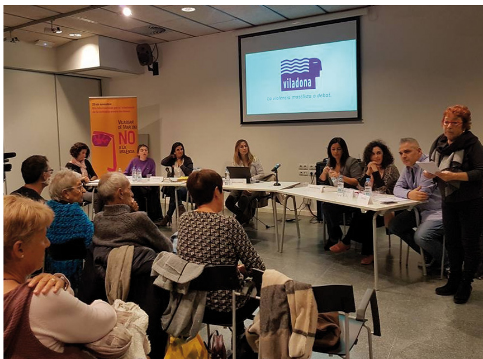
Taula rodona organitzada el 10 de novembre per Viladona sobre la violència masclista amb els regidors i regidores dels grups municipals del consistori

Al desembre, el dia 13, l'Ajuntament té previst presentar el Servei d'Informació i Atenció a les Dones (SIAD), un servei municipal que oferirà informació, assessorament i formació sobre tots aquells temes que poden ser d'interès per a les dones de Vilassar de Mar.