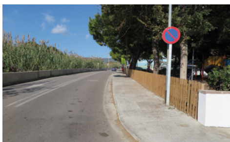
Vorera ampliada a la Ronda Vilassar