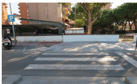
Santa Eugènia/ Ronda Vilassar