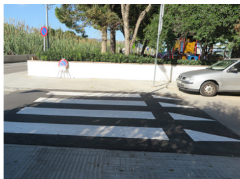
Santa Maria/Ronda Vilassar

espai del parc Notari Arús, adequant-se així a camí escolar. També s'ha actuat a quatre confluències de carrer: a la del Torrent d'en Cuyàs amb Maria Vidal (costat muntanya) i a la de Santa Maria amb Ronda Vilassar s'han fet passos de vianants elevats, mentre que a la de la Ronda Vilassar amb Maria Vidal (costat muntanya) i a la de Santa Eugènia amb Ronda Vilassar (costat mar) s'han ampliat les voreres i incorporat peces de gual de rebaix per a vianants. El pressupost de l'obra ha estat de 44.252 euros.