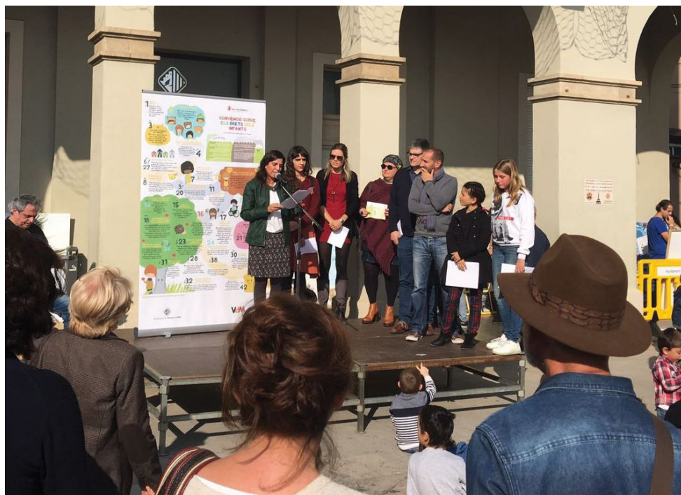
Parlaments institucionals de presentació del Consell d'Infants

El 19 de novembre l'Ajuntament va celebrar el Dia Internacional dels Drets de la Infància amb un acte públic a la plaça de l'Ajuntament per commemorar l'efemèride i fer la presentació en societat del procés de creació del Consell d'Infants. Entre les diferents activitats, es van recollir els desitjos i expectatives d'infants i adults al voltant de temes relacionats amb els drets dels infants. Precisament, per donar a conèixer els drets dels infants l'Ajuntament ha elaborat un tríptic que recull els principals articles de la Convenció dels Drets dels Infants, l'acord internacional que reconeix els drets i obligacions dels infants i que va ser aprovat el 20 de novembre de 1989. El podeu consultar a continuació.