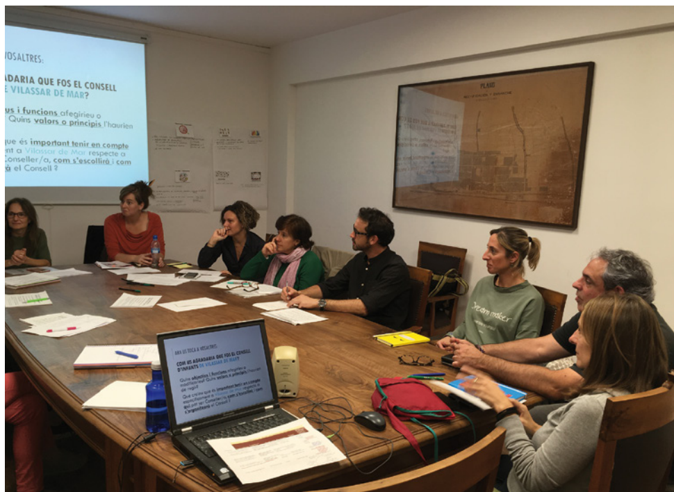
Tallers amb diferents agents del municipi i organitzacions socials i educatives dedicades a la infància

El calendari previst treballa perquè al desembre es pugui fer el procés electo-