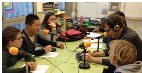
Gravació de la primera tertúlia de l'Aula d'Impuls

Els nois i noies amb necessitats educatives especials derivades de discapacitats físiques o psíquiques poden escolaritzar-se a les Unitats de Suport a l'Educació Especial (USEE) que hi ha als centres ordinaris, un recurs per tal que aquests alumnes puguin seguir una escolaritat inclusiva. L'institut Pere Ribot és el tercer any que té una USEE, que al centre han rebatejat com a 'Aula d'Impuls'. Des de l'institut van demanar la col·laboració de Vilassar Ràdio i a través del magazine matinal Parlant de tot es faran tres tertúlies amb els alumnes que hi formen part. "Volem que els nois i noies que reben el nostre suport tinguin la màxima inclusió a l'aula ordinària, però també els volem proporcionar experiències que els impulsin cap a l'autonomia i una vida activa dins la societat", explica una de les tutores de la unitat. La primera tertúlia es va gravar a l'institut i estava previst que s'emetés per ràdio el dia 21 de novembre a les 10.30 h, la segona s'emetrà al de-