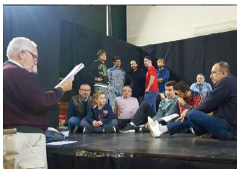
Assajos de La Tropa