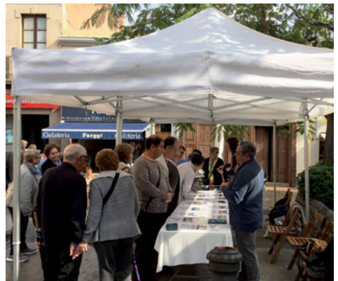
Els dies previs a les votacions es van instal·lar carpes informatives