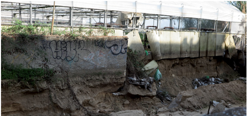
La Riera d'en Cintet, una de les més afectes pels aiguats

Pel que fa als equipaments, destaquen els 250.000 € per arranjar els desperfectes soferts al Pavelló Municipal d'Esports Paco Martín, els 100.000 € del cementiri i els 60.000 € de la Bressoleta de l'avinguda Montevideo, al Barato. Des de l'Ajuntament, s'han sufragat les actuacions més urgents entre les quals hi ha la retirada de fang i sauló dels vials inundats, rescat de vehicles a la platja, desembussat de clavegueres o canvi de paviments afectats en els equipaments. Vilassar de Mar ha sol·licitat ajuts econòmics a la Diputació de Barcelona, la Generalitat de Catalunya i al govern estatal. El quadre resum de l'informe de danys es pot consultar al web municipal www.vilassardemar.cat .