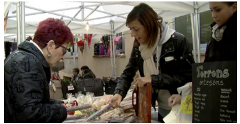
Edicions anteriors de la Fira de Nadal

des, productes exclusius i de producció local. D'altra banda, l' associació Vilassar Comerç ja té dissenyada la campanya nadal·lenca amb animacions al carrer, regals i sorpreses. Enguany sortejaran un viatge a Lapònia i dos talonaris de 1.000 i 500 € en compres a botigues associades. A més, a partir del 17 de desembre tornarà el trenet de Nadal amb sortida i arribada al Veral de l'Ocata.