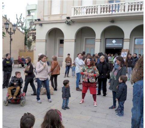
El darrer dia de votacions es va fer una festa a la pl. de l'Ajuntament