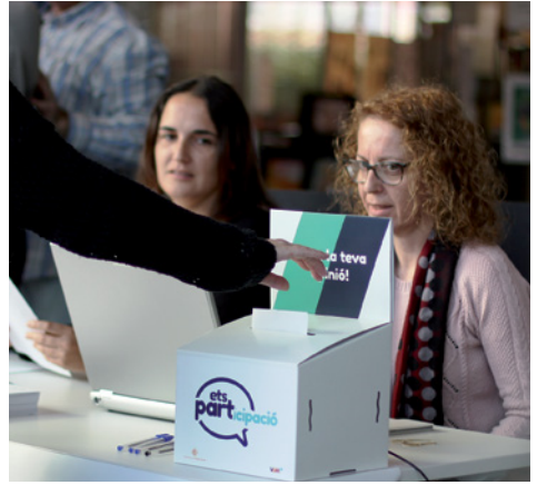
Es van fer tres dies de votacions