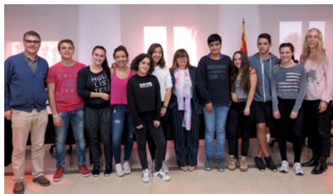
Acte de signatura dels convenis amb l'alumnat participant

administració (Serveis Territorials Municipals), atenció sociosanitària (Casal de Curació), comerç (llibreria Índex, floristeria Blanc Estudi Floral, sabateria Zamora i XAPo), perruqueria (perruqueria Elena i perruqueria Carles Selva), restauració (restaurant el Terral), pastisseria (Sweet 180°), xarcuteria (can Pocurull), alimentació ecològica i dietètica (Manduka), mecànica de bicicletes (Corriol) i planxa i pintura (Rocauto). Els alumnes, durant el curs escolar, realitzaran tres d'aquests tallers.