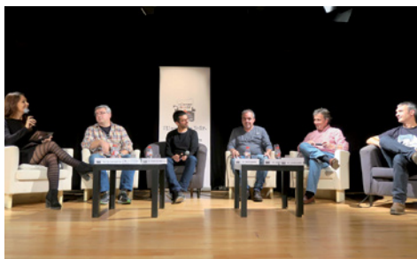
Una de les taules d'autors

coneguts autors i autores que, a través de taules rodones, xerrades i tallers, van analitzar el gènere negre des de diferents manifestacions artístiques: literatura, còmic, música i cinema. Des de l'organització han avançat que de cara a l'any vinent es potenciarà la part audiovisual.