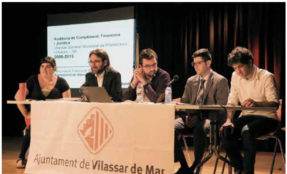
Integrants dels Col·lectiu Ronda durant la presentació

de defecte de forma. Des del Col·lectiu Ronda van recordar que cada projecte ha requerit una anàlisi particular però que hi ha tres irregularitats molt greus, que serien de semàfor vermell, comunes a tots els projectes: la primera, la manca d'una encomana de gestió per part de l'Ajuntament amb un expedient administratiu que expliqués perquè se li encarregava a la SA la gestió dels projectes; la segona, que totes les licitacions s'haurien d'haver publicat en el Diari Oficial de la Unió Europea (DOUE) perquè era un requisit inexcusable de publicitat; i la tercera, la llei de contractes exigia un informe de l'Ajuntament de la necessitat de licitar aquella obra o servei. El document complet de l'auditoria així com el resum de la presentació que va fer el Col·lectiu Ronda es pot consultar al web vilassardemar.cat .