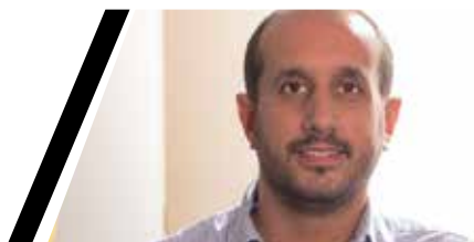
Damià del Clot i Trias Alcalde de Vilassar de Mar