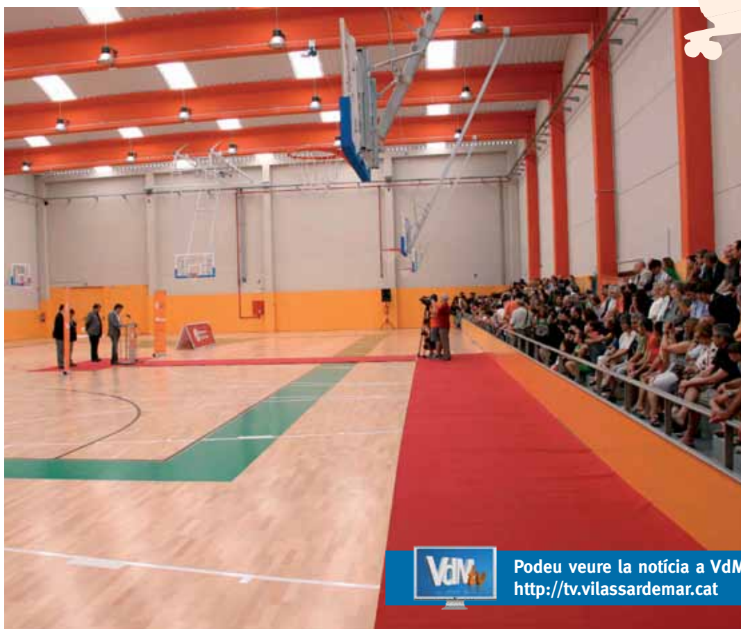
Interior del pavelló, el dia de la inauguració