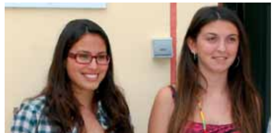
Les premiades de l'edició d'enguany

nologies http://vilassardemar.wordpress.com , on cada jove explicarà les seves experiències.