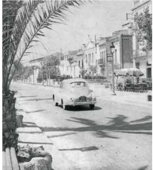
Un dels negatius del Fons Germans López Teixidó

Aquesta digitalització ha estat possible gràcies a l'establiment d'un conveni amb Emser@m, SL, que s'ha compromès de manera voluntària i gratuïta a realitzar aquesta tasca, que garantirà una millor conservació del fons, facilitarà les consultes per part d'estudiosos i farà possible que les reproduccions siguin més àgils i segures.