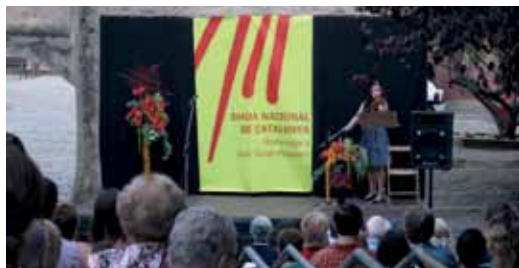
El recital de l'any passat a la Torre d'en Nadal

La Regidoria de Festes Populars, encarregada de l'organització de la programació dels actes que commemoren la Diada, enguany vol fer arribar les activitats al major nombre de públic possible. Per això, a més d'ampliar els actes, també ha canviat horaris. El més significatiu és el de l'acte institucional al jardí del Museu de la Marina, que tradicionalment es celebrava al migdia. Enguany passarà a celebrar-se a les 23.30 h del dia 10 de setembre per tal que a les dotze de la nit, tot just començar l'11 de setembre, coincideixi amb les ofrenes florals de les entitats, associacions i partits polítics al monument de Rafael Canavova. La programació però, començarà el 7 de setembre amb la presentació del llibre 'Podran arrancar, però no desarrelar. Vida de mossèn Pere Ribot i Sunyer' a la Biblioteca, seguida d'un recital de poemes i una audició musical. El 8 de setembre es projectarà el documental "Entre 2 gegants. Una cultura que es nega a morir", a la sala Roser Carrau. El 10 de setembre hi haurà cant coral, sardanes amb refrigeri i l'acte institucional de la Diada, a més de l'ofrena i una actuació musical amb el trio "2.5.6", format pels vilassarencs Judit Neddermann, veu, Ignasi Cussó, guitarra, i Isaac Coll, baix, que faran un concert de temes propis i versions del pop-rock català de tots els temps. L'11 de setembre es tancarà amb un recital de poemes en homenatge a Joan Oliver- Pere Quart, a la Torre d'en Nadal.