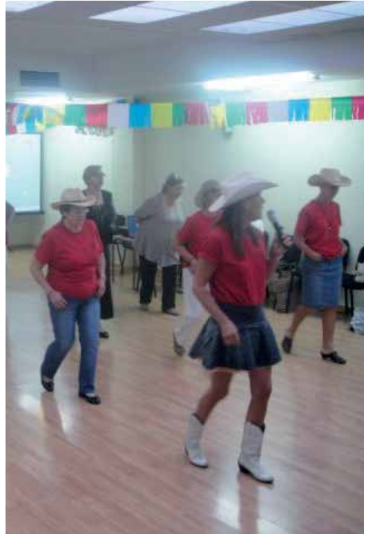
Una de les demostracions que es van fer a la cloenda

La Regidoria de Serveis Socials, Gent Gran i Família ja està preparant el nou programa d'activitats, que es donarà a conèixer durant el mes de setembre, un mes que serà especial ja que acollirà del 22 al 30 la Setmana de la Gent Gran 2012.