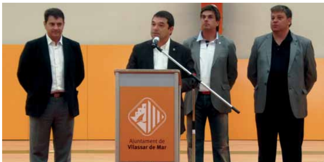
Diputat d'Esports, alcalde, regidor d'Esports i president del CB Vilassar de Mar

brica que feia maons i teules per a la construcció. El conjunt s'ha edificat en dues fases. L'edifici principal, el de la pista amb les grades, compta amb prop de 1.350 m 2 de superfície construïda, té una alçada de 10,40 metres i un aforament a les grades per a unes 200 persones. L'edifici annex, amb 600 m 2 de superfície construïda, acull els serveis complementaris, és a dir, quatre vestidors col·lectius adaptats a persones amb mobilitat reduïda, dos vestidors d'àrbitres, una infermeria, lavabos, sales de magatzem de material, sala d'administració, despatx i un porxo d'entrada, entre d'altres. Amb la nova construcció, també s'ha adequat l'entorn exterior per tal de millorar l'accés a la pista i la il·luminació.