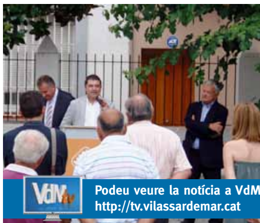
Presentació de les jornades a can Bisa

A les jornades participen una quarantena de restaurants i botigues alimentàries de 15 municipis del Maresme. Per part de Vilassar de Mar ho fan els restaurants Botavara, la Nova Atlàntida i Casa Juan, i la botiga de xarcuteria i plats cuinats Can Pocurull.