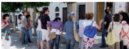
Aquest curs ha finalitzat amb una visita guiada per la ruta dels indians

Els alumnes dels cursos de català per a adults de Vilassar de Mar i diversos voluntaris i aprenents lingüístics van fer una ruta guiada com a cloenda del curs d'enguany. La visita va estar organitzada per l'Oficina de Català, amb la