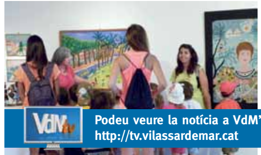
L'exposició ha registrat un gran nombre de visites