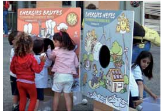
Infants al taller-lúdic amb motiu de la Setmana de l'Energia Sostenible

El 5 de juny, coincidint amb el Dia Mundial del Medi Ambient, davant l'entrada de la Biblioteca Municipal es va fer un taller de lectura a la fresca posant a disposició del públic tot de llibres de temàtica ambiental. L'11 de juny, en el marc de la Setmana Europea de l'Energia Sostenible, es va organitzar, a la plaça Picasso, un taller lúdic per fomentar l'estalvi energètic i les energies renovables entre els infants de 3 a 12 anys. A través de diferents jocs, els nens i nenes van conèixer quines són les energies renovables i quin és l'ús que es fa de l'energia. A més, es van repartir unes guies, publicades per la Diputació de Barcelona, amb consells per a la lluita contra el canvi climàtic.