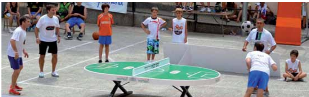
Exhibició de 'futtoc' a la plaça Picaso

excepte amb les mans, i es pot pujar sobre la taula per rematar. La puntuació és com la del tennis taula. Els sets són a 11 punts (guanya el millor de cinc sets) o 21 quan es disputa per parelles, que han de tocar la pilota alternativament. La taula és similar a la del tennis taula, però té els cantells rodons per impedir lesions, i està fabricada amb fibra de vidre per resistir la climatologia.