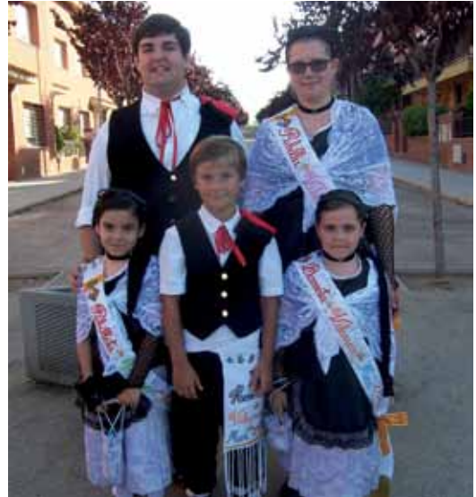
Els nous representants del pubillatge