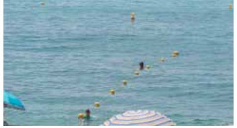
Línia de vida

Cal recordar que el servei de salvament i socorrisme està en marxa i torna a estar gestionat per l'empresa Proacti-