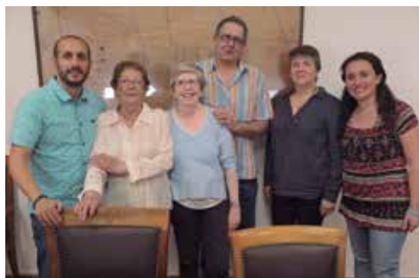
Acte de formalització de la donació amb la família Cañellas i la família Bas