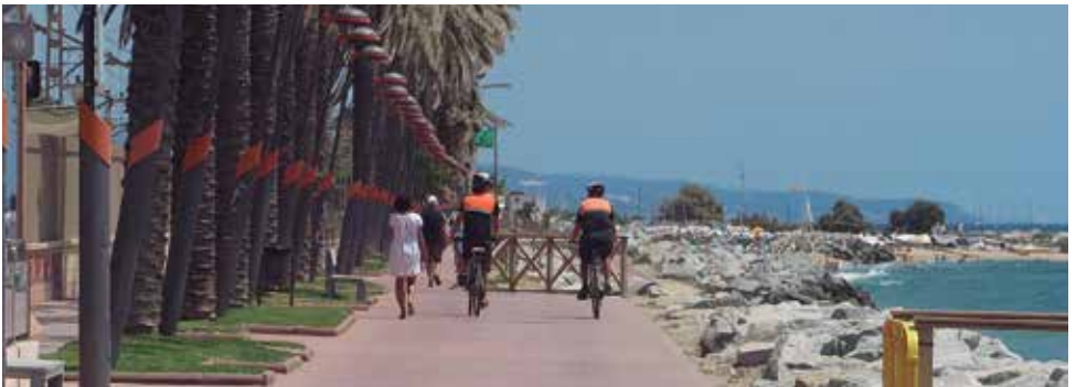
Dos nous agents cívic

Tanmateix, com en els darrers anys, dins de la campanya d'estiu també s'han incorporat dos nous agents cívic, que es sumen al que ja hi havia, per tal de reforçar els serveis que ja s'estan duent a terme. Les seves funcions són vetllar pel compliment de les ordenances municipals, especialment a la zona de la franja marítima i a les zones de parcs i jardins, i combatre l'incivisme. Els agents cívic es desplaçaran en bicicleta.