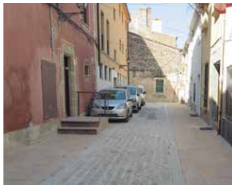
Carrer Sant Antoni després de l'actuació