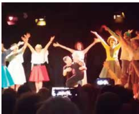
La festa de l'Amistat, un tastet del que s'ha fet i après durant el curs