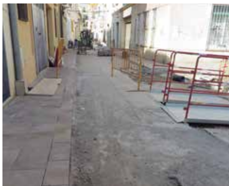
Carrer d'en Roig durant l'actuació