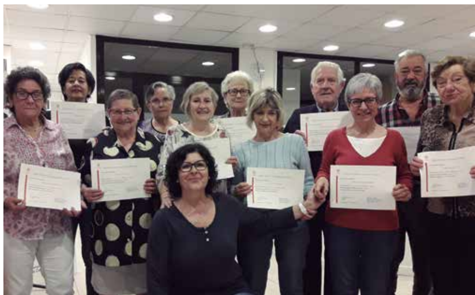
Lliurament de diplomes del taller de la memòria de 1r nivell, realitzat de febrer a maig, on van participar 15 persones

d'octubre a desembre i de febrer a juny. Enguany s'ha fet una demostració sobre l'escenari de molts dels tallers que s'han realitzat durant el curs 2017-18. A més, les persones participants al taller "Això serà cosir i cantar" van avançar un petit fragment de l'actuació que presentaran durant la Setmana de la Gent Gran, el proper mes de setembre.