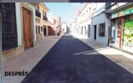
Carrer Sant Francesc: l'abans i el després