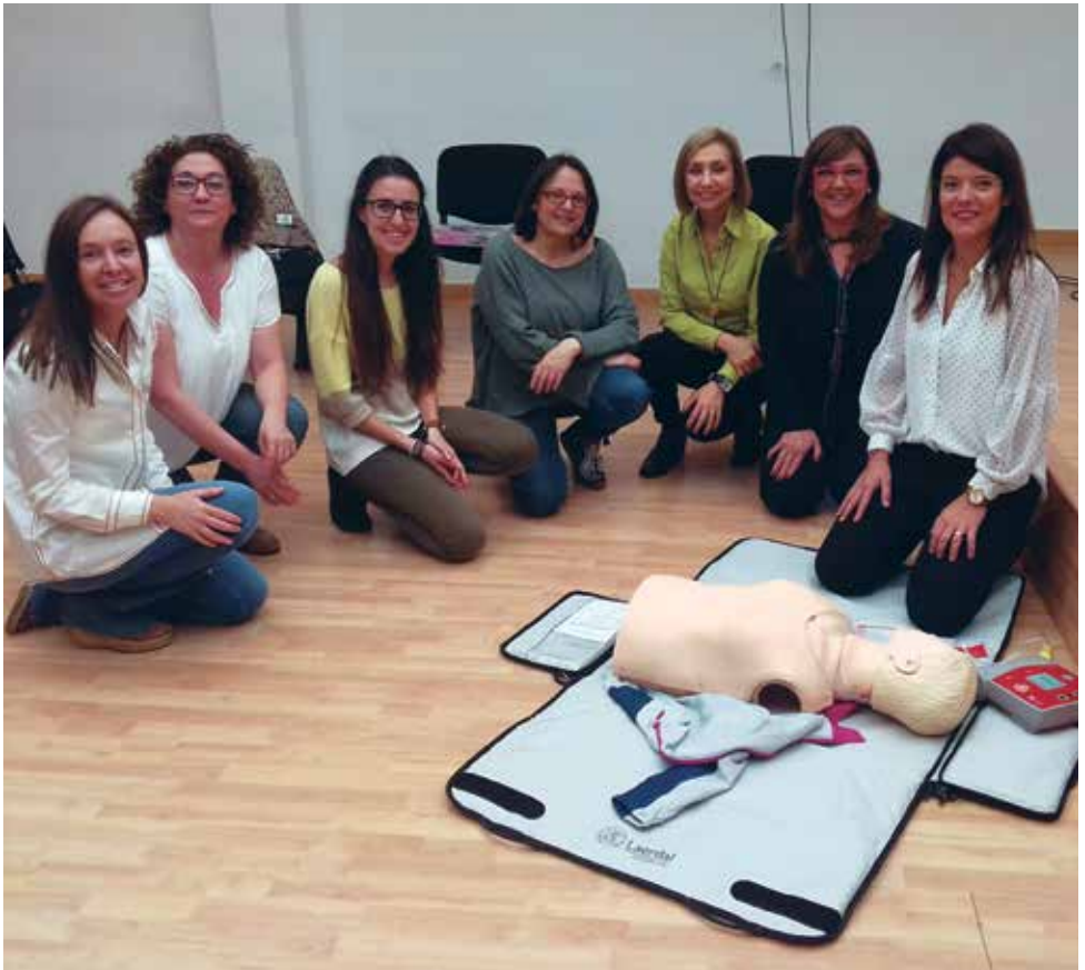
Una de les formacions del curs de RCP