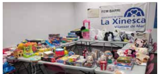
Joguines de l'AV La Xinesca

Diferents entitats com l'Assemblea local de Creu Roja o l'Associació de Veïns La Xinesca van fer campanyes de recollida de joguines per ajudar als Reis d'Orient. Des de Creu Roja Vilassar de Mar es va poder ajudar a 40 famílies, el que significa arribar a 81 nens, i des de l'AV La Xinesca es van recollir més de 250 joguines.