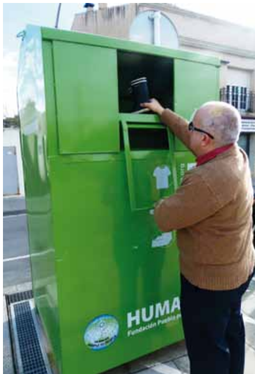
Un dels contenidors de recollida, a la pl. Vicenç Casanovas

Des de la Regidoria de Medi Ambient es fa una valoració molt satisfactòria d'aquest nou servei de recollida d'un material amb un alt potencial de reutilització i reciclatge. També es destaca com a positiu el fet que, amb aquest conveni, l'Ajuntament ha pogut disposar de 25 vals gratuïts, amb un valor de 30 euros cadascun, per adquirir roba i calçats als establiments comercials de l'ONG Humana Fundación Pueblo para Pueblo, que seran distribuïts entre les famílies ateses pels Serveis Socials municipals on es detecti que la necessitat de vestimenta no està coberta.