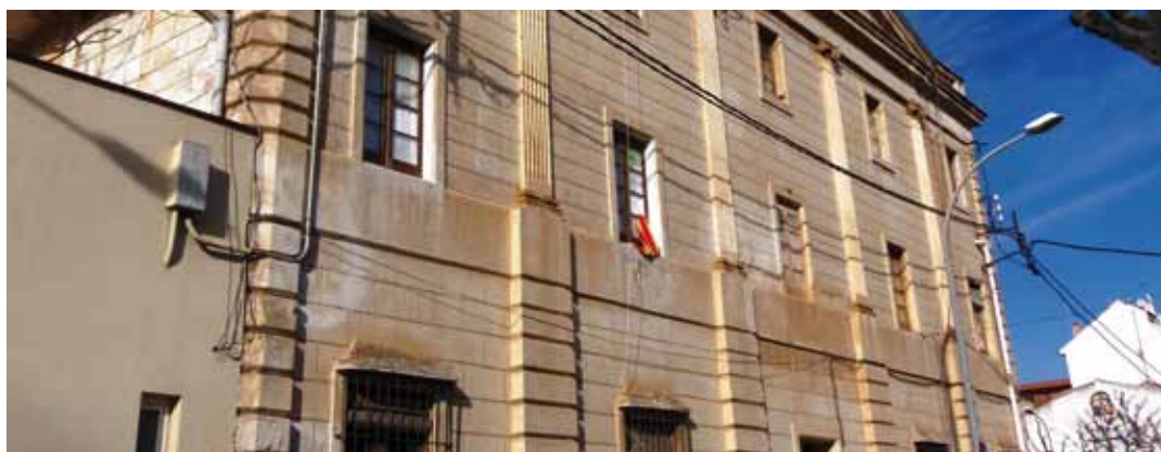
Exterior de l'Escola Nàutica

se'ls ha fet arribar diferents propostes per garantir que l'activitat educativa que el cau realitza a Vilassar de Mar pugui continuar. Entre elles, la de compartir can Gabernet amb l'AE Intayllú com a espai per emmagatzemar material i realitzar les reunions dels caps d'agrupament, i pel que fa a l'espai d'activitats amb els nens i nenes se'ls ha donat com a opcions instal·lar-se als mòduls prefabricats de l'Escola del Mar o al teatre i menjador petit de l'escola Pérez Sala. L'Ajuntament conjuntament amb l'AE Atzavara està valorant les millors opcions per donar resposta als objectius i metodologia de treball de l'Agrupament.