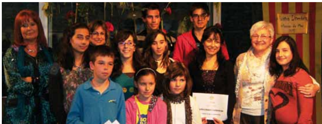
Guanyadors de l'edició anterior

Fins el 15 de març es podran presentar els treballs, a la mateixa Regidoria, de dilluns a divendres de 8 a 14 h, a l'Espai Cultural Can Bisa (C. Montserrat, 8). Tots els participants estaran agrupats per categories segons l'edat. El treball hauran de ser individuals, escrits en català i inèdits. El veredictes es farà públic el 12 d'abril a la Biblioteca Municipal Ernest Lluch.