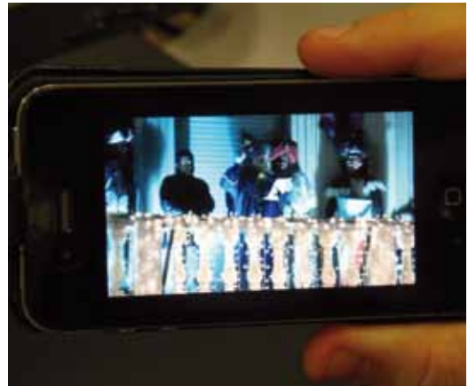
VdM'TV també es pot veure al mòbil

VdM'TV és la televisió per Internet que la Regidoria de Comunicació i Noves Tecnologies va posar en marxa el 18 de març del 2011, un servei públic de comunicació basat en el concepte webTV, combinant les característiques de la televisió convencional amb les possibilitats que ofereix Internet: TV a la carta i distribució de continguts a les xarxes socials. Es pot accedir des del web http://tv.vilassardemar.cat .