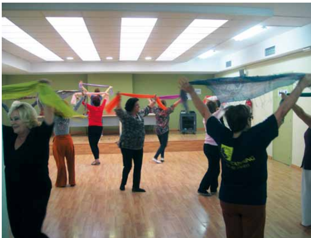
Taller de bollywood

La informació detallada d'aquestes activitats i també les que organitzen per a la gent gran el Centre Cívic del Passeig, el Centre Cívic Lluís Jover i la Biblioteca Municipal es poden consultar en un fulletó que ha editat l'Ajuntament i que també està disponible al web municipal www.vilassardemar.cat