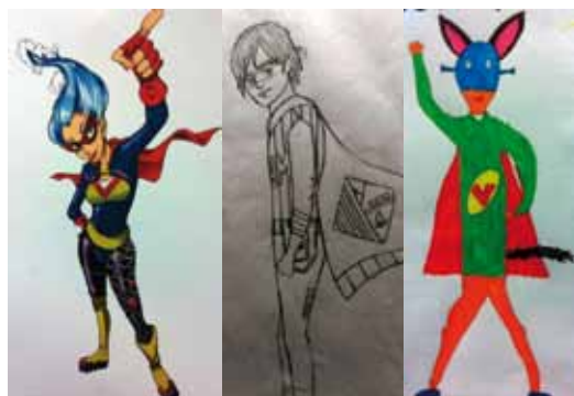
Personatges guanyadors en les categories adult, juvenil i infantil

L'objectiu del concurs era fomentar l'interès per la lectura i el món del còmic coincidint amb la celebració de la 2a Setmana del Còmic. A la categoria infantil va guanyar el personatge creat per Roman Llagostera, a l'infantil, el de Marina Masferrer i en la d'adults, l'heroïna creada per Abigail Serrano.