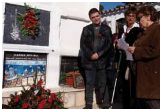
Descoberta de la nova làpida

davant l'èxit de visites, ha prorrogat fins el 27 de gener l'exposició "Carme Rovira, la puresa del naïf", que es pot veure al Museu Monjo-Museu Municipal.