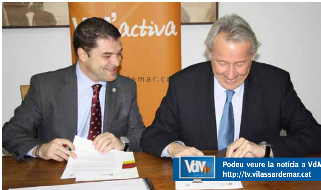
L'alcalde i el vicepresident tercer de la Diputació signant el conveni

ció de Barcelona la que s'encarregui de licitar, adjudicar, executar i finançar l'obra, que té un import d'1.098.729,16€ (IVA inclòs), mentre que l'Ajuntament passarà a tenir la titularitat de la carretera BV-5022, entre els punts quilomètrics 0+000 (coincident amb la N-II) i el 0+596 (a l'altura de l'av. Carles III) amb l'objectiu de 'pacificar-la' i transformar-la en un vial urbà. “Canviarà la fesomia del nostre poble. La carretera de Cabrils en un tram -el que determinin els estudis de mobilitat que s'estan realitzant- tindrà un sentit únic de circulació”, va avançar l'alcalde. Anul·lar un dels sentits actuals de circulació serà la solució per millorar la seguretat viària en aquest tram de la carretera i millorar l'espai destinat als vianants, ampliant les voreres.