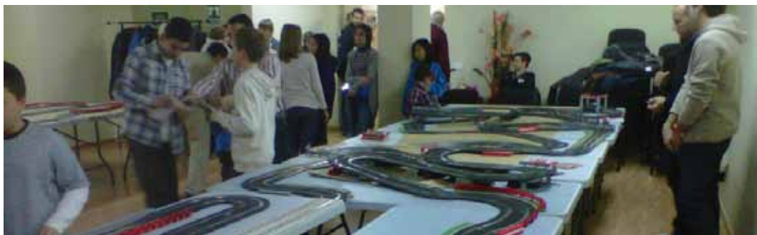
Slot de Nadal al centre social Mn. Galbany

en la versió de Ramon Pàmies a can Madrona i el dia 13 de gener (18 h) hi haurà cinema a l'Ateneu. D'altra banda, el grup de pessebristes de Vilassar de Mar presenta fins al 6 de gener la 50a exposició de pessebres al carrer Sant Josep, 26, amb un diorama monumental, que enguany recrea el poble de Vilassar de Mar durant la nevada del 1962. Per la seva part, VilassART presenta des del 22 de desembre (19 h) la seva tradicional exposició col·lectiva, aquesta vegada a l'Espai Cultural Can Bisa.