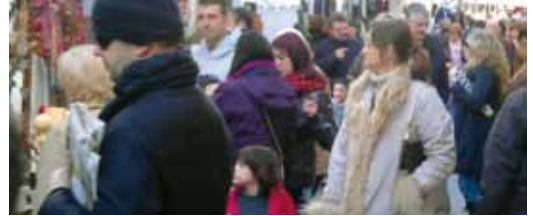
I Fira del Regal

ganitzen el IV concurs d'aparadors, on s'han inscrit 17 botigues. Hi haurà tres premis, dos dels quals escollits per un jurat i un altre escollit pel públic, que pot votar el seu aparador preferit a través del Facebook www.facebook.com/vilassarcomerc o el web www.vilassarcomerciants.cat fins al 24 de desembre. El diumenge 23 de desembre, en què els comerços associats obriran portes, la jornada comercial estarà amenitzada per nadeses interpretades per l'Aula de Música. I com ja fa molts anys, el trenet de Nadal també farà la seva aparició (consulteu horaris a l'anunci).