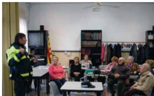
Una de les xerrades

com la de persones que es fan passar per sordmuts recollint signatures al carrer.