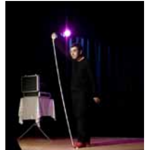
Festival de màgia