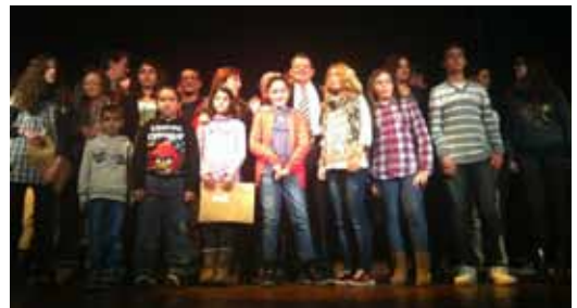
Grup dels guanyadors