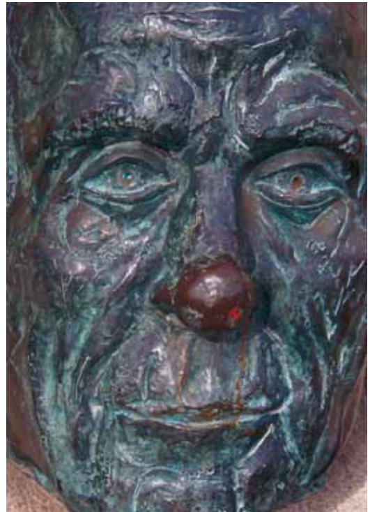
Bust dedicat a Mn. Pere Ribot, a la plaça de l'Església

Nascut a Vilassar de Mar, mossèn Pere Ribot va ser nomenat el 1941 rector de Sant Martí de Riells del Montseny, des d'on va aprofitar les poques esclatxes que presentava la dictadura franquista per mantenir i impulsar la llengua i la cultura catalana. A més, mossèn Pere Ribot va ser un dels grans poetes catalans d'aquest segle, que va utilitzar la llengua de forma magistral com una eina per expressar les seves vivències des d'un plantejament espiritual i religiós.