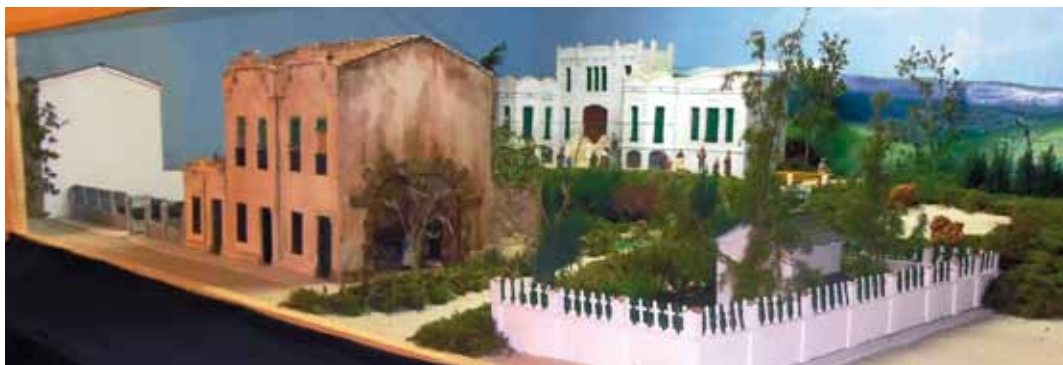
Diorama monumental de l'exposició de pessebres