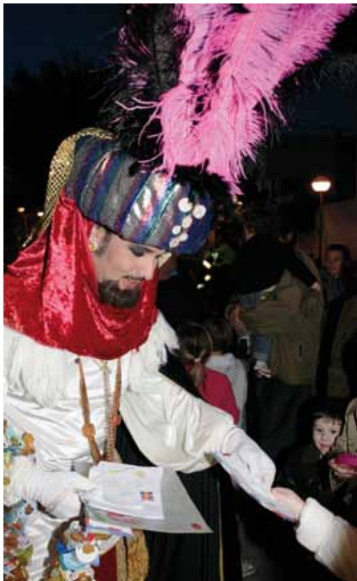
El Carter Reial arribarà el dia 29

El 24 de desembre (18 h) arribarà el tió carregat de sorpreses a la plaça de l'Ajuntament. La companyia Rafató Teatre farà que els infants que s'acostin gaudeixin d'aquesta tradició. El dia 29 serà el moment de lliurar les cartes al Carter Reial, que tornarà a venir a cavall. A les 18 hores sortirà de la plaça Vicenç Martí i travessarà diferents carrers fins a arribar a la plaça de l'Ajuntament, on atindrà un a tots els nens i nenes. La nit de Cap d'Any no hi haurà excusa per quedar-se a casa. Trenta minuts després de les dotze campanades que donen inici al nou any l'orquestra Gramola començarà a amenitzar la festa a la pista annexa del pavelló municipal d'esports Paco Martín. A partir de 2/4 de 4 de la matinada un DJ conduirà la festa amb música per als més joves. L'entrada és gratuïta i promet un vistós espectacle de llum i so per donar la benvinguda al 2013.