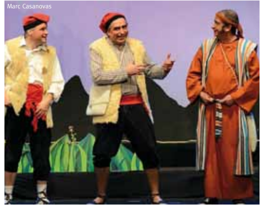
Els Pastorets de la Tropa

L'Associació de Veïns/es del Barato, el PDC i el Tucutuc donen la benvinguda a les festes el dia 20 de desembre (18 h) amb una cantada de nades i la decoració de l'arbre de Nadal als locals municipals de la plaça Carles Trias, i Viladona fa una xerrada el mateix dia (18 h) a l'hotel d'entitats perquè tothom pugui explicar com pensa viure aquestes festes. El dia 23 de desembre (19 h) al CC Lluís Jover hi haurà lectura de poesies, i el dia 24 (19 h) arribarà la missa del pollet, que enguany porta com a novetat la representació d'algunes escenes dels Pastorets de Josep Maria de Sagarra a càrrec dels infants i