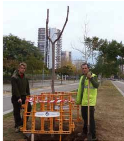
Plantada av. Lluís Companys

Els carrers i equipaments on s'actuarà són els següents: Lluís Companys, Jeroni Anyé, Santa Eulàlia, Santa Eugènia, Trafalgar, Maria Vidal, Sant Genís, Sant Magí, carrer del Carme, Sant Artur, Via Octaviana, Torrent de la Santa, Cristòfor Colom, Picasso, Narcís Monturiol, Mossèn Pere Ribot, carretera d'Argentona, Eduard Ferrés, plaça de la piscina, Santa Rosa de Lima, Montevideo, Riera d'en Cintet, Jeroni Marsal, Manuel Roca, Lluís Guardiola, Xinesca, Veral de l'Ocata i Josep Tarradellas.