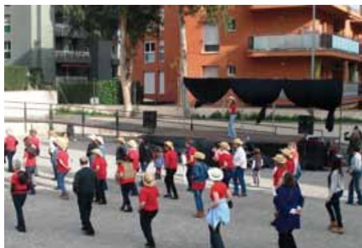
Distreure's ballant també és saludable i així de bé s'ho van passar les persones que van assistir al ball country a la plaça Picasso