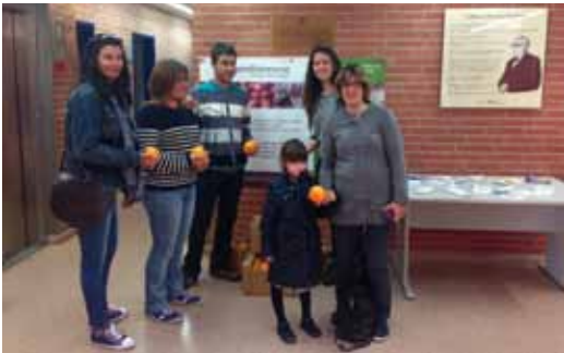
El CAP Dr. Masriera va posar al vestíbul una taula amb informació sobre la importància de mantenir una alimentació equilibrada

Del 7 al 15 d'abril la Comissió d'Estils de Vida Saludables ha organitzat nombroses activitats relacionades amb la salut amb l'objectiu de transmetre hàbits de vida saludables a tota la població. Aquestes imatges en són testimoni d'algunes d'elles.