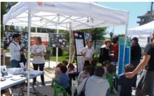
El recinte de l'escola Pérez Sala va acollir el 13 d'abril activitats per als infants com ara un rocòdrom inflable, circuits en bicicleta i patinet i tallers de diferents empreses relacionades amb la salut