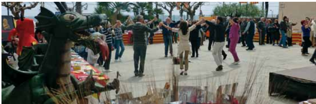
La plaça de l'Ajuntament s'omplirà d'activitat el 21 d'abril

Els guanyadors dels premis del concurs de microrelats poètics via twitter es coneixeran el 22 d'abril a la Biblioteca, que també serà escenari de la trobada de diferents clubs de lectura, el d'adults i joves de la biblioteca i el de Viladona, que recomanaran llibres. El 23 d'abril, coincidint amb Sant Jordi, les parades de llibres i roses tornaran als carrers de la vila i al dia següent, la biblioteca tornarà a ser protagonista amb la presència de l'autora del llibre "La gatera", Muriel Villanueva, en la trobada amb autor del club de lectura, una activitat pensada perquè els lectors parlin i coneguin diferents escriptors. El dissabte 27 d'abril els actes continuaran amb un BiblioExperiment, que amb el nom "El zoo de les lletres", combinarà literatura infantil amb creativitat a parts iguals. El 30 d'abril les activitats relacionades amb Sant Jordi finalitzaran amb "Barrets per marrecs", contes per a famílies amb nadons fins a 3 anys.