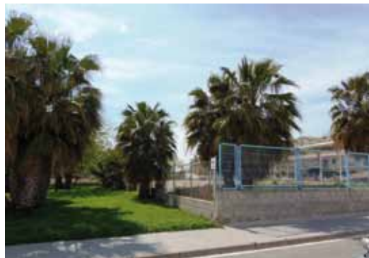
El parc del Congrés s'acondicionarà el 2013

El capítol d'inversions també inclou els treballs per quan es traslladi el Mercat Municipal al seu emplaçament definitiu que servirà per rehabilitar i tornar a deixar com a espai públic la plaça Ventura Gassol, ara mateix ocupada pel mercat provisional, així com l'entorn del nou Mercat. Una altra inversió prevista serà per condicionar i millorar el parc del Congrés i el de Santa Marta. D'altra banda, 30.000 euros es destinaran a l'arranjament del clavegueram que hi ha entre el carrer Narcís Monturiol i la Riera d'en Cintet, i 70.000 euros s'invertiran en la primera fase de reforma del Museu Monjo-Museu Municipal.