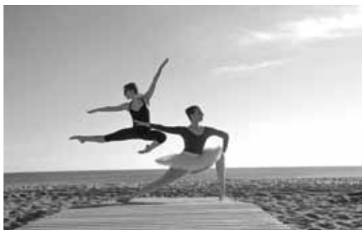
Ballarins a la platja