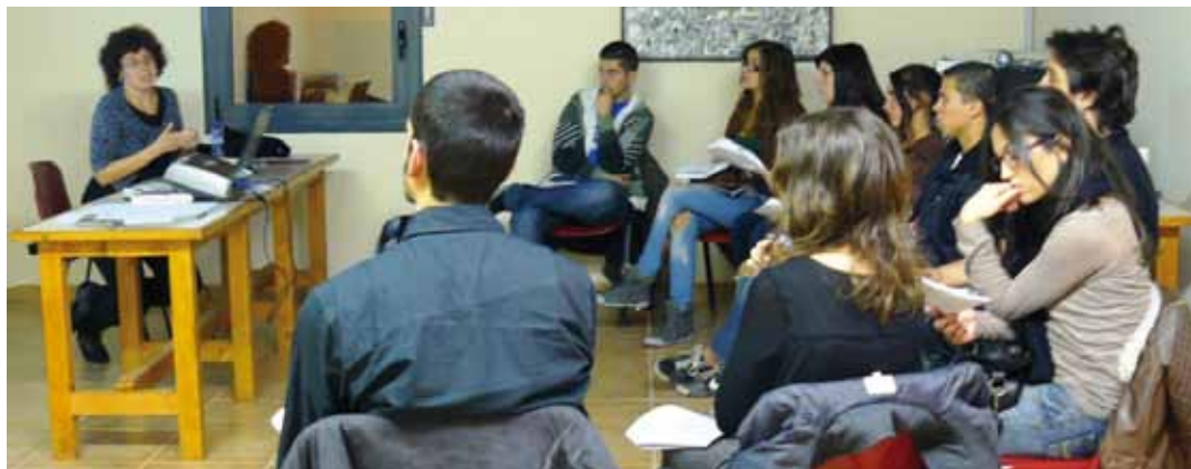
Xerrada Mobilitat Internacional

En 'Participació i ciutadania activa' s'han atès 792 persones i entitats. En aquest àmbit s'han cedit espais a entitats juvenils per fer reunions, tallers o xerrades i s'ha desenvolupat el PIDCES (Programa d'informació i dinamització als centres d'educació secundària). A més, durant el 2012 el Servei de Joventut va treballar en la redacció del nou pla local de Joventut, aprovat en el ple del passat novembre, el full de ruta per als anys 2012-2016.