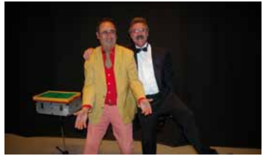
Churches i Plumetti