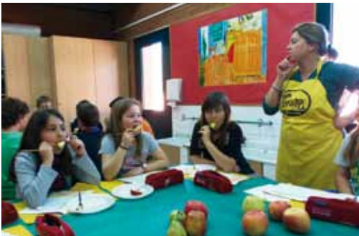
Els alumnes de l'Escola del Mar van participar en els tastos de fruita dolça de la campanya 'Disfruita-la' impulsada per Unió de Pagesos, i els més petits es van emportar unes carmanyoles verdes plenes de fruita