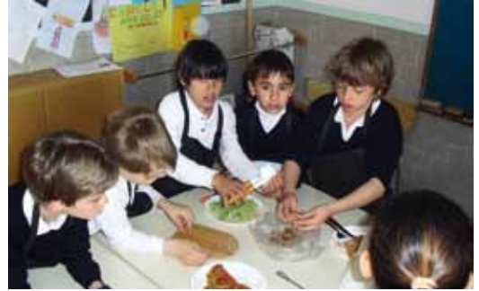
Entre les activitats escolars, des de la Presentació els alumnes van cuinar ells mateixos diferents plats saludables amb productes de proximitat