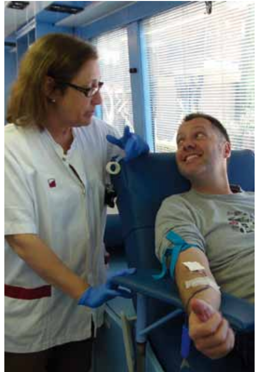
99 donacions efectives, 7 d'elles de nous donants, es van fer a la recollida extraordinària de sang del dissabte 13 d'abril

La Comissió d'Estils de Vida Saludables agraeix la col·laboració de: Vilassar Ràdio/VdM/TV, Piscina Municipal, Col·legi Oficial d'Inferm@rs de Barcelona (COIB), Vilassar Comerç, Fruiteries Germans Hernández, Forn de pa Bargalló, Supermercats Dusa, Autoservei Serrat, Formatges Vilatzara, Cafeteria D'Gust, Bar 1001, Burriac Cafè, Bar Marina, Sita Studi, FísioVilassar, Restaurant El Terral, Centre Integral de logopèdia i fonoaudiologia, Estudi Blanc Pedra, Farmàcia Roca 1904, Farmàcia Umbert, Institut Ioga Integral, FitSport, Òptica Rodon, Corriol, Creu Roja, Banc de Sang i Teixits, Mengem Maresme, Associació de Trasplantats Hepàtics de Catalunya, UE Vilassar de Mar, Club Patinatge Artístic Vilassar de Mar, Club Vilassar Hoquei, Judo Vilassar i Centre Excursionista Vilassar de Mar.