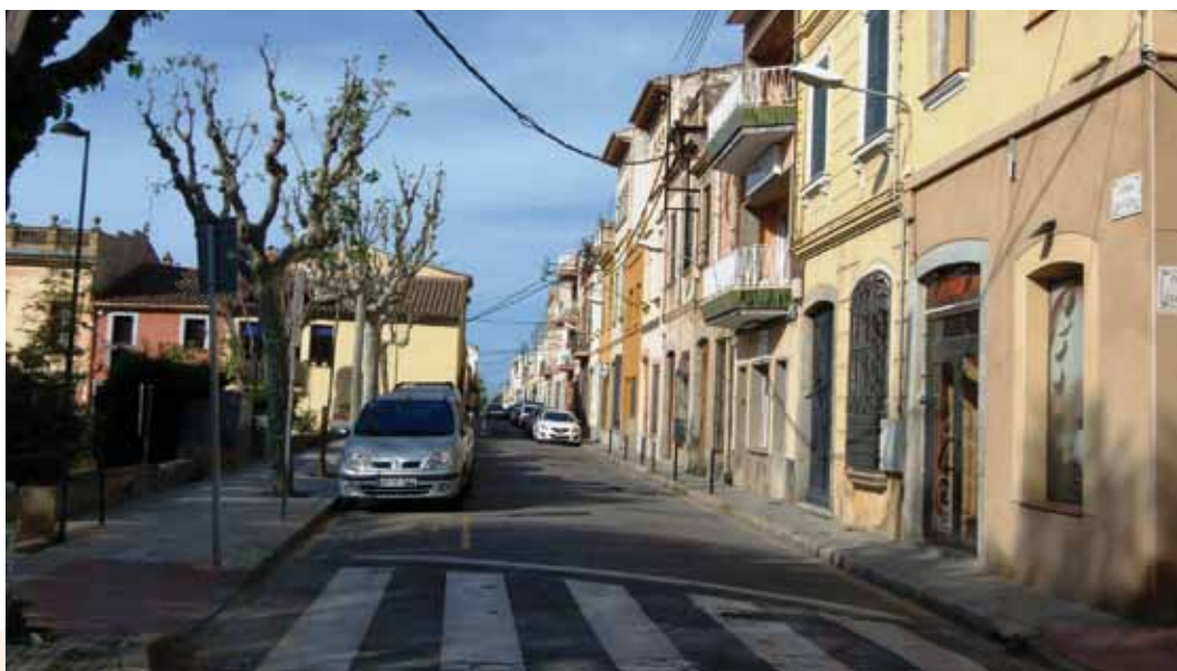
El carrer Sant Genís, un dels vials que s'arranjarà

En el capítol d'inversions es compten amb 993.300 euros, 253.300 euros de recursos propis i 740.000 provinents de transferències d'altres administracions: 290.000 euros del PUOSC 2012 de la Generalitat de Catalunya i 450.000 euros de la Xarxa de Governos Locals de la Diputació de Barcelona. Entre les inversions previstes destaquen 640.000 euros per a la millora de la urbanització de diversos vials, entre ells l'acondicionament de la carretera de Cabrils i els carrers del seu entorn (Santa Isabel, De la Pau, Sant Ignasi, Sant Genís, Santa Maria i Dr. Bartrina) per complementar la inversió que farà la Diputació de Barcelona en la construcció del pont que ha d'unir l'av. Carles III amb la de Lluís Companys.