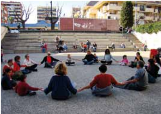
La plaça Picasso es va convertir el 12 d'abril en l'espai del taller Fem ioga, amb Espai Interior