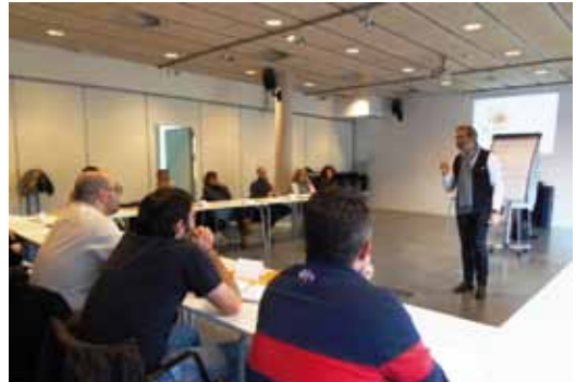
Conferència imatge corporativa

qüestionari que servirà a l'Ajuntament de guia per conèixer les inquietuds dels comerciants i emprenedors sobre diferents temes i poder adequar propers tallers i conferències a les seves demandes.