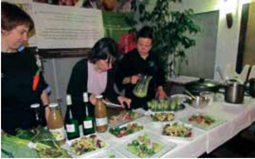
El 9 d'abril una quarantena de persones van assistir al taller de cuina i el tastet preparat pel restaurant El Terral amb productes de Mengem Maresme