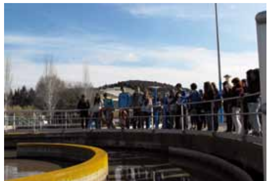
Els alumnes de batxillerat dels instituts van conèixer el funcionament de la depuradora de Sant Pol i la potabilitzadora de Palafolls