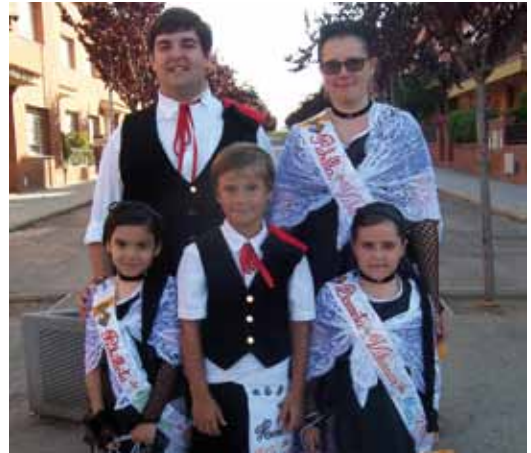
Darrers representants del pubillatge local