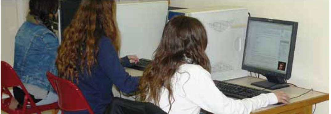
El nou espai amb ordinadors connectats a Internet

res. Els dimarts no està disponible. La primera vegada que es faci ús del servei, s'haurà de presentar el DNI original per donar-se d'alta al registre d'usuaris. Les connexions són d'1 hora, que es poden prorrogar si no hi ha joves que s'esperen. Entre els serveis que s'ofereixen hi ha la reserva d'ordinador (només per a acadèmics i de recerca de feina) d'una hora com a màxim, enviant un correu electrònic a l'adreça sij@vilassardeмар.cat ; l'escanejat de documents, i la impressió de documents en blanc i negre (DIN-A4).