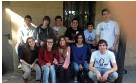
Grup d'alumnes participants