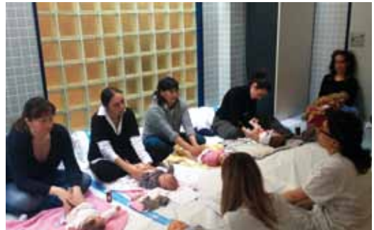
Mares amb els seus bebès en el taller de massatge infantil que es fa al CAP