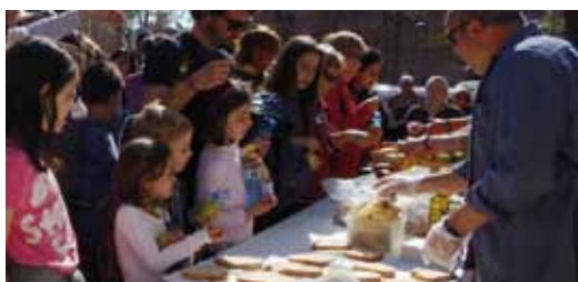
Esmorzar per a tothom