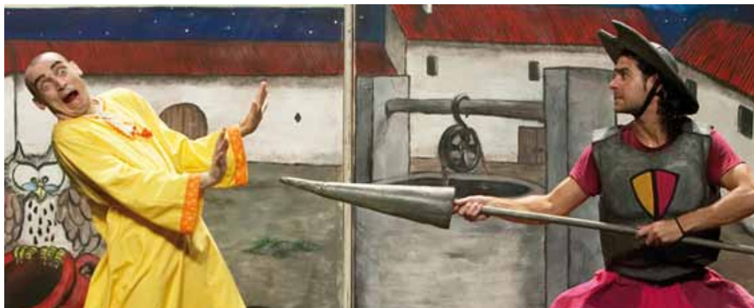
Ot, el Quixot

den viure mentre els llegeixes. Aquest és el fil conductor de l'espectacle que portarà a escena la companyia Clowns Teatre, i que s'adreça a infants a partir de 5 anys.