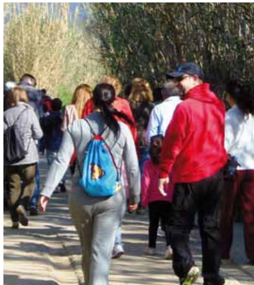
Caminada per les rutes