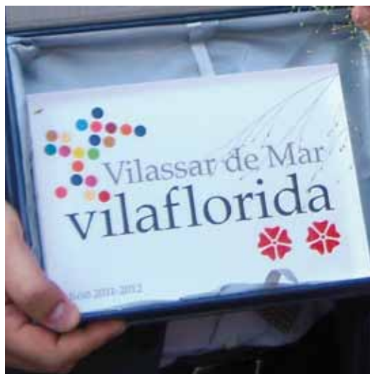
Distinció de dues flors d'honor aconseguida l'any 2012

dinamització comercial i conscienciar la ciutadania envers les polítiques sostenibles. Un jurat, format per nou professionals dels sectors del viverisme, la jardineria i el paisatgisme, valorarà els municipis inscrits. El veredictes es farà públic durant el mes de juny de 2013.