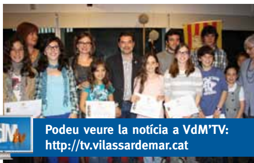
Grup de guanyadors

Les obres guanyadores participaran en la Mostra Literària del Maresme, la fase comarcal del concurs.