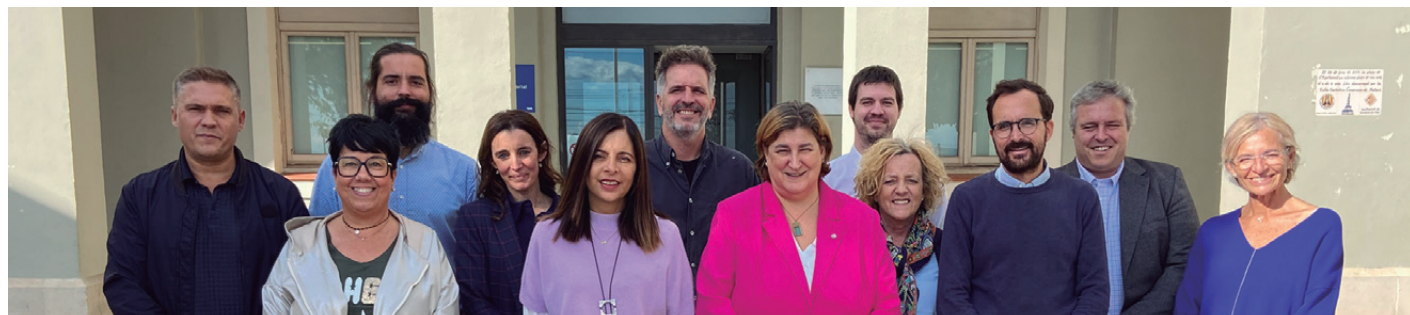
Composició del nou govern fruit de l'acord

El pacte té com a objectiu garantir un govern fort, cohesionat i estable