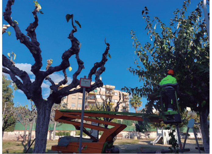
Inici de la poda al parc d'en Patufet

El passat 7 de novembre, va començar la campanya de poda de l'arbrat viari. Els treballs de poda, a càrrec de l'empresa adjudicatària del contracte de manteniment de l'arbrat públic, segueixen criteris de manteniment respectuosos amb el desenvolupament natural de l'arbre per tal de maximitzar els beneficis que aquests aporten, com la generació d'oxigen, l'absorció de contaminants i la regulació de temperatura. L'objectiu és podar de l'arbre només el que és necessari, respectant-ne la dimensió, la forma natural i les condicions de l'entorn, eliminant les branques mortes o malaltes, les que tinguin perill de caiguda o les que puguin afectar façanes, enllumenat públic o senyalització viària. Com en els darrers anys, està prevista la poda del 80% de l'arbrat, que correspon a 3.686 arbres. Les actuacions es portaran a terme en dos períodes. La major part de la poda es farà en època d'aturada vegetativa dels arbres (tardor-hivern). En aquelles espècies que no s'aconsella la poda durant l'atura-