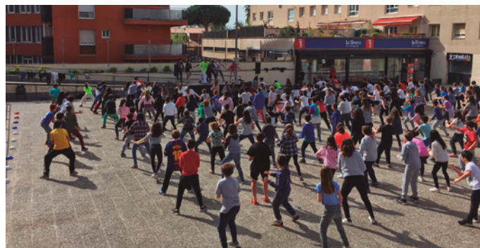
Una de les activitats de l'edició de l'any passat

Les possibilitats no s'esgoten aquí. Les diverses regidories implicades en l'organització de la Setmana de la Salut proposen, a més, diverses exhibicions ( parcour , dansa urbana), tallers per millorar la nostra salut corporal (hipopressius, moviment expressiu, taitxí, ioga, recuperació postural i estiraments) i d'altres per a la nostra salut mental. Tres anys després de l'esclat de la pandèmia del coronavirus, els seus efectes en la salut mental són tan evidents com la necessitat de cuidar-la. Hi aprofundirem amb Cuidem el nostre