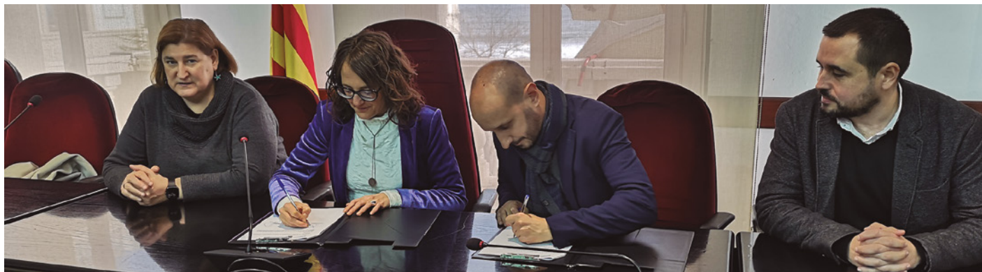
L'alcalde de Vilassar de Mar, Damià del Clot, i la consellera d'Igualtat, Tània Verge, signen el conveni a l'Ajuntament

L'alcalde de Vilassar de Mar, Damià del Clot, i la consellera d'Igualtat i Feminismes de la Generalitat, Tània Verge, van signar el passat 28 de febrer un conveni de col·laboració entre les dues administracions per desplegar al nostre municipi el Servei d'Atenció Integral LGBTI Local (SAI).