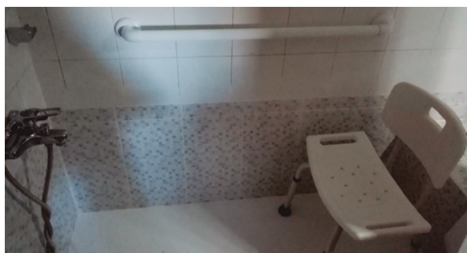
Un dels banys adaptats amb aquest programa

El programa d'arranjaments de la Diputació pretén facilitar reformes bàsiques d'adaptació funcional als habitatges, consistents en reparacions, petites obres no estructurals i instal·lacions d'ajuts tècnics. S'adreça a persones de 65 anys o més, amb discapacitat o en situació de dependència, o a persones