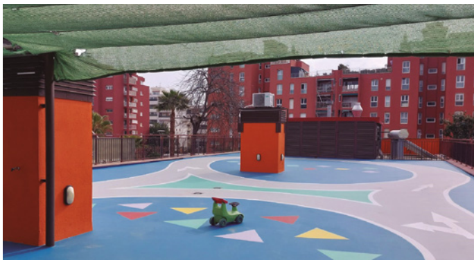
La coberta de La Bressoleta després de la intervenció

Cal recordar que a l'estiu de 2020, l'Ajuntament ja va reformar una altra de les cobertes, concretament la coberta plana no transitable corresponent al sostre de la primera planta d'aquest equipament municipal.