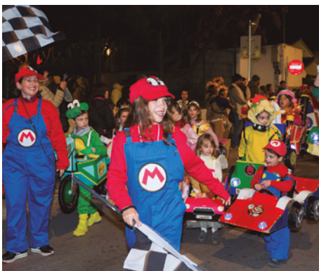
Comparsa Karlipos , premi de votació popular a la millor comparsa