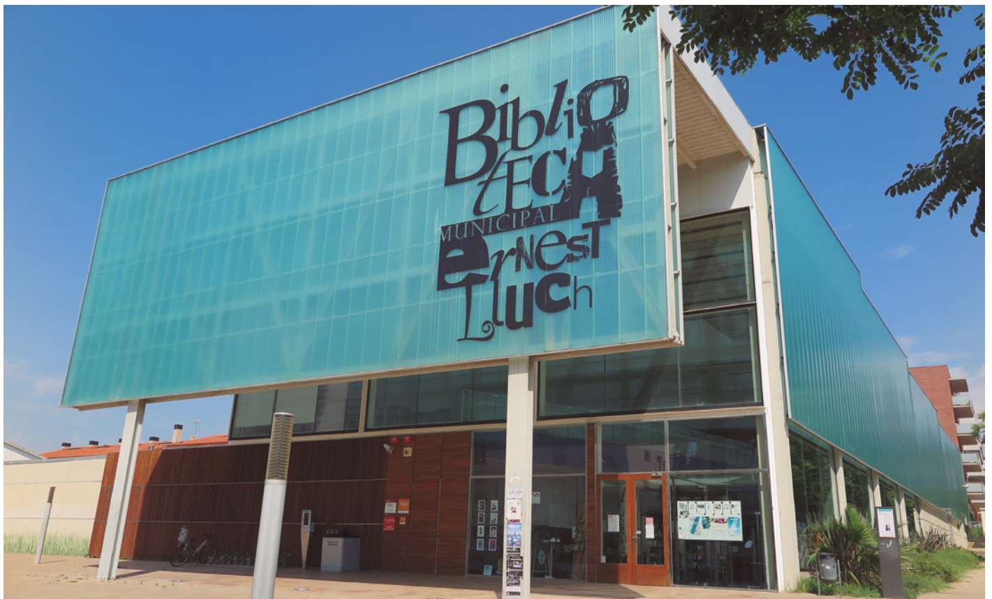
La Biblioteca Municipal Ernest Lluch és un dels equipaments municipals on s'instal·laran plaques fotovoltaiques

Els projectes s'hauran d'executar abans del 31 de desembre de 2023. En aquests moments, l'Ajuntament ja està treballant en la contractació de l'execució de l'obra descrita al projecte d'instal·lació de plaques fotovoltaiques a la Biblioteca Municipal.