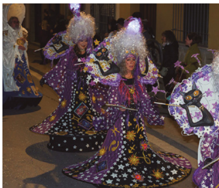
Comparsa Els Makus de Vilassar , tercer premi de la rua de Carnaval