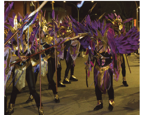
Comparsa Les Valkíries , quart premi de la rua de Carnaval