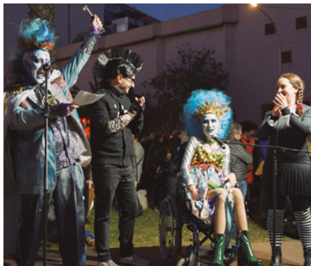
La reina del Carnaval 2022 i el rei Carnestoltes, durant el pregó