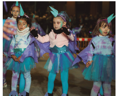
Comparsa Sisu Alocats , cinquè premi de la rua de Carnaval