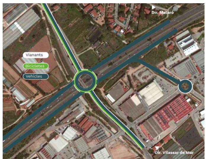
Projecció de com serà la nova sortida a la C-32

es va acordar amb la Generalitat que el projecte final tingui en compte la reubicació de la parada interurbana d’autobús, i es creï l’espai necessari per tenir una parada segura i accessible per a les persones usuàries, que pugui servir com a punt d’intercanviador dels autobusos urbans i interurbans.