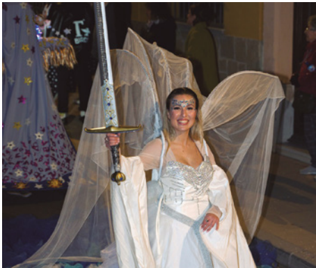
Comparsa Excalibur , primer premi de la rua de Carnaval

el premi Toni Linares (700 €) a la millor carrossa i el premi a la Reina del Carnaval. El tercer premi (500 €) va ser per als Makus de Vilassar i el quart (400 €) va recaure en la comparsa Les valkíries. El cinquè premi (300 €) va ser per a una de les comparses més familiars de la desfilada, Sisu Alocats, mentre que el premi popular va ser per la comparsa Karlipos.