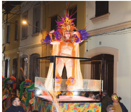
Reina del Carnaval 2023, de la comparsa Rumba Freak , guanyadora del segon premi