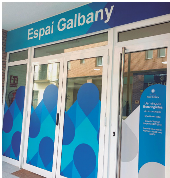
Espai Galbany, equipament que acull el SAI LGBTI+

Entre els serveis, hi ha d'informació de tota mena: tramitació del canvi de nom en la targeta sanitària, atenció i gestió de consultes de tipus local o comercial i atenció davant possibles casos de discriminació.