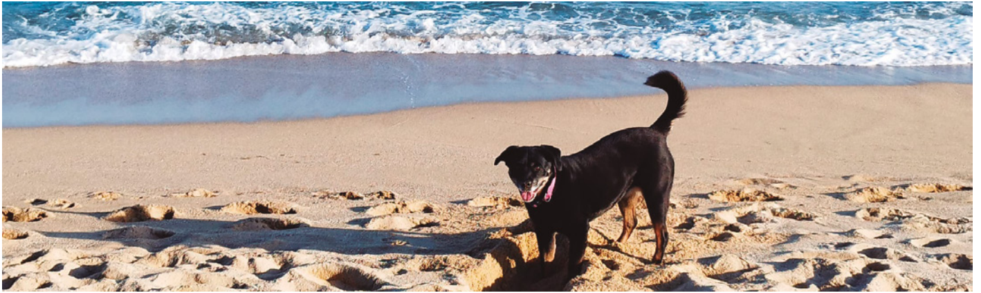
La zona de bany amb gossos està senyalitzada a la platja de Ponent (límit amb Premià de Mar)

A Vilassar de Mar, la prohibició de portar gossos a la platja s'estén de l'1 de maig al 31 d'octubre. En aquest període, només poden passejar lligats pel passeig Marítim o accedir a la zona de bany específica per a gossos. A finals de maig, es va estrenar aquesta zona a la platja de Ponent, just al costat del límit amb el terme municipal de Premià de Mar on aquest municipi té instal·lada la seva zona de bany amb gossos. Als 1.200 m 2 de Vilassar de Mar s'uneixen els 1.200 m 2 de Premià de Mar, un total de 2.400 m 2 per al gaudi dels gossos amb els seus propietaris. La zona de bany amb gossos està delimitada amb cordes i pilones de fusta i disposa de senyals informatives i papereres. Les normes bàsiques d'ús d'aquest espai són comunes tant a Vilassar de Mar com a Premià de Mar i entre elles hi ha que els gossos estiguin controlats pels seus propietaris en tot moment; que els gossos estiguin censats, i que es recullin els excrements i es dipositin a les papereres. Pel que fa als gossos potencialment perillosos, han d'anar lligats i amb morrió dins i fora de l'aigua i la persona responsable del gos ha de dur la llicència municipal i el document d'identificació de l'animal.