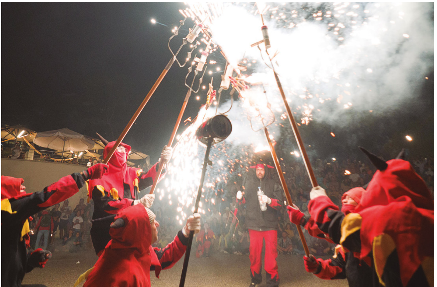
Correfoc amb els Mansuets de Foc

Tota la programació es pot consultar al web www.festamajorvilassardemar.cat .