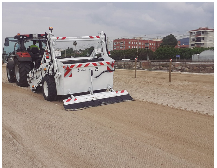
Nova màquina cribadora

La temporada alta de neteja a la platja ja ha començat. El servei implica la neteja diària de la sorra (manual i mecànica), del passeig Marítim (mecànica) i dels passos soterranis. La temporada alta de neteja es mantindrà activa fins al setembre.