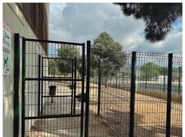
S'ha instal·lat doble porta a l'accés

Aquesta actuació forma part del compromís de l'Ajuntament per oferir un entorn més agradable i segur per als gossos i els seus propietaris, fomentant així la convivència i el benestar animal.