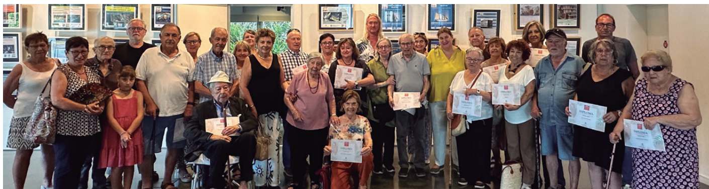
Acte de lliurament de diplomes a les persones que han fet donació a l'Arxiu durant el primer semestre de l'any

Les donacions a l'Arxiu, a més de nodrir el fons documental, permeten la construcció de la història del poble en tots els àmbits i passen a ser documents d'accés públic. Les consultes a l'Arxiu Municipal es poden realitzar de dilluns a divendres, de 8 a 13 h, amb hores convingudes per telèfon (937502957) o per correu electrònic: arxiunicipal@vilassardemar.cat .