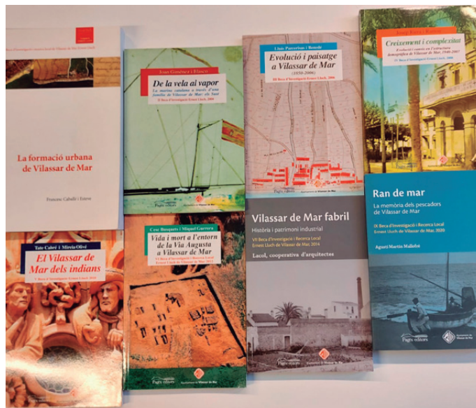
Llibres publicats dels treballs premiats

La primera edició de la beca (any 2002) va premiar el treball La formació urbana de Vilassar de Mar: de veïnat a nucli consolidat segles XVIII-XIX . La segona edició, el treball De la vela al vapor: els Sust, una nissaga marinera a cavall dels segles XIX i XX . La tercera edició va premiar el treball Evolució del paisatge i transformacions del territori a Vilassar de Mar i Vilassar de Dalt des de 1850 a l'actualitat i la quarta, el projecte Creixement i complexitat. Evolució i canvis en l'estructura demogràfica de Vilassar de Mar, 1939-2007 . La cinquena edició va