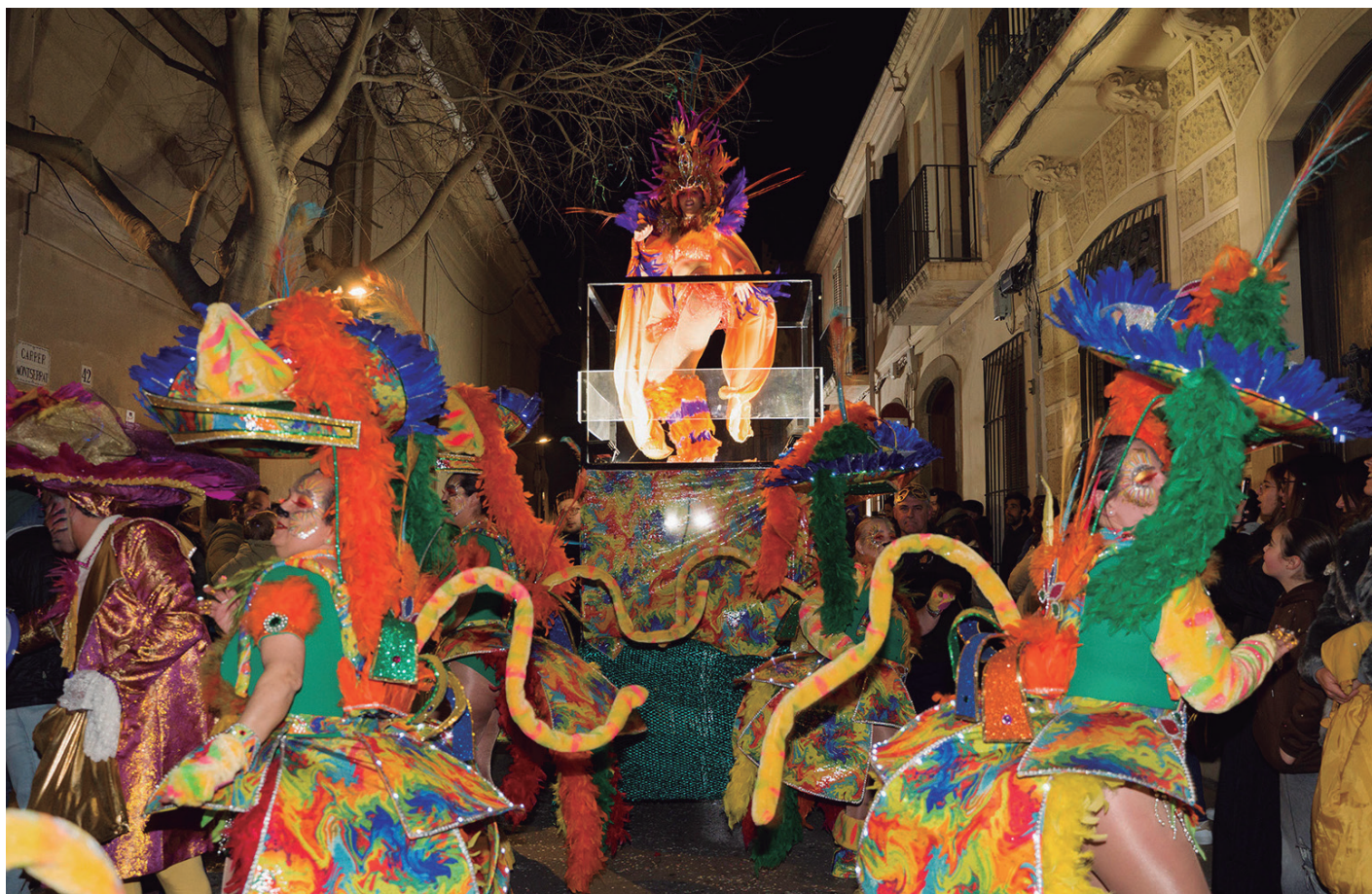
Una de les comparses participants a la rua de l'any passat

Per a més informació, les bases i la documentació necessària a presentar per participar al concurs de comparses es troben disponibles al web dels dos ajuntaments organitzadors: vilassardemar.cat i cabrerademar.cat .