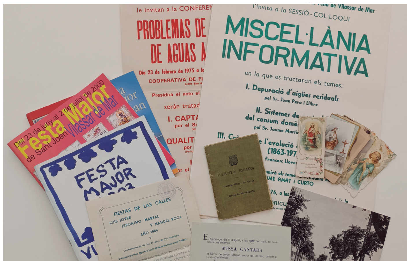
Alguns dels nous documents rebuts durant el 2023

Aquestes donacions no només enriqueixen el fons documental, sinó que també contribueixen a la construcció de la història del poble en tots els àmbits, convertint-se en documents d'accés públic. Per a consultes, podeu contactar amb l'arxiu de dilluns a divendres, de 8 a 13 hores, amb hores convingudes per telèfon (937502957) o correu electrònic a arxiunicipal@vilassardemar.cat .