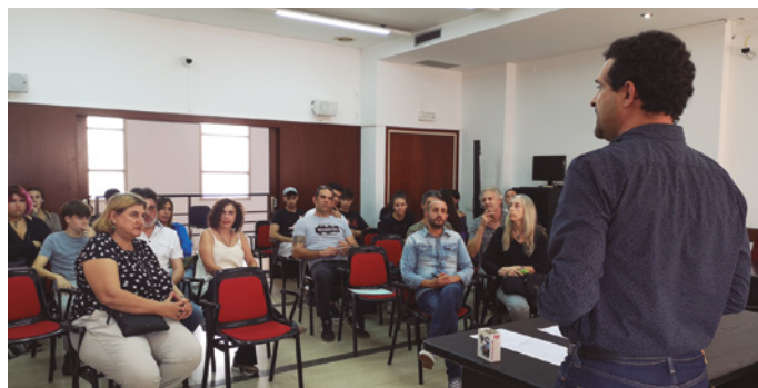
Presentació del projecte Horitzó a l'Ajuntament

En la vintena edició d'aquest projecte al nostre poble, 10 són els alumnes (sis del Vilatzara i quatre del Pere Ribot) que es beneficien d'aquest programa, que aquest curs incorpora dos nous tallers: