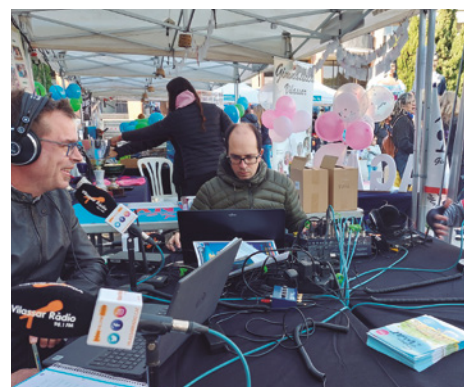
Programació especial de Vilassar Ràdio al carrer