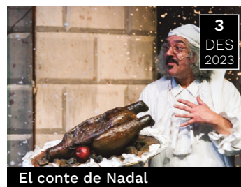
El conte de Nadal

Comèdia que explica la història de supervivència de dos amics en temps de crisi.