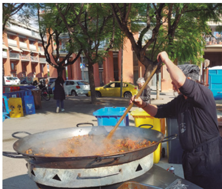
Dinar popular a la plaça Tarradellas