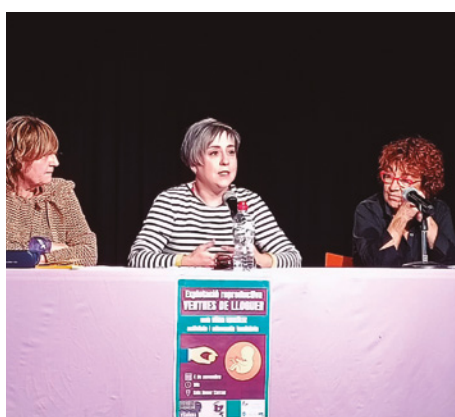
Conferència organitzada per Viladona

nal de les administracions catalanes, així com al manifest del món de l'esport. Aquí us deixem un resum en imatges de les cinc jornades en les quals, junta-ment amb les entitats feministes del nostre poble i la ciutadania, vam cridar: “No a la violència contra les dones”.