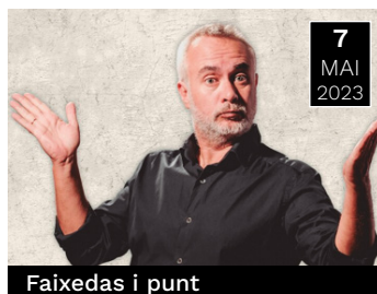
Faixedas i punt

La papiroflexia i l'art de les ombres ens ensenyen que les diferències ens enriqueixen.