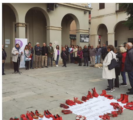
Lectura del manifest institucional