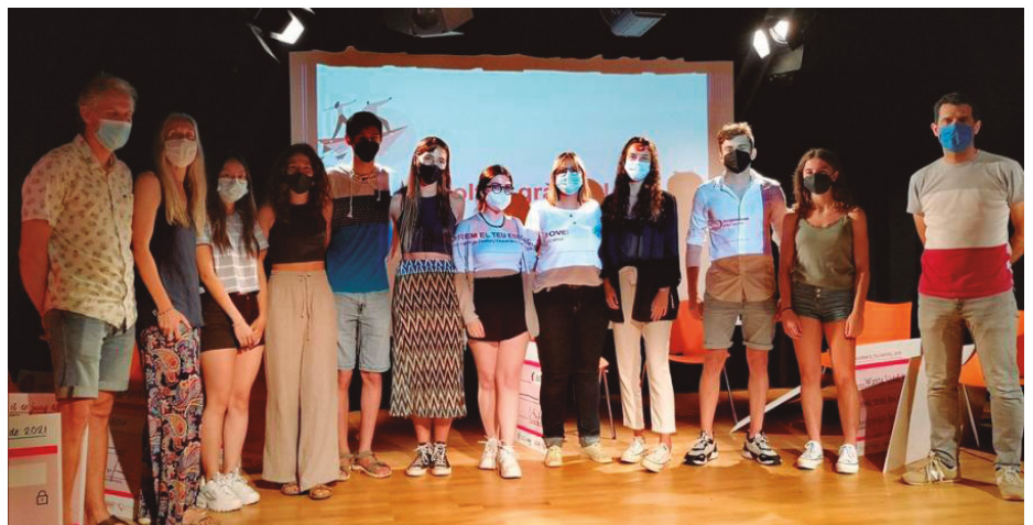
Alumnes premiats els cursos passats amb els antics guardons

La convocatòria dels premis d'aquest curs estarà oberta fins al 28 de febrer en les línies A1, A2 i B, i fins al 3 de juny en la línia C.