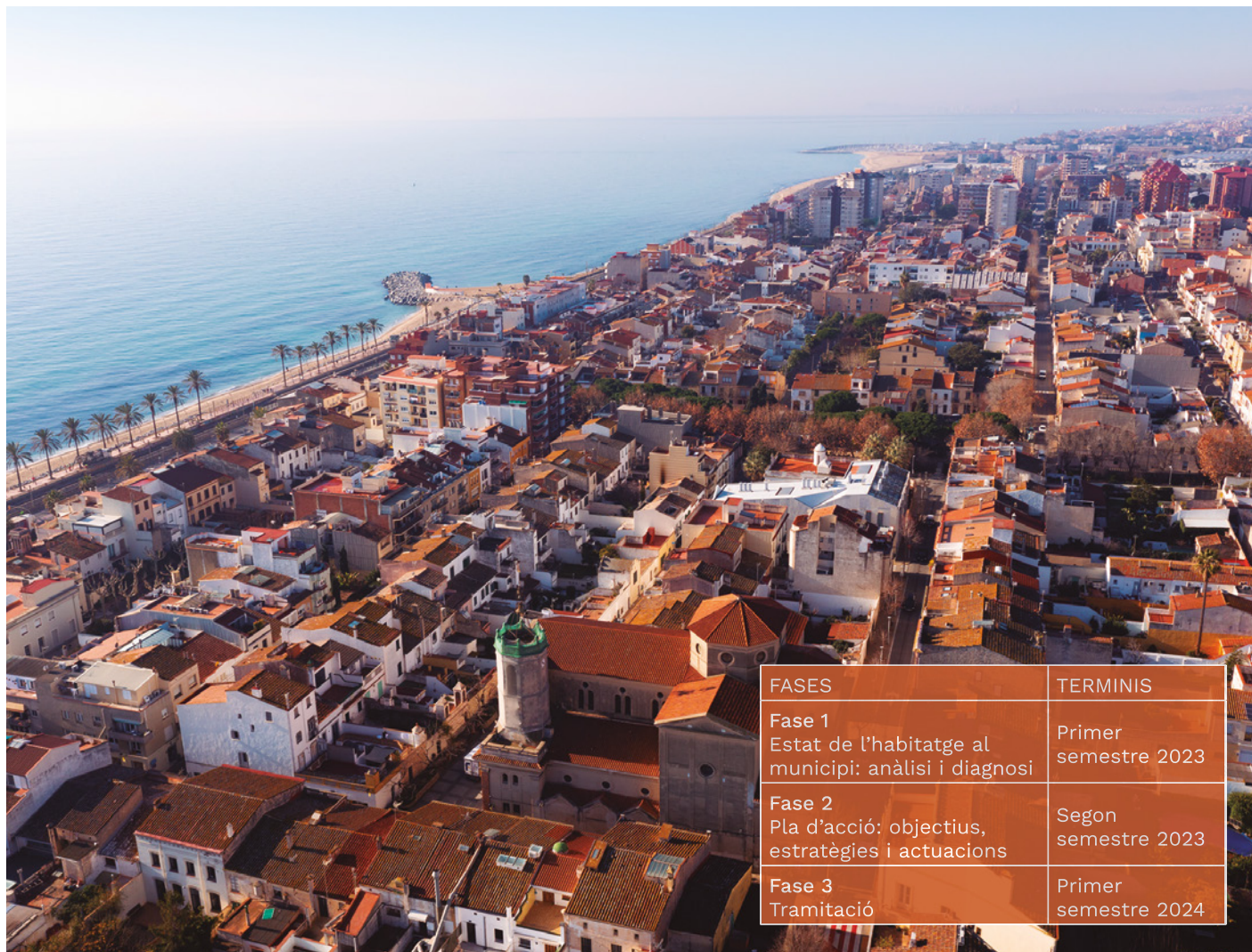
Vista aèria de Vilassar de Mar

Aquest document permetrà conèixer l'estat de l'habitatge al poble i planificar les polítiques locals