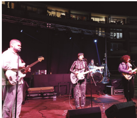
Actuació del grup vilassarenc Angeladormmm