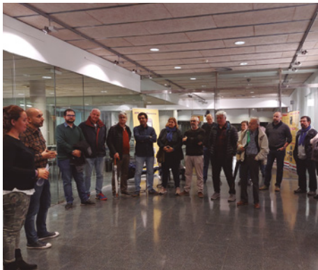
Presentació de Som de Mar a la Biblioteca Municipal

donar-los a conèixer entre la població. Actuacions musicals, la fira d'entitats, exhibicions esportives, conferències i un dinar popular van servir per donar la benvinguda a aquesta festa que l'Ajuntament ha fet coincidir amb el segon festiu local. Fem un passeig fotogràfic per aquesta primera edició del Som de Mar.