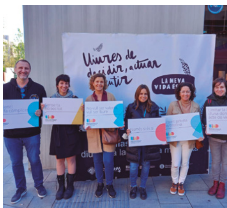
Punt informatiu de l'Ajuntament davant el Mercat