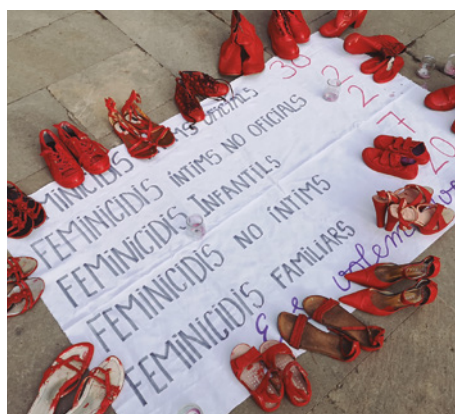
Muntatge artístic de les entitats feministes