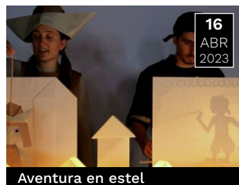
Aventura en estel

Espectacle, en el qual els animals recorden la necessitat de conservar i millorar el nostre món.