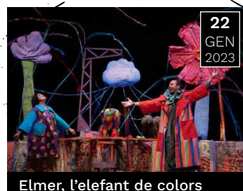
Elmer, l'elefant de colors

Història d'Elmer, l'elefant multi-color que viu en un món on els seus amics són color 'elefant'.