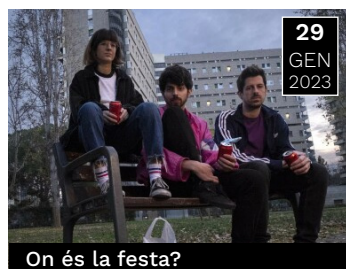
On és la festa?

Història d'Elmer, l'elefant multi-color que viu en un món on els seus amics són color 'elefant'.