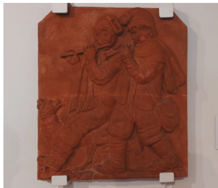
Donació de l'obra Estudi Porta Angèlica al Museu Monjo