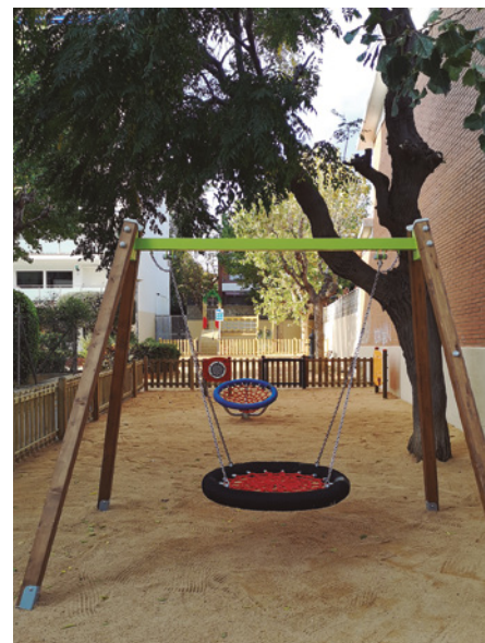
Parc Rosa Sabater

El parc Rosa Sabater llueix nova cara. L'Ajuntament de Vilassar de Mar hi ha fet una nova àrea de jocs, a més de remodelar l'existent. Fins ara, al parc hi havia un espai de joc ocupat únicament per un gronxador doble. Amb l'actuació, aquesta instal·lació s'ha canviat per un multijoc amb tobogan. A més, l'Ajuntament ha aprofitat l'espai existent entre el carrer Rosa Sabater i Pau Casals per ampliar la zona de jocs, creant un altre espai amb elements lúdics per a infants de 3 a 12