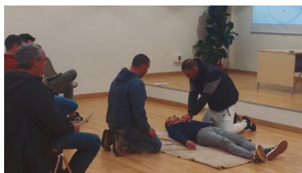
Curs seguit per la brigada

Els integrants de la brigada municipal de Vilassar de Mar han rebut aquest desembre una formació de primers auxilis i reanimació cardiovascular que els permetrà fer servir els desfibril·ladors externs automàtics, més coneguts com a DEA.