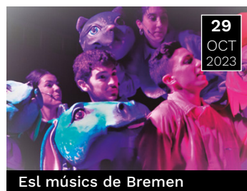
Es! músics de Bremen

Circuit itinerant en tres espais, en cadascú dels quals es representa una obra de 15 minuts.