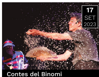
Contes del Binomi

La improvisació i les històries boges de Fel Faixedes garanteixen riure durant 70 minuts.