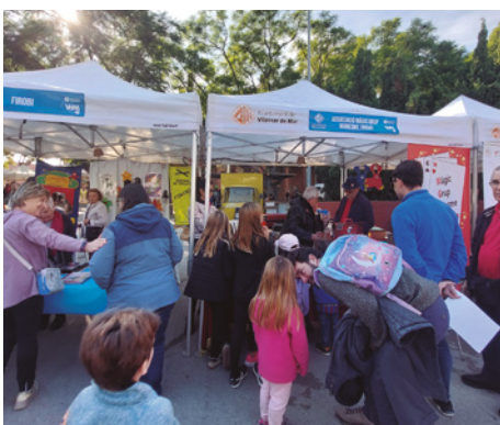
Fira d'entitats a la plaça Tarradellas