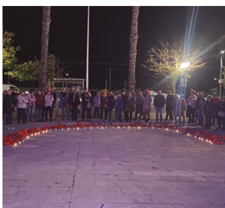
Concentració contra la violència masclista