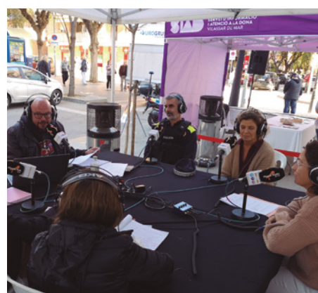
Programa especial 25N de Vilassar Ràdio