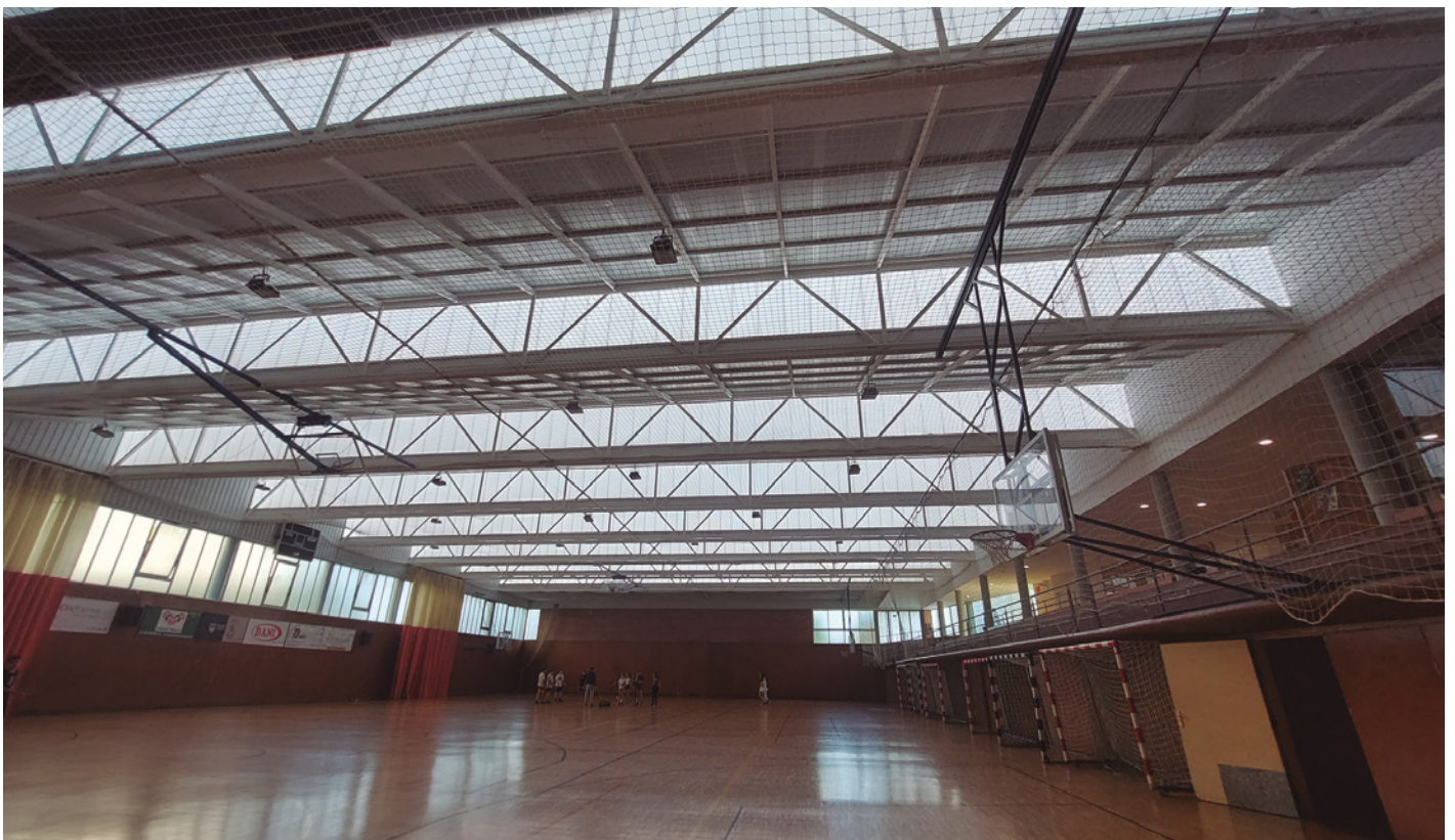
La coberta renovada sobre la pista principal

Actualment, s'han iniciat els treballs per renovar tota la instal·lació de la sala de calderes. Aquestes obres, que ja estan adjudicades, busquen garantir el funcionament continuat dels sistemes de calefacció i d'aire condicionat, així com disposar d'una instal·lació més eficient energèticament.