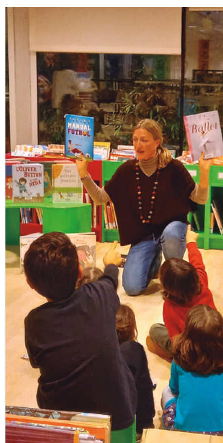
Contes per la igualtat, a l'hora del conte