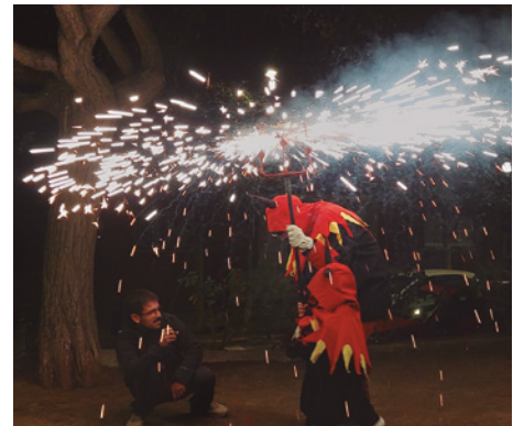
Taller de correfoc a càrrec dels Mansuets de Foc