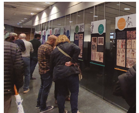
Inauguració de l'exposició 'Maria Ferrés i Puig, 150 anys'