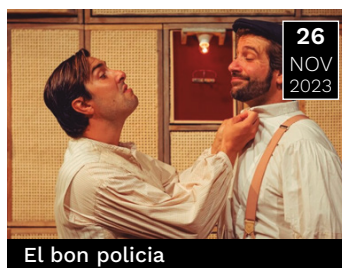
El bon policia

Aventures del Patufet, el personatge que vol ser eternament petit, i ahora un home.