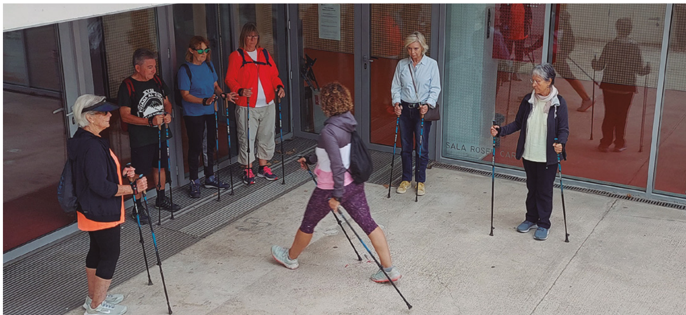
La caminada dirigida és una de les activitats per a la gent gran que ofereix l'Ajuntament

Un grup motor impulsat per la Regidoria de Gent Gran farà una diagnosi per detectar les necessitats reals d'aquest segment de la població