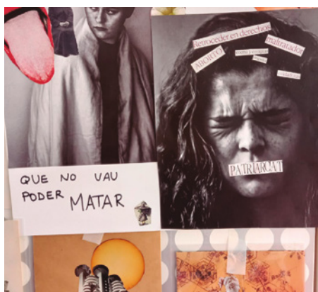
Activitat paper i tisores contra la violència masclista