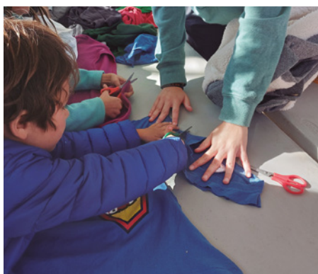
Taller infantil de reciclatge de roba