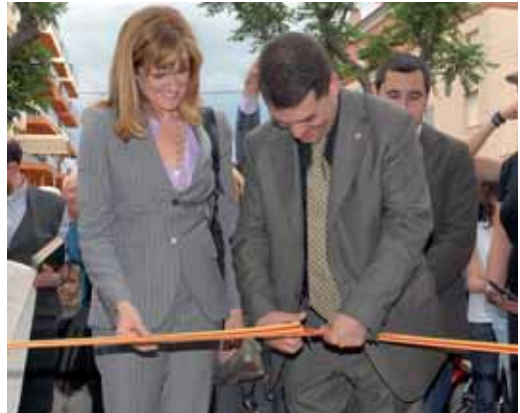
Inauguració del mercat provisional