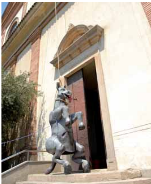
Penjada de l'ase