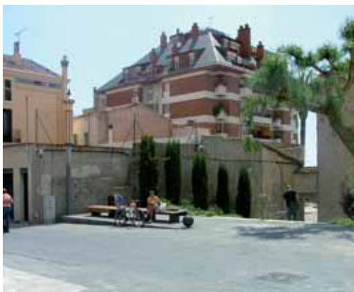
El carrer connecta amb la torre d'en Nadal.