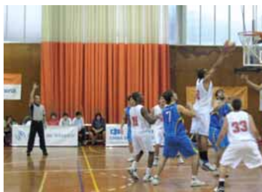
Partit de la selecció masculina sots 23