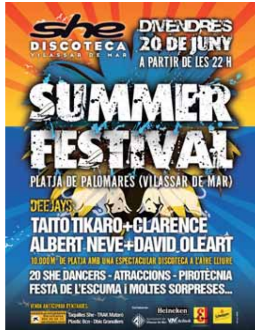
Cartell del “Summer Festival”

No serà permesa l’entrada a menors de 16 anys. Les persones no acreditades o de fora del poble podran aconseguir l’entrada a través del Servicaixa o a taquilla, al preu de 20 euros amb consumició.