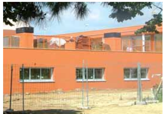
Aspecte de les obres de la nova escola bressol municipal a la Muralla

Pla general d'ordenació urbana en l'àmbit del carrer Manuel Roca que el Ple de l'Ajuntament va aprovar de forma inicial el 3 d'abril, amb els vots a favor de CIU i ICV, en contra del PP i PSC i l'abstenció d'ERC. Durant el període d'al·legacions, el PSC n'ha presentat una mostrant el seu desacord amb la ubicació de l'escola bressol al barri del Barato.