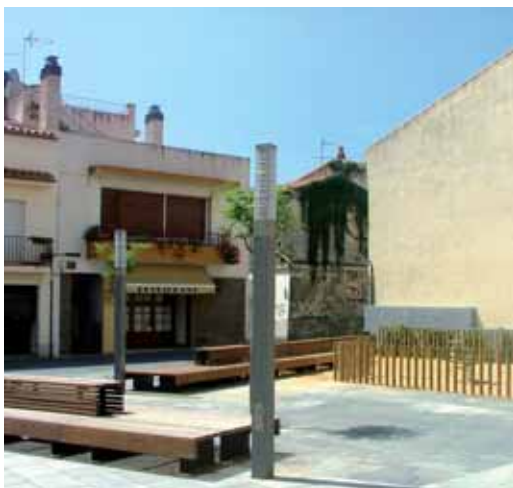
La nova plaça inclou un parc infantil.

L'obra, un projecte redactat pels arquitectes Roger Méndez i José Manuel Toral, ha resolt aspectes com la mobilitat, la pavimentació, el mobiliari urbà i l'enjardinament. El carrer ara compta amb un paviment a un únic nivell, ja no es poden estacionar vehicles, i una nova plaça, d'uns 300 m 2 de superfície, que inclou una nova il·luminació, bancs i un parc infantil.