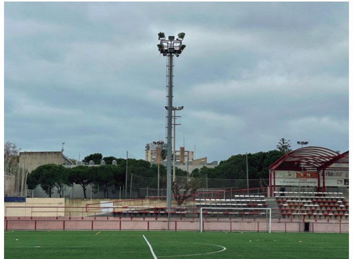
Una de les torres d'enllumenat del camp de futbol

L'actuació, que compta amb un pressupost de 60.000 euros, s'emmarca en les intervencions de millora dels equipaments esportius i de l'enllumenat públic del municipi.