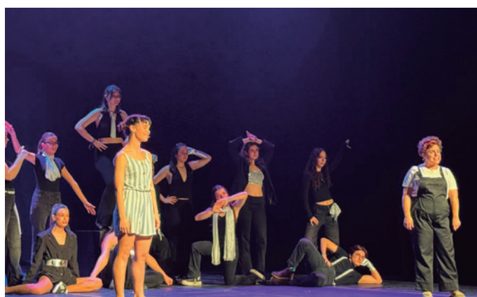
Actuació de La Tropa Teatre amb Mama Mia i El gran showman