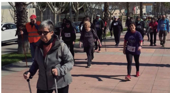
X Caminada popular La Vilassarenca