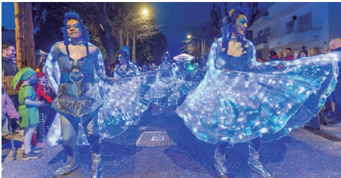
La comparsa Galaxium 08349 ens portava a l'espai, a una galàxia amb un codi postal molt proper, el de Cabrera de Mar.