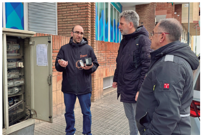
Visita del regidor de Via Pública a un dels quadres de comandament

després disminuiran la intensitat progressivament per etapes, ajustant-se automàticament segons l'època de l'any i el rellotge astronòmic. Això garanteix un equilibri entre eficiència energètica i seguretat, reduint el consum elèctric i allargant la vida útil de les lluminàries.