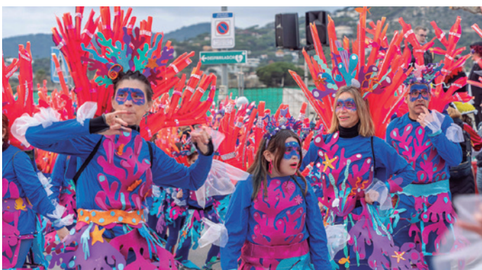
La comparsa de l'AFA dels Alocs, Buscant a l'Aloca, es va endinsar en el mar i van disfressar-se de coralls.