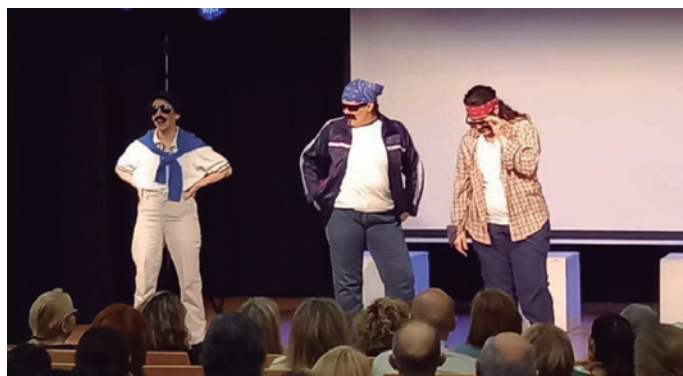
Actuació de l'espectacle d'humor Elles