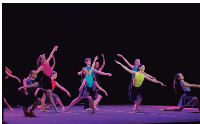
Exhibició de l'Escola de Dansa Madó