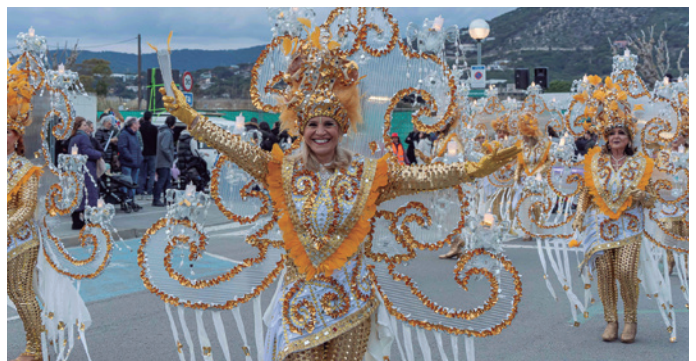
La comparsa Canelobres-els makus de Vilassar portava una disfressa de llum de diferents braços, que destacava pels seus materials de vidre i colors daurats.