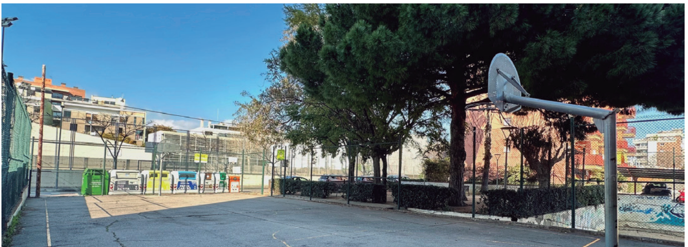
Imatge de la pista de bàsquet