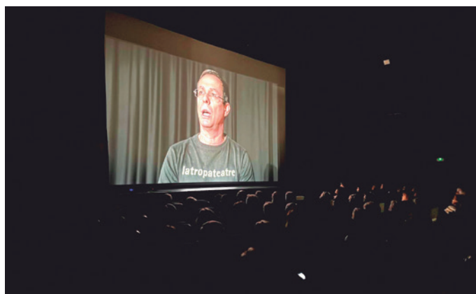
Projecció del documental sobre la història de l'Ateneu