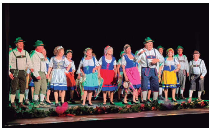
Actuació del Musical d'or, de l'associació Boatiné