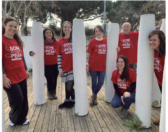
Representants de les AFA dels centres educatius de Vilassar de Mar conviden a participar en la marató de sang

El 6 d'abril es farà una neteja col·lectiva de la Riera d'en Cintet, el 7 d'abril hi haurà un taller