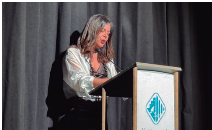
L'alcaldesa va remarcar la importància de l'Ateneu per a la vida cultural del poble