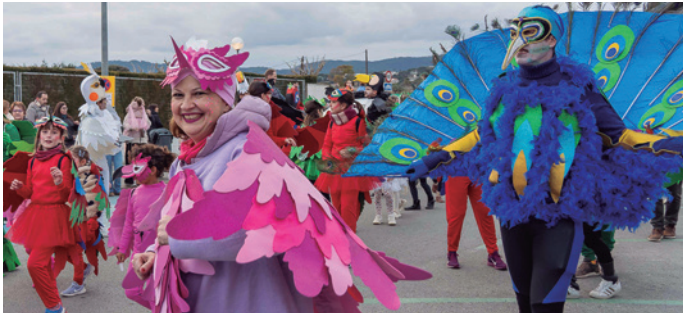
La comparsa de l'AFA del Vaixell Burriac, Parc de les aus, recordava el parc que va tancar a Vilassar de Mar el 2005 i que comptava amb nombroses espècies d'ocells.