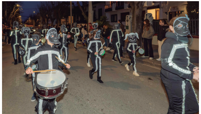
La comparsa Famílies amb llum pròpia lluïen com el seu nom indica, amb leds pel cos.