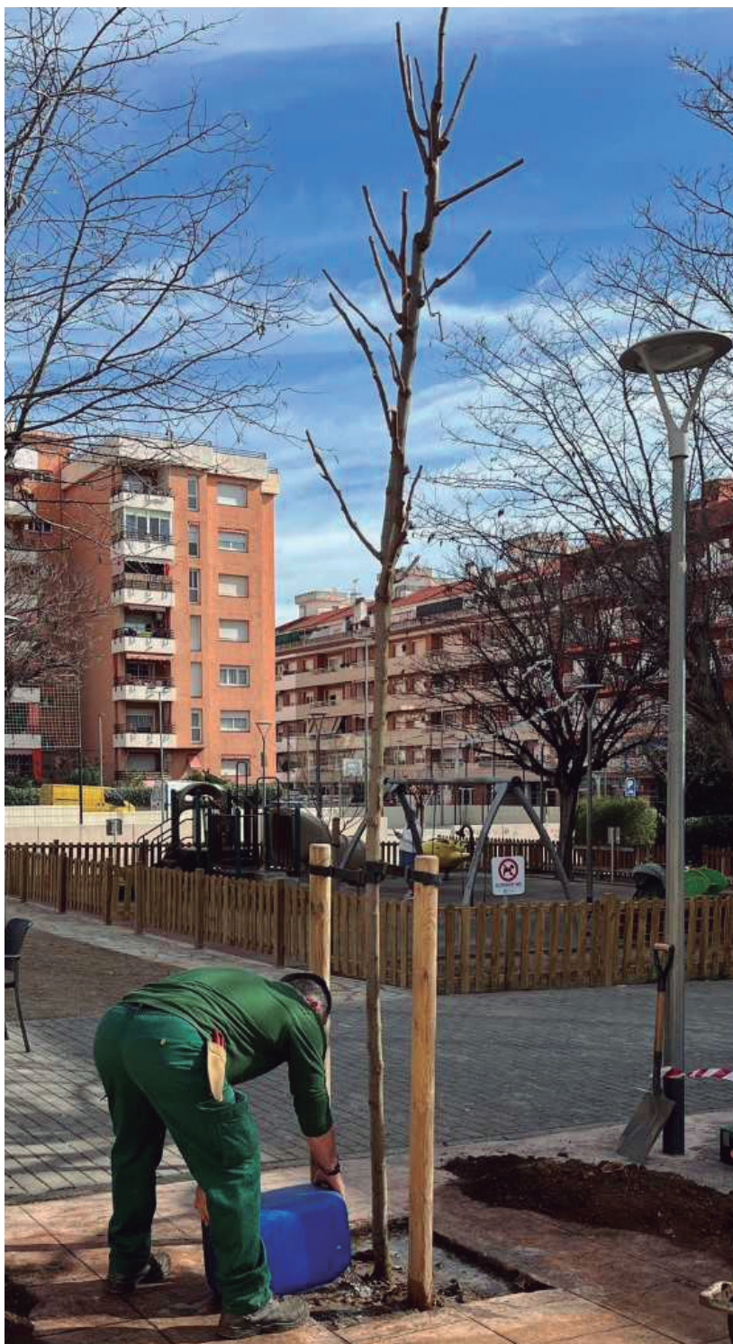
Plantació de nou arbrat a la plaça del Barato

El cost de l'actuació és de 20.940 euros, incloent-hi tant les tasques d'extracció de soques i reparació del paviment com la plantació i el material necessari per als nous arbres. Amb aquesta iniciativa, Vilassar de Mar reafirma el seu compromís amb la millora de l'arbrat viari.