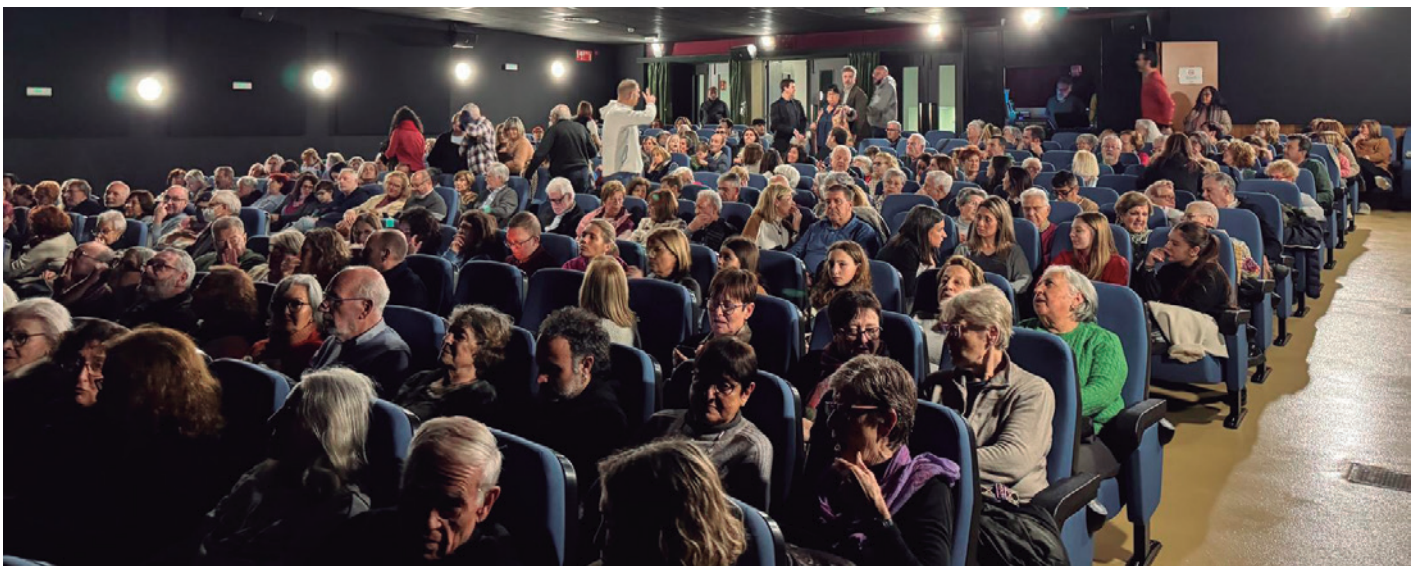
El 9 de març el públic va omplir, en les dues sessions, les noves butaques del Teatre Ateneu per assistir a la inauguració

El teatre, propietat de l'Ajuntament des de 2019, compta amb unes instal·lacions modernes i segures, oferint a Vilassar de Mar un espai de qualitat per a la celebració d'esdeveniments culturals i socials.