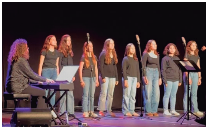
Actuació del cor Aoke de l'Aula de Música