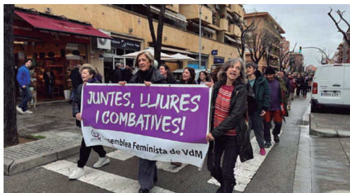
Manifestació de les entitats feministes locals