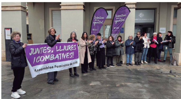
Lectura de la declaració institucional a la plaça de l'Ajuntament

Els actes per commemorar el Dia Internacional de les Dones van continuar amb l'espectacle d'humor Elles , de la companyia La Melancòmica, el concert Amb nom de dona de l'Aula de Música o el Festival de magues, entre altres. El 16 de març es va celebrar la caminada popular La Vilassarenca, inicialment prevista per al dia 9 però ajornada a causa de la pluja.