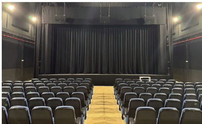
Reforma del Teatre Ateneu