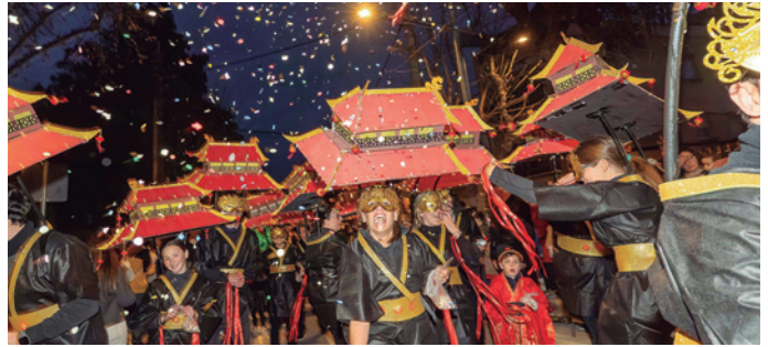
La comparsa La Aldea del dragón, amb pagodes als seus caps i dracs entre els seus integrants, ens va transportar a la Xina.