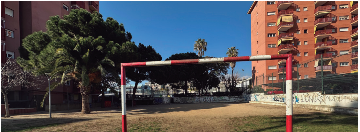
Imatge de la pista de futbol des del carrer Santa Maria

El termini d'execució de la primera fase és aproximadament de quatre mesos.