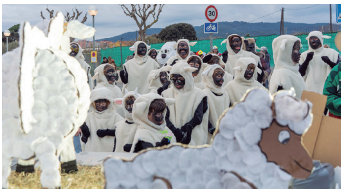
La comparsa Beelipos es va convertir en un ramat d'ovelles amb llop, gos de pastura i pastors.