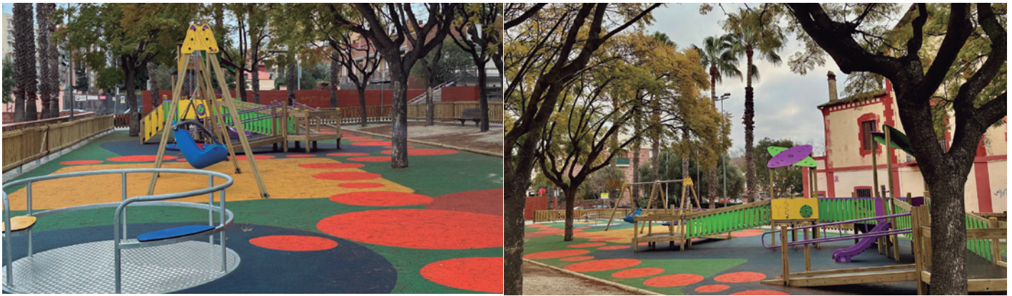
Parc Tarradellas després de la reforma

gronxador inclusiu, un gronxador niu, una estructura multijoc de fusta amb rampes accessibles i un giratori. A més, s'ha fet la renovació del terra de cautxú i del tancament de fusta perimetral, s'ha instal·lat nova senyalització inclusiva, s'han restaurat els elements de joc que s'han mantingut i s'han fet millores a la reixa de desguàs. També s'ha instal·lat una nova font amb doble cubeta accessible.